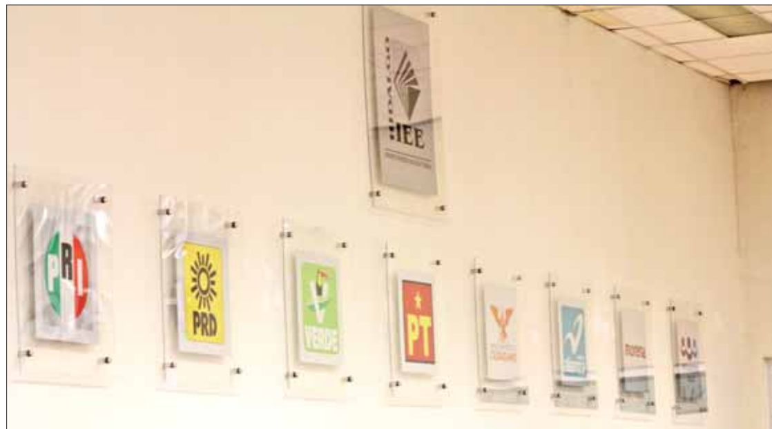
LINEAMIENTOS. Afirmó el director jurídico que es necesario considerar algunos temas significativos.