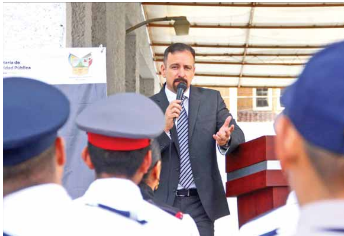
CONTRAPESOS. Intensificó la dependencia su presencia en escuelas de la entidad para llevar mensajes al alumnado.

La actividad se trasladó a Atonilco el Grande, Actopan, Acaxochitlán, Tizayuca, Tlanchinol, Jaltocán y Zimapán, donde los estudiantes presenciaron en su escuela todos los mensajes que la SSPH genera para fomentar la prevención de la delincuencia y