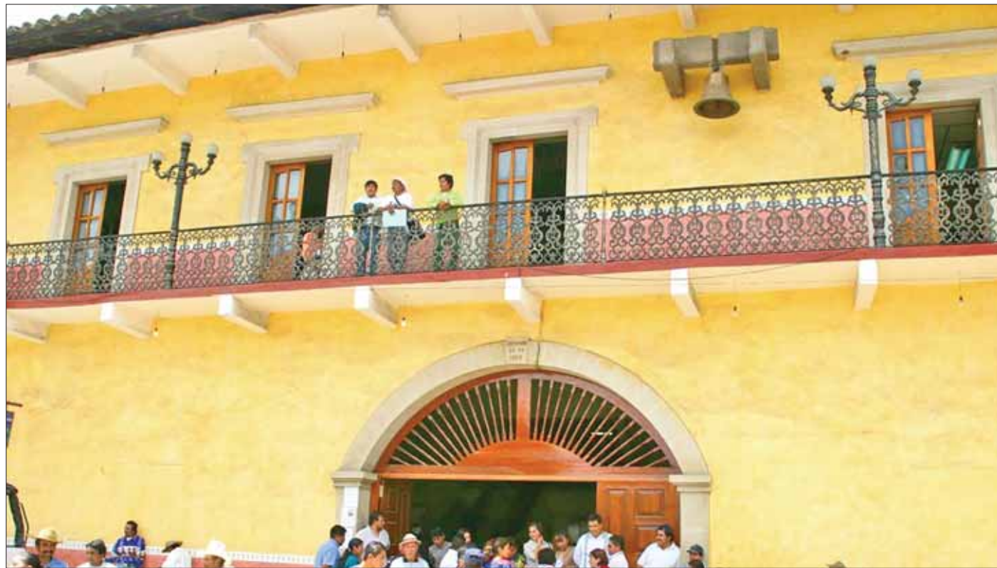
ESTOCADA. Exalcalde ganaba 17 mil pesos quincenales, los últimos meses (julio y agosto de 2016), tras las elecciones, al saber que su partido perdió, se redujo el salario a la mitad.

Cabe recordar que recientemente la administración debió pagar demandas de exregidores que solicitaban el pago de la diferencia en su salario por los dos últimos meses de la pasada administración. "Lo que nos permite ver que a pesar de la votación que hicieron al respecto, los propios regidores no estaban de acuerdo con reducirse el salario", aseveró. Finalmente dijo que en áreas de la administración no hay aumentos pues trabajan con salarios del año pasado.