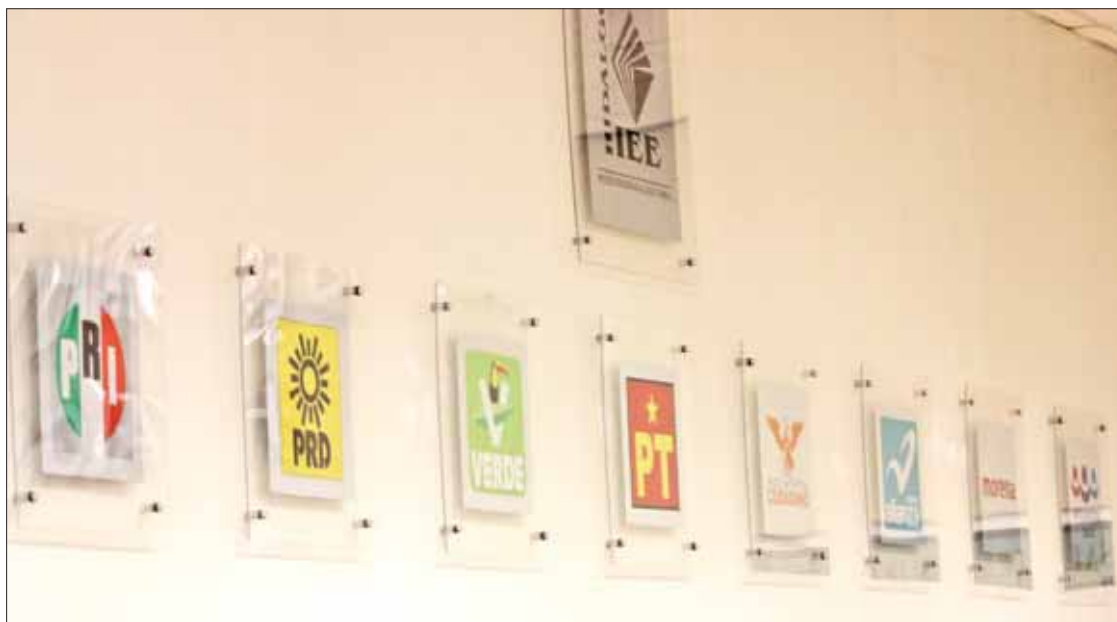
RECURSOS. De acuerdo con el reporte de Finanzas estatal no existe comprobante o recibo hasta el momento.

va de Prerrogativas y Partidos Políticos del IEEH confirmó que desde noviembre del año pasado comenzó la devolución voluntaria de dinero no ejercido por parte de cúpulas.