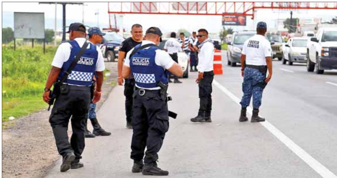
QUEJA. Una pobladora acusó que policías le solicitaron 500 pesos por traer vidrios polarizados.

"La presencia de la Fuerza Conago es un apoyo que recibi-