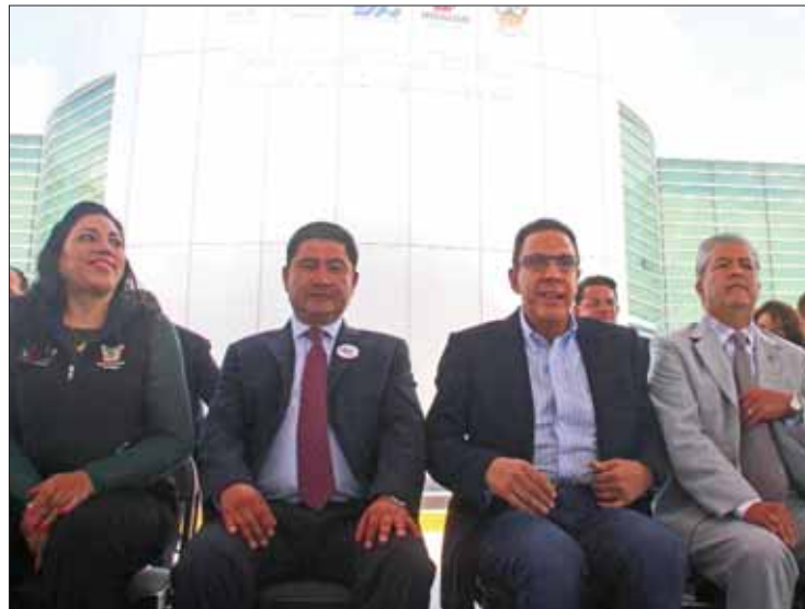
EVALUACIÓN. Recordó que entregará documento ante Congreso.

Explicó que los mecanismos serán a través de medios de co-