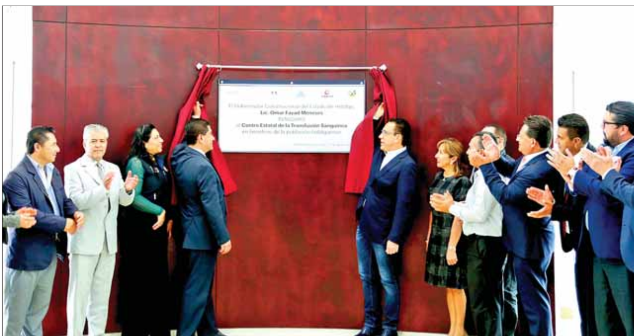
Puso en marcha gobernador Omar Fayad el CETES, con ello cumple compromiso de concluir obras pendientes, antes de edificar nuevas.