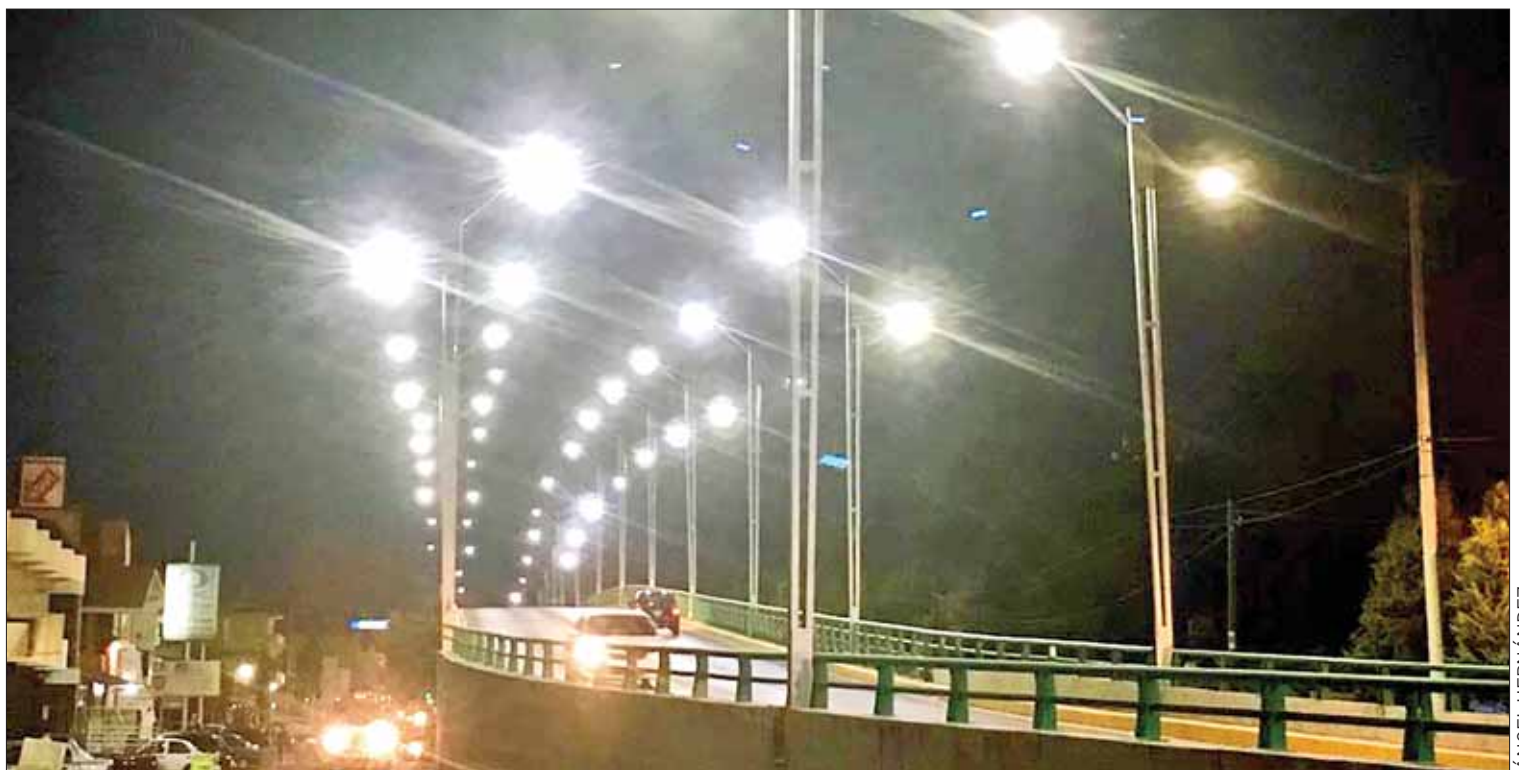
PREMISA. Meta es que el vital líquido esté garantizado para todas las familias de la demarcación.

Finalmente respecto a los constantes aumentos en los costos en la electricidad y reportes de abusos de Comisión con los usuarios dijo que se tiene conocimiento de ellos, pero que es tema primordial de CFE, "más como municipio tratamos siempre de apostar al diálogo para encontrar solución.