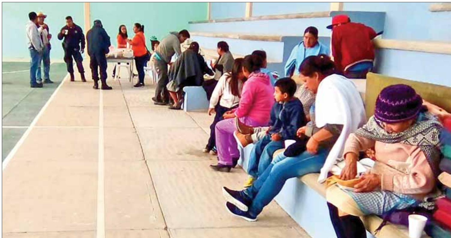
ORIGEN. Posible causa sea un acomodo natural, pero aún realizarán otros estudios específicos en la zona para descartar accidentes.

Ixmiquilpan es el municipio donde se presenta el mayor número de pendientes en cuanto a conflictos, ya que es de las demarcaciones más activas, social y políticamente. (Hugo Cardón)