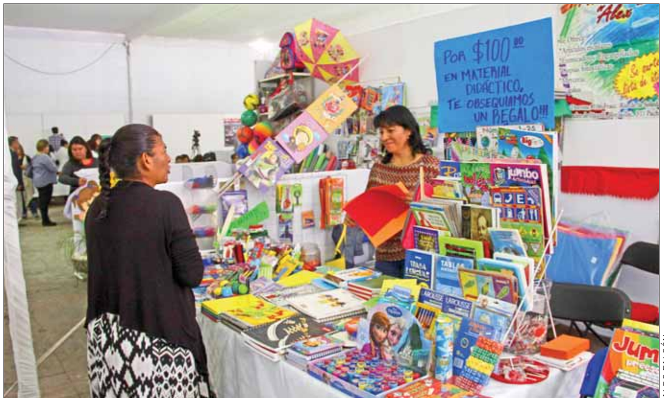
EN COLONIAS. Aprovechan algunos comerciantes para disparar el precio de diversos artículos.

Especificó que es necesario dar a conocer aquellos establecimientos, siempre y cuando las autoridades competente lo permita, de aquellos comercios en los que se han detectado anomalías al momento de cobrar, ya que decenas de personas están expuestas a padecer abuso al momento de pagar.