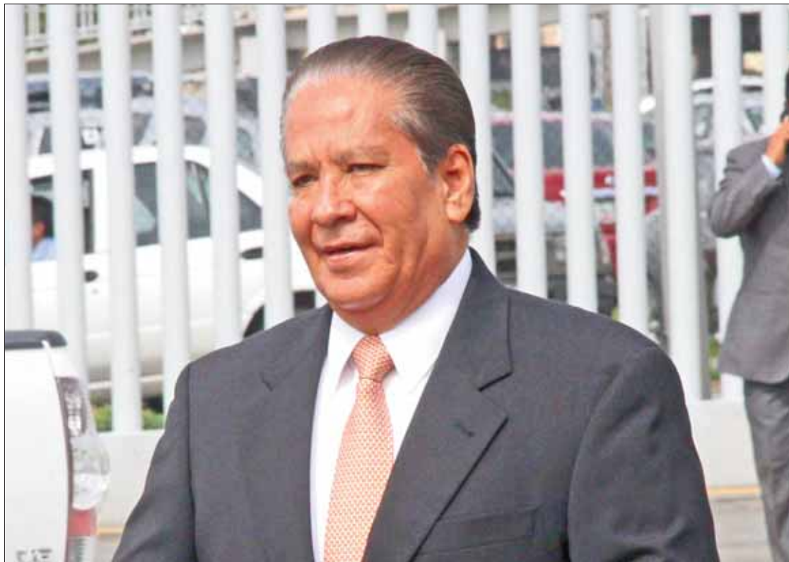
LEYES. Antes era el Ejecutivo el que determinaba una terna para dicho encargo, pero hubo modificaciones.

Según el artículo 71, el Congreso emitirá convocatoria pública y tendrá 10 días para recibir solicitudes, posteriormente