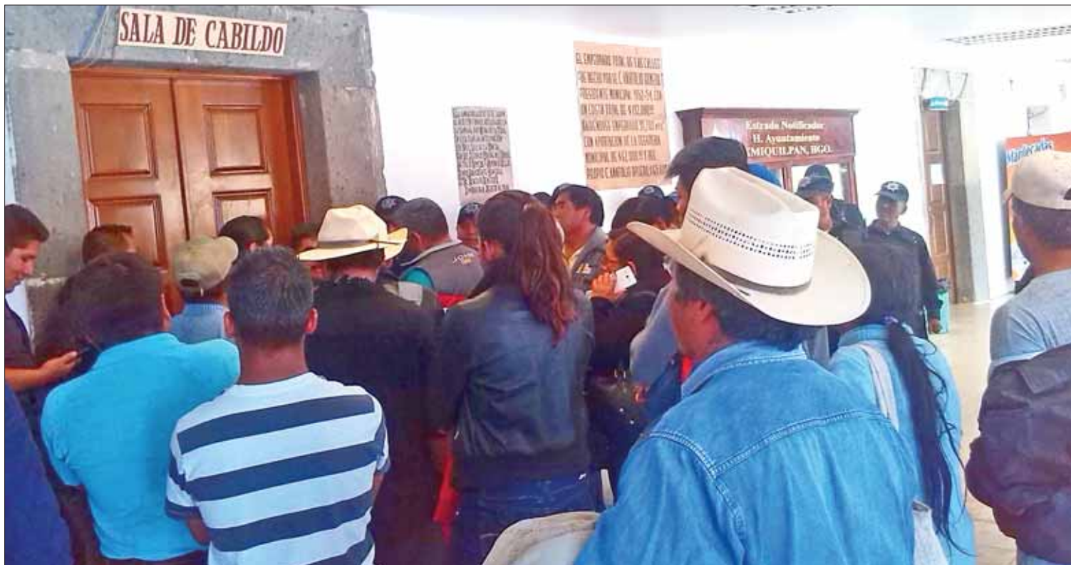
PRÁCTICAS. Varios integrantes de asamblea municipal expusieron el opaco manejo de dineros por parte del edil, cuya característica es ocultar.

Luego de varias horas el presunto delincuente fue cedido a las autoridades; no obstante, sus familiares tuvieron que dejar en garantía una motocicleta y 10 mil pesos para que liberaran al joven. (Hugo Cardón)