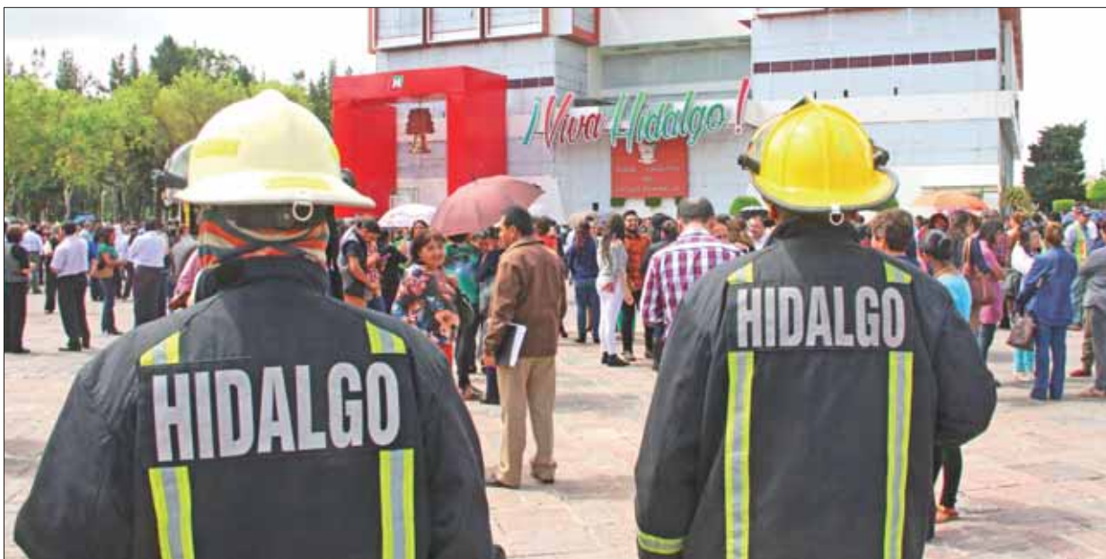
Resultado del sismo registrado la tarde de este jueves, trabajadores del Palacio de Gobierno y diversas dependencias fueron evacuados, sin reporte de daños en inmuebles.