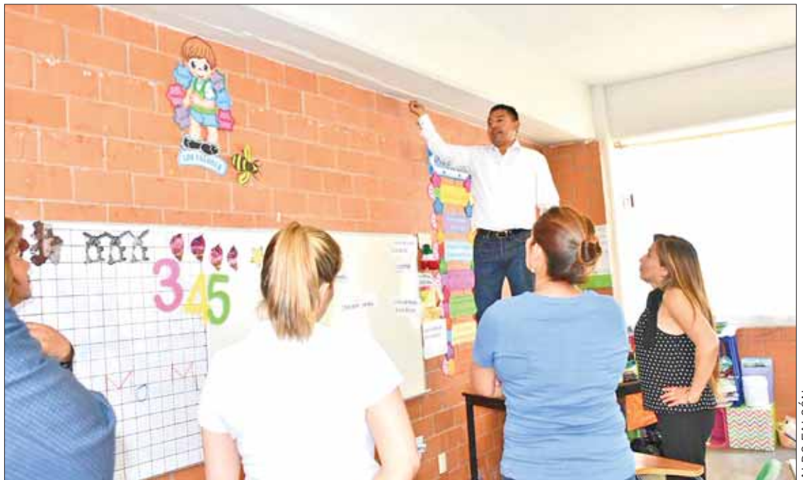
SEGURIDAD. A menos que el escenario cambie, retorno a los salones será el próximo lunes.

REGRESO A CLASES. El regreso a clases está previsto para el 25 de septiembre tanto para escuelas de educación inicial, básica, media y superior, tanto públicos como privados, a excepción de los dos mencionados.