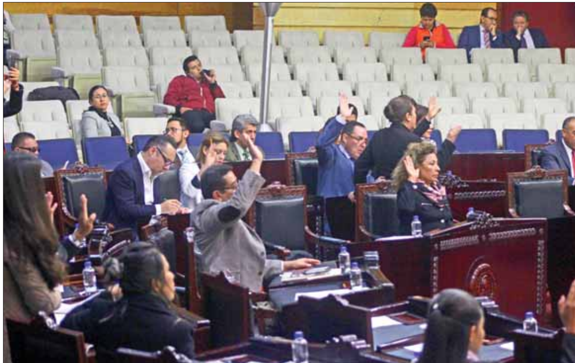
CERTEZA. Deberá concentrarse en tareas jurisdiccionales necesarias para el estado.

► Objetivo es armonizar cuanto antes disposiciones de la entidad con las federales en materia laboral