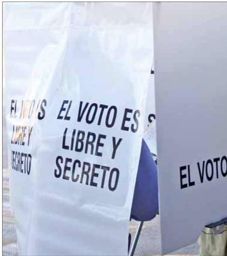
MENSAJES. Aprobó el organismo electoral la convocatoria para los interesados en buscar puesto bajo dicha figura.

ción Pachuca, 6 mil 665 rúbricas y en Tepeapulco, 5 mil 501.