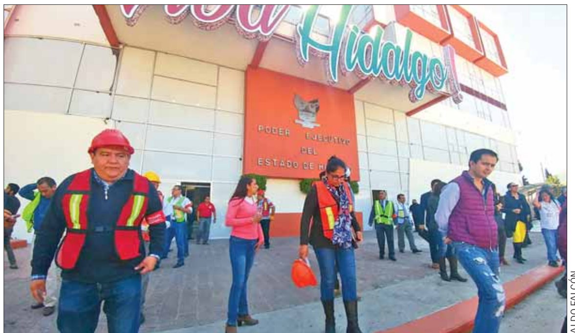
Realizó personal de Protección Civil simulacro de sismo con el que evacuó Palacio de Gobierno, para preparar y evaluar tiempos de reacción ante cualquier siniestro.

Respecto a senadores tienen hasta el 9 de octubre y diputados el 4 del mismo mes. 3