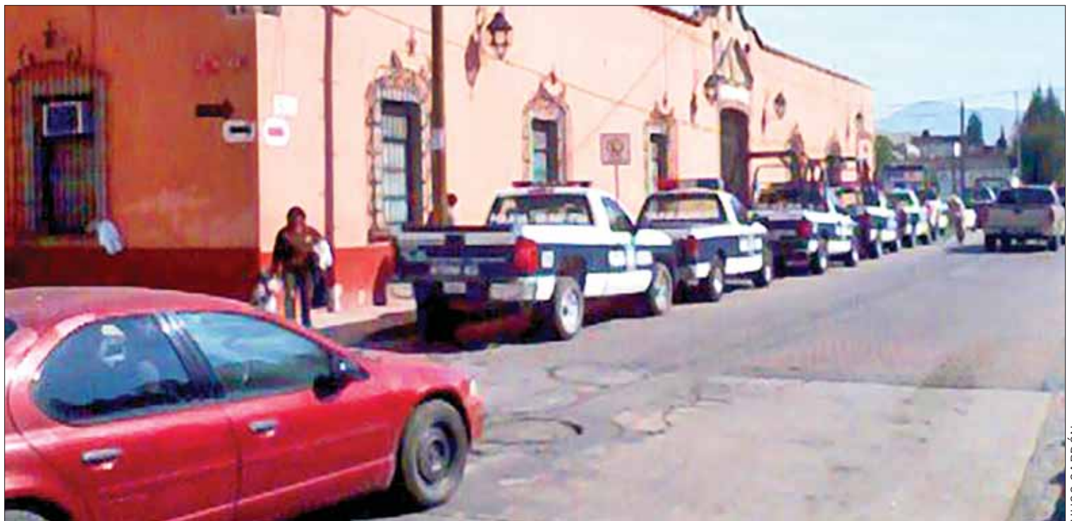
MATICES. Adelanta alcalde que este año cerrarían con un promedio de entre 75 a 80 uniformados más.

Recordó que el tema de seguridad es una de las demandas más sentidas que se tienen en Actopan y que se está atendiendo en la medida de las posibilidades del ayuntamiento.