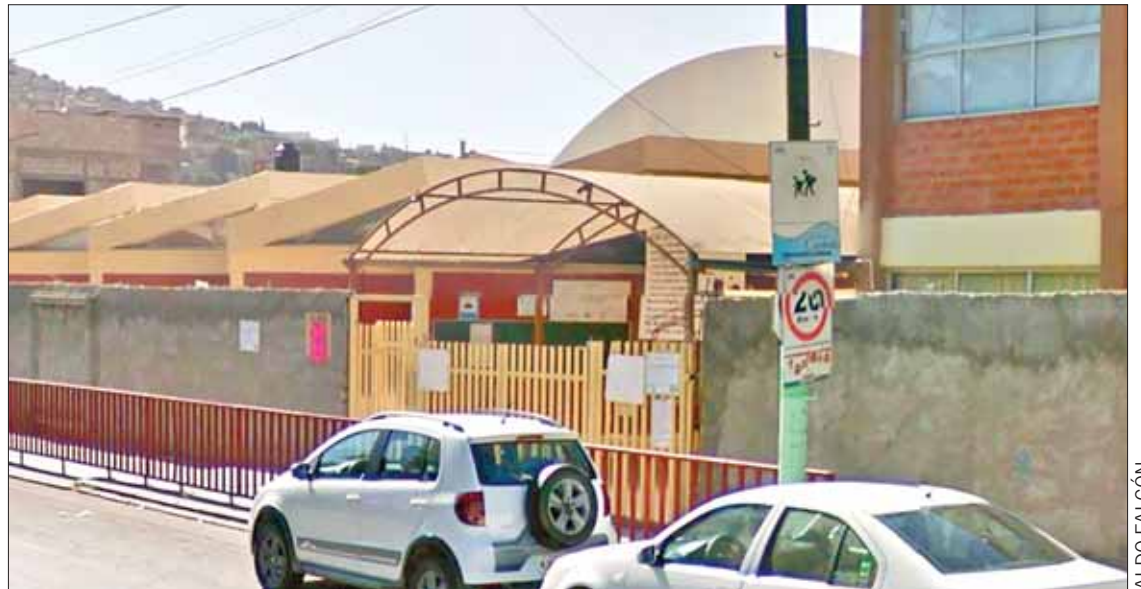
FUENTES. Algunos tutores se organizaron a las afueras del plantel, ubicado en avenida Revolución, de la colonia Periodistas, para hablar al respecto.

Ahora desconocen quién tomó esta decisión que a muchos les ha molestado; especialmente porque no fue un asunto en el cual fueran considerados.