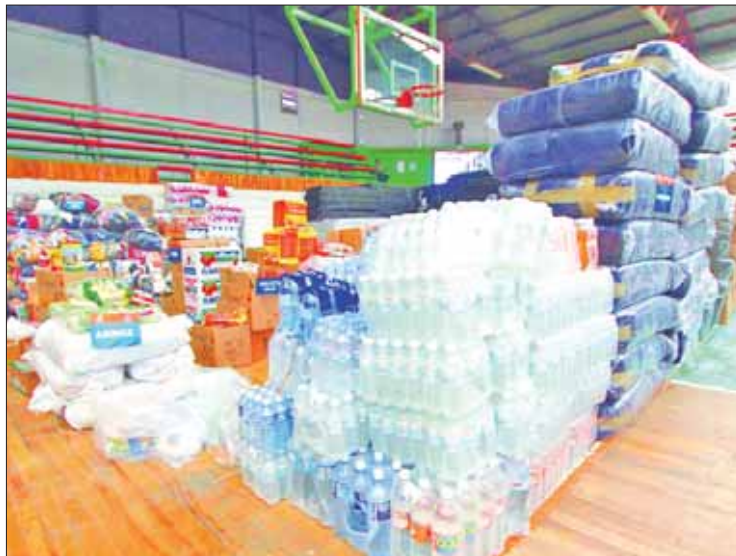
ESFUERZOS. Además otros organismos reúnen víveres.

Se abrirán las instalaciones de la Subdirección de Vinculación