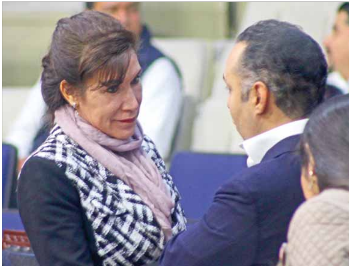
VUELTA. Reiteró la legisladora que dichos perfiles no serán revelados hasta que deban hacerlo en el Congreso.

La lista que trascendió en medios menciona nombres de empleados de la Procuraduría General de Justicia de Hidalgo, del