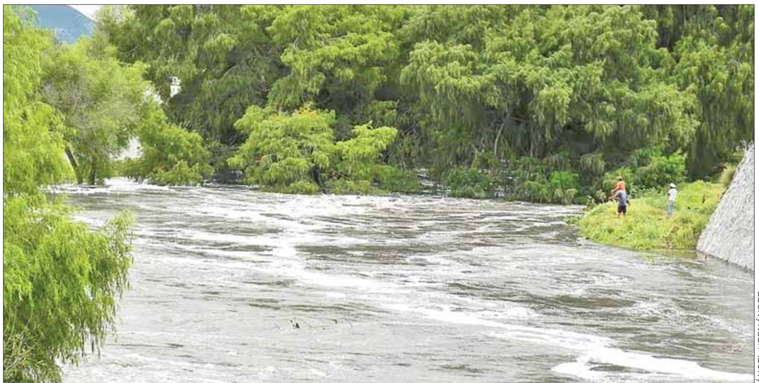
POSTURA. En meses pasados comenzaron las labores pero las detuvieron; buscan socializarlas y que la administración local conozca los alcances de lo que se pretende hacer.

Reveló que lo que se conoce hasta ahora es que dos puentes (Zaragoza y el de El Sabid) tendrán que ser tentativamente elevados, reforzados y ampliados, "pero tenemos que ver qué alternativas nos dan".