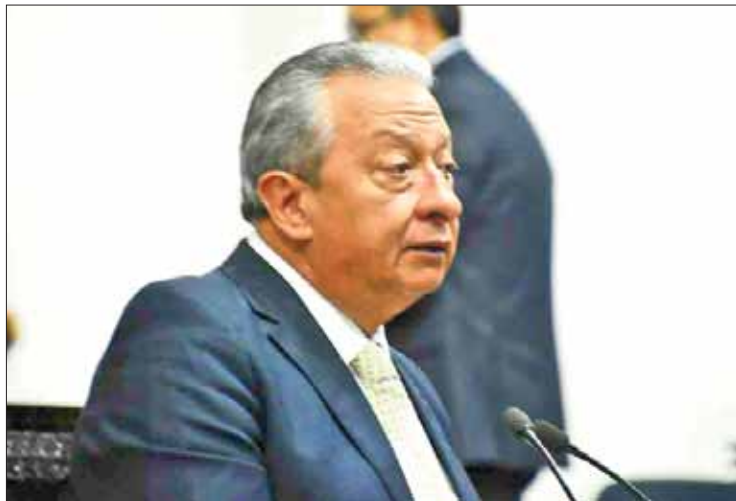
RESPUESTA. Indicó el legislador que dictamen no debe considerarse a autónoma.

dad no puede ser tratada de la misma manera que los demás organismos, pues los otros dependen del estado y no tienen la misma autonomía".