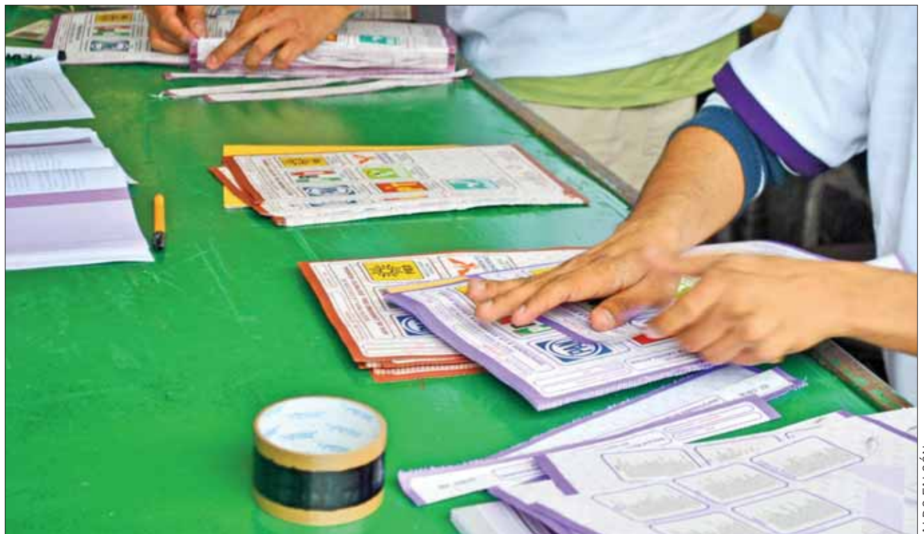
CLÁUSULAS. Este 10 de octubre venció el periodo para que aspirantes por esta modalidad a este cargo manifestaran su intención de participar ante las respectivas juntas distritales del INE.

Mientras que para el Senado de la República, tienen como límite al 15 de octubre y la búsqueda de firmas al 14 de enero de 2018.