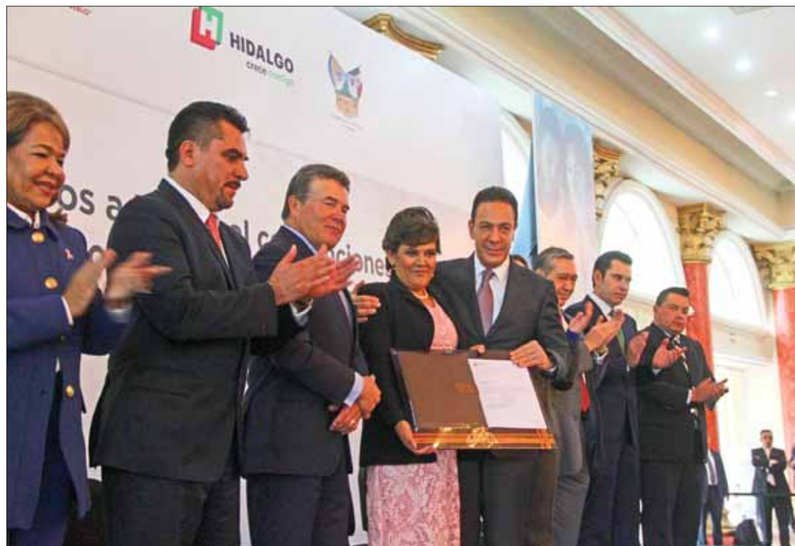
PROGRESO. Expuso el mandatario que la mejor apuesta es por la niñez, ya que representa el futuro.

El mandatario hidalguense entregó nombramientos defini-