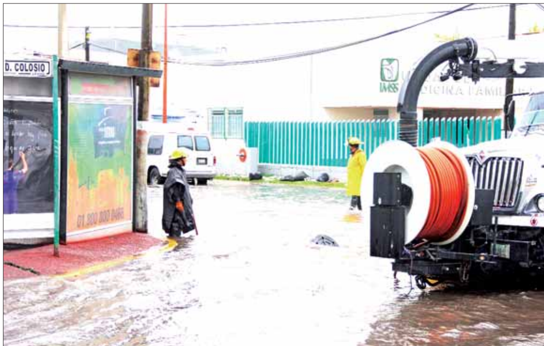
LIMPIEZA. Precisó el funcionario estatal que maquinaria y equipo están listos para atender reportes de la población.

Recordó que el gobernador Omar Fayad dispuso lo necesario: recursos, insumos, personal y maquinaria para operar en puntos estratégicos del estado y atender de manera oportuna