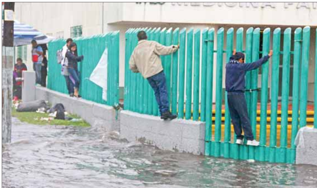
Varios puntos de la capital hidalguense lucieron inundados como resultado de las fuertes lluvias registradas desde la mañana de este miércoles.

García Conde expuso que hay algunos derrumbes en algunas vías de comunicación de la Sierra, Huasteca, Otomí-Tepehua, Valle del Mezquital y la Vega de Metztlán. .3