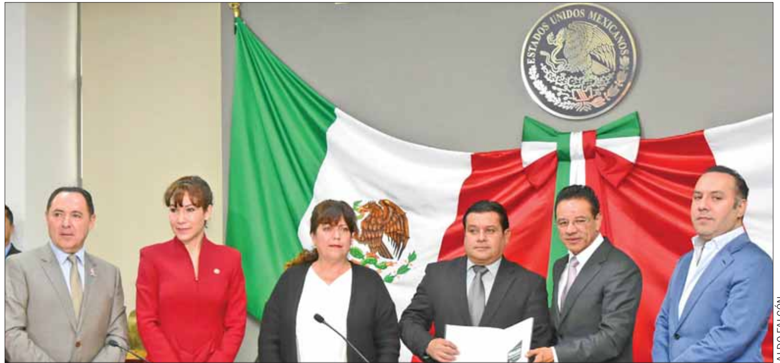
PUBLICACIONES. También destacó el programa implementado para transparentar procesos relativos a los verificentros de la entidad.