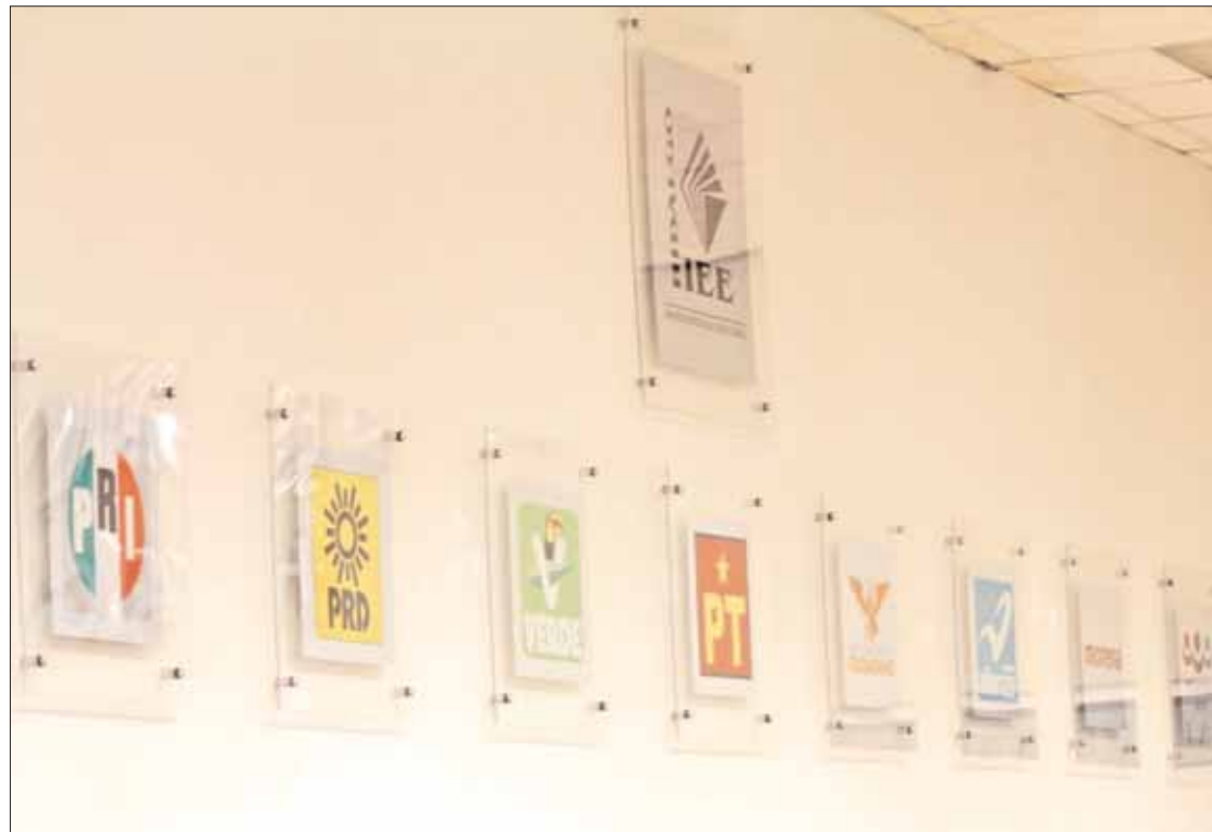
CONTENTOS. Para el próximo ejercicio el instituto consideró un incremento salarial para estas figuras y también aguinaldos.

Asimismo confirmaron que los nueve representantes ya utilizan un vehículo mediante contrato de comodato; es decir, un contrato por el cual una parte entrega a la otra gratuitamente una