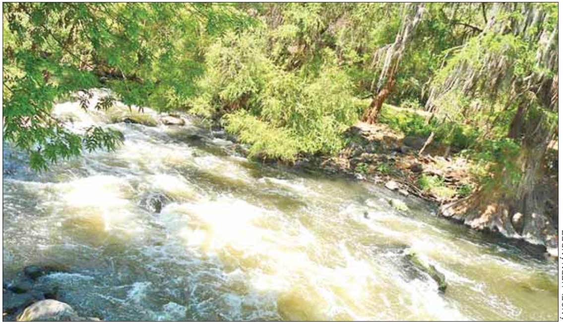
VOCES. Por la porquería que llega la gente ha muerto de cáncer; demandaron intervención directa del Gobierno de la República.

Pidieron a la federación empiece a modificar el proyecto de revestimiento del Río Tula, pues no permitirán que se ejecute como está, con toda la matanza de árboles que implica. Expresaron que no están contra la obra, pero sí contra el ecocidio que se comete y pidieron la pronta reforestación de las áreas taladas.