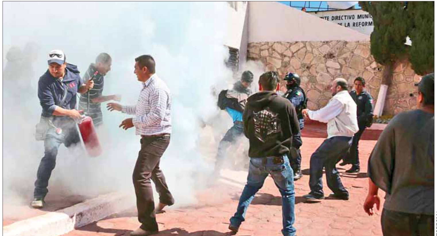
AMENAZAS. Tuvo que interceder el director de Protección Civil, quien roció a los manifestantes con un extinguidor.

Cabe mencionar que desde el 2016 se iniciaron trabajos para la construcción de un nuevo hospital para la región de Actopan, inmueble para el cual el ayuntamiento consiguió el terreno; no obstante, esta obra todavía tardará para que esté al servicio no sólo de Actopan, sino de municipios aledaños.