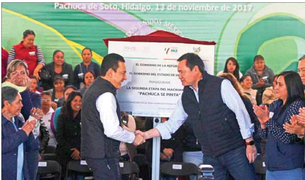
Comenzó este lunes la segunda fase del programa Pachuca se pinta , encabezado por el gobernador Omar Fayad, el secretario de Gobernación, Miguel Osorio, y la alcaldesa capitalina, Yolanda Tellería.