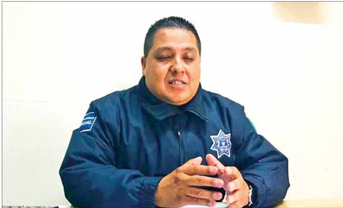
LLEGADA. Afirmó que inculcado tiene tres meses trabajando en su corporación y proviene del Estado de México.

El secretario de seguridad dijo que el comisario de la policía estatal de Atlacomulco se presentó a requerirle acudiera a la fis-