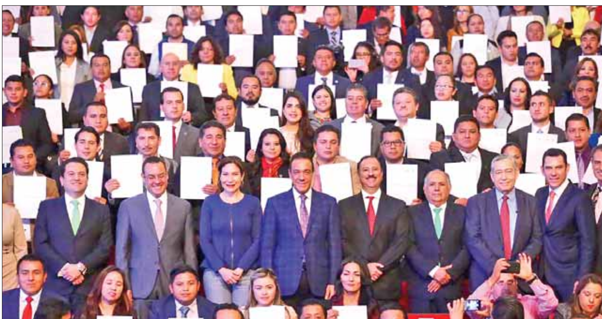
Constante actualización de servidores públicos permite ofrecer mejores servicios a la población, indicó el gobernador Omar Fayad.