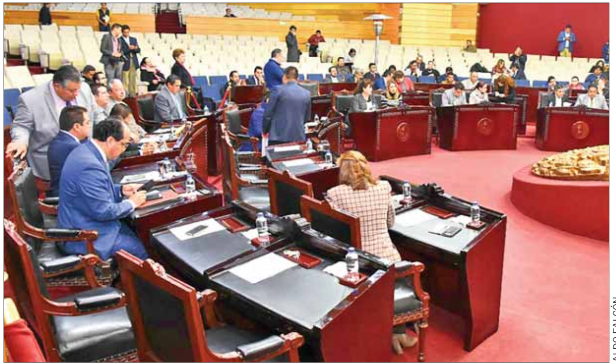
MANUTENCIÓN. Presidencia contaría con casi 5 millones de pesos sólo para servicios personales, conforme las cifras.

La Dirección General de Servicios Administrativos previó un presupuesto de 43 millones 741 mil 595 pesos, mientras que la Coordinación de Asesoría podría obtener 4 millones 918 mil 216; Instituto de Estudios Legislativos 2 millones 21 mil 789; Instituto para el Desarrollo y Fortalecimiento Municipal 2 millones 69 mil 987; y Dirección de Comunicación Social 2 millones 502 mil 534.