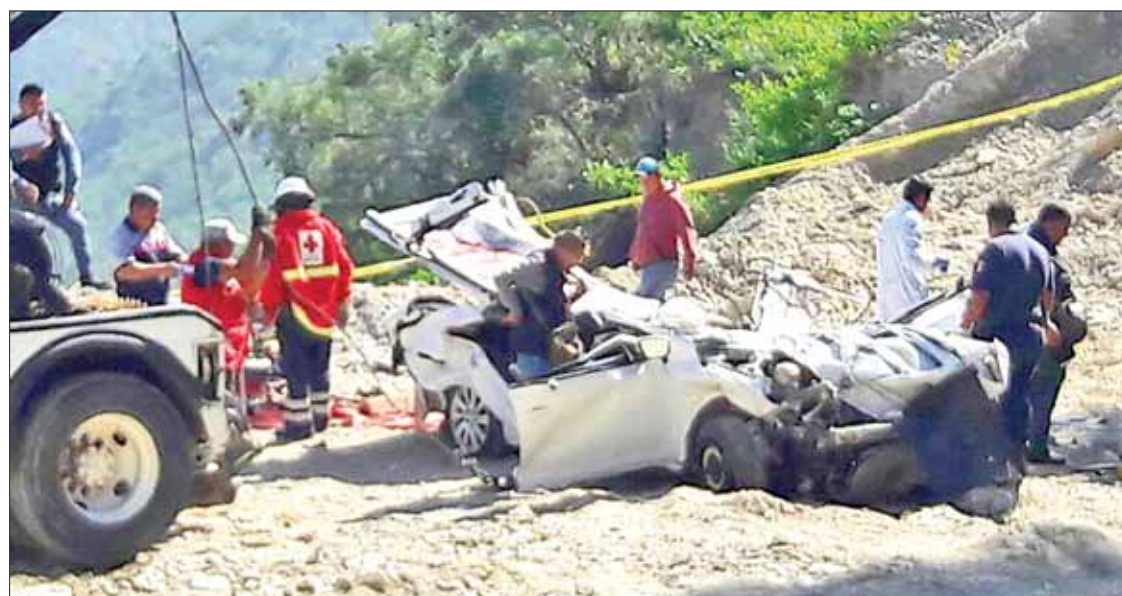
ACCIDENTE. Se dirigían hacia las Grutas de Tolantongo, pero conductor perdió el control.