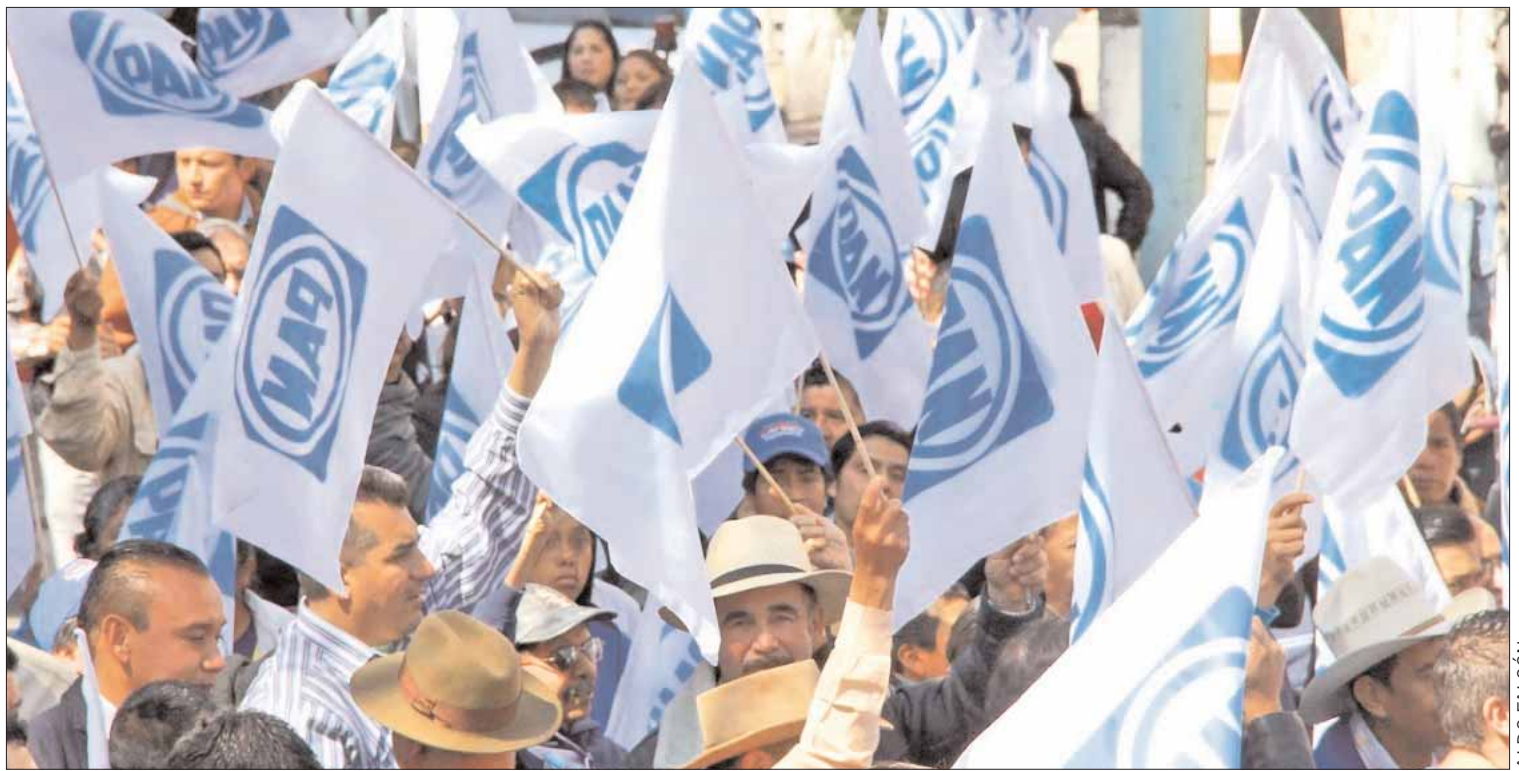
CALENDARIOS. Concluyó el partido con su fase de reafiliación desde el pasado 30 de junio, pero hubo prórrogas.

Sin embargo, 53 ciudadanos que pretenden su inclusión en el padrón "albiazul" recurrieron al tribunal electoral hidalguense, en otras entidades la cifra de juicios superó los mil 700.