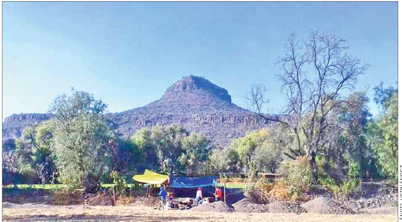
RECOPIACIÓN. Fueron descubiertos dos cuerpos de hombres y una mujer, de acuerdo con los arqueólogos universitarios.

Asimismo reveló que es la segunda temporada de investigaciones a las faldas del cerro del Xicuco u Ombligo del Mundo, que era un lugar sagrado para los indígenas; "durante la primera fase de investigación encontramos restos humanos, una habitación y utensilios".