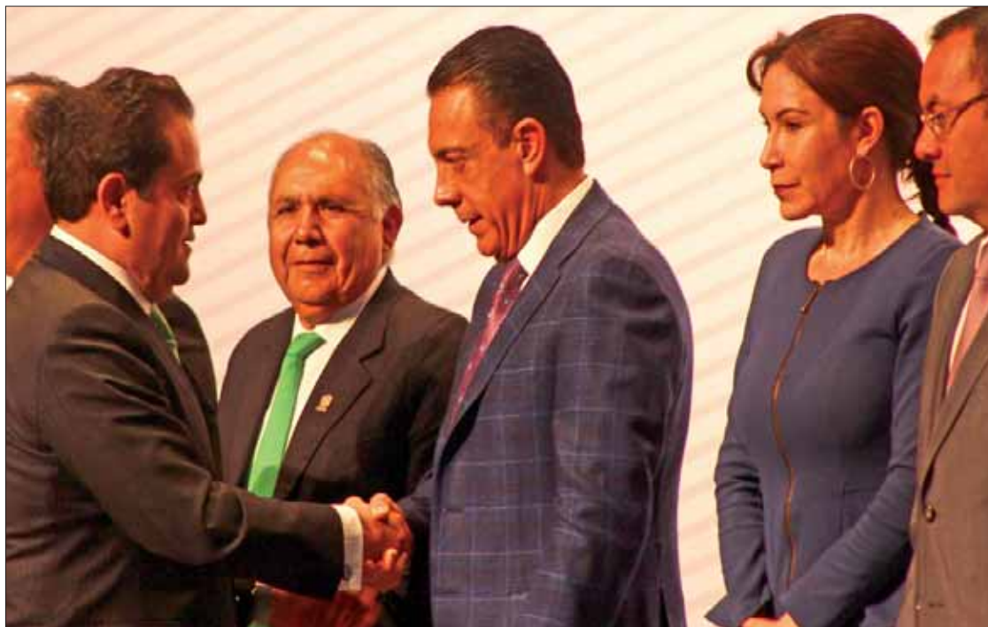
FORTALEZAS. Reiteró Guevara la labor realizada en territorio hidalguense, basada en la agenda y con cifras récord.

Destacó que el gobierno estatal y las alcaldías demuestran liderazgo nacional y son punta