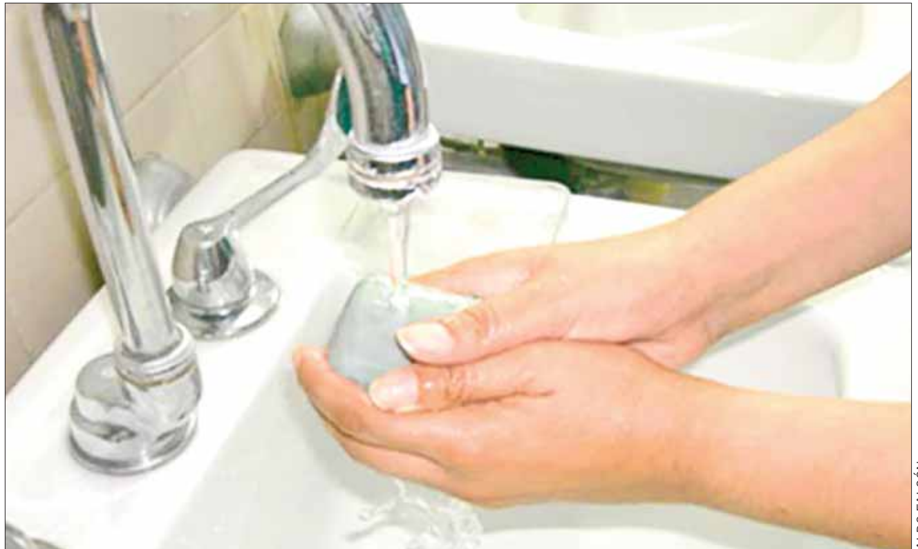
SSH. Una de las premisas para esta temporada es que la salud empieza con la prevención.

Se efectuarán actividades encaminadas a las acciones del programa de 6 Pasos de Salud con Prevención, cuyo objetivo es contribuir a proteger a la población de enfermedades a través de acciones de saneamiento básico.