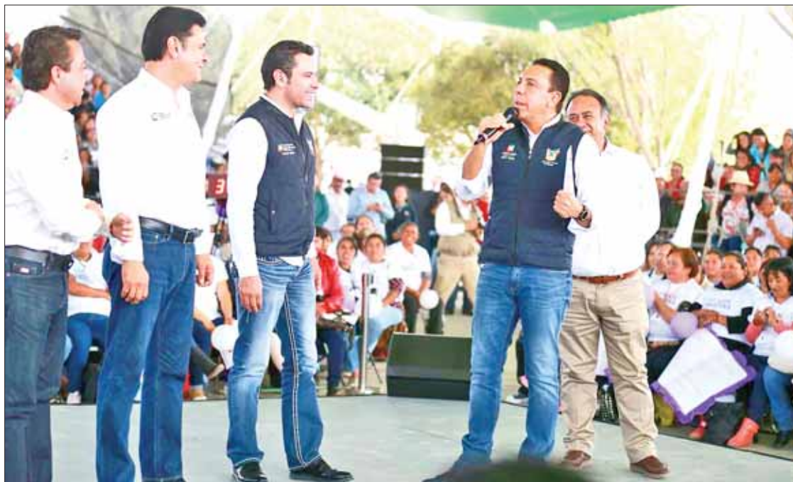
CERTEZAS. Visitó diversos municipios del Altiplano hidalguense para incluir a más familias en plan federal.

Al tomar protesta a las vocales de Prospera, Omar Fayad subrayó que serán quienes velen por