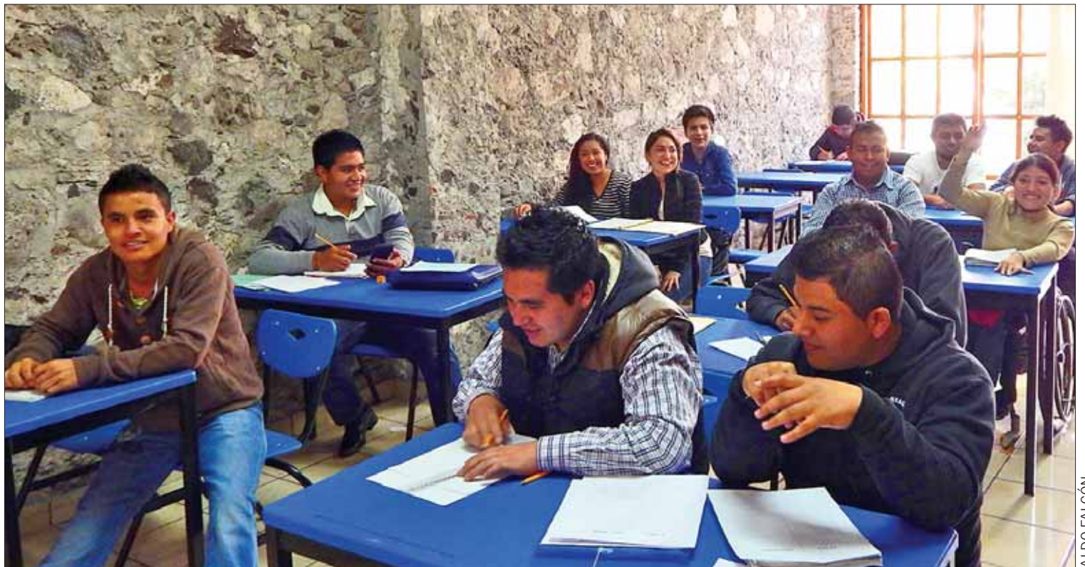
CLAVES. Las temáticas del encuentro son: emprendimiento y formación dual; la población objetivo es la de jóvenes entre los 18 y 29 años; especificaciones.

Este encuentro propiciará la participación entre los jóvenes alrededor de la solución a problemáticas locales, nacionales y globales, contar con testimonios de jóvenes emprendedores que contribuyan a generar políticas que logren hacerlos más competitivo; y consolidar emprendimientos, que permitan construir trayectorias de trabajo innovadoras y sostenibles.