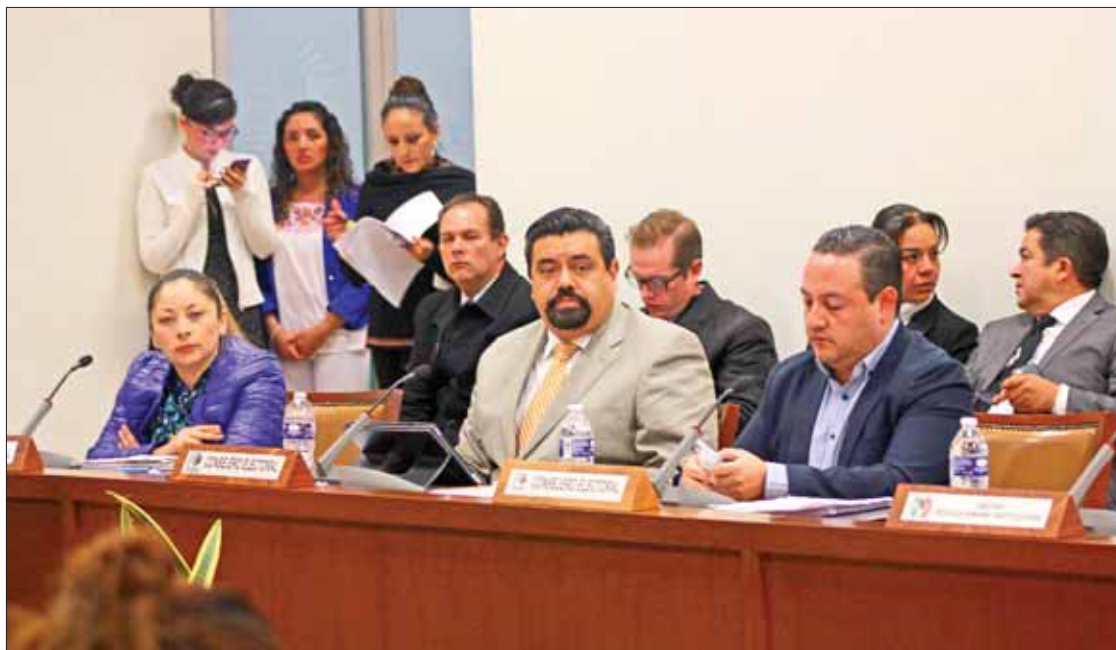
REMUNERADOS. Las seis consejerías locales restantes cuestan 48 mil 107 pesos cada mes, según la información actual.

Cabe recordar que el INE es el ente autónomo encargado de organizar comicios federales, respecto al Presidente de la República, diputados y senadores que integran el Congreso de la Unión, para realizar actividades, cuenta con 32 delegaciones en