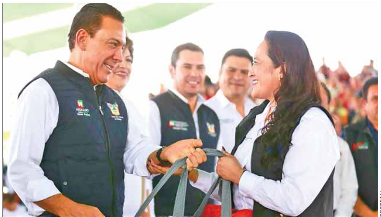
Refrendó gobernador Fayad compromiso por inclusión de sociedad hidalguense en diversos programas y destacó las audiencias públicas de su gabinete.