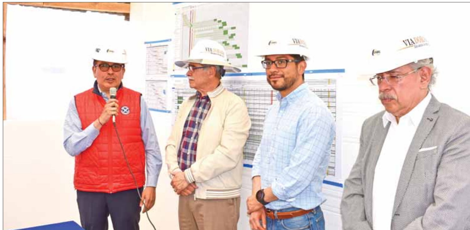
PERSISTENCIA. Visitó titular de la Sedeco cinco empresas cuyas participaciones fueron anunciadas durante el primer año del actual gobierno estatal.

Cabe mencionar que desde comienzos de este año la Dirección de Gobernación de la región Zimapán se encuentra acéfala, sin que hasta el momento se nombre a un nuevo responsable del área. (Hugo Cardón)