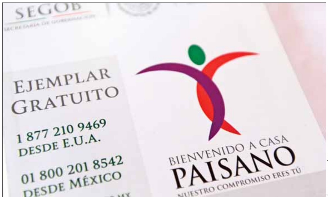
CONTEO. Año pasado visitaron entidad 31 mil 487 hidalguenses que residen en el extranjero.

Para mejor atención de los paisanos que regresan al estado en vacaciones, en los 37 municipios que participan en el operativo se dispusieron un total de 42 módulos que ya operan en las diferentes demarcaciones mediante la difusión de información.