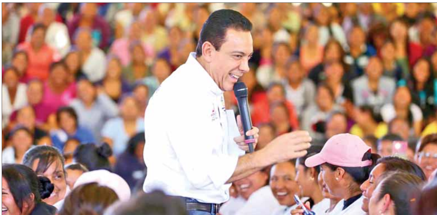
REGISTRO. Enfatizó el mandatario estatal la importancia de inscribir a más hidalguenses en los beneficios obtenidos desde este programa nacional.

Agregó que en materia de seguridad se implementó la estrategia Hidalgo Seguro, actualmente cuenta 11 arcos carreteros y más de mil 900 cámaras de videovigilancia en la zona para combatir, inhibir y prevenir la delincuencia.