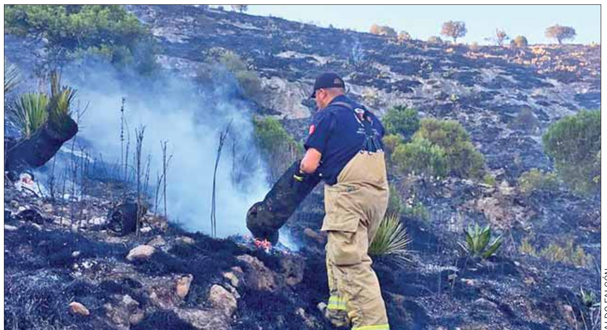
Apoyado por vecinos de lugar, personal de Protección Civil sofocó incendio en barrio de Camelia, Pachuca, donde más de 10 hectáreas fueron consumidas por el fuego.

Si quieren participar en eventos políticos los trabajadores del gobierno estatal tendrán que hacerlo durante sus horas libres. 3