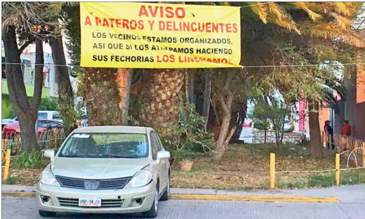
INMOVILIDAD. Reconoció un incremento en términos criminales; sin embargo, faltan las órdenes de aprehensión.

Por último indicó que las familias de los infractores ya los ubican como individuos dedicados a perturbar el orden en Barrio Alto, San José y El Carmen y que incluso ellos mismos han acudido a la Secretaría a pedir auxilio porque ya no los aguantan.