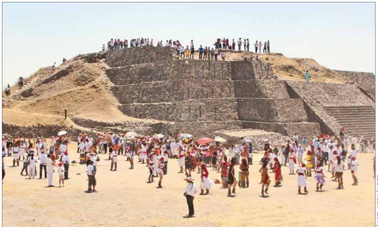
DIMENSIONES. Evento será 20 y 21 de marzo: con dos talleres, uno por día, dos ponencias magistrales y otros eventos.

Finalmente enfatizó la importancia de la ceremonia que se realizará el 21 de marzo en la zona arqueológica, la cual consistirá en ejecutar danzas y aromatizar el ambiente con fines de la carga de energía.