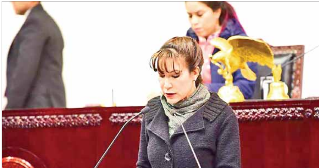
ATRASOS. Reconoció la legisladora que todavía están pendientes algunos asuntos como las leyes secundarias.

Esta semana podrían realizar la votación, toda vez que aún existen varios temas pendientes en cartera, como es el caso de la ley secundaria en materia laboral, que va de la mano con la reforma constitucional que se realizó en el rubro y por la cual desaparecen las Juntas de Conciliación y Arbitraje y se crea un tri-