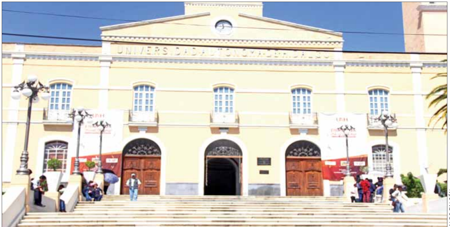
ACOTACIONES. Las mejoras se pagarán a partir del 20 de marzo o más tardar la segunda quincena de marzo, es decir el día 30.

MARCHA. Convocó el personal de la UAEH a una marcha este jueves 22 de marzo desde las 9:30 horas con el objetivo de mostrar su "compromiso social", dice un comunicado que fue lanzado en redes sociales desde la semana anterior.