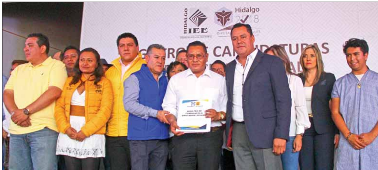
ARGUMENTOS. Manifestaron dirigentes que es necesario lograr la alternancia en Hidalgo y por ello combatirán para obtener una mayoría legislativa.

Los inconformes dijeron que previeron dicha situación; sin embargo, no esperaban que la atención también fuera suspendida, pues en otros años había atención aunque la resolución de temas se diera de manera posterior. Cabe mencionar que Ixmiquilpan cuenta con más de 130 comunidades.