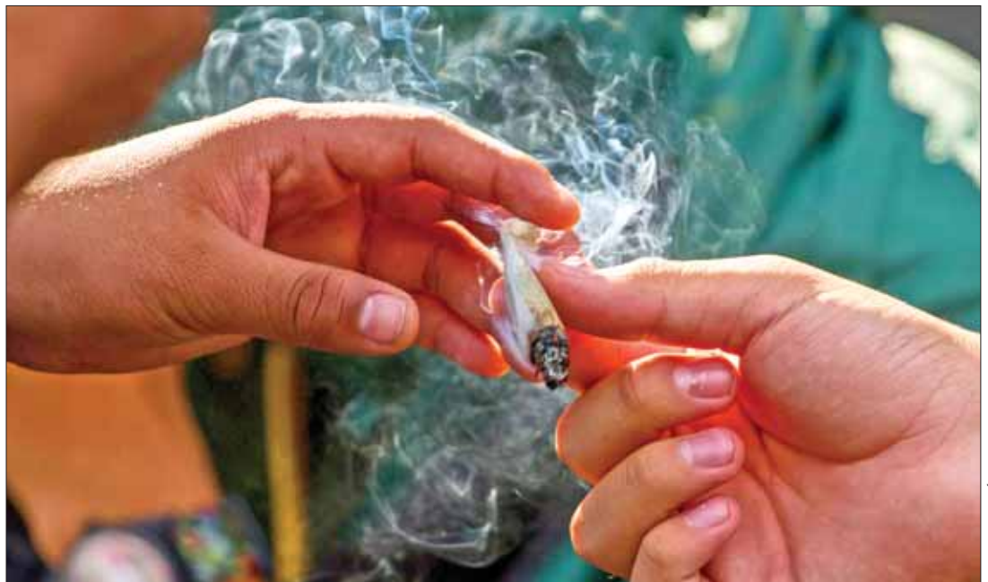
EJEMPLARES. Aprovecharon experiencias de quienes lograron salir adelante pese a sus problemas.

Manifestaron que para mejorar en el tema empresarial es necesario dar cumplimiento a los compromisos adoptados por las autoridades para el impulso de la innovación que surge de las incubadoras universitarias. (Milton Cortés)