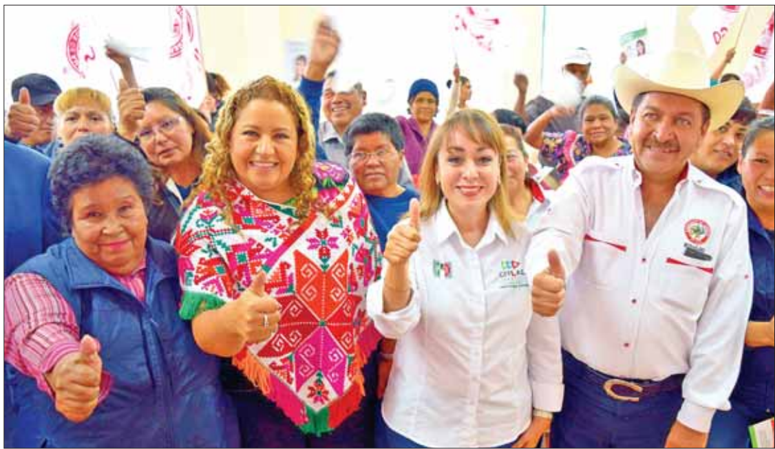
PASOS. Afirmó la candidata que también debe impulsarse el deporte y una mejor alimentación.

De igual forma indicó que en el ámbito de salud resulta fundamental la práctica de algún deporte y cuidar la alimentación. "Hoy desafortunadamente México es el país número uno en obesidad y eso está generando problemas de hipertensión, cáncer, diabetes y muchos otros que surgen como consecuencia de la falta de actividad física".