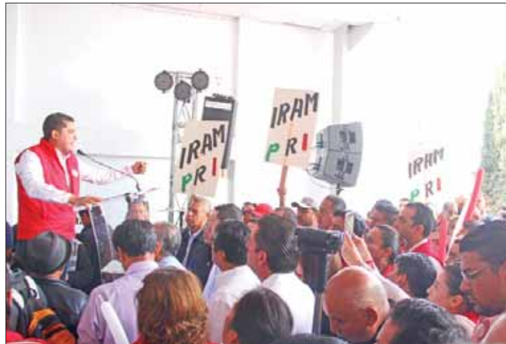
MARCO. Acudieron ante la sede del IEEH para presentar todos los documentos, al cumplir con requisitos solicitados.

Entre porras y apretujones, el líder priista presentó a las 12 fórmulas de mayoría y el listado plurinominal, quienes acudieron al órgano electoral para remitir su documentación, reiteró el compromiso y responsabilidad para