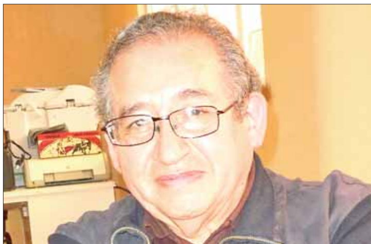
INSISTENCIA. Escenario ya había sido planteado por precandidatos.

Asimismo lamentaron que se haya ignorado a quienes siempre estuvieron con Morena y que trabajaron por el partido desde hace años, por darle preferencia a externos que sólo llegaron a colgarse de algo que ya estaba