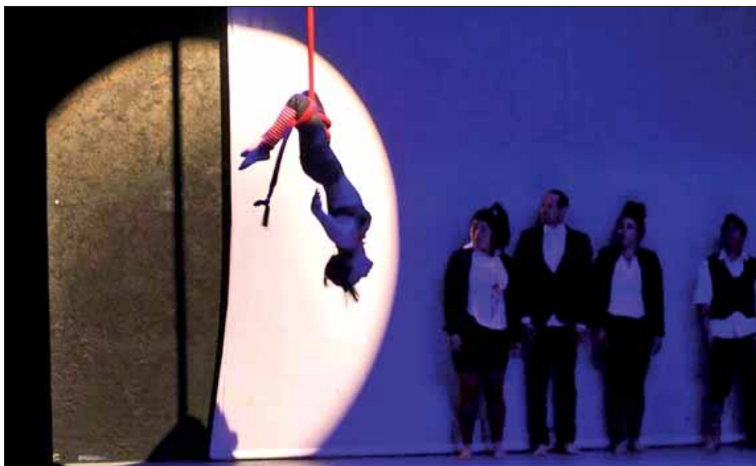
Recibió Hidalgo el Festival Internacional de Circo 2018, con espectáculos de compañías locales, nacionales e internacionales.

Entre porras y apretujones, el líder priista presentó a las 12 fórmulas de mayoría y el listado plurinominal, quienes acudieron al órgano electoral para remitir su documentación, reiteró el compromiso y responsabilidad para rendir cuentas a la ciudadanía, pues a diferencia de sus rivales políticos, el PRI no improvisa. .3