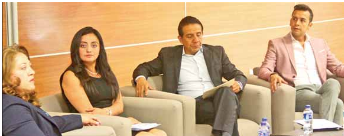
NIVEL. Expuso delegación en Hidalgo importancia de herramienta.

Los cinco pilares refieren: elaboración de un estudio de opinión censal por parte de los can-