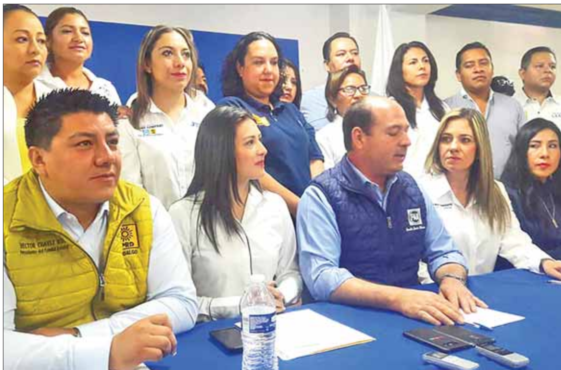
PAPELES. Advirtieron que ya preparan denuncias formales para contrarrestar acciones en detrimento.

► Acusó el líder del PRD en Hidalgo que hay algunas comunidades donde exigen dinero a sus candidatos