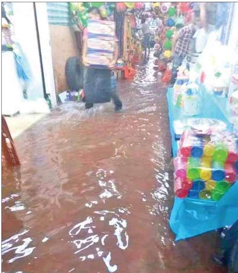
Fuerte tormenta acompañada por granizo generó anegaciones en varias colonias y en el mercado municipal de Huejutla.