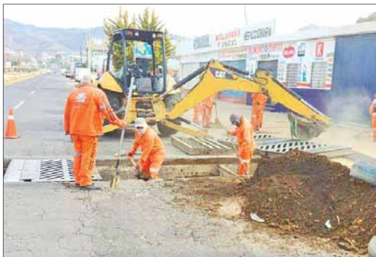
TEMPORADA. Recordaron que desde hace años padecen los estragos con lluvias.

Señalaron que son al menos siete fraccionamientos pertenecientes a estos tres municipios los que en temporada de lluvias