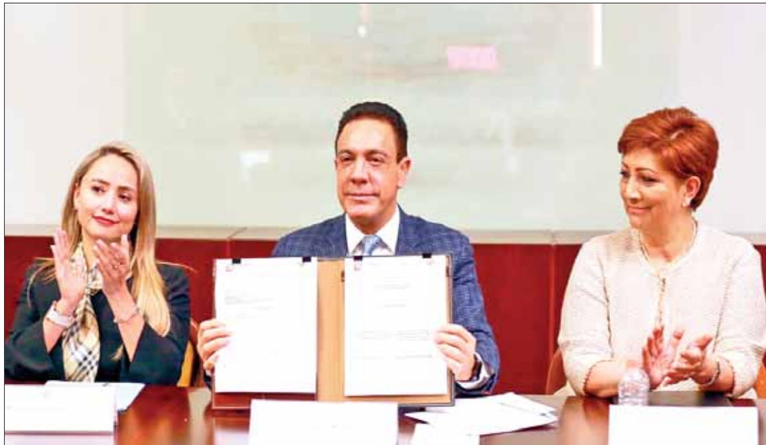
PARTICIPANTES. Contó con aval de tribunal superior, Congreso del estado, Secretarías de Gobierno y de Seguridad Pública.

La Comisión Interinstitucional para la Consolidación del Sistema de Justicia Penal contará