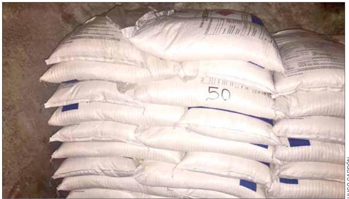
LOCALIZACIÓN. Los hechos ocurrieron en la comunidad Verdosas; movilización de corporaciones policiales de la región.

Hasta el cierre de esta edición, no se tenía indicios del paradero de este material; sin embargo, estaban vigilantes ante cualquier información que se les pudiera proporcionar de su paradero, esto a fin de que se evite tomar riesgos.