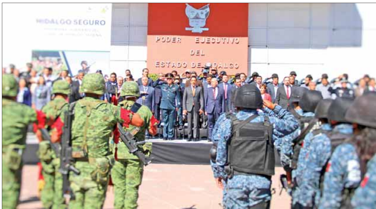
Acompañado por autoridades federales y estatales, detalló el gobernador Omar Fayad acciones contundentes a seguir en Hidalgo contra el robo de combustibles.

"En Hidalgo combatimos con responsabilidad y fuerza el robo de hidrocarburos y aunque los índices de inseguridad se consideran bajos, reitero mi total compromiso de continuar trabajando en la construcción de un estado más seguro".