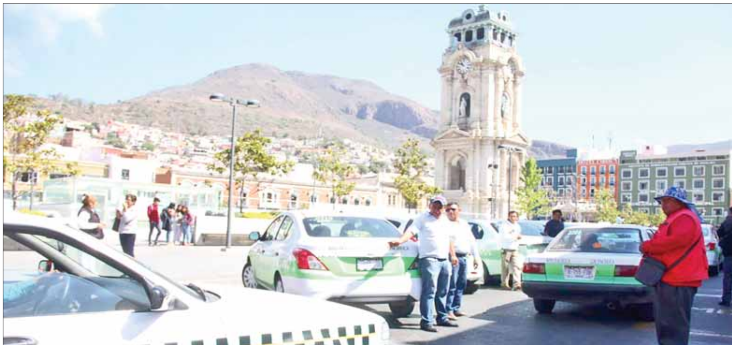
SORPRESA. Recordó Guevara que la dependencia estatal continúa con operativos especiales para identificar violaciones a reglamentos.

Según el reglamento de elecciones, las autoridades electorales pueden solicitar el desarrollo de estudios sobre las boletas y demás documentación, principalmente respecto a participación ciudadana, capacitación, características geoelectorales de la votación, entre otros tópicos. (Rosa Gabriela Porter)