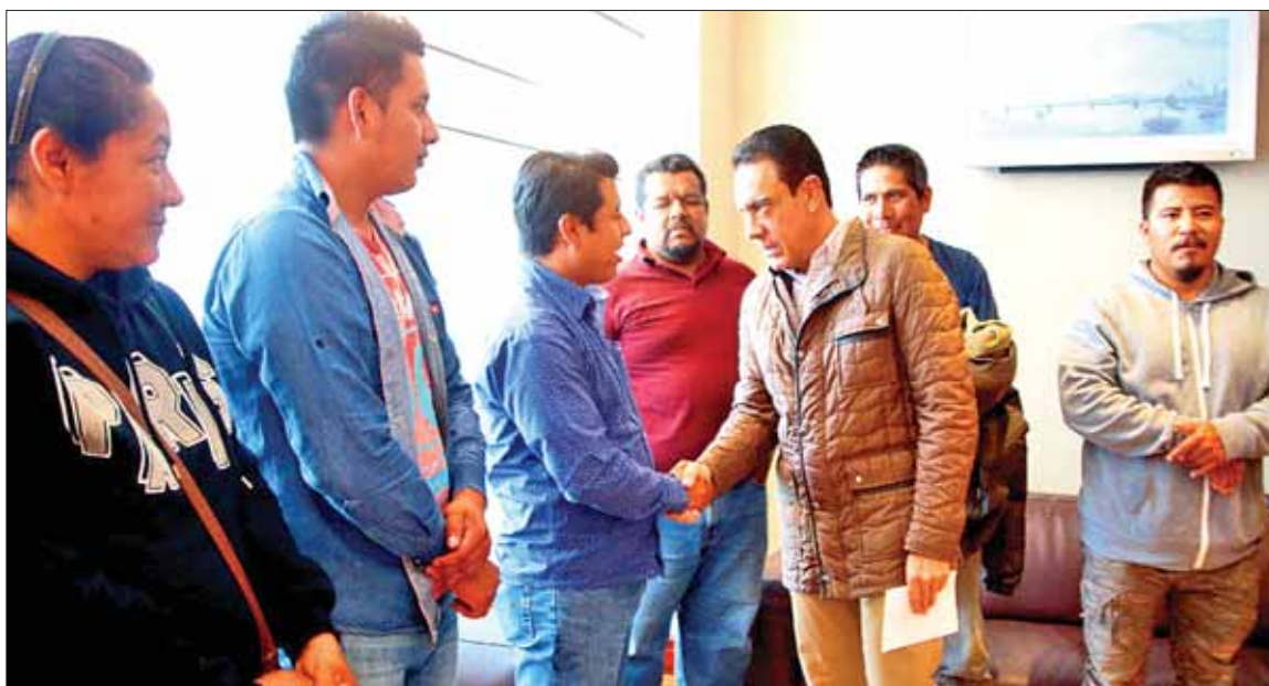
El gobernador Omar Fayad se reunió con familiares de personas que fallecieron en el incidente suscitado en días pasados en la mina de mármol de Francisco I. Madero. En charla abierta y franca los deudos agradecieron la inmediatez con que autoridades estatales actuaron ante el derrumbe, al desarrollar trabajos de rescate, así como apoyos que hoy se coordinan en beneficio de todos los afectados. Omar Fayad refrendó su total solidaridad y manifestó su interés de hacer equipo con las familias, cuyo sostén económico se basa en las actividades de explotación del material rocoso.

"La recomendación del gobernador Omar Fayad es regularizar al transporte público en todas sus dimensiones y otorgar un servicio de calidad a los usuarios".