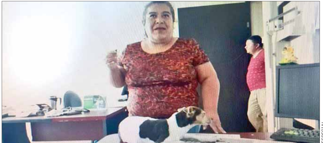
SÍNDROME. En ocasiones las redes sociales distorsionan lo ocurrido.

Se reiteró, la mascota está viva y en recuperación, por tanto el personal de Control Canino nunca extralimitó sus funciones y no atentó contra la mascota.