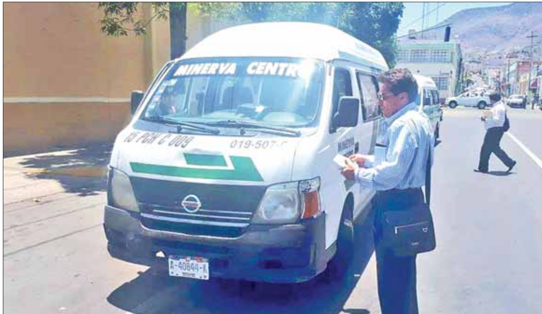
REGLAS. Indicó el secretario que algunas zonas están marcadas para pasaje pero las utilizan como estacionamiento.

Añadió que algunas zonas de ascenso y descenso actualmente son utilizadas como bases para taxis metropolitanos, que en oca-