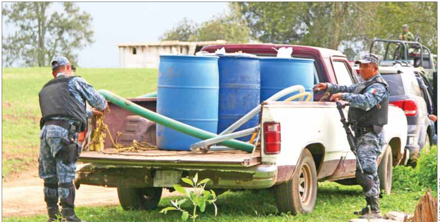
CAUSAS. Las dos personas que fueron aseguradas no lograron comprobar el origen del hidrocarburo que transportaban.