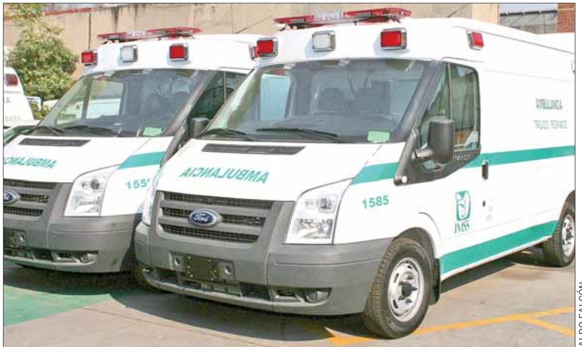
POTENCIAR. Subrayó el organismo mejoras en la calidad que brinda a la derechohabiente del estado.

También se otorga el componente salud a las familias afiliadas al programa federal Prospera, el cual es de inclusión social y se prestan servicios a las personas afiliadas al Seguro Popular en algunas regiones de la entidad, como la Huasteca, la Otomí-Tepahua o el Valle del Mezquital.