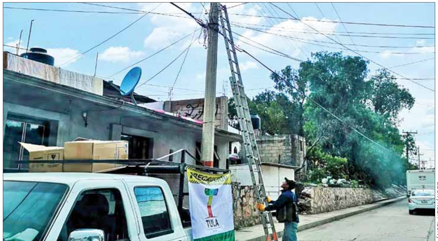
DINEROS. Destacó que desde su llegada al ayuntamiento de Tula trabajó por solventar las deudas.

Hasta ahora se han colocado 2 mil de 11 mil 54 censadas.