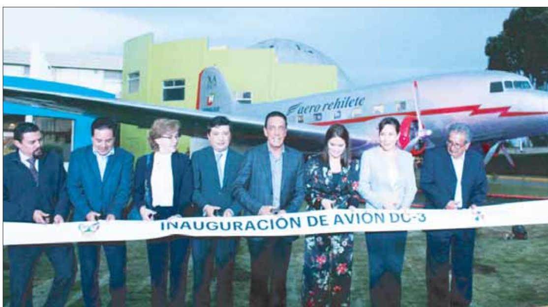
Al inaugurar un nuevo atractivo en el museo El Rehilete, el gobernador Omar Fayad, subrayó la inversión en becas de su administración, a favor de la infancia y juventud del estado. 2

Señaló que los tiempos para la entrega-recepción ya están marcados en la ley, por lo cual desde hace varios días se trabaja en los formatos. 3