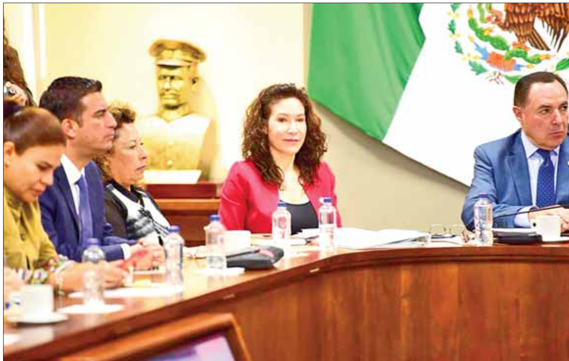
RECURSOS. Subrayó presidenta que el presupuesto ya está etiquetado por mes, para que no haya ningún problema.

Por lo anterior este año será una cuenta pública compartida, la LXIII Legislatura comprobará gastos y el recurso ejercido