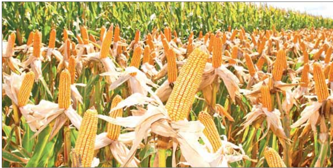
RESPALDO. Además los labriegos de la entidad cuentan con el Seguro Catastrófico contratado por el gobierno estatal.

Confío el secretario de Agricultura que durante este año se tendrán excelentes cosechas de los diversos productos; "todavía no canto victoria, así comenté el año pasado, en el último coletazo de las lluvias se presentaron varias afectaciones y se inundó