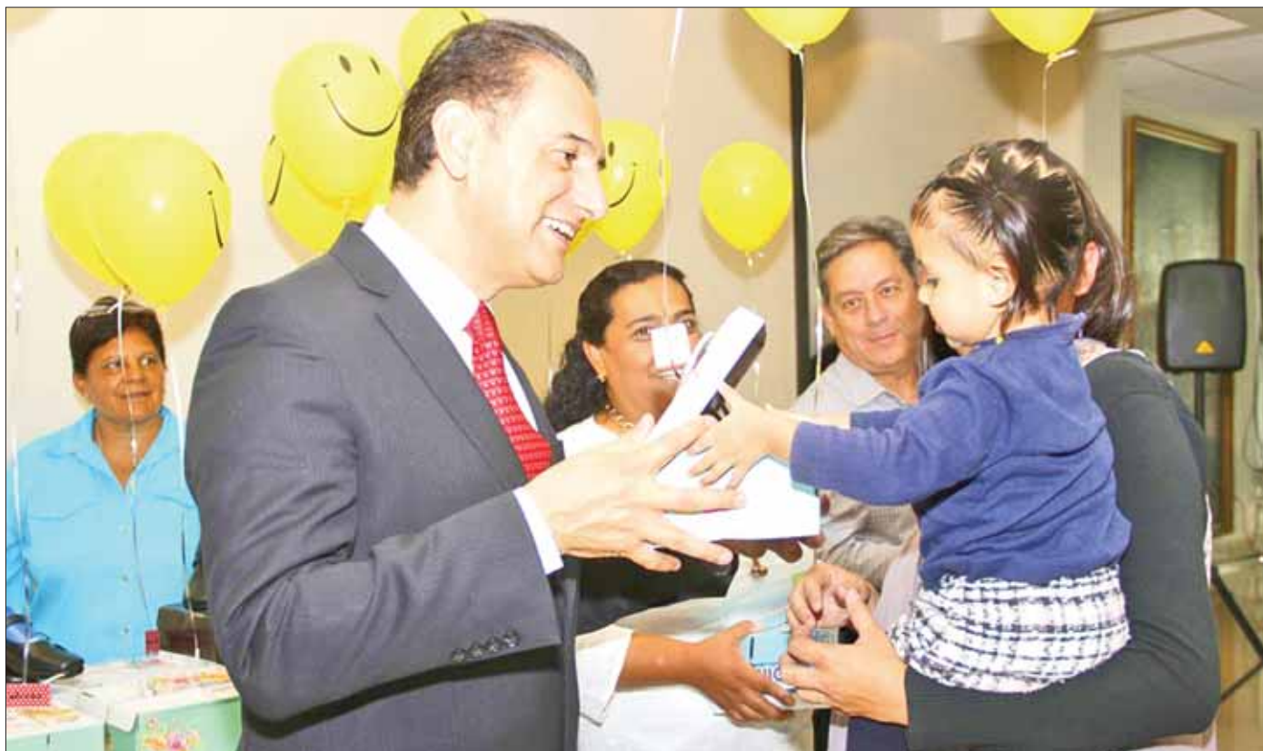
ESFUERZOS. Dicho acto fue en coordinación con una asociación civil y gracias al programa Todos somos útiles.

El calzado es 100 por ciento de piel y los números de los zapatos van desde el 18 al 25. Principalmente el beneficio está dirigido para menores de escolaridad primaria de instituciones públicas del municipio.