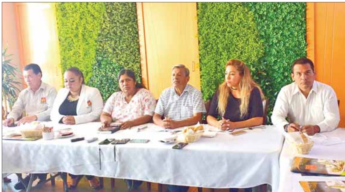
FICHITA. Un grupo de militantes inconformes exigieron la expulsión de A.A.B., debido a este y otros comportamientos.

Esta situación desencadenó la molestia de la plantilla laboral completa, ya que continuamente son amenazados.