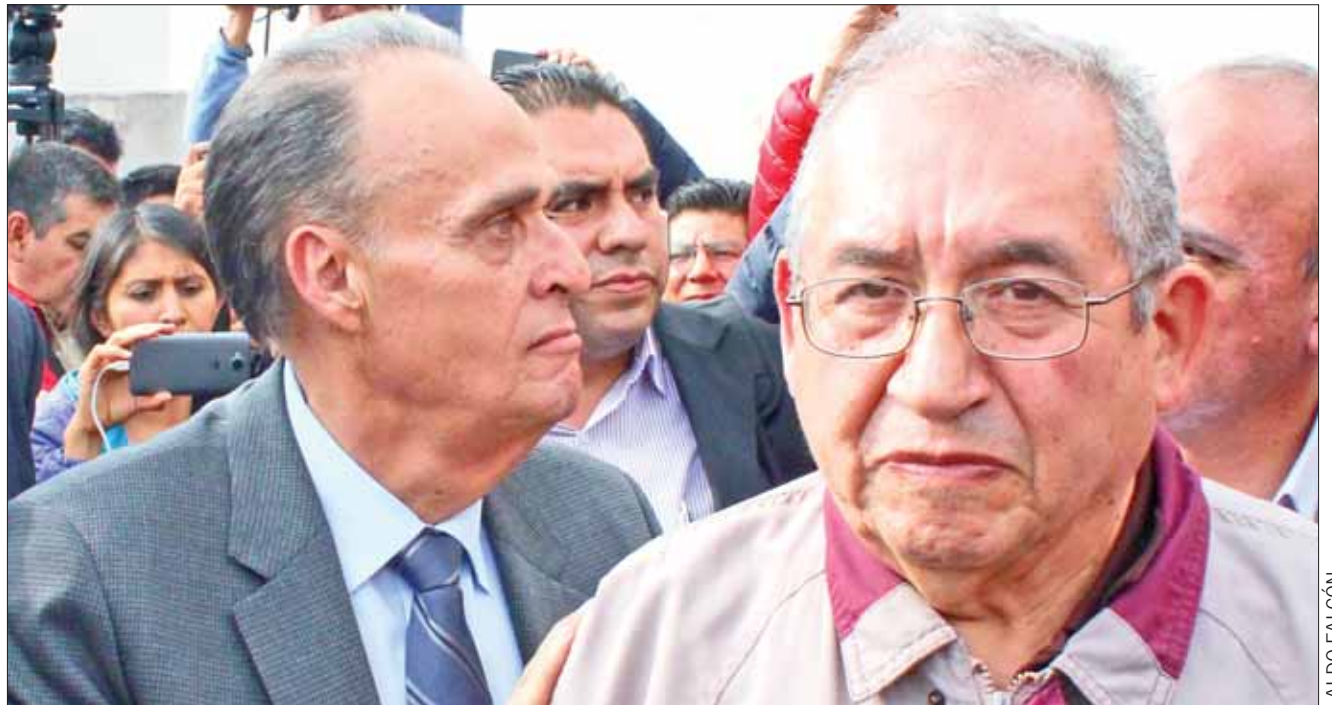
RECORDATORIOS. Premisa es que caso se resuelva Morena en los términos en que se aprobó el pasado 13 de septiembre, donde el partido obradorista para presidirá la junta de gobierno, el primer año.

Agregó que hay una agenda extensa y por ello se debe resolver el tema de la junta a la brevedad.