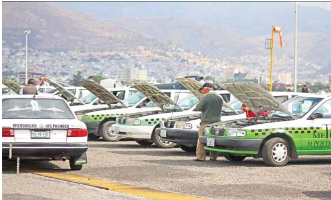
INSTRUCCIÓN. Refirió que para el gobernador Omar Fayad el tema de los permisos también debe ser acorde con las normativas.

El artículo 170 de la ley establece que las concesiones para prestar servicios públicos del transporte colectivo o individual