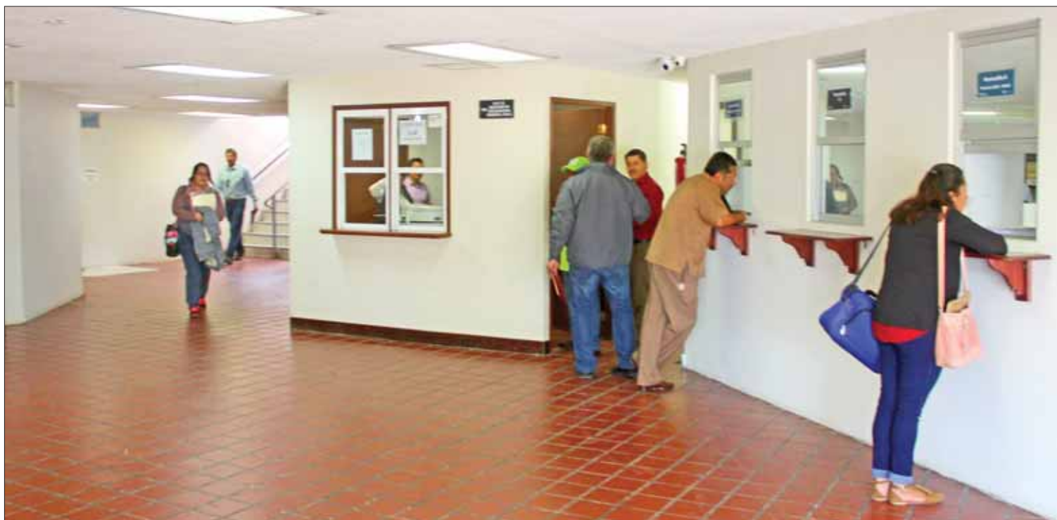
RUBROS. Elaboraron autoridades federales guía para que en instituciones tengan conocimiento de las situaciones de riesgo en las que se encuentra y cuente con los elementos indispensables para adoptar las medidas preventivas y correctivas necesarias.

La Guía constituye una herramienta que brinda la información y las indicaciones básicas necesarias para que la comunidad escolar pueda contar con su Programa Escolar de Protección Civil y con ello darle a cada miembro un papel específico, considerando siempre que la mayor prioridad es salvaguardar la integridad de NNA.