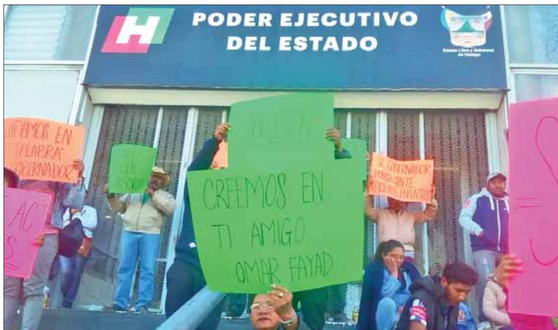
Protestaron vecinos de Tizayuca ante el Palacio de Gobierno en demanda del retiro de unidades del transporte público irregulares que afectan a concesionarios con documentos en orden.

Puntualizó que el periodo de vigencia será determinado tomando en consideración, entre otros aspectos, rentabilidad en el servicio y la necesidad que da origen, establecidos mediante dictamen técnico emitido por el organismo. .3