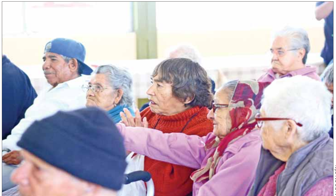
FORMAS. En distintas casas de día emprenden acciones encaminadas a la construcción de un mejor escenario para las personas en edad avanzada.

Añadió que en distintas casas de día se han puesto en marcha acciones para encaminar a las personas en edad avanzada a una armoniosa fase de tercera edad de sus vidas; sin embargo, señaló que por diversas razones, se enfrentan muchas veces a situaciones que tienen que ver con afectaciones en materia psicológica.