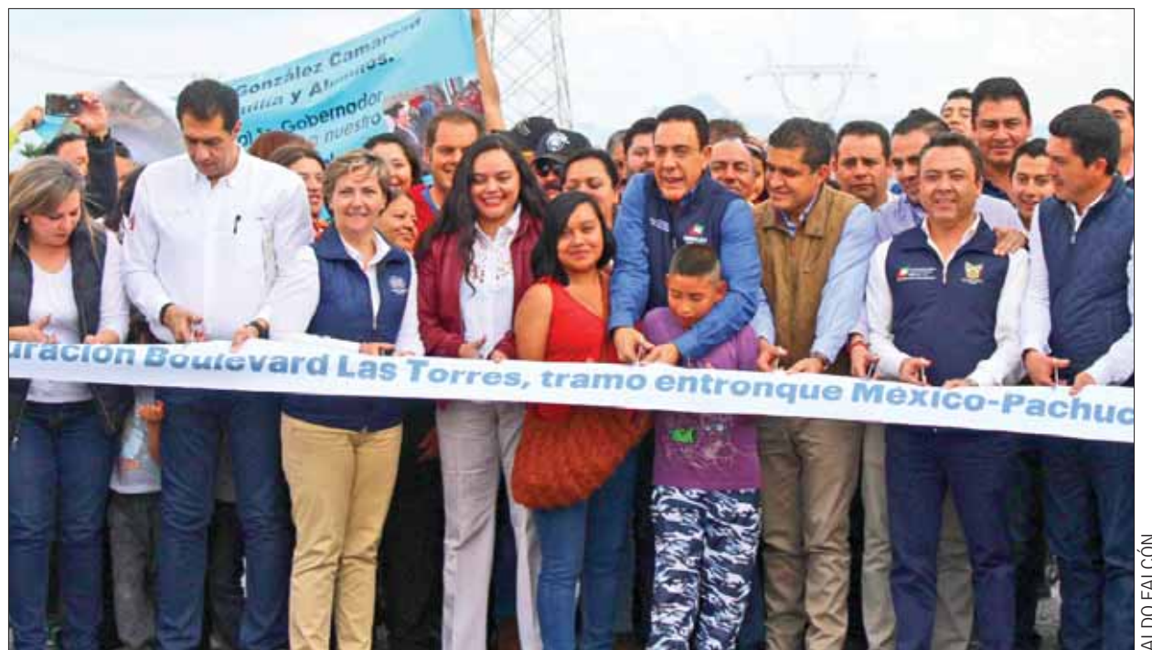
Inauguró mandatario estatal nuevo tramo carretero para mejorar conexión con la capital hidalguense y municipios conurbados.

Consideró que esta obra es de gran relevancia porque pasaron muchos años.... 3