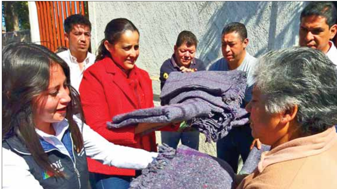
SANTIAGO TULANTEPEC. Los documentos deberán ser entregados a los delegados de las colonias o directamente en las oficinas del Sistema DIF local.

Los documentos deberán ser entregados a los delegados de las colonias o directamente en las oficinas del Sistema DIF de