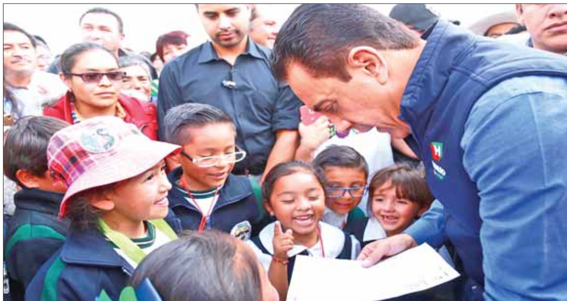
DISTRIBUIDORES. Acudió el mandatario estatal para la apertura de ampliación en el bulevar Las Torres, al sur de Pachuca.

Consideró que esta obra es de gran relevancia porque pasaron muchos años desde su planea-