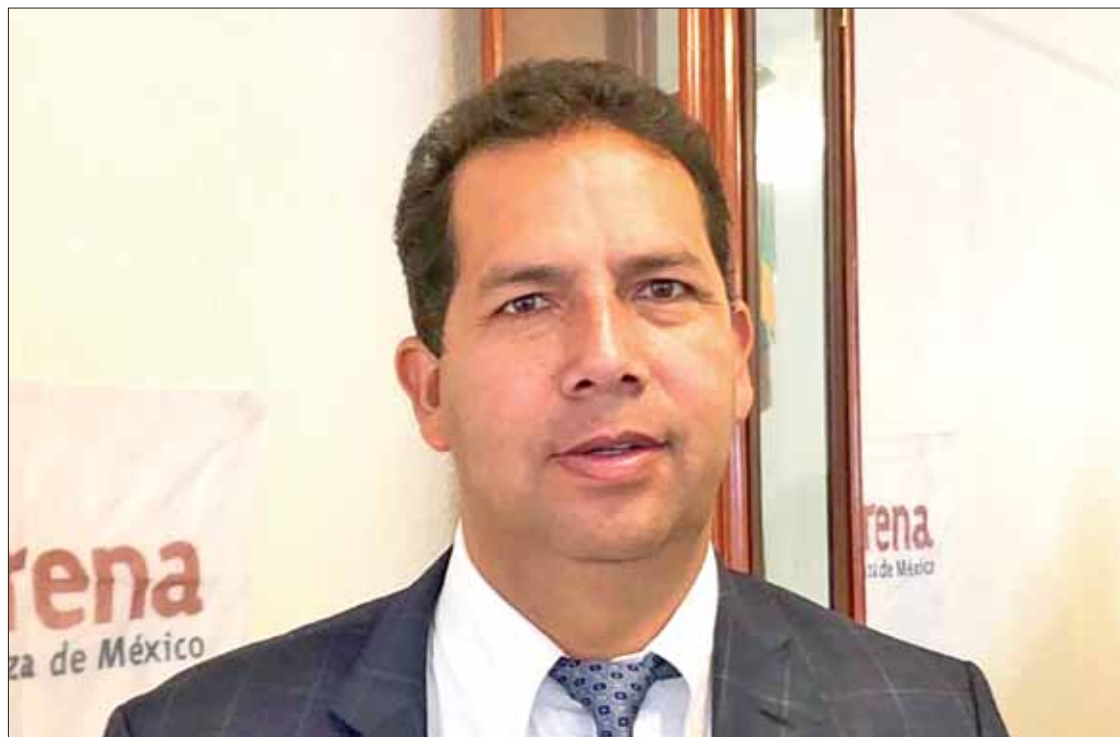
RASTROS. Acusaron que Julio César no quiere dejar el municipio para irse a cumplir de lleno su encargo federal como legislador.

► Detallan que si sigue con acoso que mantiene contra capital privado dañará la economía local