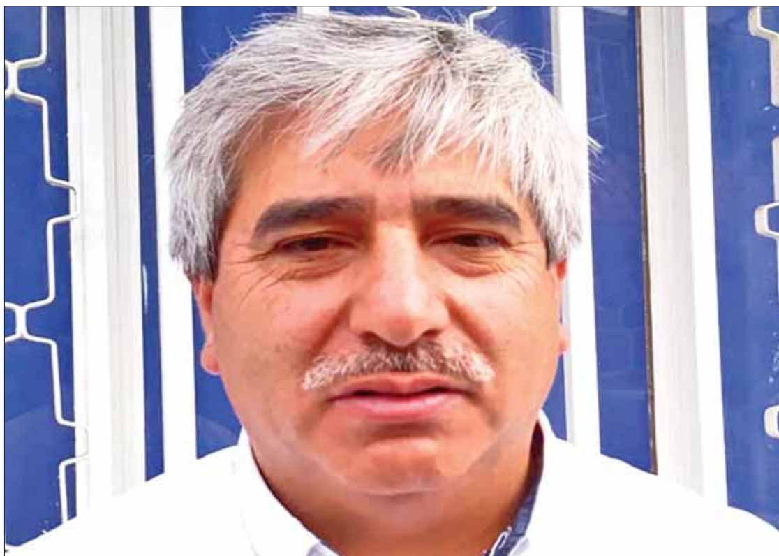
IDENTIFICADOS. Explicó que se realiza un censo para conocer necesidades de las familias vulnerables a lo largo del país.

Dijo que para evitar malos entendidos o que alguien se haga pasar por censador o servidor de la nación para obtener datos confi-