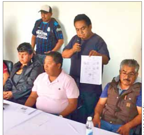
MAÑAS. Expusieron que las rúbricas fueron falsificadas y los sellos no corresponden.

En cuanto al comité de obra de San Miguel, cuestionó que se recurra a este tipo de malas prácticas para evitar ser juzgados por las autoridades, más aún cuando los protagonistas señalan que no debe haber impunidad dentro del nuevo gobierno federal, que está por iniciar en diciembre.