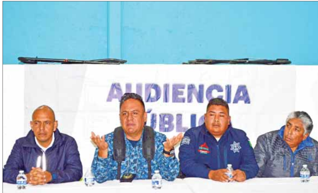
RESPUESTA. Indicó Moreno que la estrategia de Seguridad Pública en Hidalgo no sólo se trata de detenciones.

Solicitó la atención de Policía Federal pues muchos asaltos son perpetrados sobre vías federales, e incluso con unidades que cuentan con códigos de patrulla.