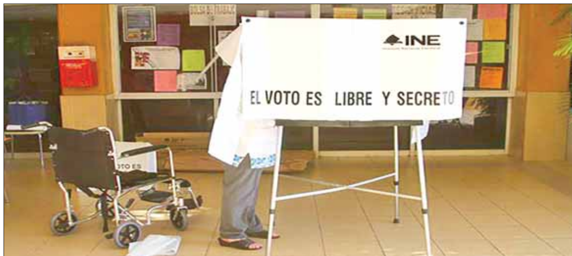
CARACTERÍSTICAS. El 100 % de estos insaculados participaron activamente en el proceso, según el informe de la Dirección Ejecutiva de Capacitación Electoral y Educación Cívica del INE.

► Funcionarios de mesas directivas de casilla durante la contienda 2017-2018