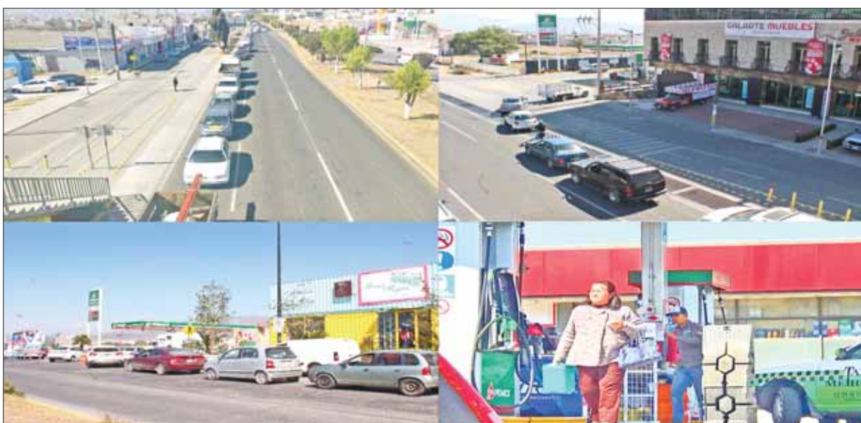
Extensas filas de automovilistas comenzaron a observarse en las gasolineras de Hidalgo para obtener un poco de combustible, algunas personas prefirieron almacenarlo mediante bidones, garrafones o hasta en cubetas, ante el temor de que continúe el desabasto provocado por el gobierno federal y su lucha contra el huachicolero.

Apuntó que en Hidalgo no se permitirá la llegada de empresas como Uber, pues se cuida el trabajo formal de concesionarios a través de lineamientos de la Ley de Movilidad y Transporte. .3