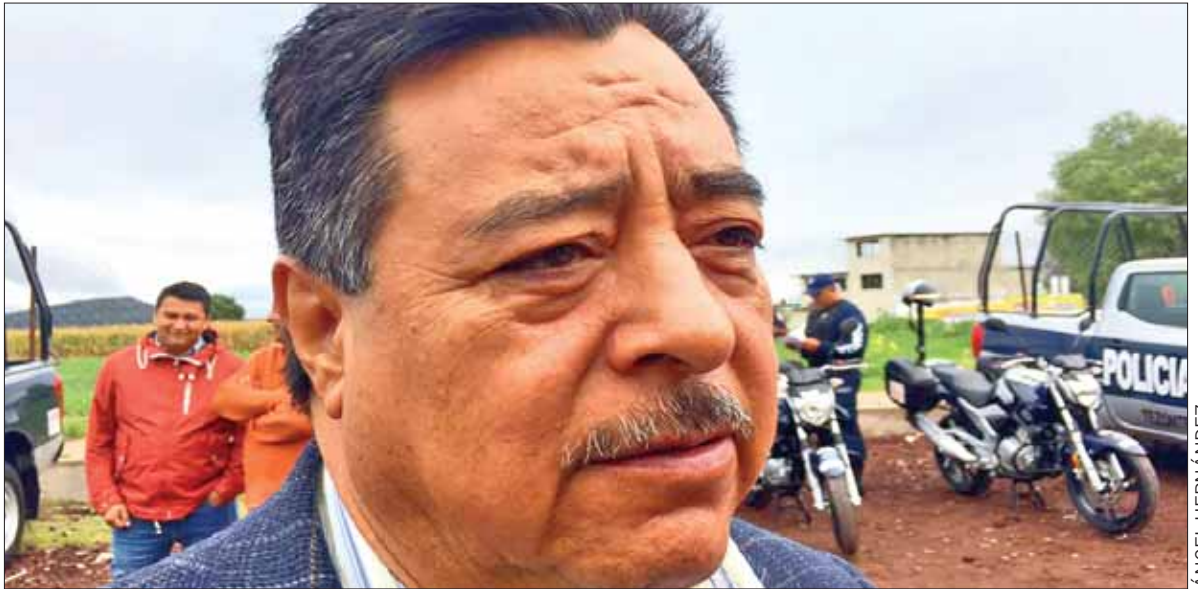
MUESTRAS. El Ejecutivo tezontepense sólo ha acudido en una ocasión a los encuentros que buscan tener un balance diario del clima de inseguridad que se vive en la franja suroeste de la entidad.

Pese a las críticas dijo que el gobierno que encabeza está dispuesto a apoyar en todo lo necesario a la Federación, "pero con una estrategia efectiva".