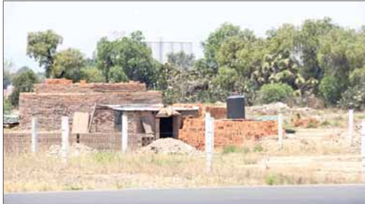
ANTECEDENTE. Desde hace tiempo crecieron quejas en región.

Las primeras quejas presentadas fueron por parte de habitantes de la colonia Chapultepec, quienes indicaron que estas fábricas utilizan estiércol como combustible, lo que ocasiona una grave contaminación.