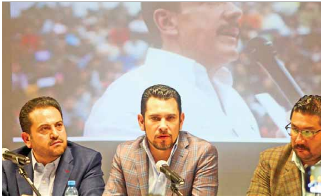
PREVISIONES. Adelantó el secretario que el Tuzobús tiene garantizado el servicio para sus usuarios.

En los próximos foros se abordarán anteproyectos del reglamento de la Ley de Movilidad y Transporte, programas de Seguridad en Transporte, de Ordenamiento, de Movilidad Sustentable y de Fortalecimiento Institucional.