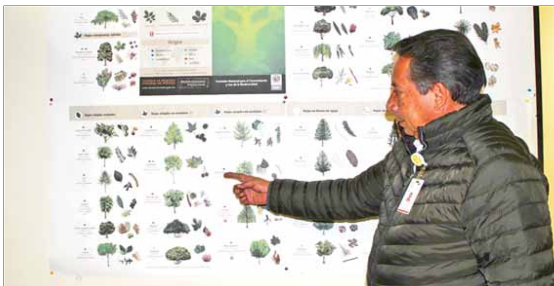
TULANCINGO. Nutrirán el suelo de las áreas verdes del municipio.