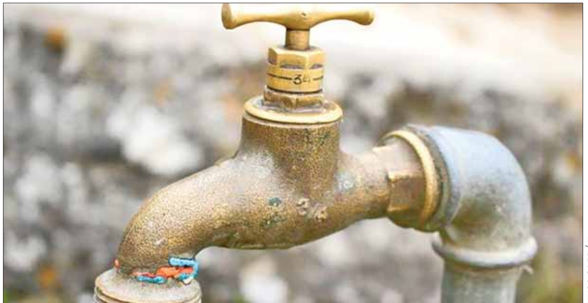
PAUTAS. El edil solicitó apoyos y obras para combatir el rezago que persiste en diversas comunidades.

Los habitantes de Usdeje solicitaron a los regidores de Ixmiquilpan intervinieran directamente para solucionar este problema que afecta a varios poblados de la zona norte que no gozan de este servicio, debido a las condiciones geográficas donde se encuentran.