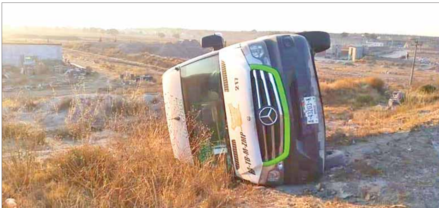
COLMOS. Reconoció que seguro contratado tardó más de una hora en llegar, por lo cual adelantó sanciones para la empresa del servicio.

El Sistema Integrado de Transporte Masivo de Hidalgo actuó conforme el protocolo de seguridad, aunque la aseguradora contratada por la empresa concesionaria del Tuzobús, Corredor Felipe Angeles, tardó una hora y media en llegar al sitio para apoyar a los afectados, por lo que se sancionará a la empresa.