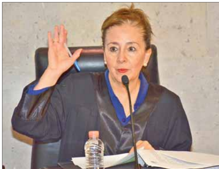
SELECCIÓN. Recordó que otra alternativa es la coalición: sin embargo, exige el cumplimiento de más requisitos.

únicamente son viables en un tercio del total de los distritos o municipios en disputa, los partidos suscribirán un convenio a partir del día siguiente del término de