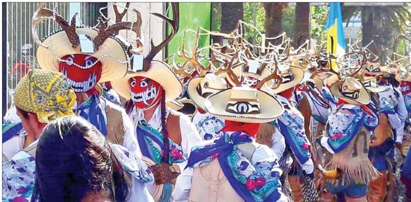
AMBIENTES SANOS. Indicaron que en todos los puntos donde organizan verbenas populares de este tipo la intención es, además de celebrar las festividades de forma segura, terminar con la mala imagen que en existe sobre determinadas zonas.

De igual forma, exaltaron que la participación de la población es parte fundamental para hacer de estas fiestas eventos atractivos para las familias y heredar a las generaciones venideras las costumbres que se han arraigado en estos lugares.