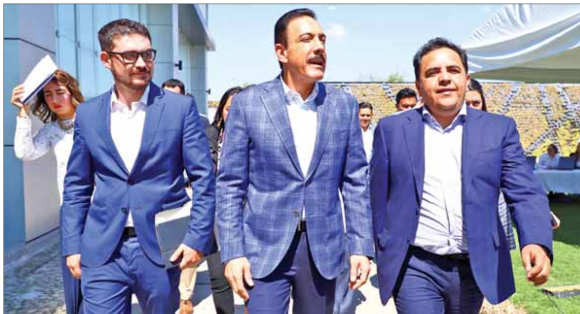
Inició foro de consulta en Hidalgo para construcción de Plan Nacional de Desarrollo, donde Omar Fayad subrayó el compromiso de su administración para democratizar este documento.

Indicó que el Foro Estatal de Consulta para la Construcción del Plan Nacional de Desarrollo será nutrido con todas y cada una de las aportaciones realizadas, mediante una gran jornada en beneficio del país y la entidad. 3