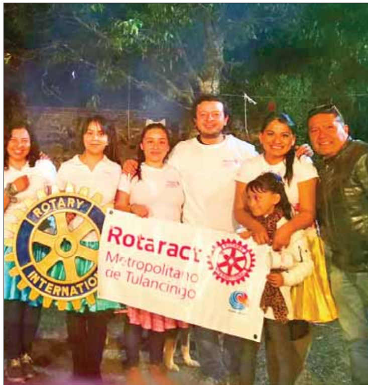
TULANCINGO. Actividad será hoy, por la noche, y costo es de 150 pesos.

Indicó que en este caso sería la quinta ocasión en que el Club Rotario Metropolitano de Tulancingo apoyaría una situación similar: "invito a la población a asistir a este evento pues al mismo tiempo ayudarán a quien resulte beneficiado".