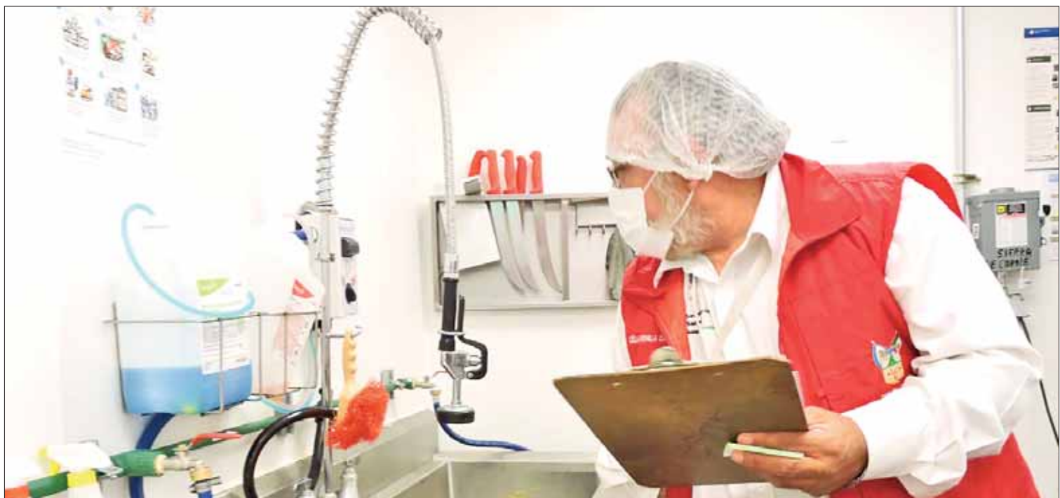
SUMATORIA. Población debe estar muy atenta a las características que deben tener alimentos, con el objetivo de evitar diversas enfermedades.