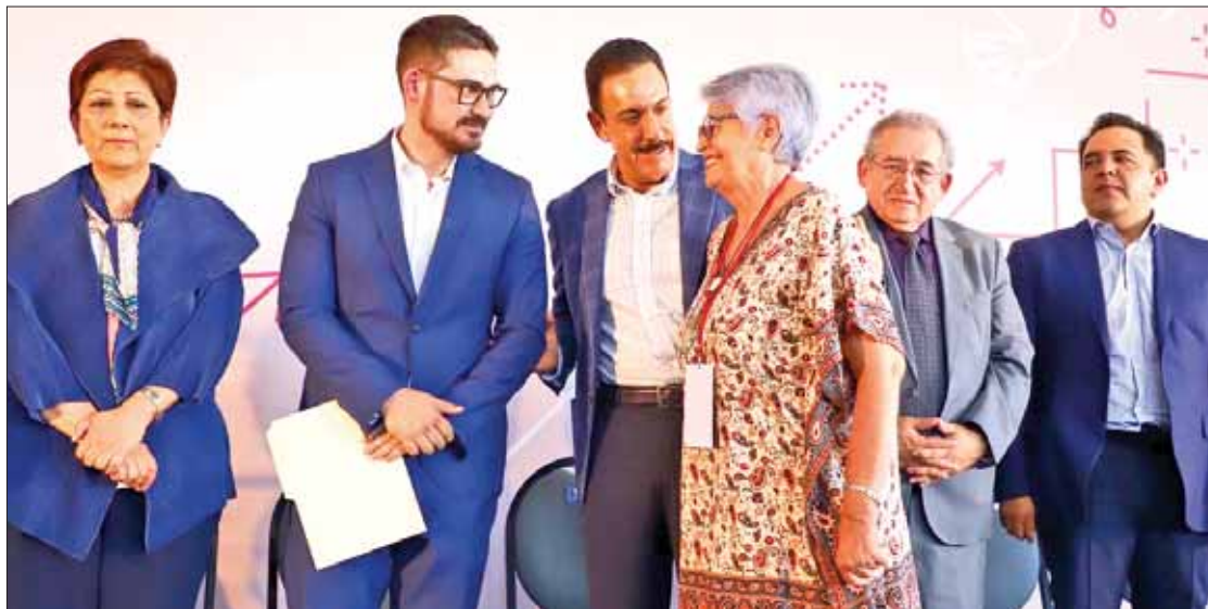
DEMOCRACIA. Recordó Fayad el ejercicio parecido que implementó a su llegada a la administración que encabeza.

Consideró que la participación de académicos, líderes sociales, representantes de pueblos originarios, empresarios, activistas, legisladores, alcaldes,