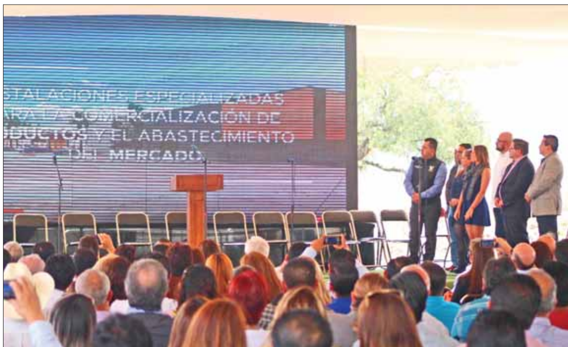
REQUERIMIENTOS. Subrayó el líder de comerciantes que empresarios ya cumplieron con la parte que les compete.

Aclaró que "no pretendemos ni venimos a que nos regalen nada. No venimos a pedirle al