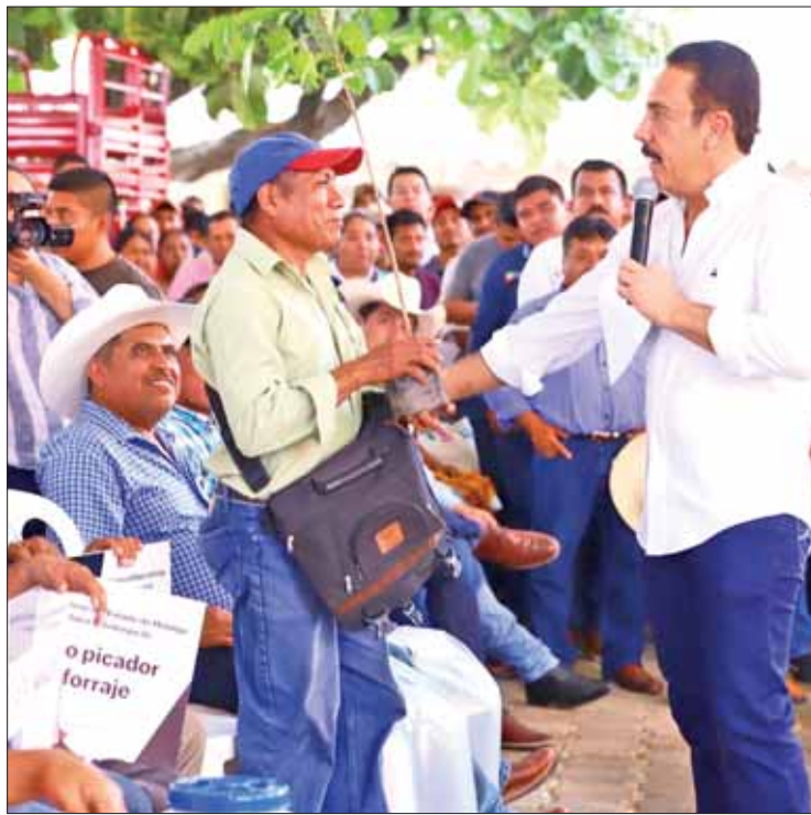
HERRAMIENTAS. Son familias o grupos organizados para obtener capacitación, proyectos de huertos, actividad acuícola, etcétera.

Hidalgo Te Nutre focaliza sus esfuerzos en 550 localidades periurbanas y rurales con un grado de marginación muy alto, alto y medio en 22 municipios de Hi-