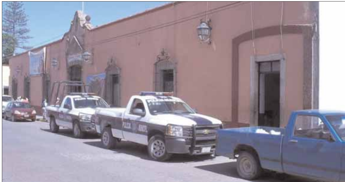
TESÓN. Pese a no contar con Fortaseg lo elementos obtuvieron resultados, de acuerdo con las estadísticas.

A esto deben sumar bajos salarios, ya que al igual que otras corporaciones policiales de la región