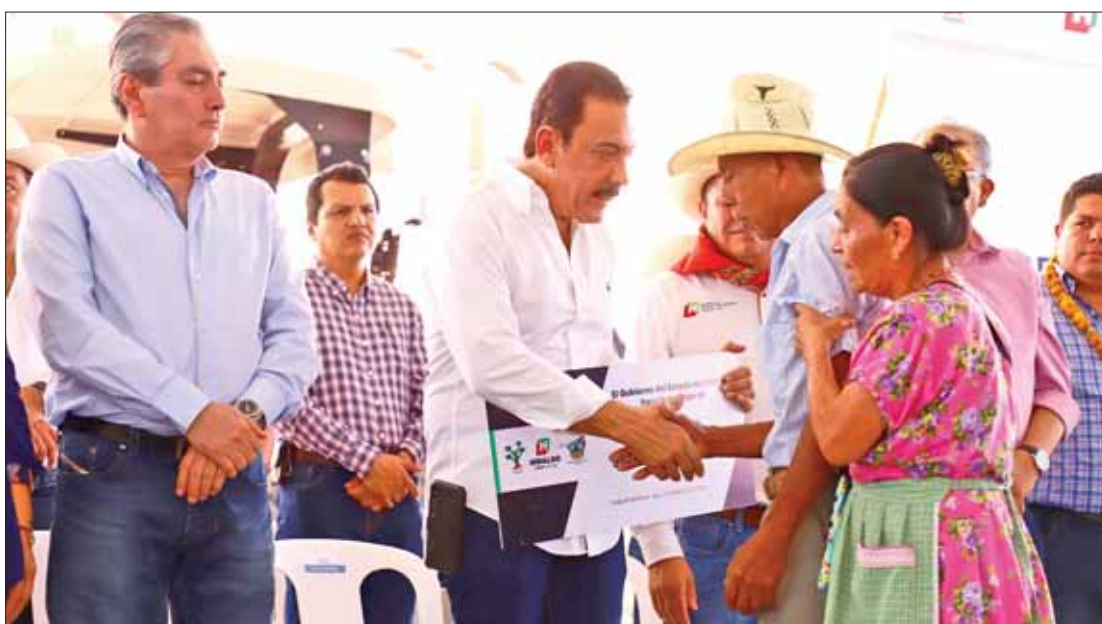
HIDALGO TE NUTRE. Prioriza el gobierno de Omar Fayad la seguridad alimentaria para las familias hidalguenses.

El principal rol de la FAO en la implementación de Hidalgo Te Nutre es proporcionar capacitación y acompañamiento metodológico a las 22 Agencias de Capacitación y Seguimiento Técnico (Adecs), que implementan las estrategias. .3