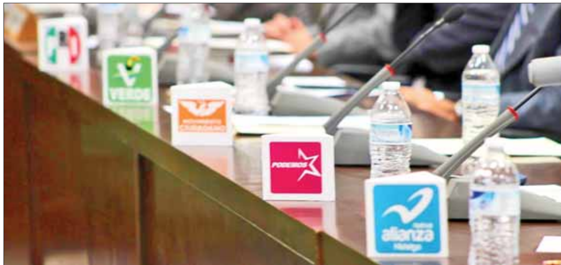
PENDIENTES. Detalló representante del PRI que todavía falta discutir asuntos como las candidaturas comunes.

► Avanzan los consensos entre partidos para adelantar el comienzo del proceso electoral; sería en noviembre