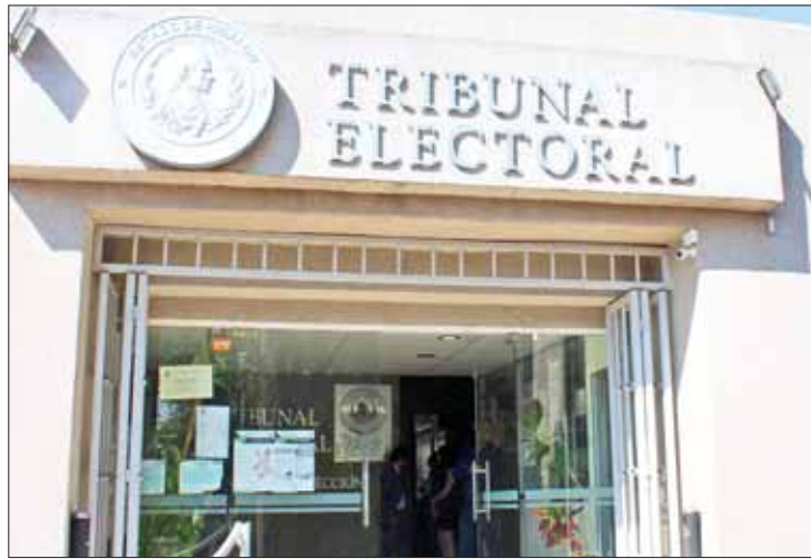
PRECEDENTES. Hay denuncias también por violencia política de género.

Remitieron copias del expediente a la Procuraduría General de Justicia del Estado (PGJEH) por posibles