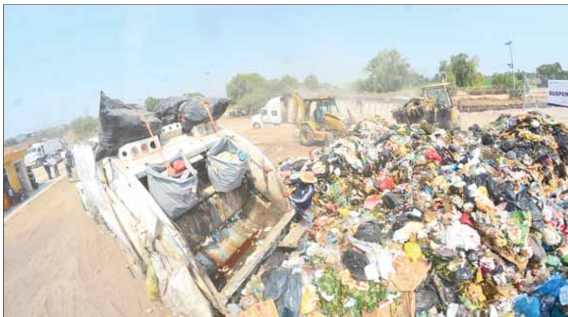
ESPERA. Adelantó el alcalde que la Semarnath revelará en breve las posibles cuotas y apoyos del estado.

Confirmó que habrá un subsidio importante del gobierno estatal a través de la Secretaría de Medio Ambiente (Semarnath) que; sin embargo, será definido por la propia dependencia en próximos días, por lo que prefirió omitir cifras.