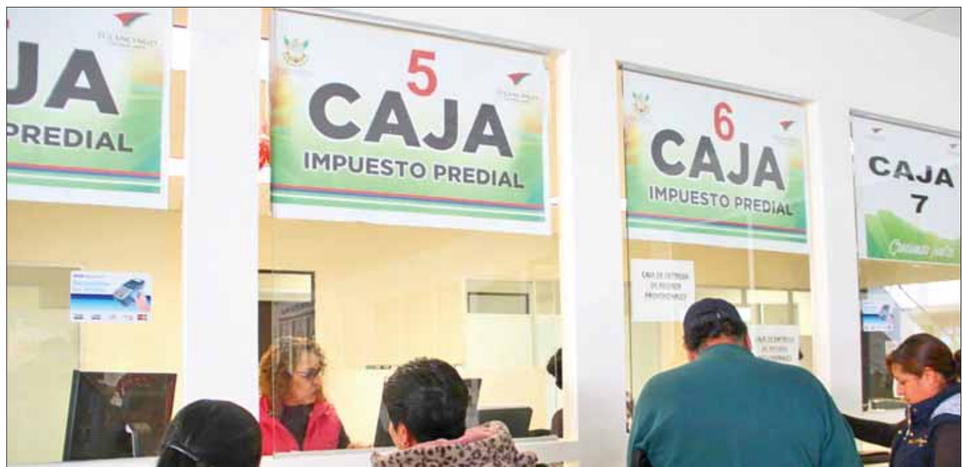
AREA. Refirieron autoridades que esta es una buena oportunidad para cumplir con las obligaciones locales.

Se dijo que muchas veces los adeudos acumulados en impuesto predial son porque la ciudadanía enfrenta diversas situaciones que le imposibilitan cumplir, pero en esta ocasión la campaña es una gran oportunidad que vale la pena aprovechar.