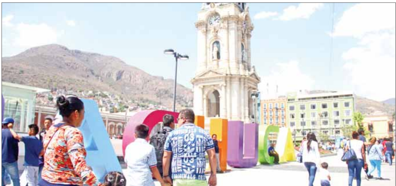
EXPOSICIÓN. Representa alternativa única para demarcaciones sin litorales pero con carga cultural.

El tianguis dispondrá de un espacio para realizar citas de negocios y venta de paquetes turísticos, hay 70 compradores inscritos y se espera que llegarán a 100 al momento de iniciar, habrá un pabellón internacional, en el cual participará el Reino Unido como país invitado.