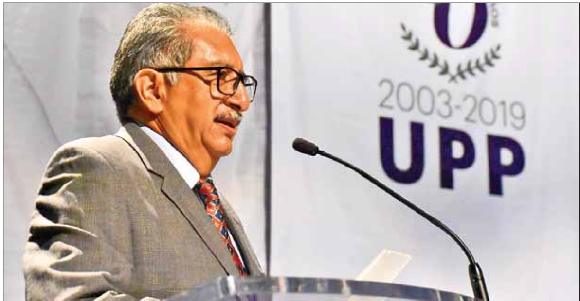
CERTEZAS. Destacó, en presencia del titular de la SEPH, trabajo coordinado entre gobierno estatal y federal.

En su intervención, el secretario de Educación Pública de Hidalgo reconoció el trabajo que ha realizado la UPP para formar a profesionistas competitivos.