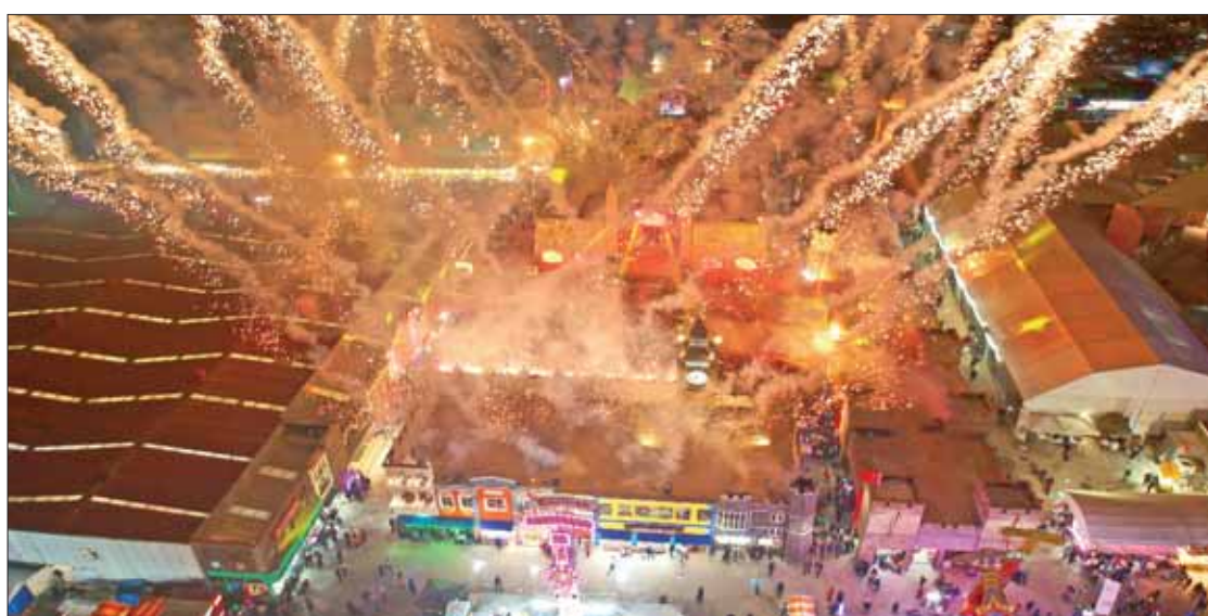
CIERRE. Con saldo favorable y más de 1 millón de visitantes culminó la Feria San Francisco Pachuca Hidalgo 2019, una de las cinco más importantes del país. 2

La secretaria del Trabajo en la entidad puntualizó que la institución a su cargo focaliza sus esfuerzos en cuatro acciones principales: Apoyo al Empleo; Capacitación para y en el trabajo; Vigilancia al cumplimiento de las disposiciones normativas en materia laboral... 3