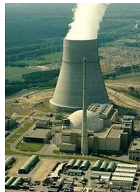
Las conversaciones nucleares, sin avance

tes del acuerdo nuclear de 2015 restaurar automáticamente las sanciones de la ONU contra Irán. ● (Eidalid López)