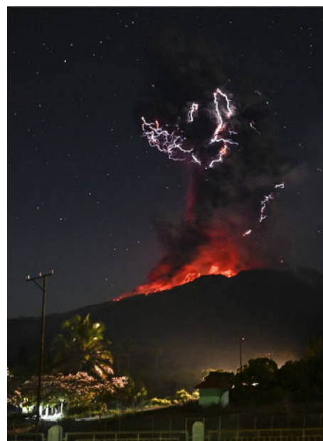
El volcán Lewotobi Laki-Laki.

monte, ante lo que piden a los residentes de zonas cercanas usar mascarilla para evitar los riesgos asociados a la ceniza volcánica. ● (Jesús Sánchez)