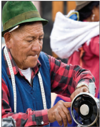
CONMEMORACIÓN. Llamam a sumarse a las actividades del Mes del Adulto Mayor.

► Actualmente, existen lugares donde este sector desempeña funciones específicas