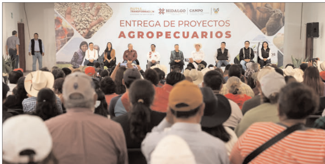
RESPALDO. El parque fotovoltaico de Dhamma Energy en Singuilucan y Epazoyucan, tiene una inversión superior a los 6 mil 460 millones de pesos.

Cabe subrayar que en el plantel Singuilucan del Colegio de Estudios Científicos y Tecnológicos del Estado de Hidalgo (CECYTEH), se ofrece la carrera de Fuentes Alternativas de Energía, permitiendo que los jóvenes en-