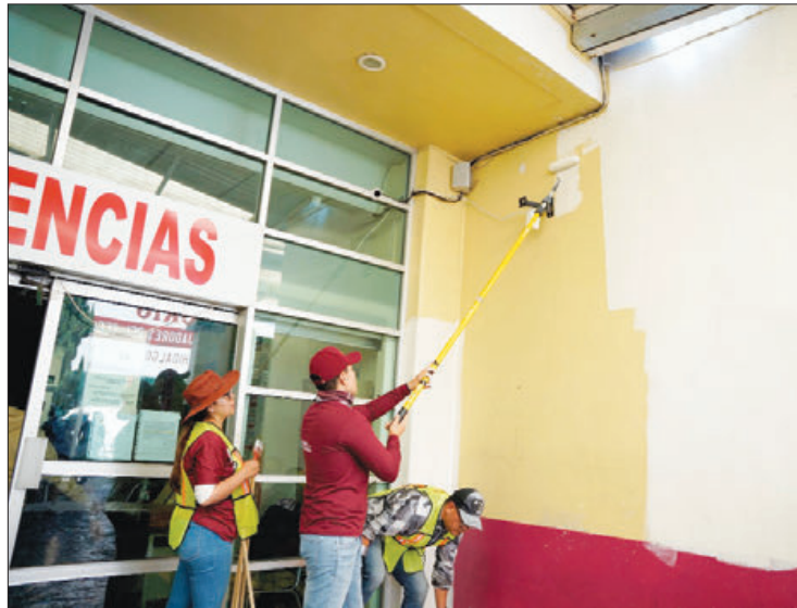
ACCIONES. Se otorgó una mejor imagen al acceso al área de urgencias del nosocomio, que ahora lucen con colores institucionales.

El presidente municipal de Pachuca explicó que las faenas del reciente sábado son especiales, ya que se sumaron a los esfuerzos del personal médico y administrativo del Hospital Ge-