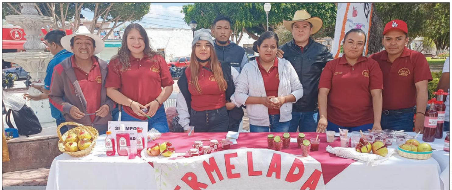
También conocida como Feria de la Granada que se llevará a cabo del 14 al 17 de agosto de este año.

Para esta edición se espera la asistencia de entre 25 mil a 30 mil visitantes en estos tres días de feria, con una derrama económica estimada en cinco millones de pesos aproximadamente, pues se espera superar la derrama de ediciones anteriores.