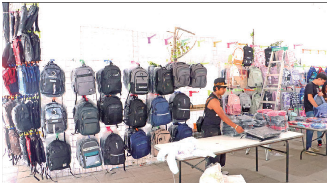
AGENDA. El evento se realiza de 9:00 de la mañana a 9:00 de la noche en la Plaza Independencia.

Comparar precios antes de hacer las compras de la lista de útiles escolares, ya que diversos establecimientos suelen incrementar los precios unos días previos al regreso a clases.