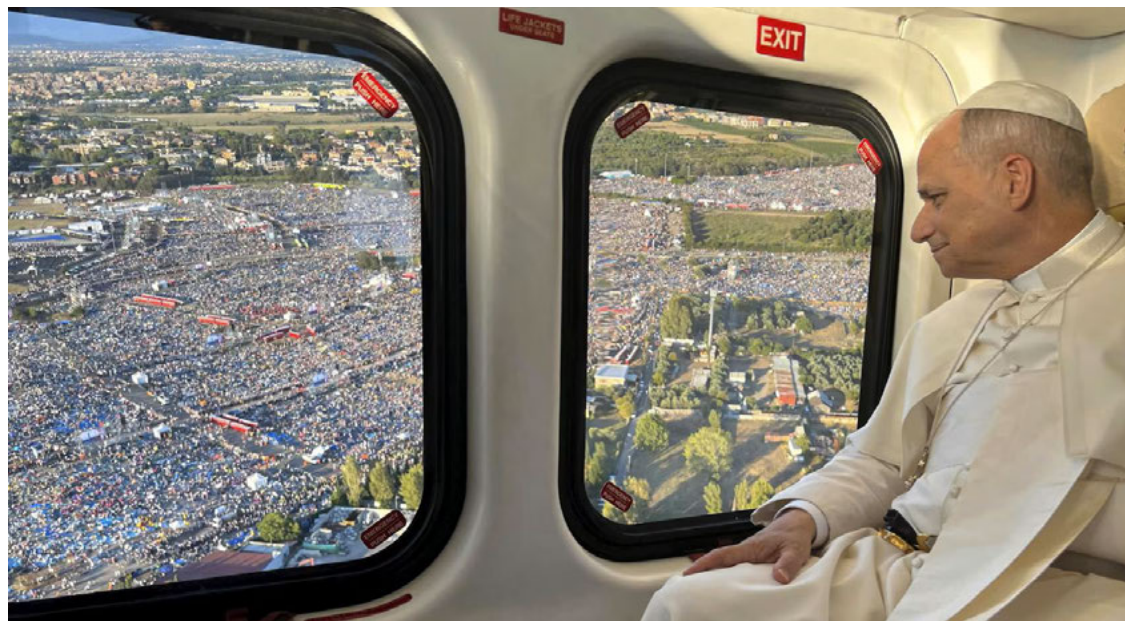
León XIV mira por la ventana de un avión el sitio donde posteriormente se reunió con miles de jóvenes.

“Nuestra comprensión de lo que es bueno, entonces, refleja cómo ha sido formada nuestra conciencia por las personas en nuestra vida; aquellas que fueron amables con nosotros, que nos escucharon con amor y que nos ayudaron. Esas personas ayudaron a educarte en la bondad y, por lo tanto, a formar tu conciencia para buscar el bien