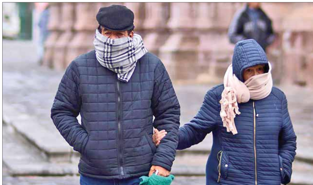
CONTRAS. Se esperan lluvias para todas las regiones de la demarcación, acentuará en la región Huasteca.

De acuerdo con el Instituto Nacional de Estadística y Geografía (INEGI) la tasa de desempleo mensual en Hidalgo es de 2.6 %, así se cerró durante noviembre del 2017. Esto representa un promedio de 27 mil personas que están desocupadas, si se compara con la población económicamente activa es de un millón 200 mil habitantes. (Alberto Quintana)