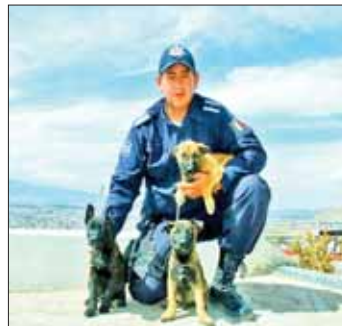
RUTA. Nacieron nuevos ejemplares; empezaría en marzo su adiestramiento.

Corresponderá a la Dirección de Prevención del Delito socializar entre diversos planteles educativos, la misión, visión y objetivos de la unidad canina y también se promoverá entre alumnos que puedan ponerles nombre a los cachorros. (Redacción)