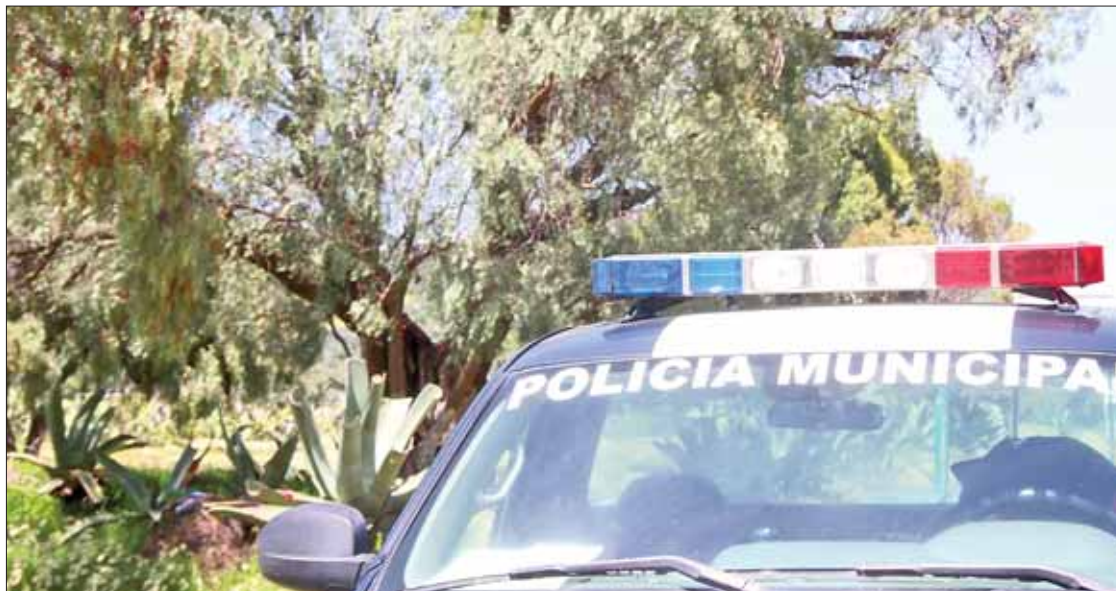
FORMAS. Inicialmente un grupo de personas, presuntamente relacionadas con el robo de combustible, sostuvo un enfrentamiento con los estatales.

Al sitio arribaron en apoyo agentes de investigación y policías de diferentes municipios, con lo que fueron asegurados 14 vehículos con diferentes característi-