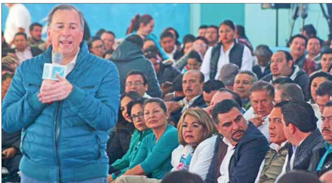
Durante segunda visita de José Antonio Meade Kuribreña a territorio hidalguense, en menos de 15 días, también convivió con militantes del Estado de México, Colima y Michoacán.