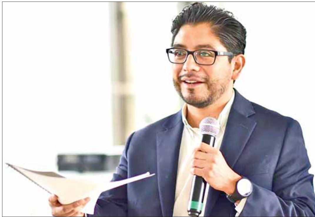
MUESTRAS. Son Pon tu negocio, yo te apoyo y Mi primer empleo, mi primer salario ejemplos del trabajo de la administración estatal focaliza para la juventud.

Desde el inicio de la administración estatal, señaló, se diseñó una estrategia de desarrollo económico cuyo fin último y principal es generar más y mejores empleos para los hidalguenses.