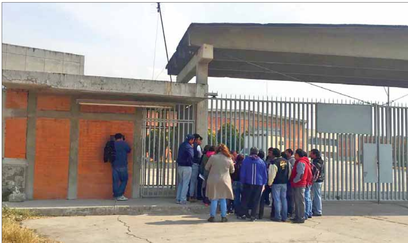
ANOTACIONES. Desde el 17 de enero ya no hay actividad dentro de la planta.

Desde el 17 de enero ya no hay actividad dentro de la planta.