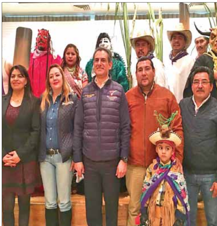
MARCOS. Desde Tlaxcala buscan generar intercambios culturales, atraer turismo y preservar tradiciones.

Igualmente se compartió que elaboran un torito artesanal, como símbolo de sus ancestros y que los disfrazados utilizan un