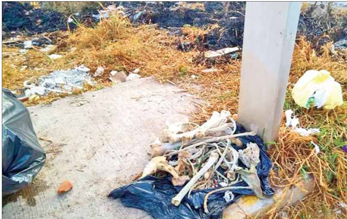
EL TELÉFONO. Ubicaron restos en un costal, en la esquina que forman las calles Hidalgo y Puebla.