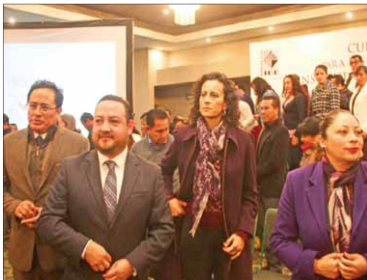
ELECCIÓN. Mencionó que existe disposición para sacar el proceso.

Oficial del Estado ya publicó el desglose del presupuesto y prevaleció la cifra autorizada