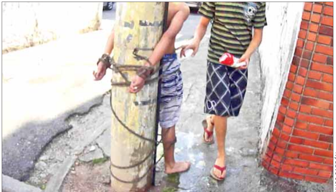
PUNTOS. En situaciones suscitadas en Actopan, Santiago de Anaya e Ixmiquilpan, los habitantes actuaron sin la intervención de las autoridades policiales municipales o estatales.

El caso más reciente ocurrió el 2 de enero, en Actopan. Un joven de 25 años, originario del El Boxtha, fue detenido por vecino de la Quinta Manzana mientras intentaba sustraer cobre de una casa, a diferencia de los casos anteriores aquí el detenido no fue golpeado pero sí entregado a las autoridades para que sea castigado.