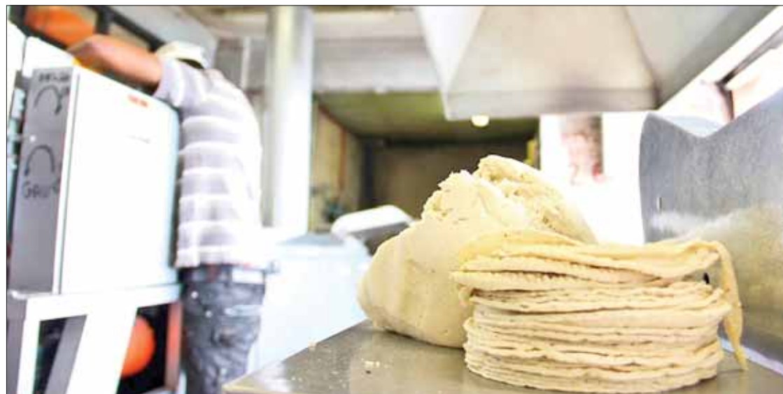
COMPARATIVO. Aclaró la Secretaría de Economía que el costo del maíz blanco incluso está más bajo que hace un año.