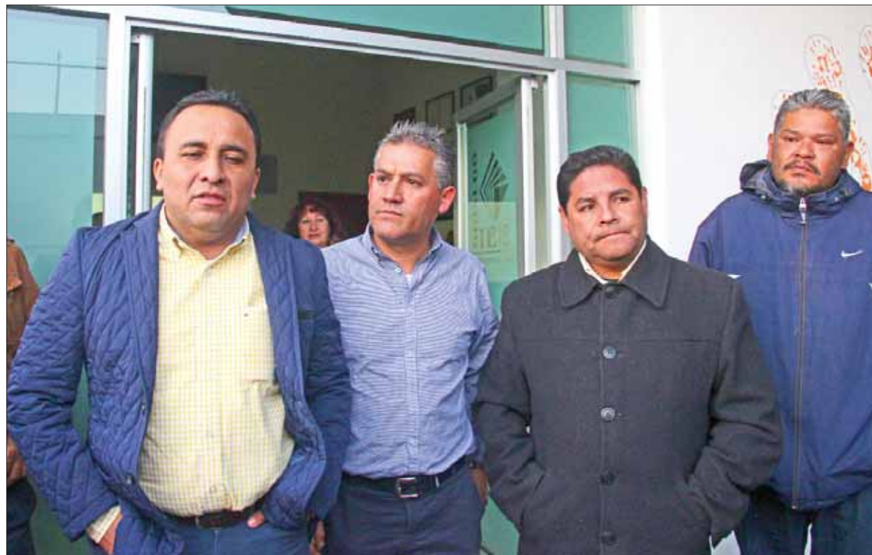
LEY. De acuerdo con las fechas los partidos en la entidad debían presentar sus propuestas para coaligarse.

Respecto al programa de becas para los egresados de las diversas carreras, el gobierno del estado habrá de entregar un total de mil durante este año, para las distintas empresas.