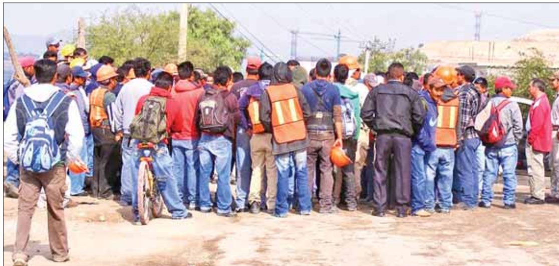
MIEDO. Como resultado del pleito los oficiales accionaron sus armas de cargo y dejaron heridos a dos individuos.

Cabe recordar que el pasado jueves elementos de seguridad estatal establecieron un puesto de vigilancia durante el transcurso del día, en el cual el conductor de un vehículo marca Jetta, con placas de circulación XWB-2989 se negó a la revisión e inició una agresión verbal.