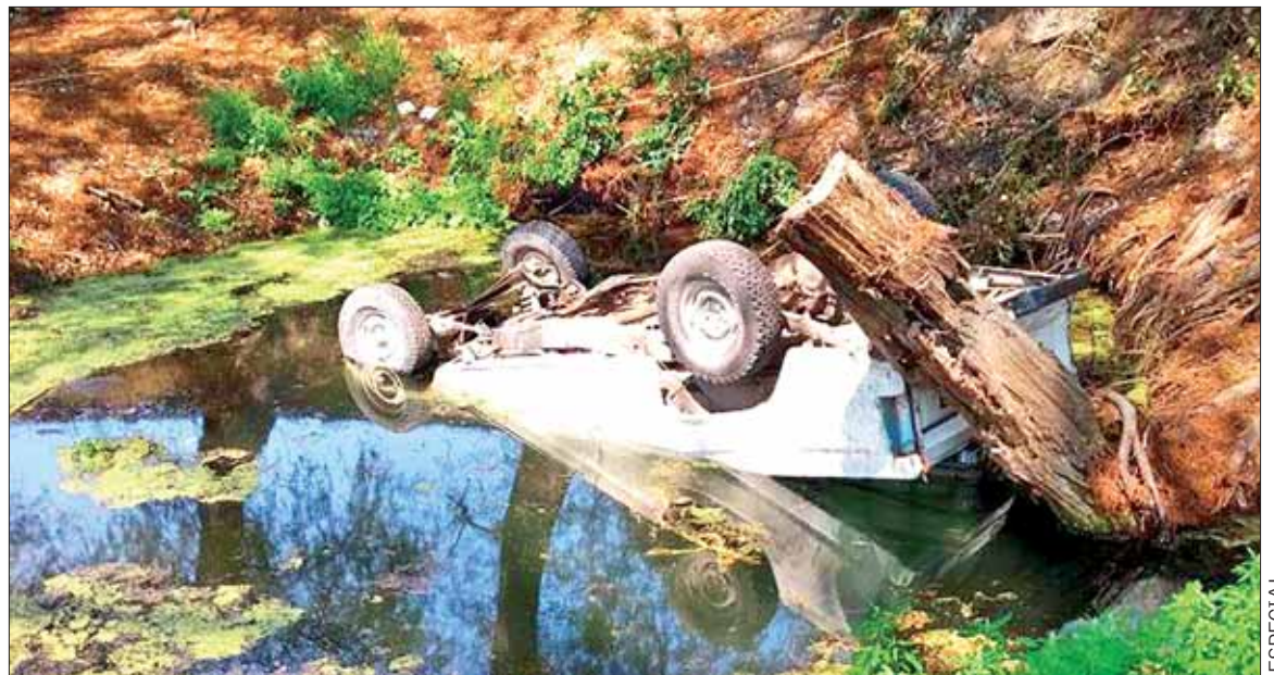
Localizó Policía Estatal una camioneta volcada en el ejido General Pedro María Anaya, en Tepetitlán, con dos contenedores para mil litros con combustible robado. Trascendió que población de la comunidad no dejó entrar al personal hasta que los tripulantes huyeron del lugar.

Desde el inicio de la actual administración se mantiene una apertura y puertas abiertas, para solucionar cualquier situación que afecte la estabilidad. .3