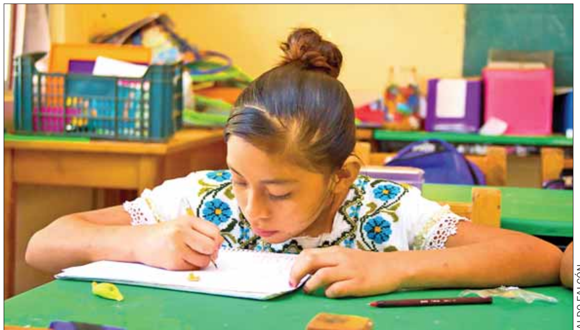
DIVERSIDAD. En el país se hablan entre 71 y 367 lenguas maternas, según la forma en que se las considere.

En México se hablan entre 71 y 367 lenguas maternas, según la forma en que se las considere. Son el español, 68 lenguas indígenas (o 364, si se consideran sus variantes) y dos lenguas de señas.