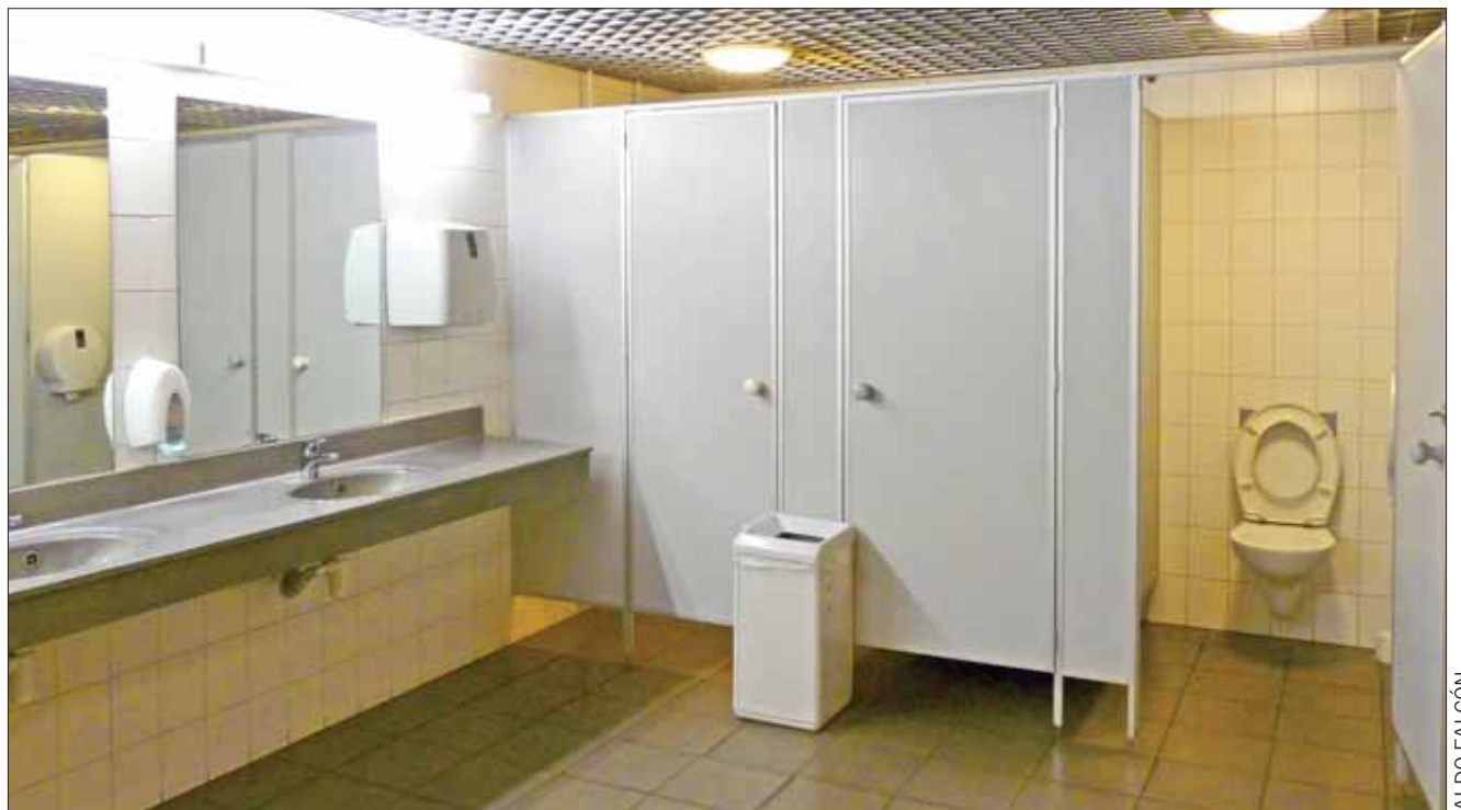
TERMINALES. Forman parte de los cambios establecidos en los ordenamientos federales para la mejora de los servicios.

La reforma fue enviada a la Cámara de Senadores, para las sanciones correspondientes y una que sea aprobada por ambas cámaras, entrará en vigor en un plazo de 90 días, en tanto el Ejecutivo federal adecúa las normas y disposiciones administrativas en la materia.