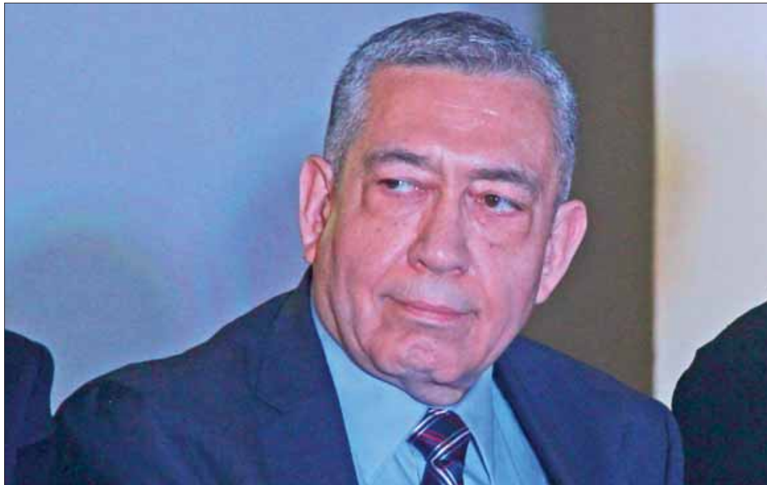
MENOS. Afirmó el secretario que los únicos que no asisten son los representantes del Movimiento Regeneración Nacional.

Desde el inicio de la actual administración se mantiene una apertura y puertas abiertas, para solucionar cualquier situación que afecte la estabilidad y paz social del estado.