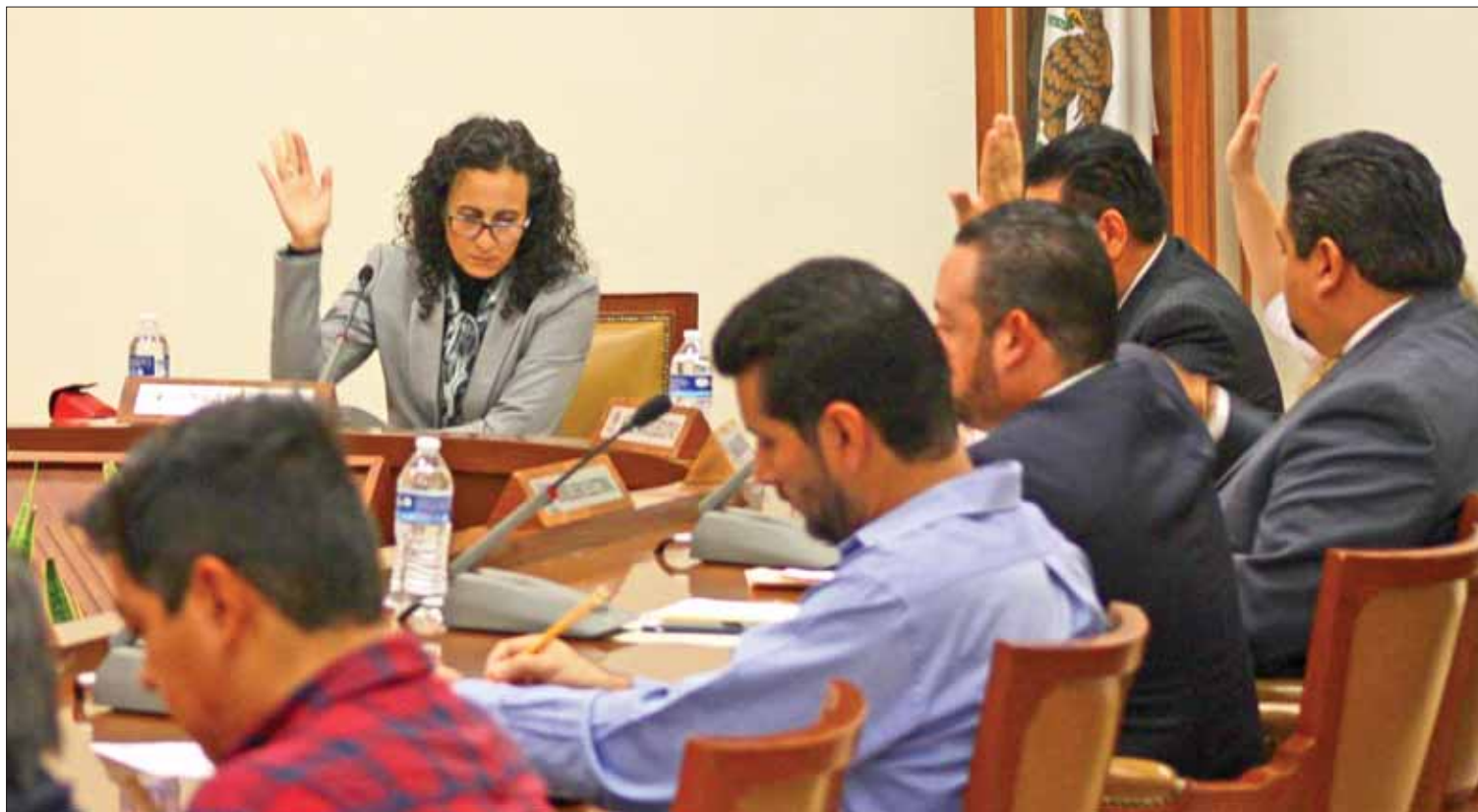
TIEMPOS. Sostuvo que debe darse celeridad a procesos pues meta es ofrecer tendencias a partir de las 11 de la noche del primero de julio.

Cartel de identificación de casilla, tarjetón vehicular, constancia de mayoría y validez de las tres elecciones, cartel para personas vulnerables para acceder a casillas, así como las plantillas braille para cada uno de los comicios, instructivo, constancia individual de recuento (de cada elección), entre otros. (Rosa Gabriela Porter)