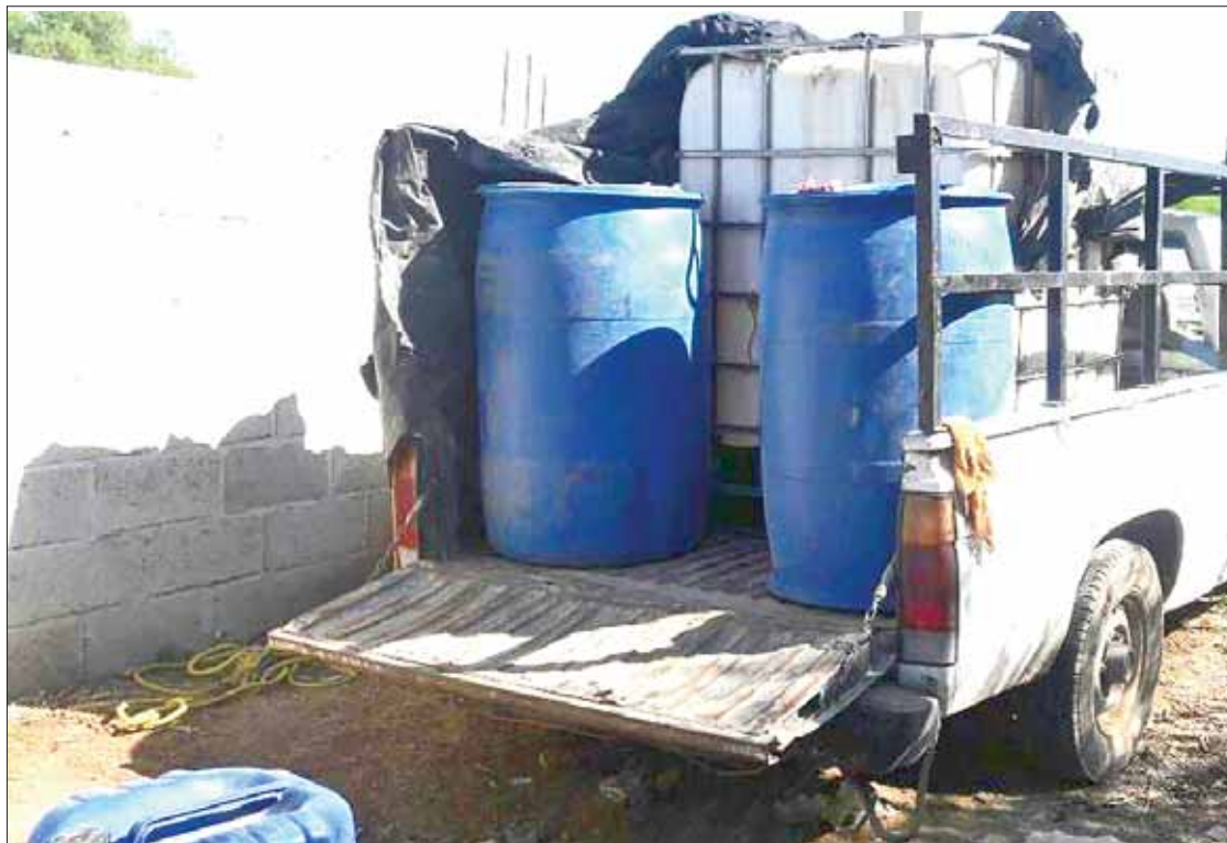
GOLPE. El denominado huachicol era almacenado en una bodega al interior de un terreno en Santiago Tlautla.

Junto con los miles de litros, de manera extraoficial se supo que también fueron recuperadas tres unidades motoras supuestamente utilizadas para trasiego ile-