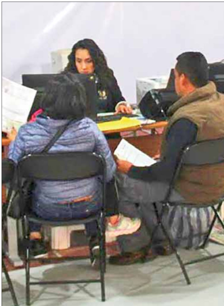
PLAZOS. Reiteró la dependencia el llamado para que los interesados acudan en tiempo y forma a centros de atención.

Actualmente se hace un despliegue de la campaña, para que los contribuyentes se acerquen a las unidades y sean informados de los requisitos que deben presentar para realizar este trámite.