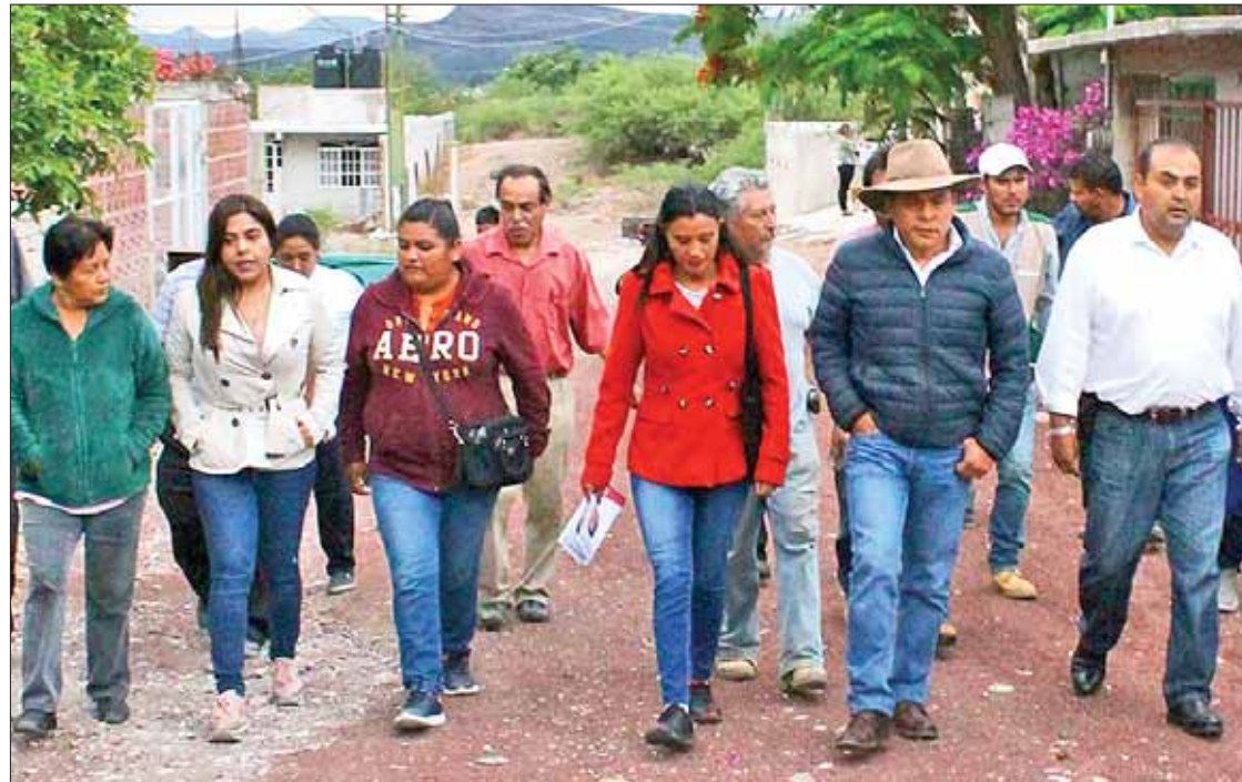
DÁZA. Si se puede, el lema de campaña del candidato a legislador.

El candidato a diputado local, quien también representa a los partidos: Verde Ecologista de México, Nueva Alianza y Encuentro Social, lamentó que el municipio no ha atendido de buena manera el tema de seguridad. (Redacción)