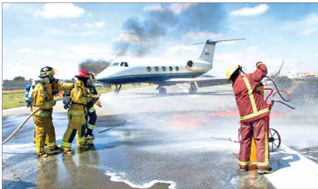
Desarrollaron autoridades de aeronáutica, en aeropuerto "Juan Guillermo Villaseca", simulacro de emergencia para aterrizaje forzoso de una avioneta, con participación de personal de cuerpos de emergencia y Ejército.

El Programa de Reemplacamiento Hidalgo 2018 concluirá en junio de este año, de acuerdo con el calendario programado por la Secretaría de Finanzas. - 3