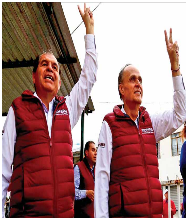
BASES. Que el gobierno se vuelva austero, porque el dinero que es de todos...

dedicado su vida a servir a los demás, lo que lo llevó a convertirse en médico, además de transmitir sus experiencias a los jóvenes para formarlos y servir a la sociedad. "He dirigido diversas instituciones de salud y educación, y la honestidad ha sido la regla de mi conducta".