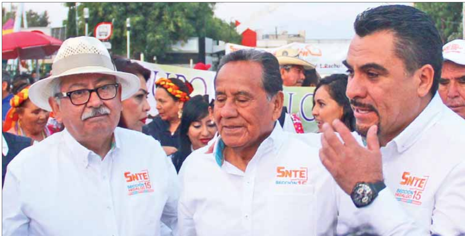
NEGOCIACIÓN. Afirmó Morales que gracias a las gestiones del gobierno estatal ya procedieron con 500 docentes, pero están pendientes otros más.

Dijeron estar convencidos que este proyecto se consolidará; no obstante, realizaron un nuevo llamado a las autoridades para que se agilice todo el proceso y se pueda contar con esta institución que se ha vuelto de primera necesidad, no sólo para Tunititlán, sino también para las comunidades vecinas.