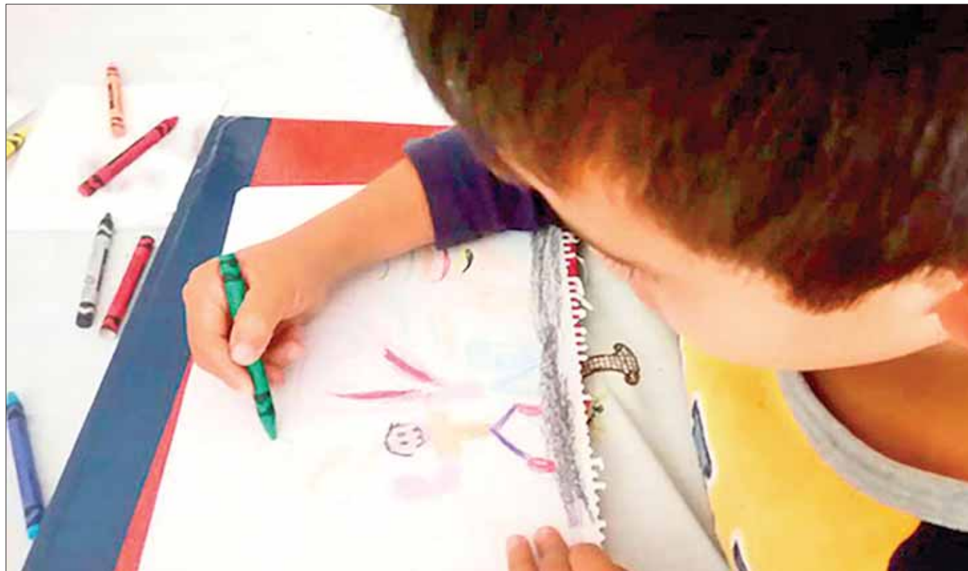
FORMATO. XXV Concurso Nacional de Dibujo y Pintura Infantil y Juvenil 2018, detalles SEPH

El dibujo podrá realizarse en cartulina o papel no mayor de 60 por 45 centímetros. La técnica es libre, podrán utilizar lápiz, grafito, cartón, pasteles, lápices de colores, técnicas a blanco y negro, sanguina, crayones, acuarelas, pinturas acrílicas, tintas y óleos. Serán rechazados los dibujos que hagan uso de personajes o imágenes de la televisión, del cine, historietas, revistas, logotipos, marcas, emblemas comerciales o políticos.