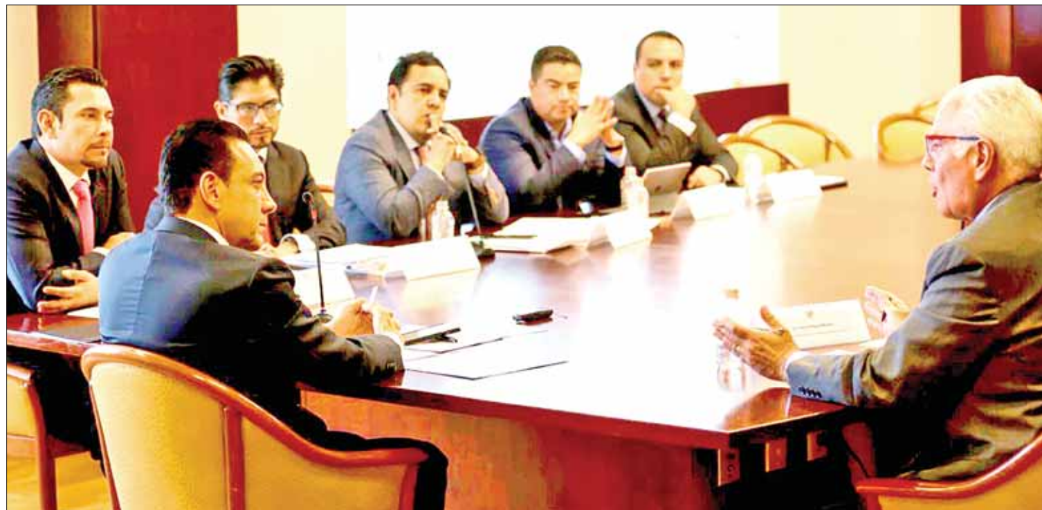
ESFUERZOS. Precisó el mandatario estatal que las acciones están enfocadas a la llegada de más inversiones y fuentes de empleo en la entidad.

Hasta el momento son los únicos recursos que interpusieron el PRI y PT contra los resultados de los comicios federales del 1 de julio, en contraste con Nueva Alianza (Panal), que presentó 13 juicios ante la Sala Toluca. (Rosa Gabriela Porter)