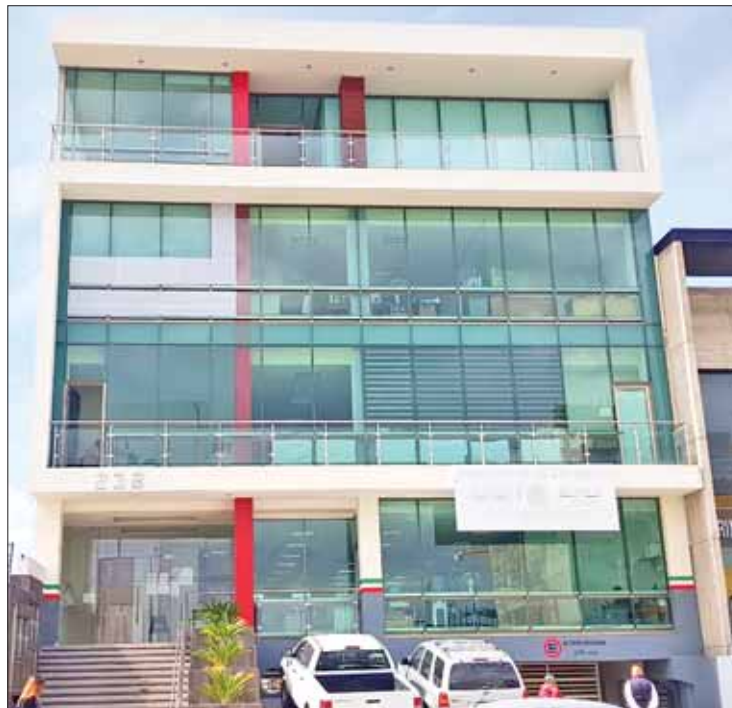
PROCESOS. Señaló el funcionario que para que esto suceda primero debe el Congreso de la Unión aprobar modificaciones a leyes.

Puntualizó que la nueva administración federal tiene que reformar la Ley Federal de Administración Pública, actualmente