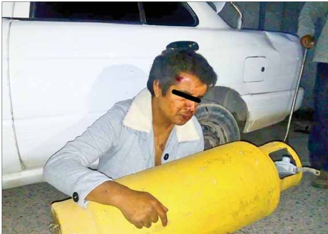
GRAVE. Sólo permitieron la salida de una persona debido a que resultó malherida por la tranquiiza y el impacto.

Debido a que uno de los retenidos estaba malherido por los golpes y el impacto del vehículo, elementos de la Cruz Roja lo trasladaron al Hospital Regional del Valle del Mezquital para