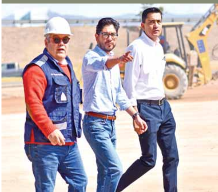
OPORTUNIDAD. Reiteró funcionario estatal la visión del gobernador Omar Fayad para atraer nuevos capitales al estado.

Aunque el Producto Interno Bruto (PIB) del estado disminuyó en 1.0% por ciento en todo 2017, dada la elevada obra pú-