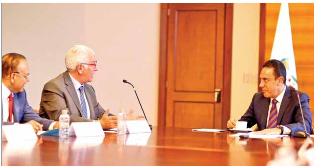
Encabezó gobernador Omar Fayad reunión con representantes de Canave, a fin de concretar estrategias de promoción al sector.