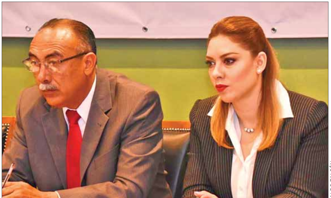
MÉRITOS. Durante cada tanda de preguntas indicaron sus propuestas para mejorar un área toral del gobierno estatal.

Luego de las entrevistas la comisión realizará el dictamen correspondiente para someterlo a votación del pleno, en donde el ganador debe obtener aval de las dos terceras partes.