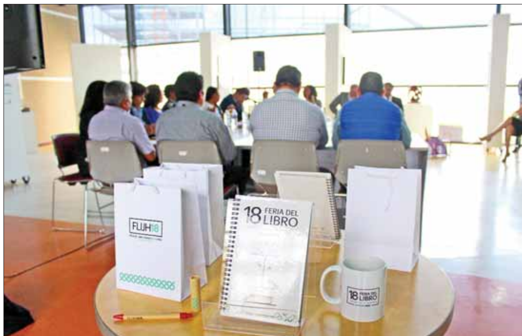
TRISTE. Hidalgo está abajo de la media nacional: coterráneos sólo leen 2.5 libros, al año

RITMO. Se contará con un programa con más de 400 actividades, entre las que destacan: talleres, conferencias, presen-