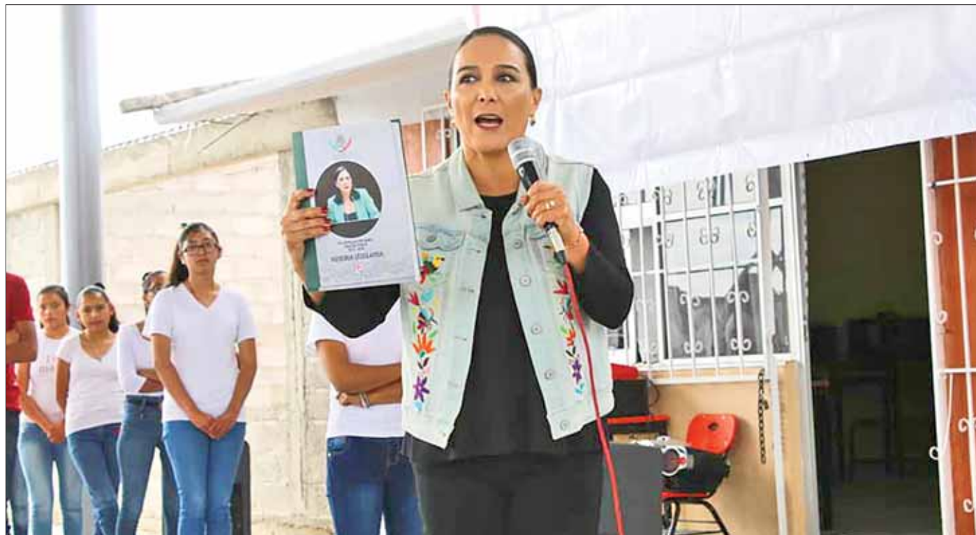
MENSAJES. Durante los tres años de gestión como diputada el reto siempre fue incrementar las acciones y presupuesto para el beneficio de las familias hidalguenses.

En el acto de inauguración compartió sus experiencias en San Lázaro "cada proyecto de presupuesto de egresos, mantenía una constante, la disminución de ingresos para el estado de Hidalgo, pero las y los diputados priistas de la entidad hicimos un bloque fuerte que nos permitió que en la aprobación siempre tuviéramos incrementos, aun cuando en 2017 y 2018 casi todas las entidades sufrieron recortes, eso nos permitió ser una bancada que logró presupuestos históricos que se traducen en infraestructura, educación, salud, empleo".