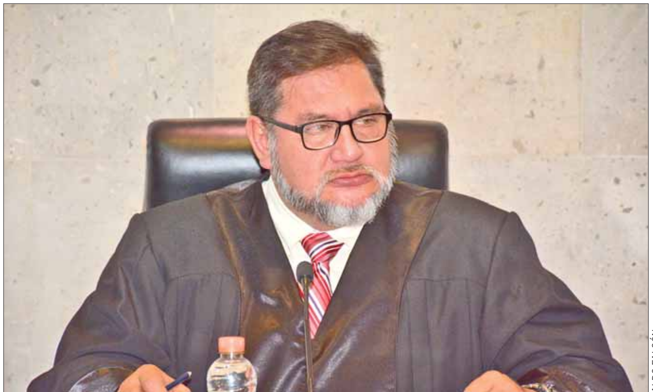
ESTATUS. Al concluir los comicios, normalmente comienza una discusión en el Poder Legislativo para optimizar las leyes en la materia.