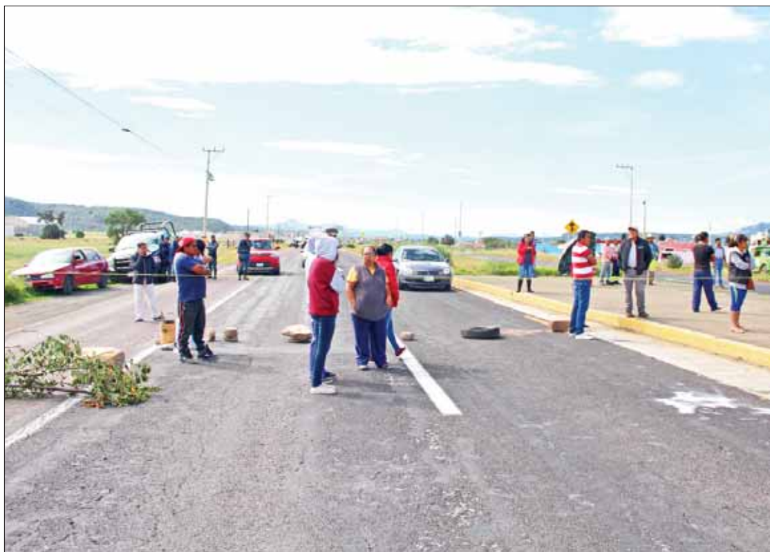
DESPUÉS. En atención a las demandas, personal de SOPOT instaló topes, como demandaban los colonos.

Los quejosos señalaron que desde hace varios meses se solicitó al ayuntamiento un puente