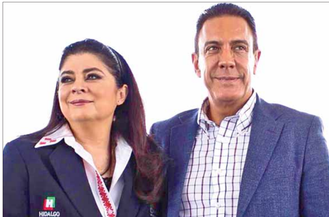
COMPROMISO. Acompañado por la presidenta del Patronato del Sistema DIFH, Victoria Ruffo, presentó estas acciones.

Las unidades entregadas beneficiarán a habitantes de Pachuca, Tula, Ixmiquilpan y Huejutla, que viven en las zonas de alta marginación y que por sus condiciones no