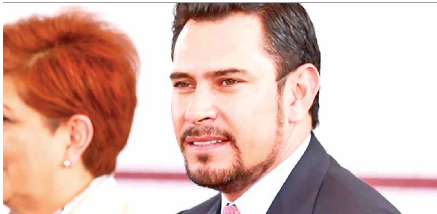
ÍNDICES. Recordó el funcionario que sólo uno de cada cinco dueños de unidades atiende a esta contribución, pero cifra debe crecer.

Hidalgo tuvo variación del presupuesto aprobado y el ejercido en 2017 de casi 30 por ciento, además junto con Michoacán y Oaxaca fueron los únicos estados donde no se pudo dar un seguimiento puntual al ejercicio del gasto. (Jocelyn Andrade)