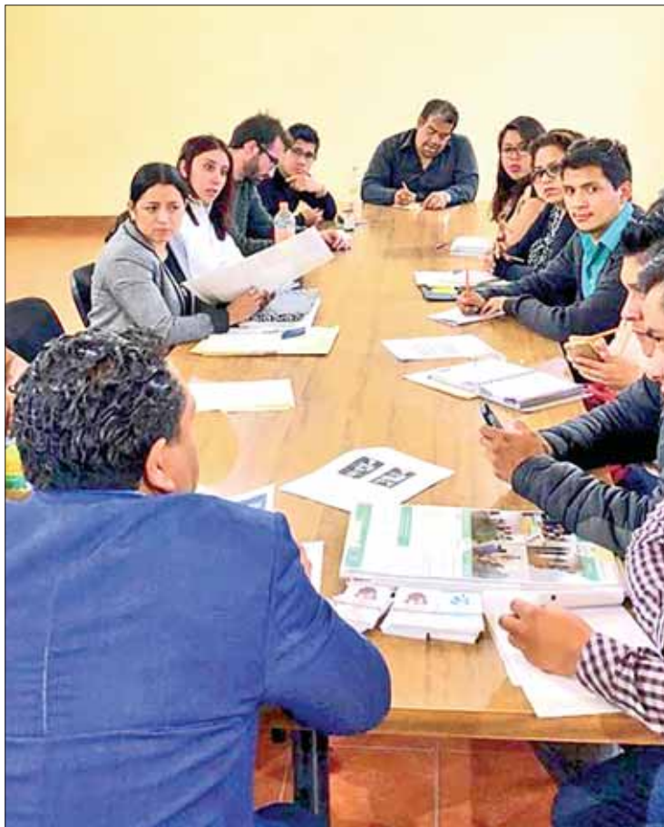
COBERTURA. Parte del compromiso de descentralizar la oferta cultural; beneficio en Ixmiquilpan y Zimapán.

A coordinadores regionales de los Centros Culturales de Zimapán e Ixmiquilpan se