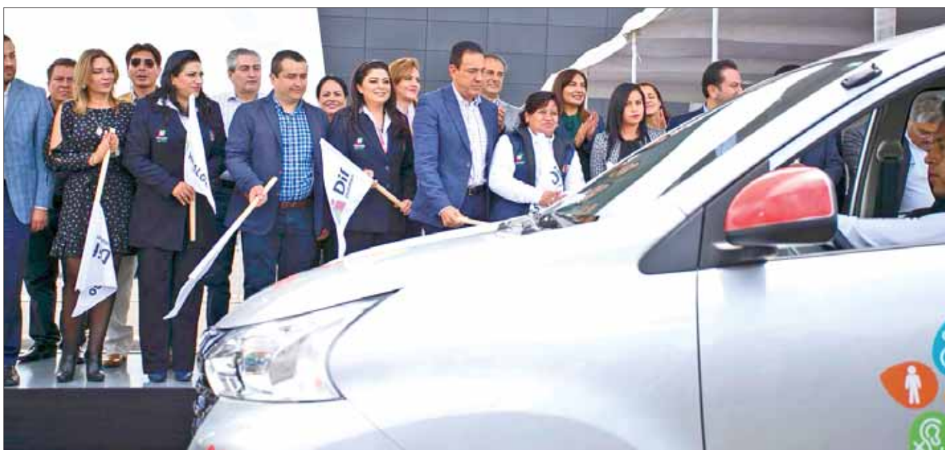
BANDERAZO. Alrededor de 11 millones de pesos fueron invertidos para transporte especial de personas con discapacidad, informó el gobernador Omar Fayad, acompañado por su esposa, Victoria Ruffo.

Destacó que como gobierno tiene la misión de impulsar el crecimiento económico, estabilidad social y la seguridad. .3