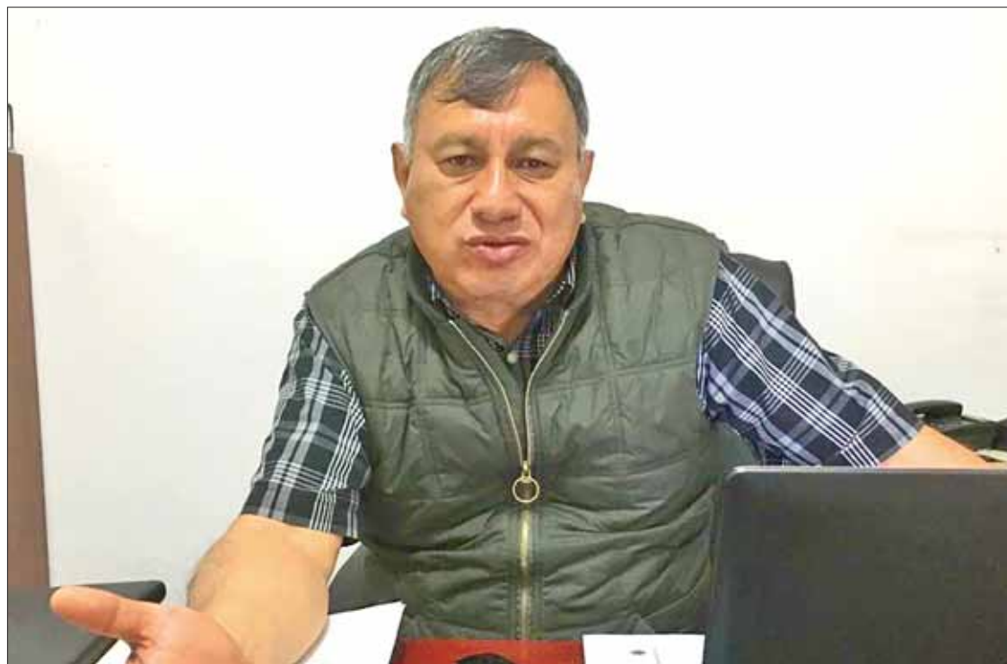
DISTRACCIÓN. Enfatizó que el pasado martes atendieron un supuesto caso, que al final resultó ser mentira, en escuela.

► Advirtió jefe policial de Tula sobre cuentas desde las cuales se difunde la información irresponsable