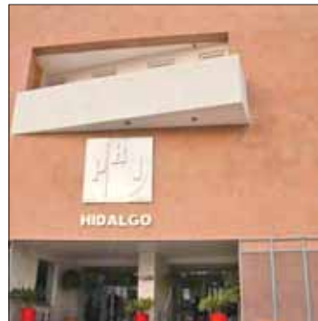
SALIDA. En el mismo periodo renunciaron personajes como Gerardo Sosa y Canek Vázquez.