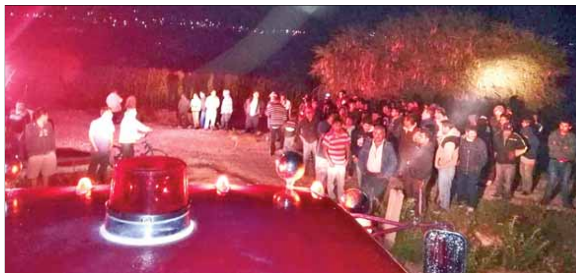
NECIOS. Confirmaron las autoridades que algunas personas resultaron heridas al no acatar medidas de seguridad.

Cabe mencionar que el curso tuvo como propósito reforzar los conocimientos que tienen los oficiales de cada municipio a fin de desempeñar mejor su trabajo. (Hugo Cardón)