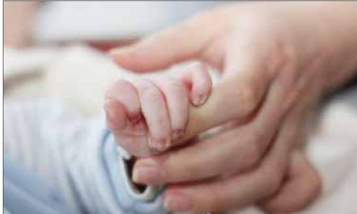
FORTALEZAS. Con estrategias buscan acompañar a la mujer embarazada antes, durante y después del proceso.

Recientemente, en Ixmiquilpan, Escamilla Acosta se dirigió al personal que atiende a usuarios de los Servicios de Salud en aquella región.