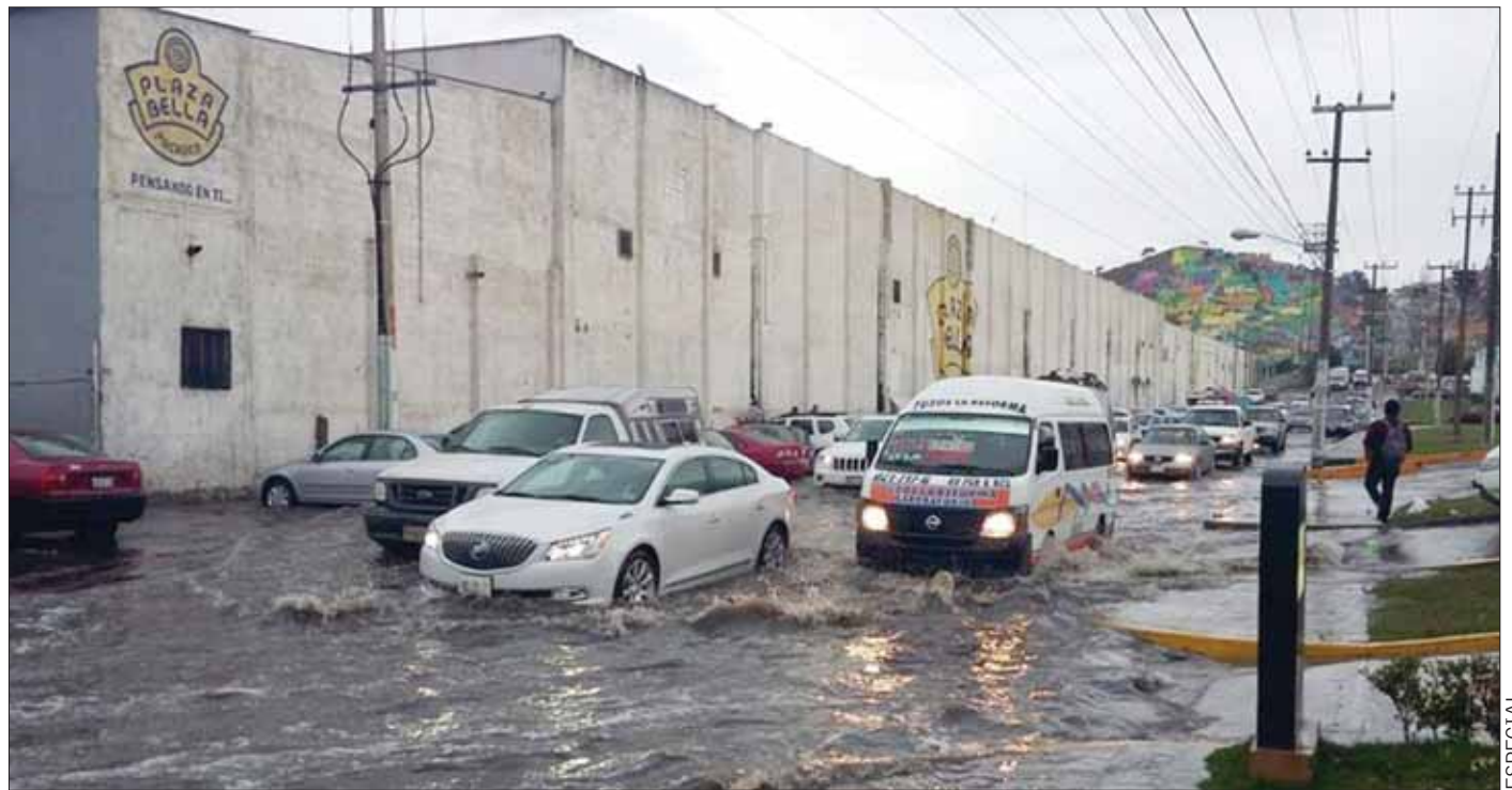
DINÁMICA. Suman a las brigadas de limpieza de alcantarillas para que así la basura no sea uno de los factores de anegaciones.

Por último, dijeron que se hace el exhorto a la sociedad a no tirar basura y contribuir a crear conciencia entre los habitantes es factor fundamental para contar con colonias libres de inundaciones.