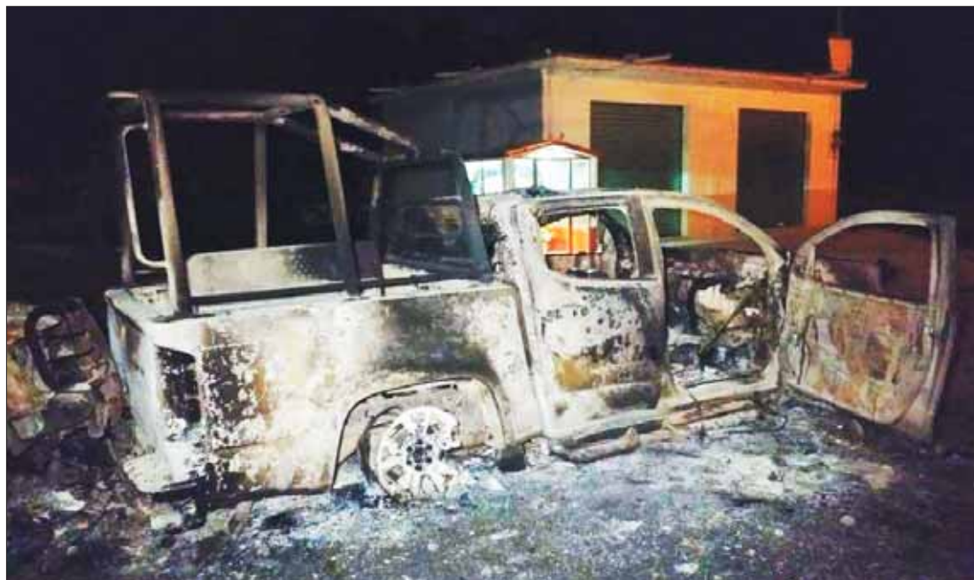
Al menos tres patrullas y una ambulancia fueron quemadas, en un enfrentamiento entre pobladores de la comunidad de Santa María Quelites y elementos de la policía municipal de Tepeji del Río, después de que presuntamente los elementos mataran a un civil.

Fue el pasado jueves cuando los representantes de Morena solicitaron un nuevo receso de la sesión constitutiva, pues no están de acuerdo en presidir hasta el tercer año la Junta de Gobierno, además pretenden que en el acuerdo de la Junta de Gobierno se valide el voto ponderado, es decir que cada coordinador de bancada lleve a la junta el parecer de sus representados, así el partido obradorista tendría 17 sufragios a favor, más uno que le sumaría el Partido Nueva Alianza. 3