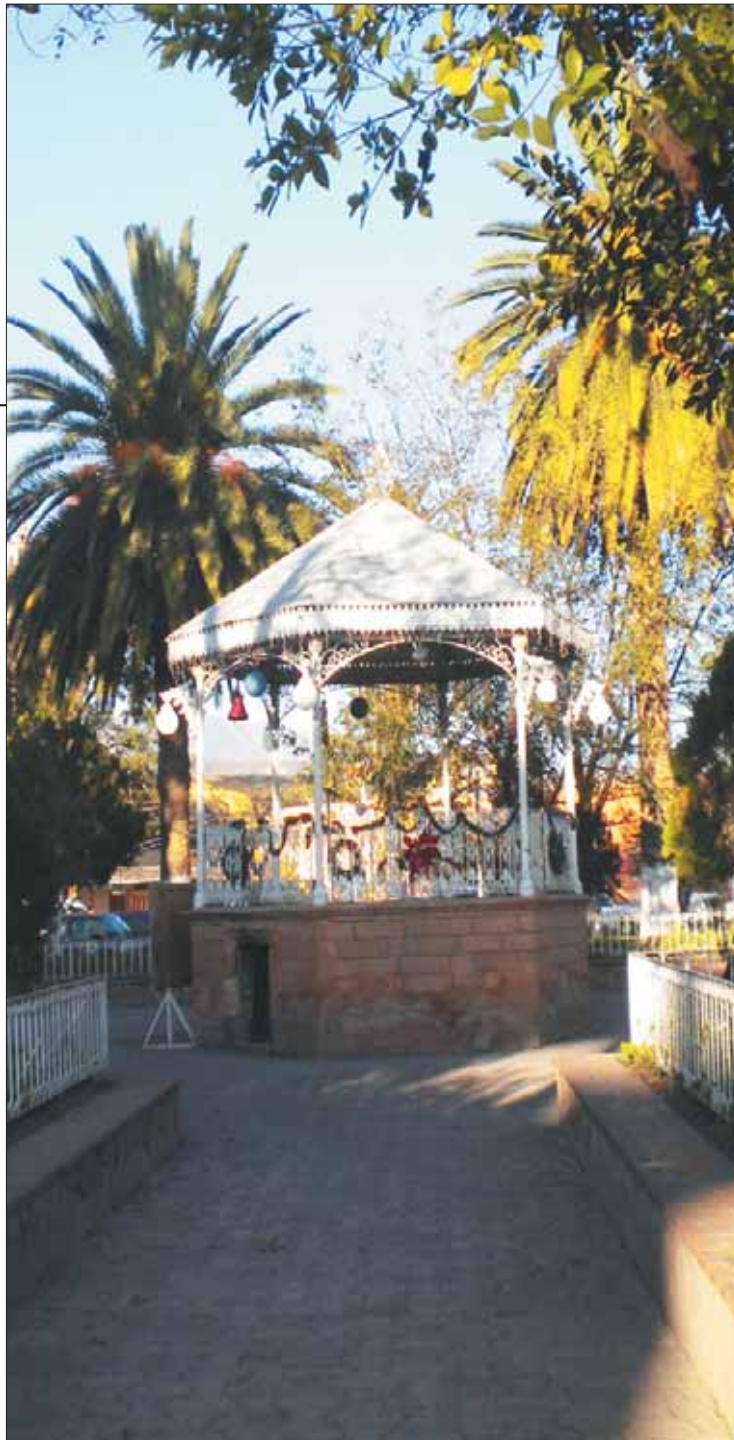
ESTRAGOS. Afectaciones directas para la gente de El Bonthí y La Rinconada.

ZONA Esta semana, el secretario del Medio Ambiente, encabezó una gira de trabajo