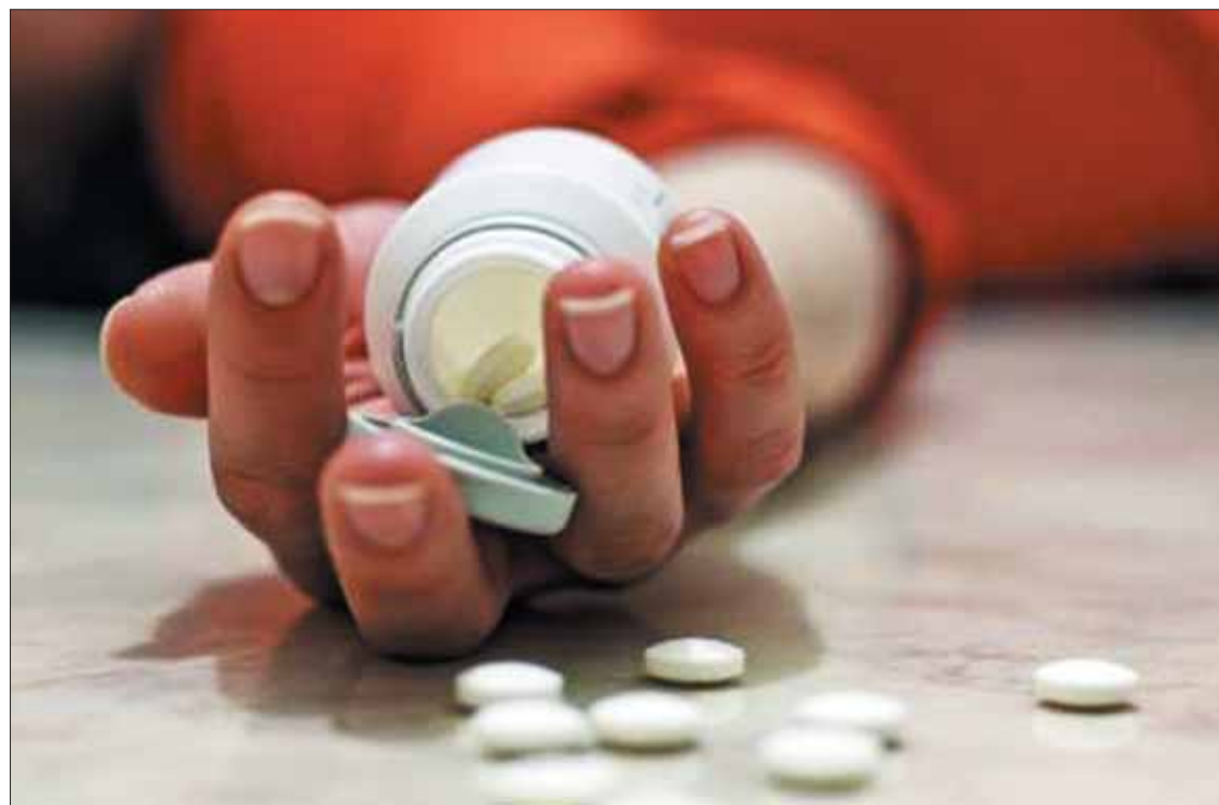
ASPECTOS. Lesiones autoinfligidas intencionalmente, un problema grave de salud; efectos en las familias, amigos y sociedad son complejos y perduran aún mucho tiempo después de la pérdida.

En México, en 2016, ocurrieron 6 mil 291 muertes por lesiones autoinfligidas intencional-