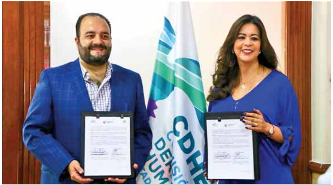
DIRECTRICES. Subrayó secretaria estrategias y políticas en la materia, desde el gobierno que encabeza Fayad.