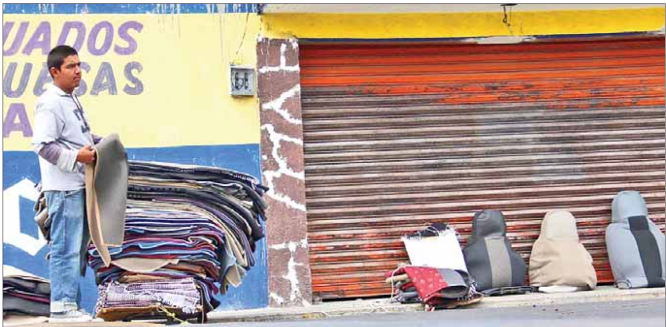
EJEMPLO. Recordaron que hace poco una persona perdió la vida pues están muy cerca de la carretera.

Reconocieron que las dificultades económicas por las que atraviesan decenas de familias orillan a las personas a ejercer el comercio formal; no obstante, debe existir conciencia para ejercerlo en mejores condiciones.