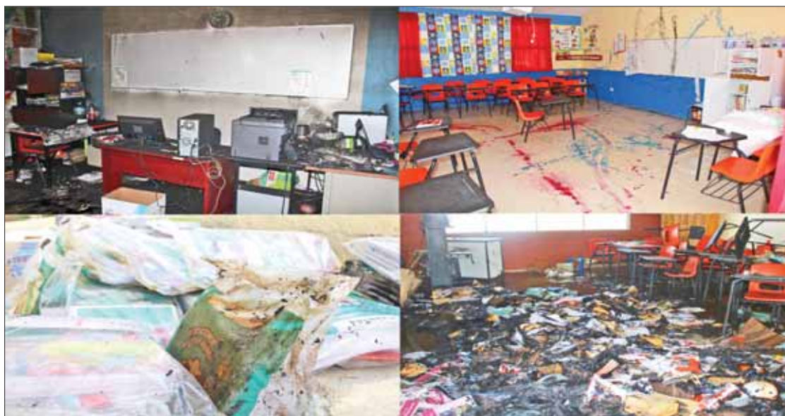
SALDOS. Hurtaron amantes de lo ajeno equipos de cómputo, pantallas, proyectores y hasta útiles escolares.

Personal de Bomberos Municipal logró sofocar la conflagración, pero se consumieron varios útiles escolares, así como equipo de cómputo, el cual era usado por la administración del plantel.