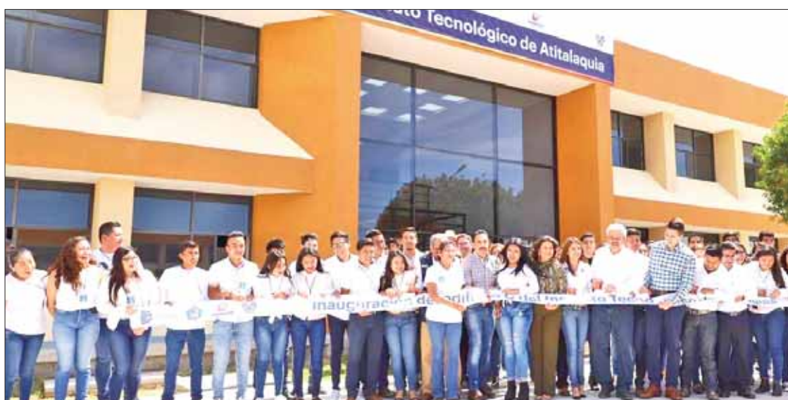
Reiteró Omar Fayad, desde Atitalaquia, su compromiso con el sector educativo, prioridad de su administración.

Anunció que invertirá adicionalmente 2.5 millones de pesos para realizar el cercado perimetral del tecnológico y en coordinación con el ayuntamiento se construirá un estacionamiento. 3