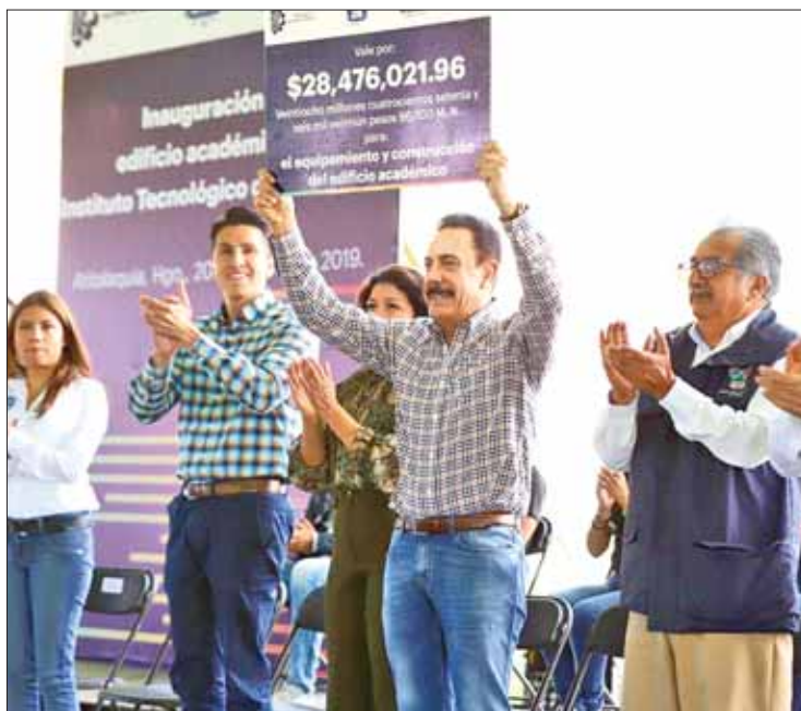
COMPLEMENTO. Anunció una inversión adicional para el estacionamiento.

Recordó que el gobierno estatal vincula a jóvenes profesionistas egresados con empresas, a