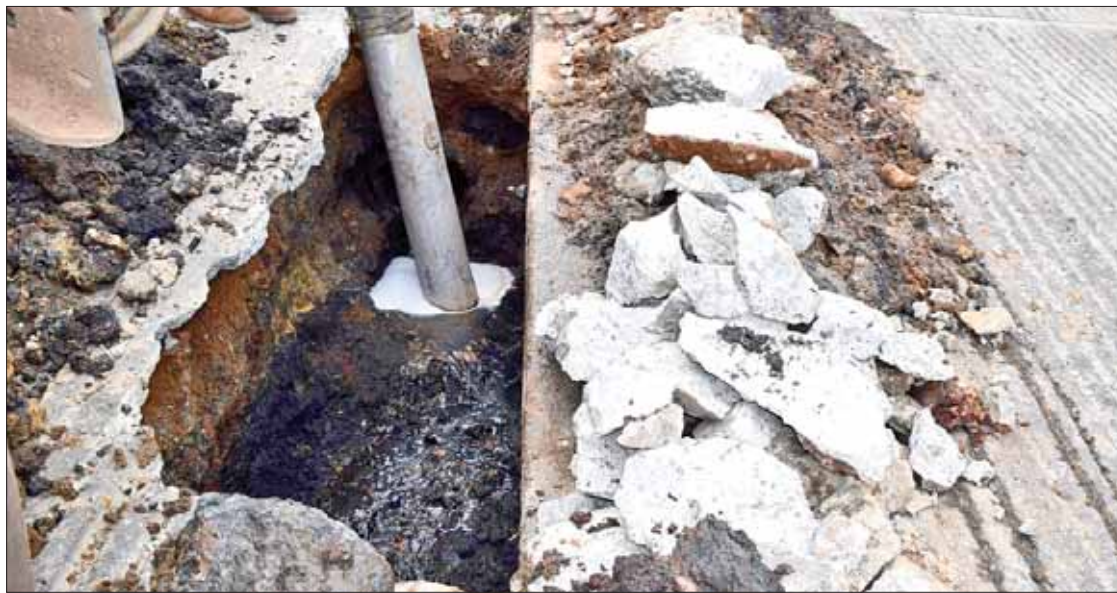
RECOMENDACIÓN. Exhortó a evitar prácticas como desechar restos de animales, pues obstruyen las tuberías.

La jornada comenzó el 13 de agosto en Santa Teresa y también incluye otros puntos como Santa Ana Hueytlan (27 y 29 de agosto), Santa María Asunción (3 y 5 de septiembre), así como Polígono El Paraíso (10 y 12 de septiembre). (Redacción)