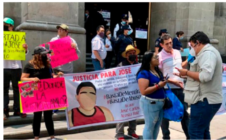
Familiares y vecinos de Horacio y José pretendían manifestarse frente al Antigua Palacio del Ayuntamiento, pero fueron engañados por personal de "apoyo ciudadano" que los mandó a la SCJN.

Sin embargo, el contagio por el virus SARS-CoVid-19 impidió que el personal penitenciario pudiera trasladar al Lenin ante el juzgado, por lo que se suspendieron los plazos constitucionales. (Eloísa Domínguez)