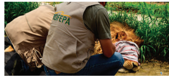
Trasladado de un león al Zoológico de Chapultepec.

Se informó que los primeros 4 leones y 14 primates ya fueron trasladados al Zoológico de Chapultepec. (Jennifer Garlem)