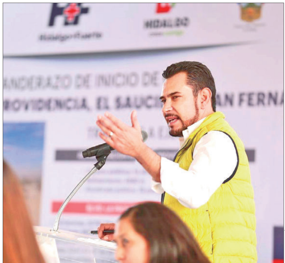
RESPALDO. Los habitantes de su municipio mantienen el compromiso de sus autoridades de trabajar de manera intensa.

Concluyó que los habitantes de su municipio mantienen el compromiso de sus autoridades de trabajar de manera intensa para que prevalezcan los buenos resultados.