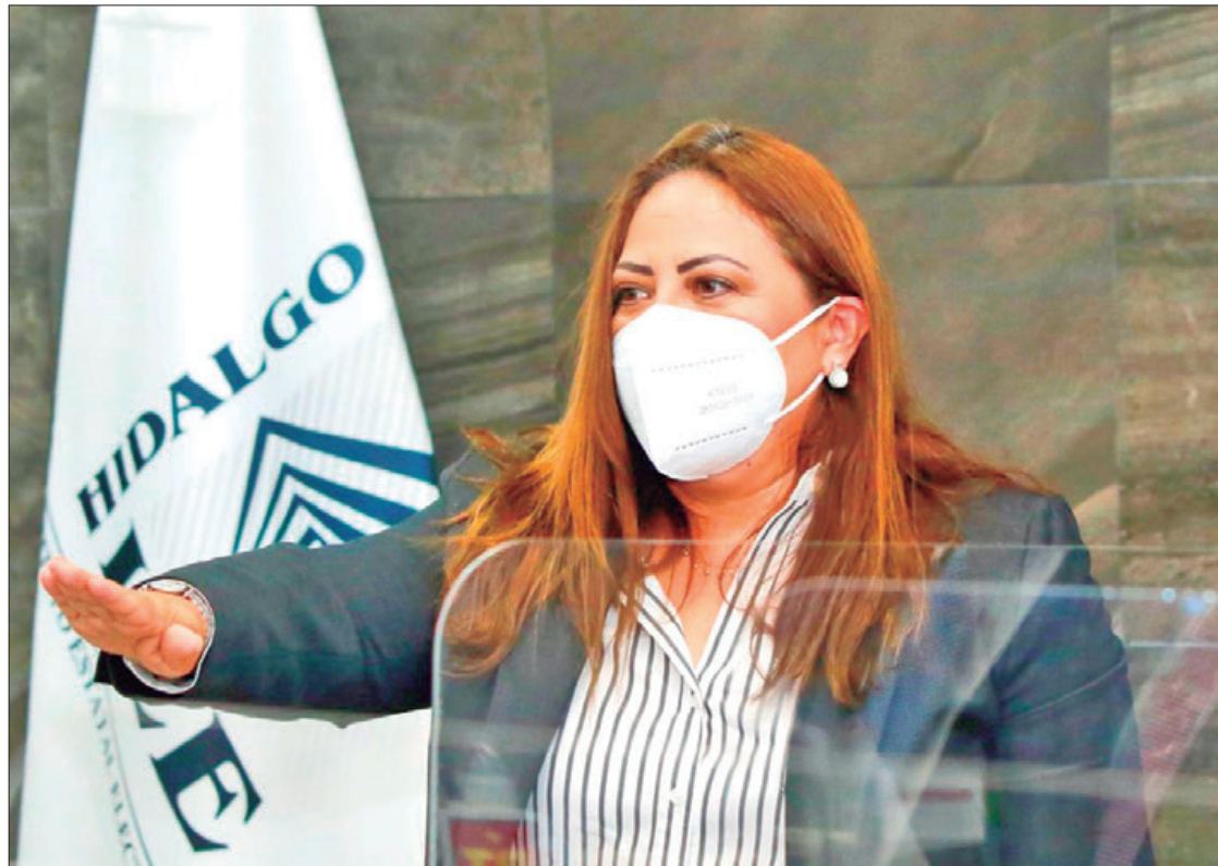
ANÁLISIS. En estos días continúa el reconocimiento de la estructura, plantilla laboral, verificación de normativas internas, entre otras.

"Lo que hemos hecho es revisar las actividades que se vienen realizando en el IEEH, hemos tenido la oportunidad de revisar alguna normativa interna que re-