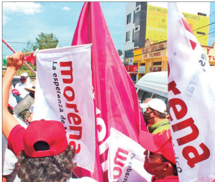
RECURSOS. Ante Sala Superior del TEPJF contabilizan, por ahora, dos juicios ciudadanos.

A su juicio, la convocatoria "vulnera e impide el adecuado desarrollo de las funciones del Comité Ejecutivo Estatal de Morena en Hidalgo, en relación al artículo 32 primer párrafo de los estatutos"; sin embargo, la CNHJ determinó como improcedente el caso porque lo presentaron de manera extemporánea, es decir