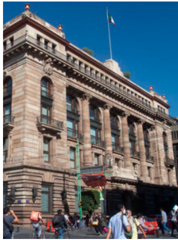
Banco de México.

“La mayoría consideró mayores retos para la conducción de política monetaria ante el apretamiento de las condiciones financieras globales, el entorno de acentuada incerti-