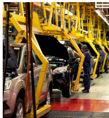
En junio se fabricaron 285,318 autos en México.

En el acumulado enero-junio, se fabricaron 1 millón 661,