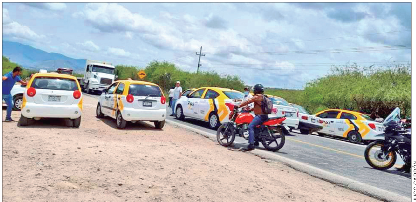
EXPRESIONES. Aproximadamente 20 taxistas del sitio de Nicolás Flores se manifestaron nuevamente de manera pacíficamente frente a la presidencia municipal.

Hasta antes del cierre de esta edición, los manifestantes no habían tenido ningún acercamiento con las autoridades, por lo que habían advertido que se quedarían en el lugar hasta tener atención.