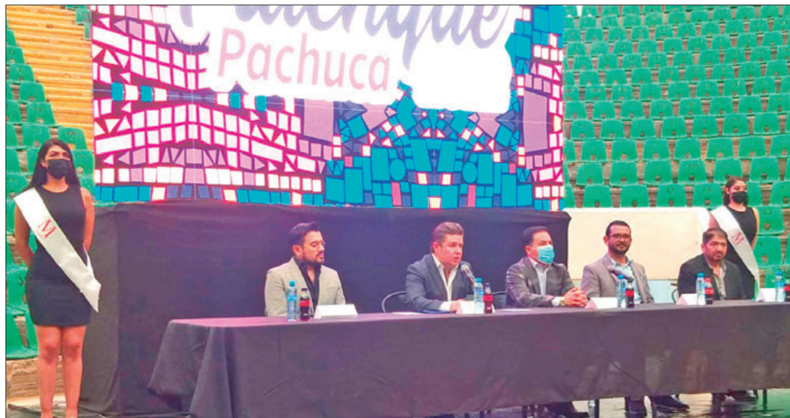
ESPECTATIVA. Las actividades generan una derrama económica que superan los 200 millones de pesos y cerca de un millón de visitantes.

El director general de la feria, puntualizó que la presentación