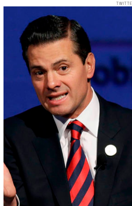
Enrique Peña Nieto responde vía twitter.

El exmandatario se dijo confiado en las instituciones mexicanas de justicia