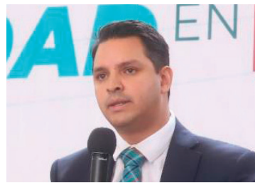
Aristides Rodrigo Guerrero, comisionado presidente del InfoCDMX.

El comisionado presidente del Instituto de Transparencia, Acceso a la Información Pública, Protección de Datos Personales y Rendición de Cuentas de la Ciudad de México (InfoCDMX), Aristides Rodrigo Guerrero García, se pronunció este miércoles respecto al “Reporte Especial N°1/2022: Apertura en la L12 del Metro. La ruta del interés público a un año” -elaborado por el