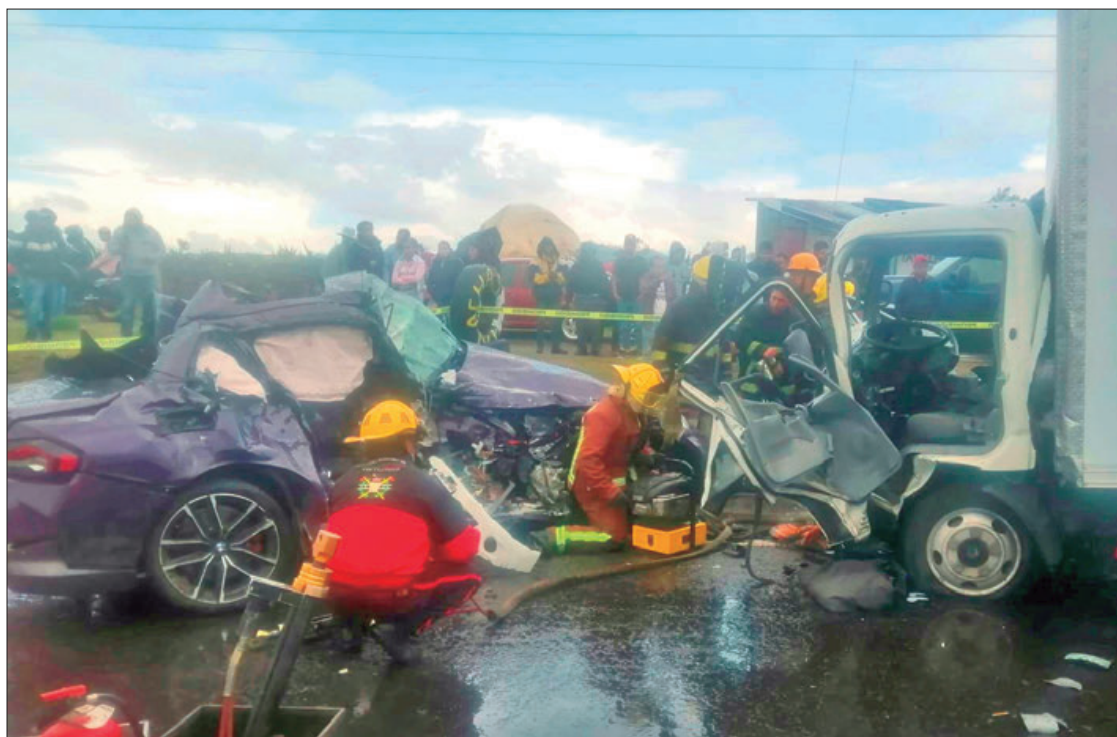
La tarde de este jueves dos personas perdieron la vida en un accidente vial que se registró sobre la carretera México-Tuxpan, a la altura de Singuilucan, donde automóvil compacto y un camión colisionaron en el kilómetro 69. Los ocupantes del vehículo deportivo quedaron prensados por lo que personal de bomberos de Tulancingo los liberaron con equipo hidráulico; uno de ellos quedó sin vida en el lugar y su acompañante fue trasladado al hospital para su atención médica. Asimismo, se informó que en el lugar también perdió la vida el conductor del camión, después del impacto.