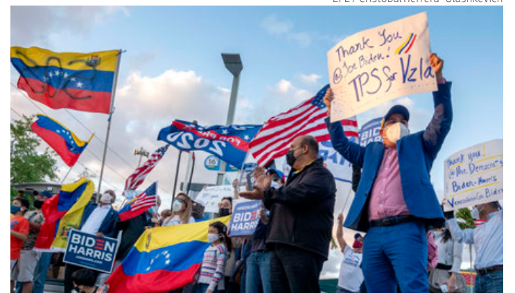
Activistas defienden el TPS para venezolanos, en 2020.