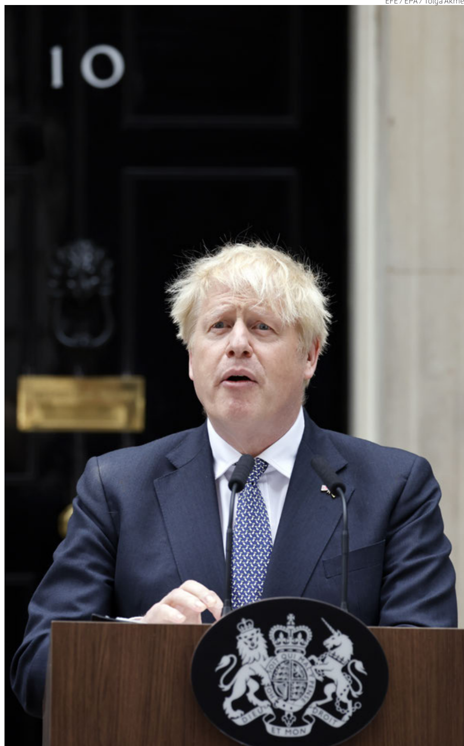
Boris Johnson, ayer, frente a la residencia oficial en el número 10 de Downing Street, Londres, al anunciar su renuncia.

Fiel a su estilo, subrayó que se marcha porque se vio obligado por su propio equipo de gobierno, y no por la convicción per-