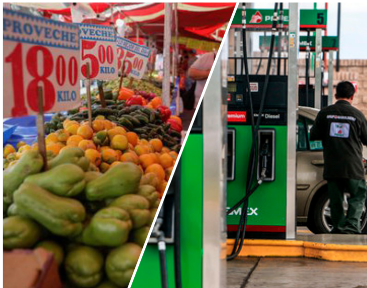
El incremento en los precios agropecuarios y de combustibles detonaron el incremento de la inflación en junio.

Tan sólo en el mismo periodo de 2021, las variaciones correspondientes de la canasta de consumo mínimo fueron de 0.66 y 7.02 por ciento, en ese orden.