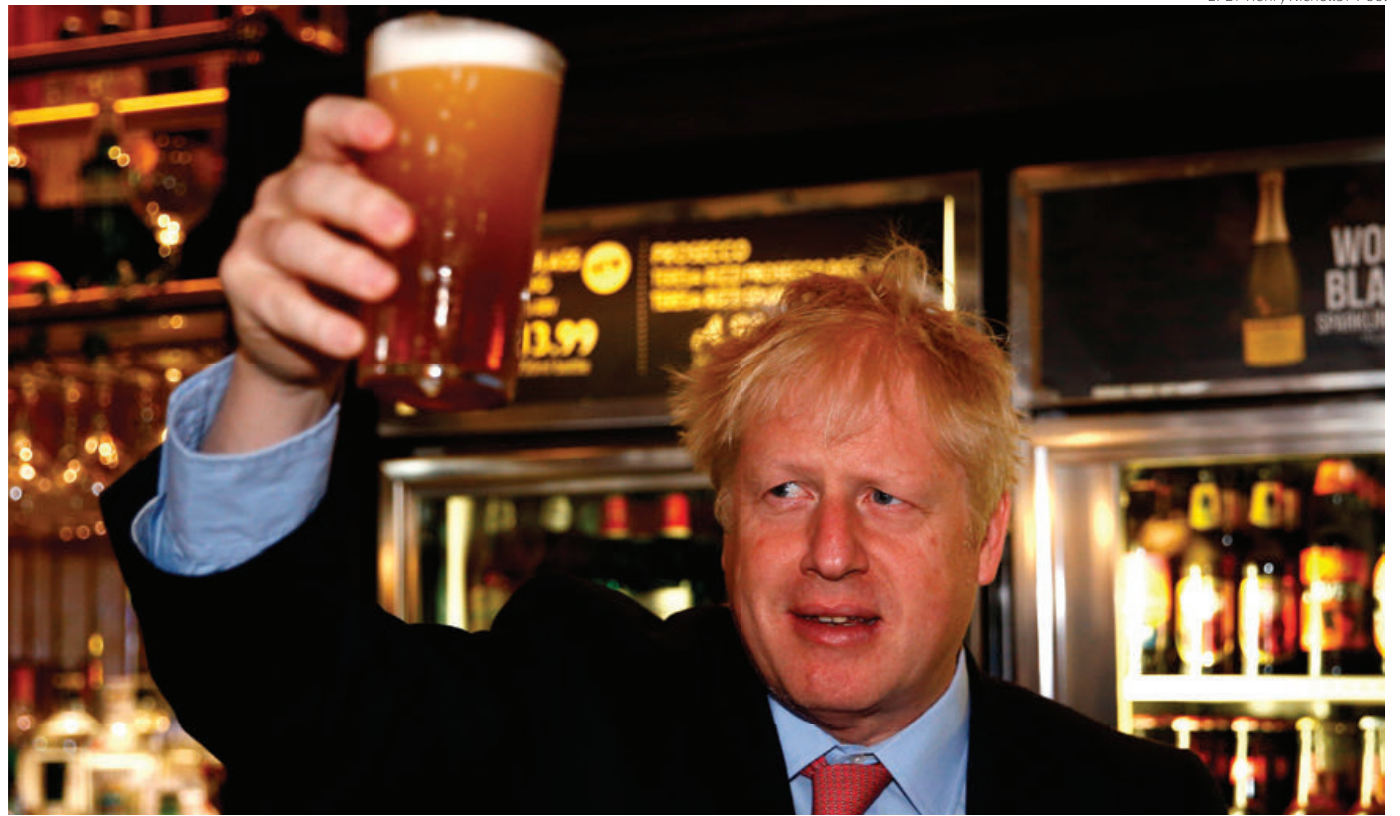
Boris Johnson brinda con cerveza, en una imagen de archivo.

Si el fantasma del conflicto en Irlanda del Norte está reviviendo peligrosamente; si los especialistas y el personal de enfermería europeos han abandonado los hospitales británicos; si los empresarios no saben dónde vender su mercancía, cuando antes el mercado natural era el continente europeo; si falta mano de obra, por veto a la entrada de inmigrantes, y si sus universidades ya no acogen a mentes brillantes de todo el mundo, como ocurría hasta hace poco, es por culpa de su empeño