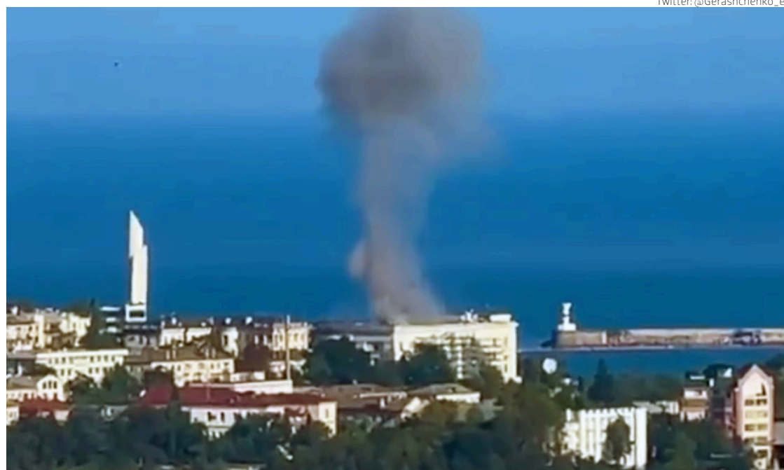
Captura de pantalla del humo resultante del dron ucraniano estrellado en la base del Estado Mayor de la flota rusa en el Mar Negro, ayer.

En su último informe, el estadounidense Instituto de Estudio de la Guerra (ISW) apuntó que los recientes ataques ucranianos contra las infraestructuras militares y de transporte en la parte de región de Jersón con-