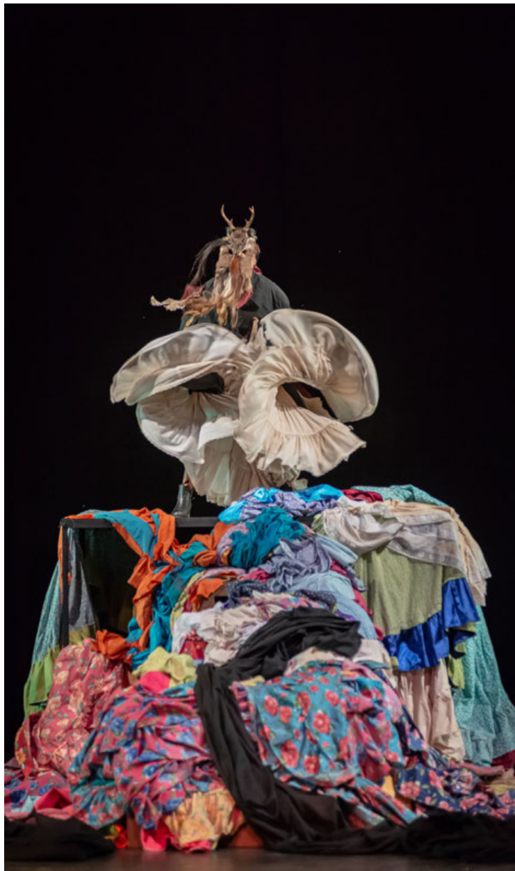
La escena del pecado capital destinada a la avaricia.