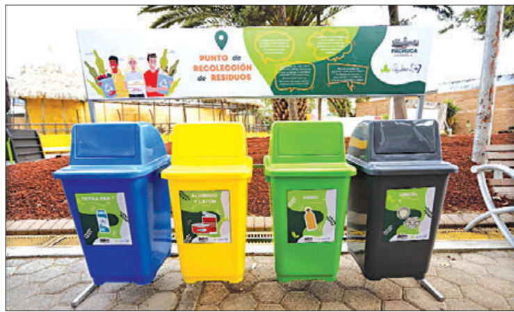
LOCACIÓN. El Punto Verde está ubicado en el Bioparque de Convivencias.

Indicaron que los interesados en sumarse a las acciones emprendidas por el ayuntamiento para promover la cultura del reciclaje y el cuidado del medio ambiente, pueden acudir de lunes a viernes en horario de 8:30 a 16:30 horas.