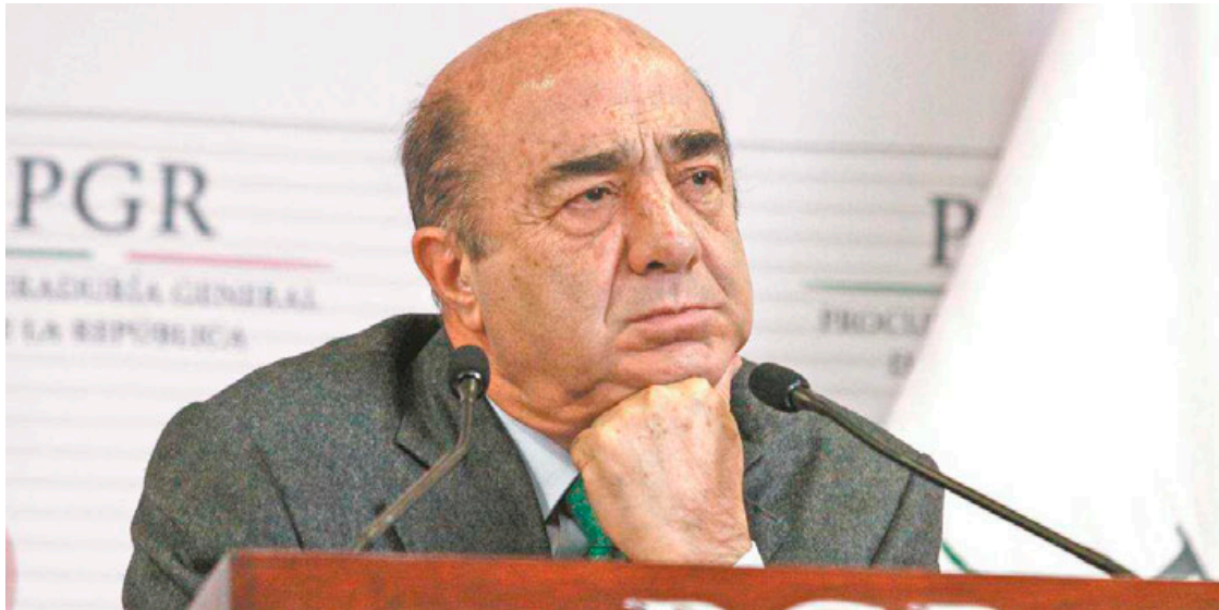
Jesús Murillo Karam esperará hasta el miércoles para conocer su situación jurídica.

El exprocurador fue escoltado por Fuerzas Armadas en su traslado a la audiencia