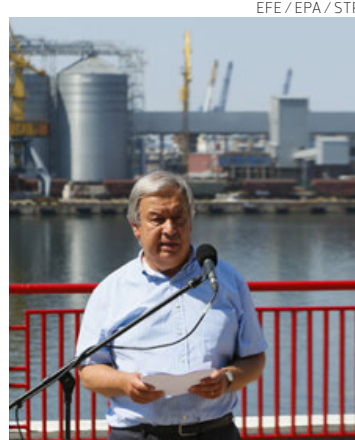
António Guterres, este viernes en Odesa, Ucrania.

Desde entonces, 27 buques mercantes han salido de Ucrania, transportando un total de 656 mil toneladas de produc-