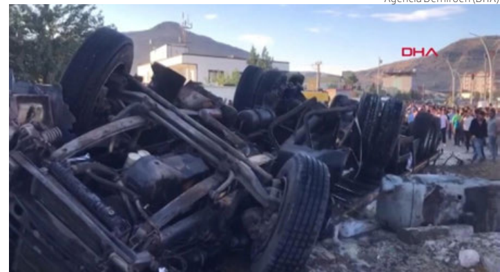
Escena tras el accidente de dos camiones y otros coches, ayer en Mardin, Turquía.