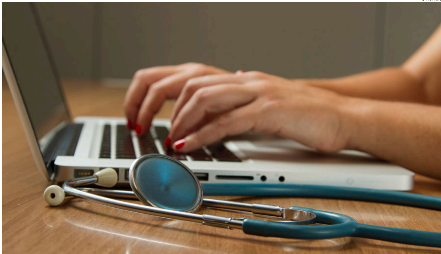
Las actividades complementarias de médicos menores de 45 años se enfocan en dar clases y las de más de 45 en actividades inmobiliarias.

La encuesta reveló que el 29 por ciento consideraría dejar la carrera para ganar más dinero en una actividad no clínica