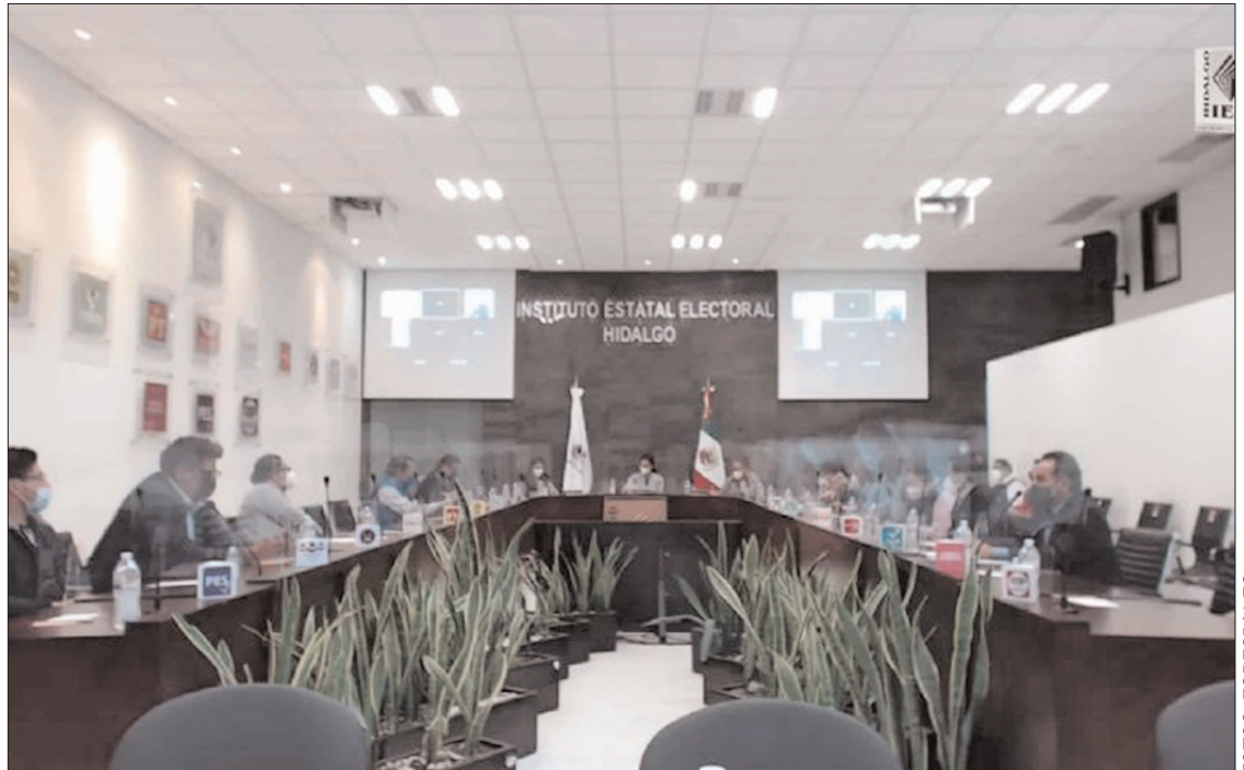
MUESTRA. En marzo de este año formalizaron cuatro quejas, dos que desecharon por no ratificarse, contra el ayuntamiento de Ixmiquilpan.

Conforme al acuerdo IEEH/CG/028/2020, la Ley General de Acceso de las Mujeres a una Vida Libre de Violencia, la Ley General de Instituciones y Procedimientos Electorales y el Código Electoral del Estado, al menos son 30 conductas enunciativas, más no limitativas, que constituyen violencia política por razón de género.