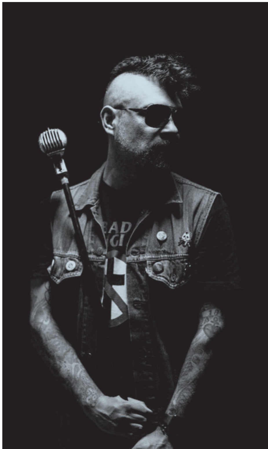
El músico canceló su gira internacional debido a que no puede viajar por su padecimiento de hipertensión.

“Fue ya para terminar el show, el cual fue muy intenso con 95 mil personas. Y de repente ese golpe adrenalínico sí interviene a la hora de estar en el escenario y sacar esa energía rimbombante, afortunadamente los paramédicos estaban ahí para auxiliarme y me bajaron la presión, aunque no fue al 100 por ciento la dejaron nivelada en 100 la diastólica y de ahí volar al otro día en la mañana para la Ciudad de México donde teníamos el vuelo para Bogotá, me vino otra subida de presión en el avión en la cual me sentí peor, entonces bajando inmediatamente me fui con elementos de mi oficina al doctor, al cardiólogo y me hizo las pruebas necesarias. Salí con la presión súper altísima y el doctor negó subirme a un avión”, explicó.