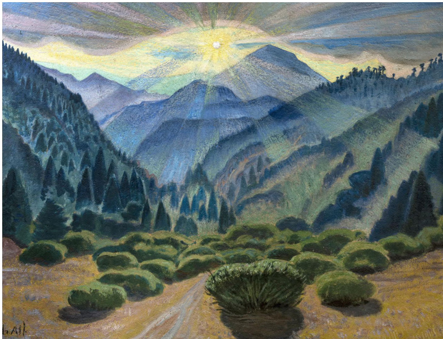
"Rayos de Sol", de Gerardo Murillo, (Dr. Atl).