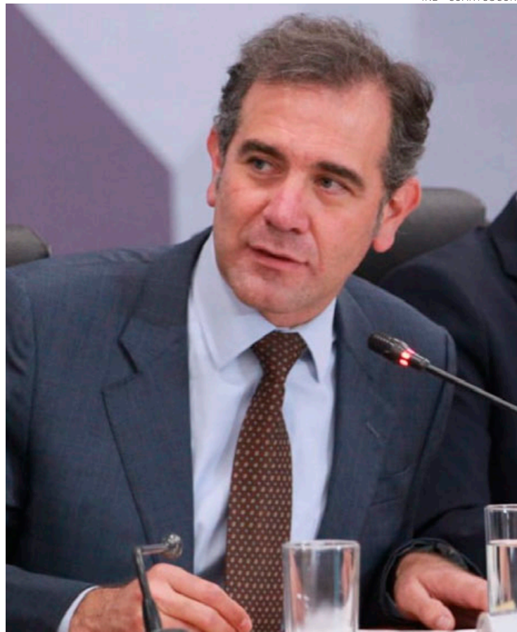
Lorenzo Córdoba defiende al INE y los procedimientos electorales.

Sin salirse del tema central que es la propuesta de una reforma electoral como propone el gobierno de la 4T, el titular del INE reiteró que “este ya