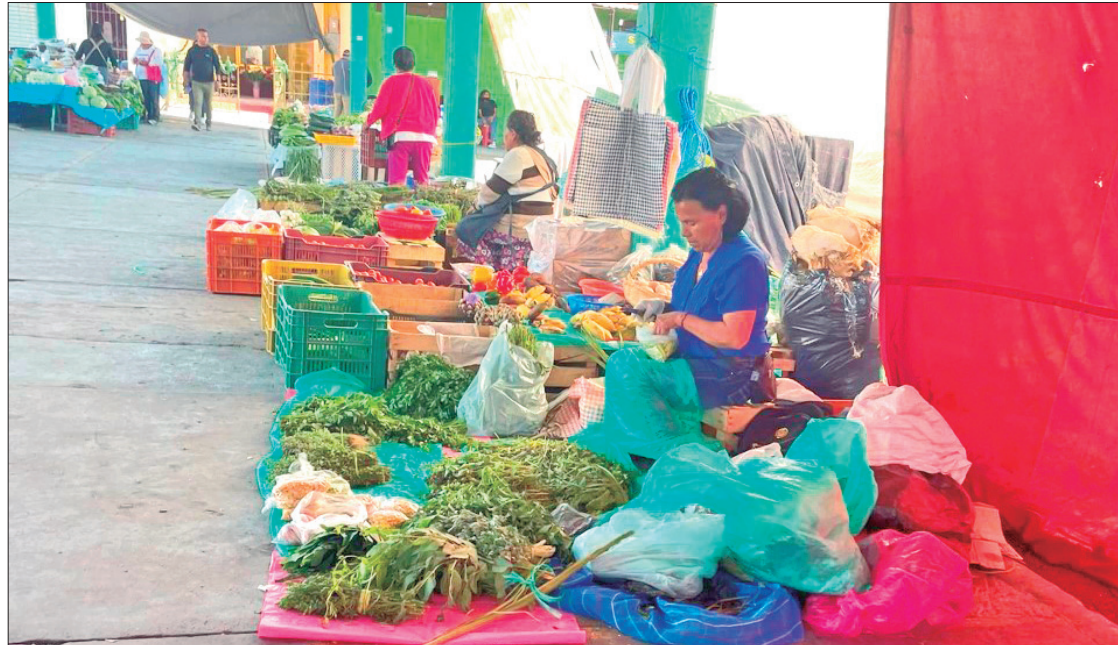
ORÍGENES. A mediados de este año, horticultores anunciaron la construcción de locales comerciales en el área conocida como "Techado I"; sin embargo, ésta fue reclamada por vendedores del Morelos, asegurando que este espacio es parte de este centro comercial.

Dijo que actualmente son varias las denuncias realizadas en contra de funcionarios municipi-