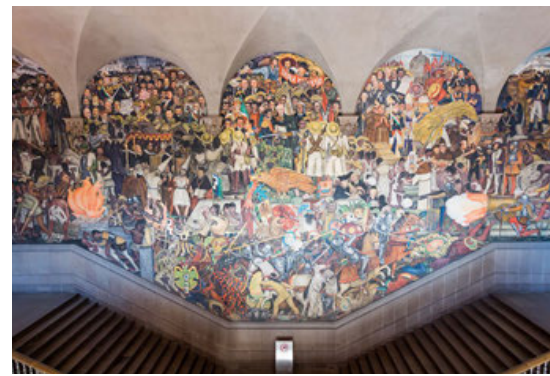
Un detalle de los murales de Rivera.

“Cien años después, en 1972, el recinto parlamentario fue reconstruido y ahora, 50 años más