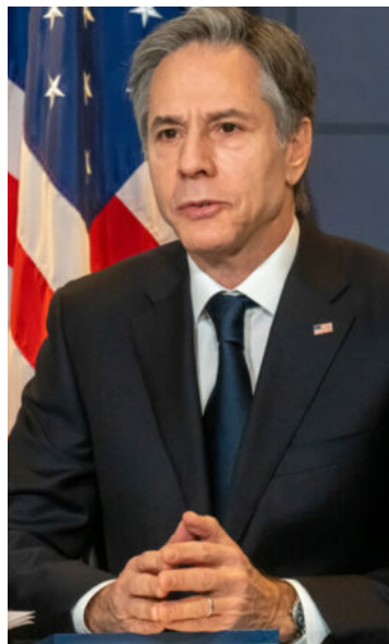
Anthony Blinken, visitará México para un diálogo de alto nivel.

Recordó que el diálogo económico de Alto Nivel se inició