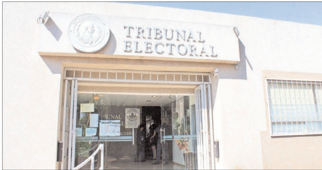
RESALTA. Del total de expedientes, 194 son relacionados al proceso electoral de gobernador.

Los magistrados dirimen o emitieron fallos de 132 procedimientos especiales sancionadores, 103 juicios de protección de derechos políticoelectorales, 32 recursos de apelación, 18 juicios