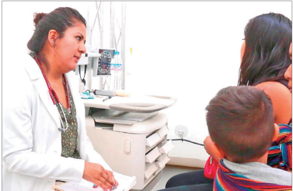
SITUACIÓN. En México, desde 2006 es la segunda causa de muerte por neoplasias malignas en la mujer.

También se busca, lograr un incremento en las coberturas de tamizaje y la relevancia de regresar por sus resultados, para en