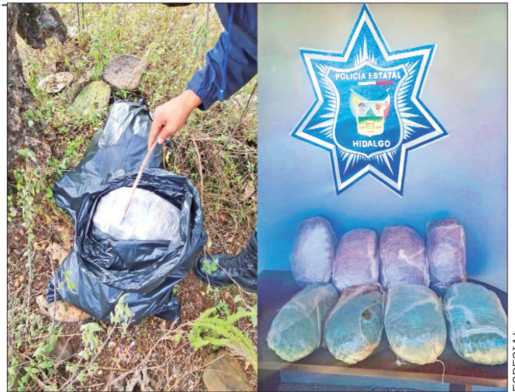
IMPLICADOS. Sujetos fueron consignados ante un agente del Ministerio Público de la Procuraduría General de Justicia de Hidalgo.

Ambos sujetos, que se identificaron con los nombres con iniciales O.M.C. y F.J.S.R., de 27 y 25 años, respectivamente, fueron consignados ante un agente del Ministerio Público de la Procuraduría General de Justicia de Hidalgo, relacionados con la carpeta de investigación iniciada en consecuencia.