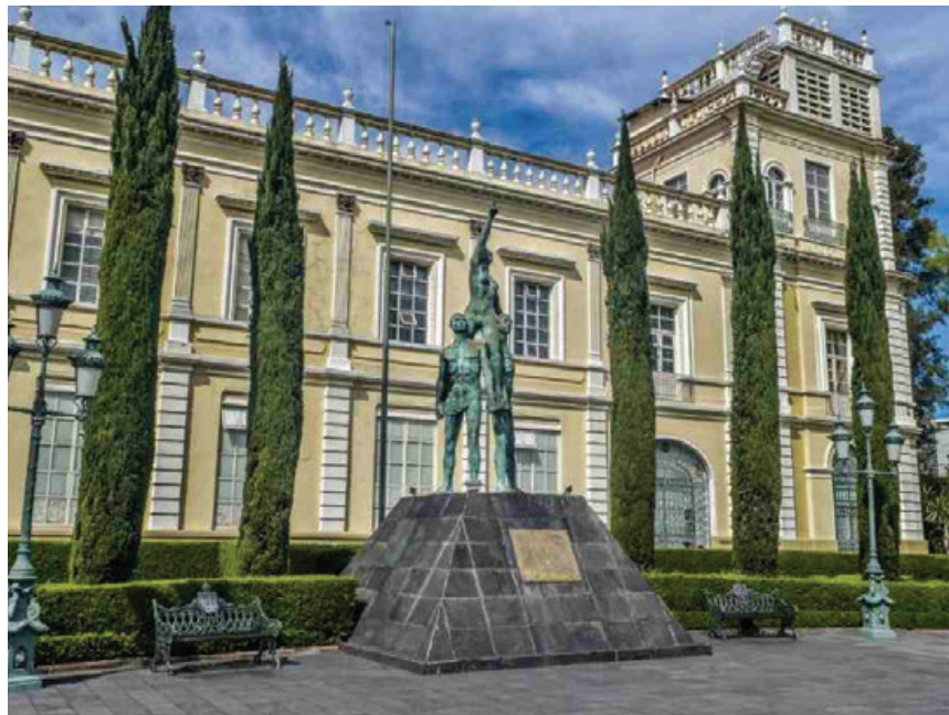
Universidad del Estado de México, Premio Crónica en Comunicación Pública.

cíhuatl 2012, del Inmujeres de la Ciudad de México; Premio Universidad Nacional 2013, en Ciencias Naturales. En 2018, el Sistema Universitario Jesuita le otorgó el doctorado Honoris causa .