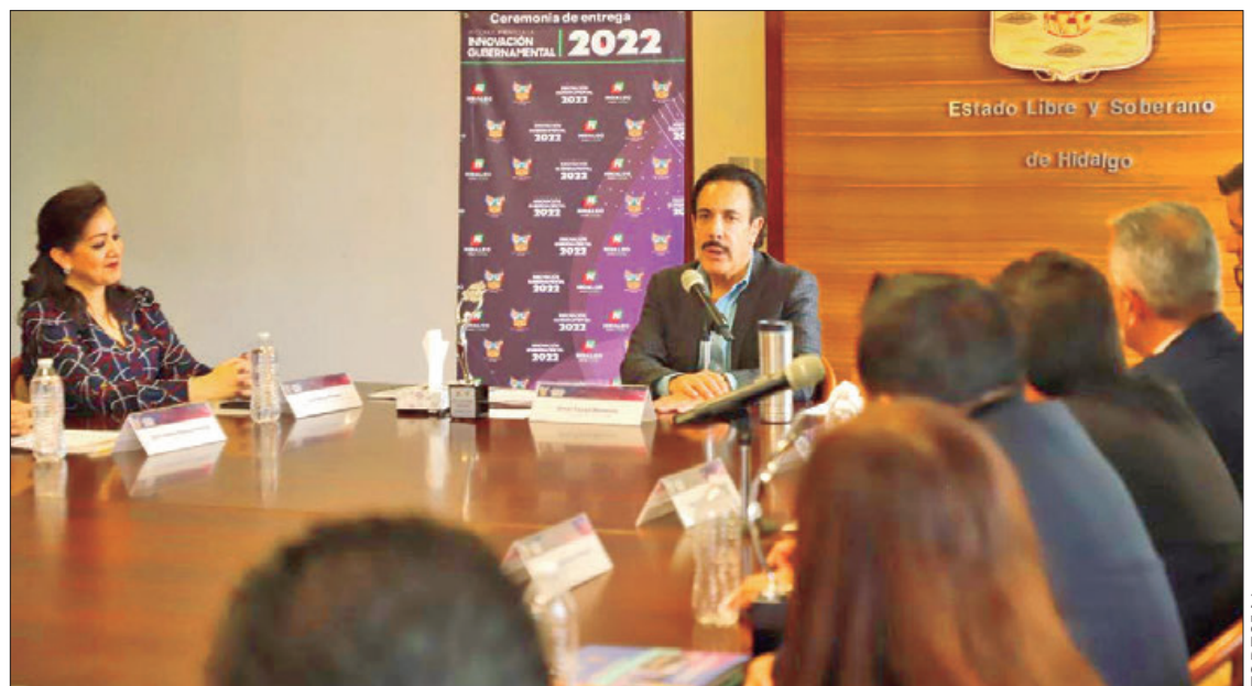
CERTEZA. El jefe del Ejecutivo refirió que desde el inicio de su administración estableció que su gobierno sería moderno y digital.

También se reconoció la perspectiva, compromiso y liderazgo en temas relacionados con la tecnología y la innovación de cada integrante del Comité Evaluador, ya que se garantizó que cada práctica ganadora se distinguiera por su contribución en el servicio público en beneficio de la ciu-