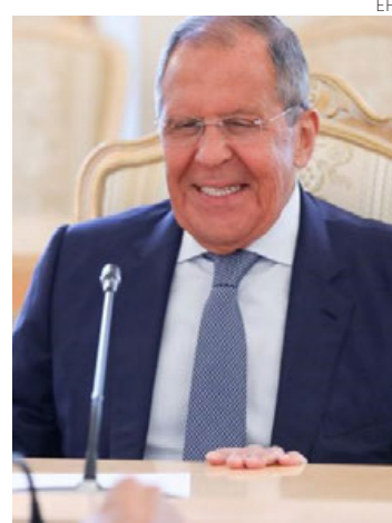
El canciller ruso, Serguéi Lavrov.

La intervención militar también fue condenada por algunos países latinoamericanos, especialmente Colombia, Chile o Guatemala, mientras Cuba, Nicaragua,