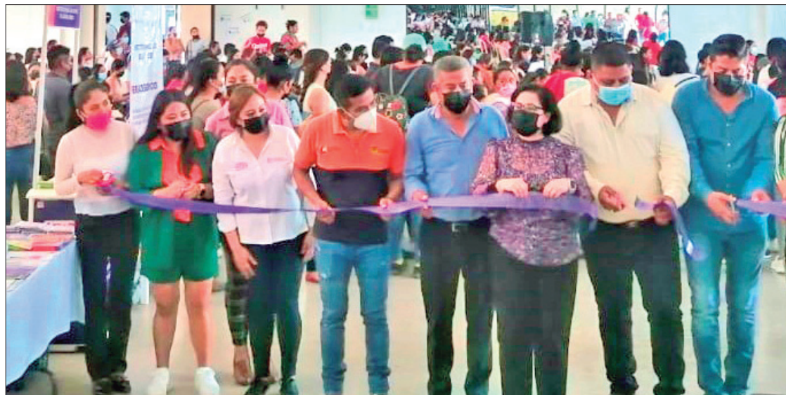
ACCIONES. Se instaló un módulo de orientación especializada a cargo de personal certificado hablante de la lengua náhuatl, para brindar atención jurídica, psicológica y de trabajo social.

Subrayó que en el sexenio del gobernador Omar Fayad, se instruyó a todo el funcionariado a hacer trabajo cercano a la gente para conocer las necesidades de viva voz de la ciudadanía. En este sentido, en materia de género, la Secretaría de Gobierno, a través del IHM, impulsó la creación de redes de apoyo entre las dependencias que operan a nivel federal, estatal y municipal, para que