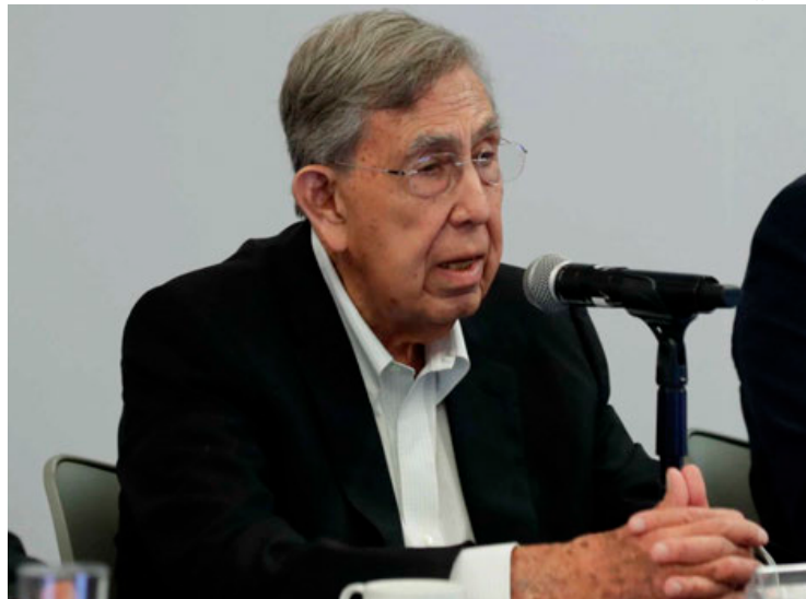
Cuauhtémoc Cárdenas dicta ponencia ante el Grupo Plural.

Orador en la reunión del Grupo Plural, el ingeniero Cárdenas expuso que no observa en México un gobierno de izquierda, porque no hay una verdade-