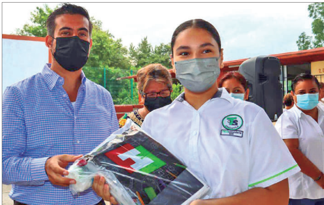
COMPROMISO. Alcalde inaugura ciclo escolar 2022-2023 en la Telesecundaria 609 de Chacatitla.