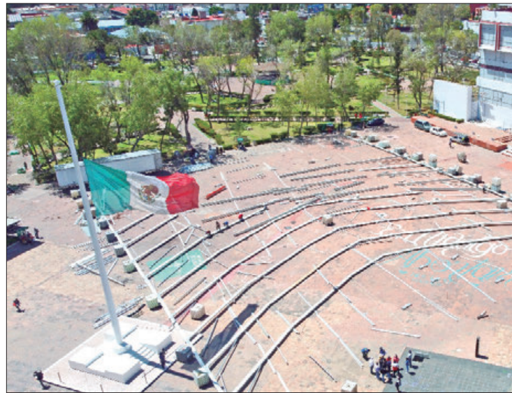
EN PAUSA. Hasta el momento, la Diputación Permanente no convoca a un periodo extraordinario para el cambio de sede del Congreso Estatal.

acuerdo de la Junta de Gobierno y con la aprobación del Pleno, la Legislatura podrá sesionar fuera del recinto oficial, con el objeto de promover la participación ciudadana, la máxima publicidad y la transparencia en la función legislativa".