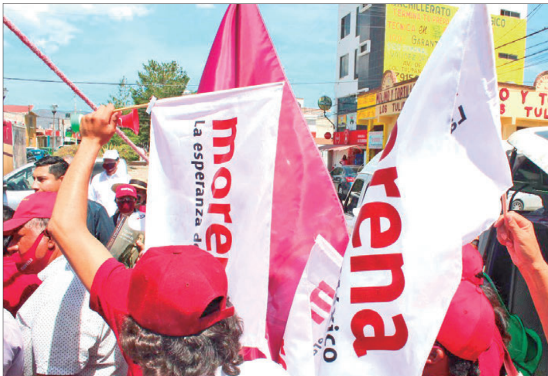
Desde el 29 de julio hasta el 25 de agosto prevalecen más de 20 asuntos que formalizaron militantes o aspirantes a consejerías estatales.

de Morena, desde el 29 de julio hasta el 25 de agosto prevalecen más de 20 asuntos que formalizaron militantes o aspirantes a consejerías estatales, la mayoría están en trámite de prevención o admisión, además de cierres de instrucción.