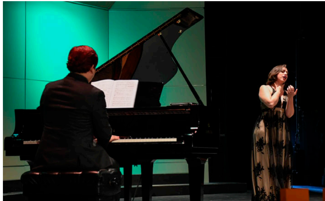
Las actividades se realizan del 1 de septiembre.

“Son más o menos 650 piezas divididas en 6 acervos: pin-