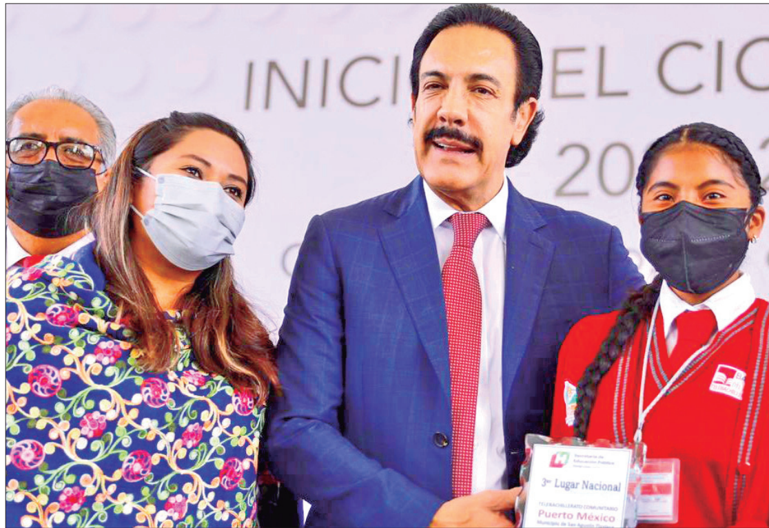
FUERZA. Inició el ciclo escolar 2022-2023, gobernador evento en la Escuela Secundaria Técnica número 6, de Chilcuautla.

Subrayó que pese al complejo panorama que se vivió durante la pandemia ningún indicador en materia educativa retrocedió en los últimos seis años, lo que habla del esfuerzo y compromiso que docentes, autoridades y alumnos han puesto para que Hidalgo se consolide como el segun-