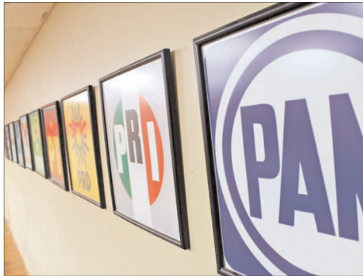
DATOS. Tres cúpulas cuentan con oficinas propias para albergar sus respectivas direcciones por lo que no destinan dinero para rentas.

El "sol azteca" refirió que en ese lapso no constituyó nuevas comisiones o enlaces en las demarcaciones, ni entregó dinero para las sedes municipales,