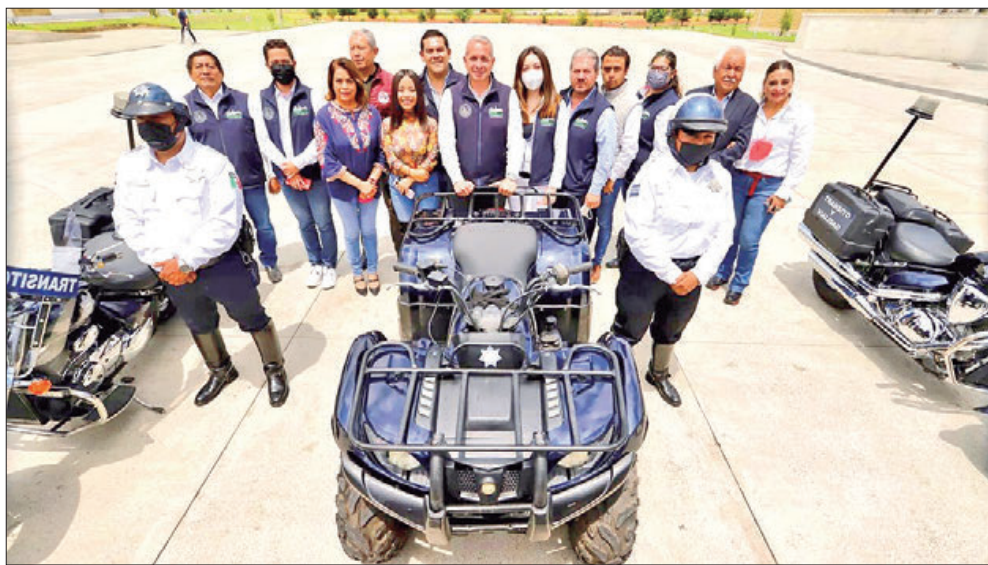
CAMINO. Alcalde destaca que siempre será determinante que los elementos de la Policía cuenten con las herramientas necesarias para el combate del delito.

Además, enalteció la labor realizada por el titular de la Secretaría de Seguridad Públi-