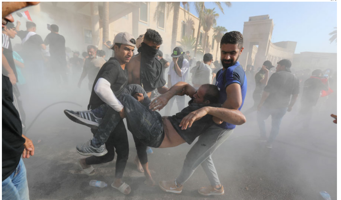
Seguidores del clérigo Mutqada al Sadr, sacan a un herido del Palacio Presidencial de Bagdad asaltado.

Ante la imposibilidad de gobernar, el clérigo ordenó en junio a los diputados de