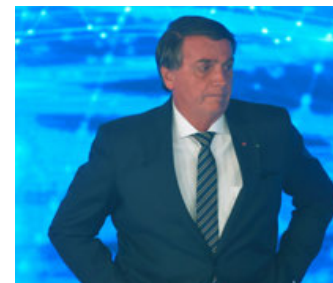
Bolsonaro en el debate del domingo.

El expresidente brasileño Luiz Inácio Lula da Silva se mantiene como el máximo favorito para vencer en las elecciones presidenciales del 2 de octubre en Brasil, con una ventaja de 12 puntos porcentuales que no varió en las dos últimas semanas sobre el actual mandatario, Jair Bolsonaro.