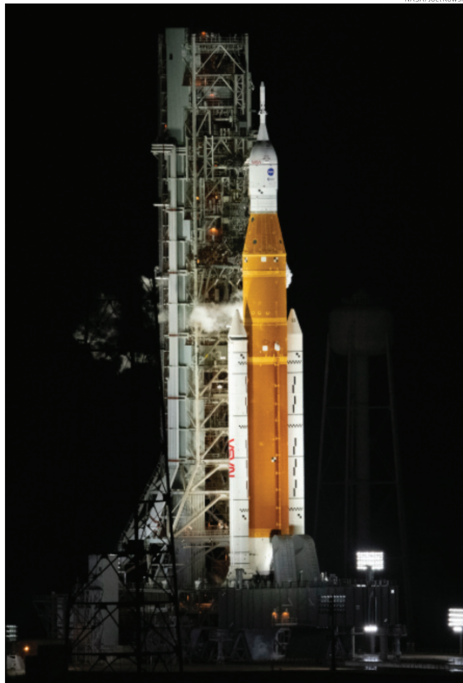
Sigue abierta la posibilidad de un lanzamiento el viernes. La NASA ofrecerá más detalles este martes.

De acuerdo con la NASA, los ingenieros de la misión están evaluando los datos recopilados durante el intento de lanzamiento de Artemis I, después de que los equipos no pudieron llevar los motores del cohete al rango de temperatura adecuado requerido para encender los mo-