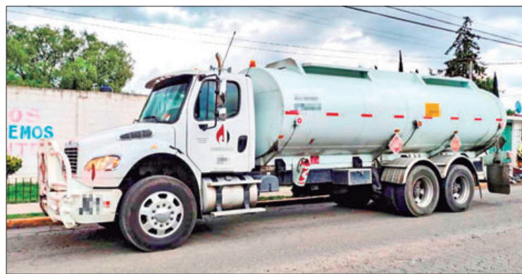
COBERTURA. Despliegue policial fue en el barrio Nacozari.

El conductor, que se identificó como A.S.O., de 45 años, originario de Tecámac, Estado de México, y quien trató de huir del lugar, fue consignado junto con la unidad y el dispositivo de bloqueo satelital ante la Fiscalía General de la República, mediante su representación en Hidalgo, donde se dio inicio a la carpeta de investigación en consecuencia.