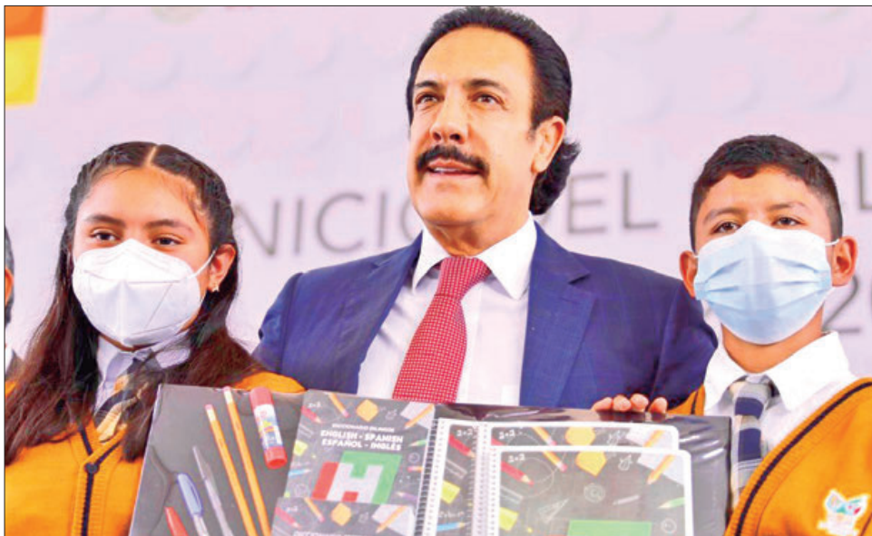
Gobernador encabezó evento, por inicio del ciclo escolar 2022-2023, en la Escuela Secundaria Técnica número 6, de Chilcuautla.

■ En Educación, subraya el jefe del Ejecutivo, se hizo historia porque en 6 años las acciones en diferentes rubros estuvieron enfocadas en cambiar escenario