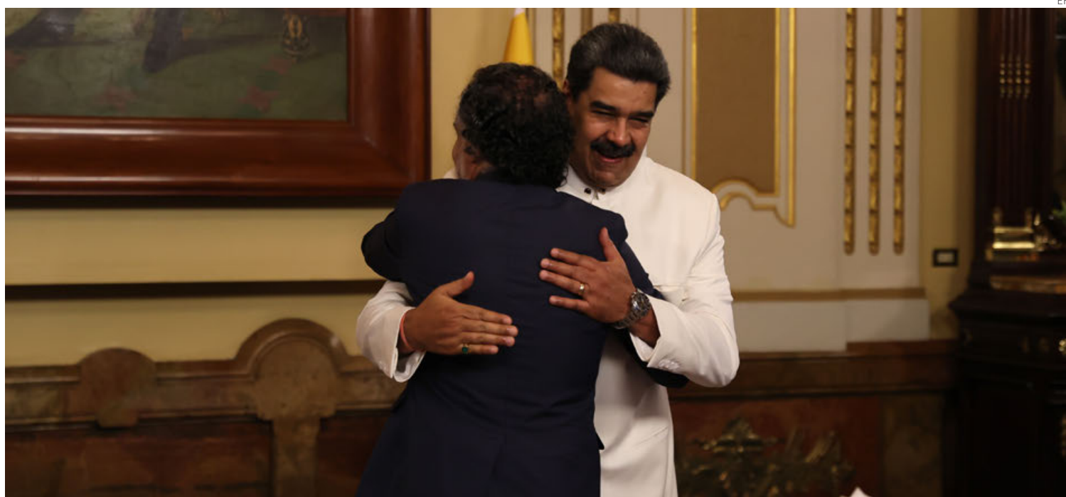
Maduro recibió con un cariñoso abrazo al nuevo embajador colombiano, Armando Benedetti..