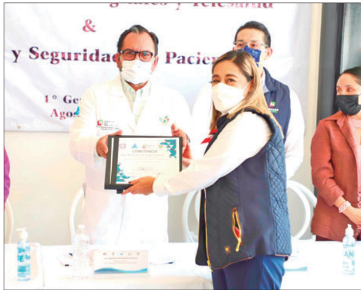
GALARDONADOS. Al final de la ceremonia de clausura, las autoridades recibieron un reconocimiento al ser docentes del diplomado.

sanitarias en la entidad, recordó que actualmente en la época post moderna se soslaya el ejercicio clínico de los médicos, pues señaló, el mayor reto es entender que nada sustituye el trato directo y necesario con el paciente, que en ocasiones, acuden al sector salud por escucha y comprensión, por ello, añadió, la tecnología debe ser considerada únicamente como la herramienta de la que se valen los profesionistas para derramar sus conocimientos en el tratamiento y beneficio de los pacientes.