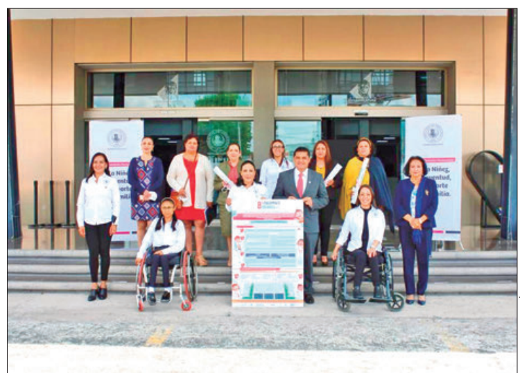
ACCIONES. La Comisión de la Niñez, la Juventud, el Deporte y la Familia presentaron el cronograma de actividades rumbo a la sesión del Parlamento Infantil 2022.

y electos, el supervisor escolar realizara el registro del 3 al 6 de octubre en la página web del Instituto Estatal Electoral de Hidalgo (IEEH) ( www.ieehidalgo.org.mx ). Para el 7 de octubre se realizará el envío de las ligas a las y los alumnos y deberán ingresar el día y la hora indicada