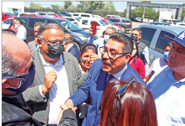
VOCACIÓN. El líder magisterial advirtió que con trabajo permanente lograrán el cambio sindical que este gremio requiere.

que se desempeñarán de forma clara, transparente, con convicción y responsabilidad de parte de la nueva directiva.