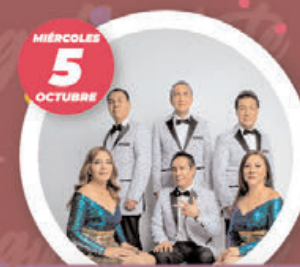
LOS ÁNGELES AZULES