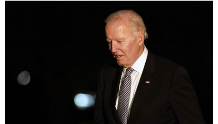
Joe Biden llega a la Casa Blanca tras un evento en Nueva York, la noche de este jueves 6 de octubre de 2022.