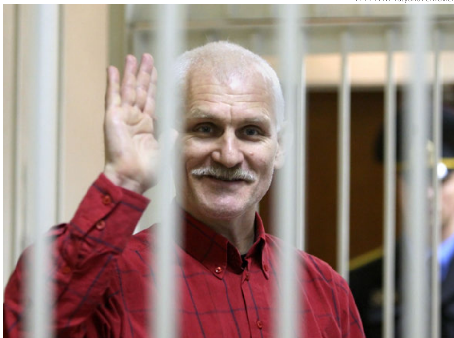
El activista bielorruso Ales Bialiatski, durante un juicio en Minsk en noviembre de 2011.