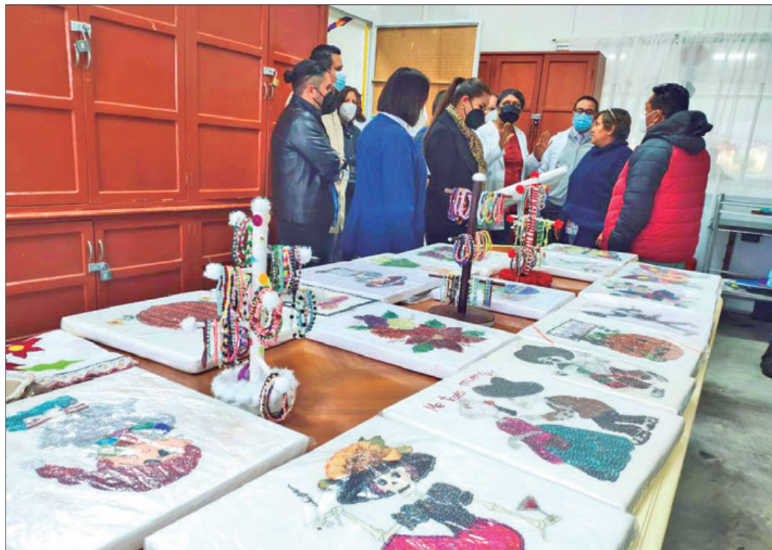
COMPROMISO. Es una obligación como institución pública, darles condiciones de vida con empatía, calidad y calidez a los pacientes.

Expuso que el goce de los derechos humanos es impostergable, las personas institucionalizadas son personas co-