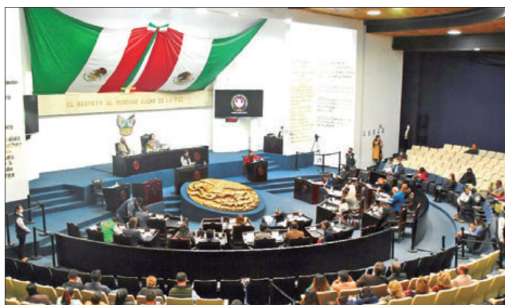
PLANEACIÓN. Analizan otras dos sedes: la primera de ellas Mineral de la Reforma y la otra está en revisión si es en Molango o Zacualtipán.

Destacó que al interior de la primera comisión existe avance