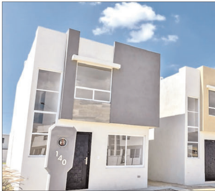
LIMITACIONES. Las empresas constructoras no pueden ejecutar sus proyectos por diversas causas.

Además, son tierras exclusivas agrícolas, lugares considerados de riesgo y alto riesgo para la