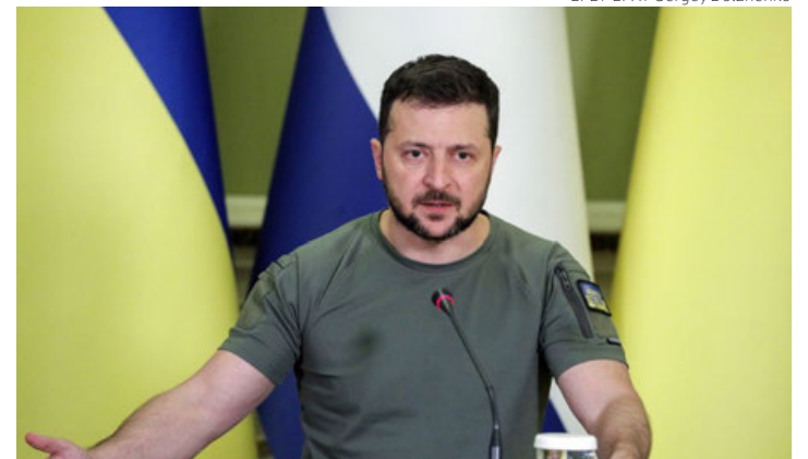
Volodímir Zelenski, en una imagen de archivo.