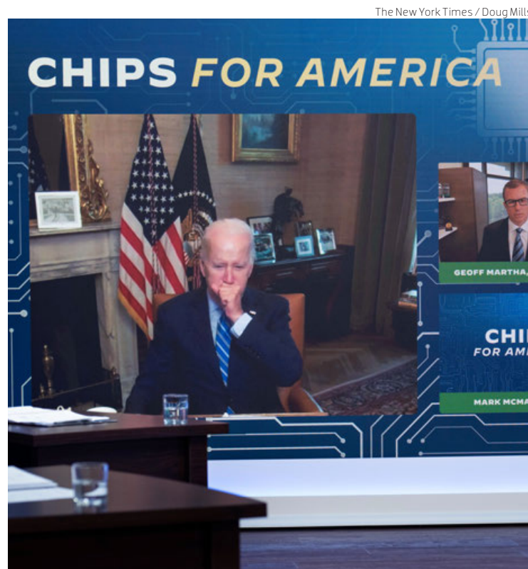
Joe Biden participa en una cumbre virtual sobre la fabricación estadounidense de microchips, en una imagen de archivo.

La medida, fuertemente rumoreada durante la última semana en algunos medios estadounidenses, es similar a las restricciones impuestas