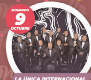
LA ÚNICA INTERNACIONAL SONORA SANTANERA