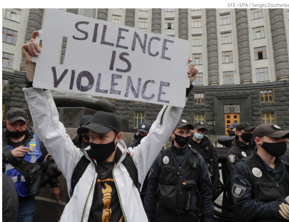
Un manifestante en un grupo del Centro por las Libertades Civiles y activistas LGBT protestan contra el gobierno de Kiev, el 5 de junio de 2020.