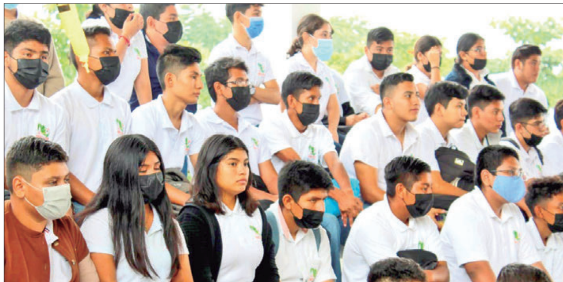
ACCIONES. Esta actividad es parte de la conmemoración del valor de la integridad que se realiza los días 9 de cada mes.

tividad es parte de la conmemoración del valor de la integridad que se realiza los días 9 de cada mes y que está basado en el acuerdo de la secretaria de la función pública en materia de combate a la corrupción, además de celebrar el aniversario número 20 del Cecytech.