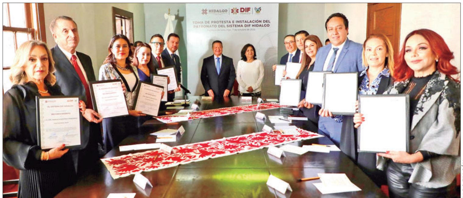
El gobernador Julio Ramón Menchaca Salazar tomó protesta a integrantes del Patronato del Sistema DIF Hidalgo.

El funcionario comentó que dicha secretaría absorbía muchas responsabilidades de diferentes áreas, por lo que requiere de un análisis exhaustivo su eventual desmantelamiento. 3