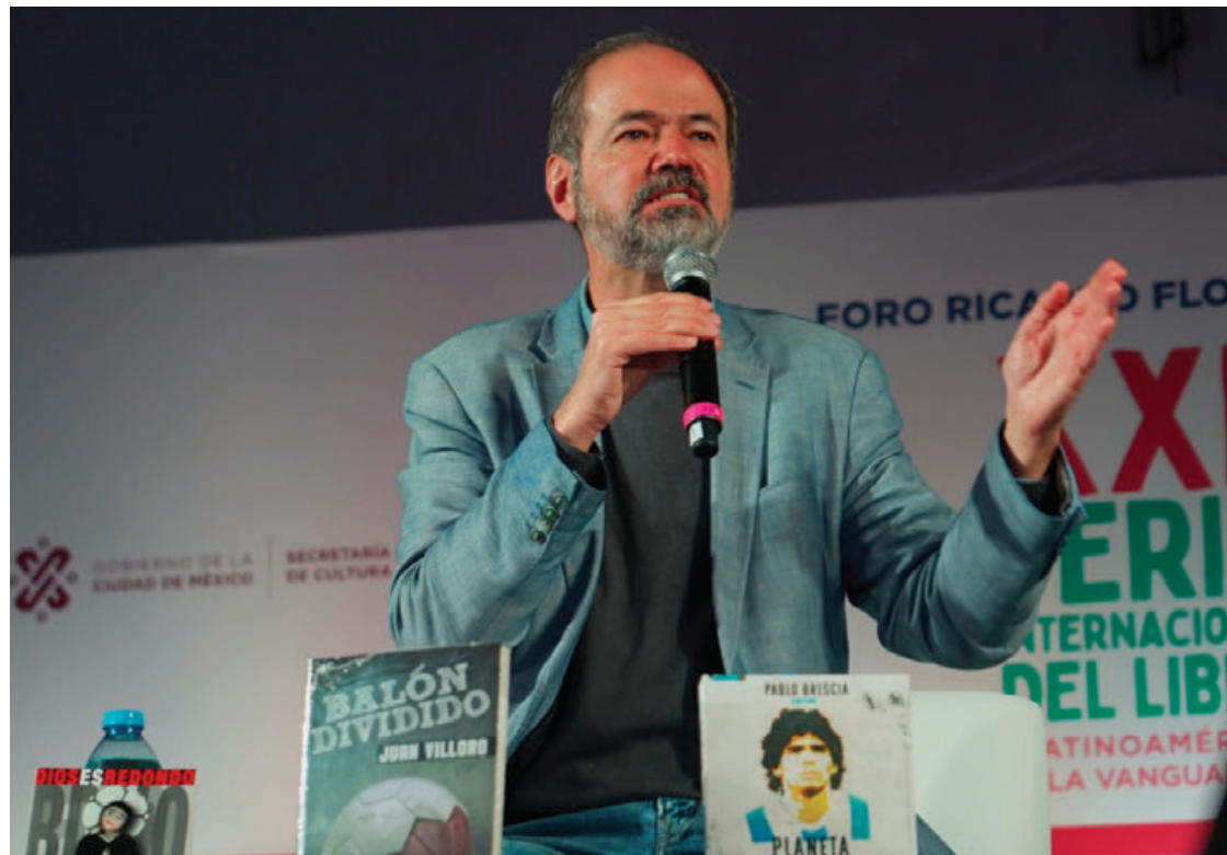
Uno de los problemas del fútbol mexicano es que nuestra liga es sumamente corrupta y “se dedica en su mayoría a la especulación económica”.

“Los que han comprado boletos hipotecaron sus casas, vendieron coches, rifaron sus mascotas... cosas enloquecidas para poder ir a Qatar. Es un público entregado que llega con disfraces maravillosos, incienso y copal, plumas, que en la aduana les dicen que no pueden importar chiles serranos y responden que es su ropa hecha de chiles, matracas de a montón, sombreros de ala extra ancha que tapan la vista a 3 filas superiores... esa afición entregadísima, con una selección que rara vez ha cumplido”.