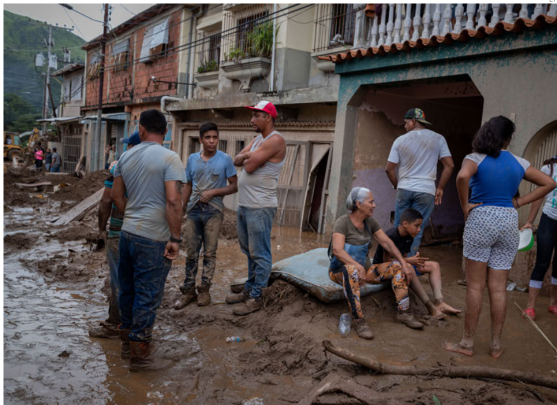
Residentes de Tejerías, en el estado central de Aragua, tras la riada destructora.

claró al canal estatal Venezolana de Televisión (VTV) desde la zona del suceso, “hubo un gran deslave” que provocó que se desbordaran las quebradas, provocando “perdidas humanas” y grandes daños materiales.