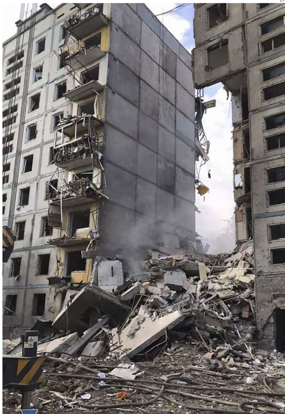
Edificio de viviendas de Zaporíyia bombardeado por los rusos mientras sus residentes dormían.

una reunión con los miembros permanentes del Consejo de Seguridad", dijo el domingo el portavoz del Kremlin, Dmitri Peskov.