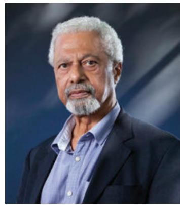
El Premio Nobel de Literatura 2021 participó en el Lviv BookForum, el festival literario de Ucrania.

“Mucho antes de los 70 años me di cuenta que era importante compartir mi experiencia. Quiero decir, creo que el deseo de hablar sobre las cosas por las que he pasado: irme de mi país, de mi casa por razones complicadas y por razones políticas, no es algo exclusivo de mí. Eso es una experiencia compartida por millones