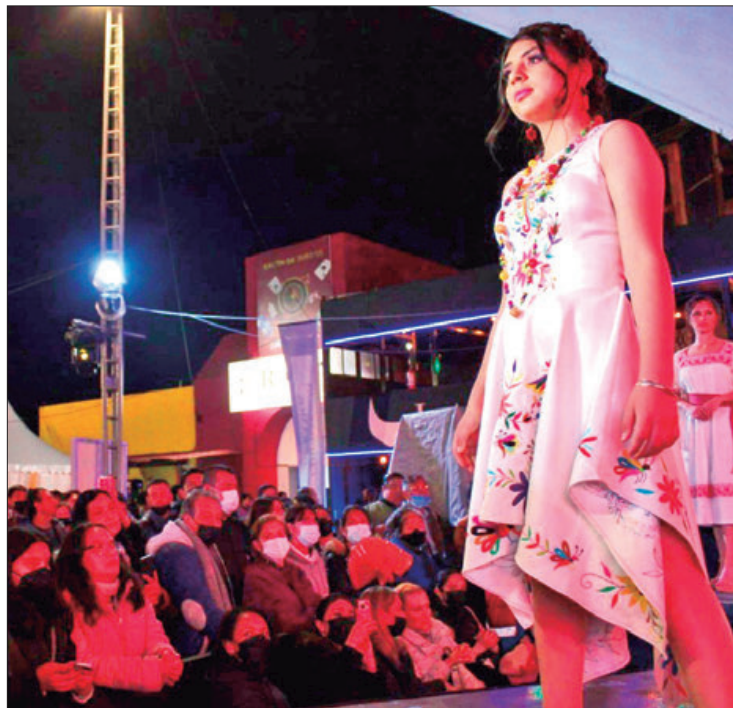
ACCIONES. En esta pasarela participaron 50 personas que modelaron los productos artesanales.

Lo exhibido mostró que el trabajo artesanal es valioso, innovador y luce bien para ocasiones especiales, así lo comentó la subsecretaria de Participación Social