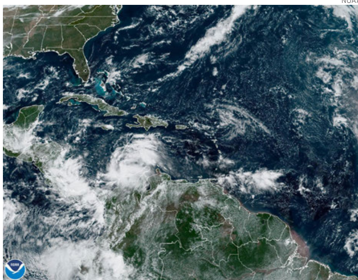
Imagen satelital de Julia en Centroamérica.

Las autoridades nicaragüenses, que todavía no han repor-