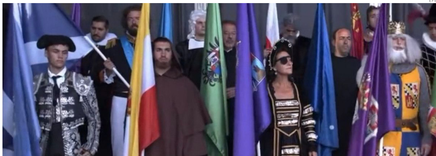
El escenario de la fiesta celebrada en Madrid se llenó de todos los clichés de la derecha española, incluidos toreros, el Quijote, conquistadores...

lla de la fiesta, celebrada en Madrid, fue el primer ministro de Hungría, Viktor Orbán, sancionado por la Unión Europea por su autoritarismo y persecución de minorías, quien invitó a sus colegas a “recuperar” la democracia.