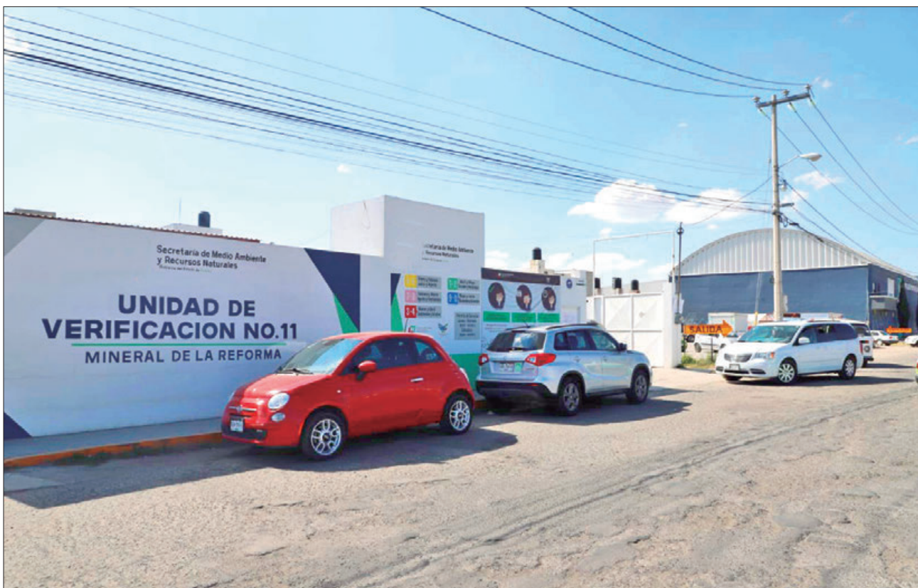
En el Periódico Oficial del Estado (POE) informaron sobre la vigencia de los hologramas tipo "0", "1" y "2" obtenidos en el último semestre del 2021 y el primer semestre del 2022.

■ Próximamente entregarán los hologramas específicos para esta modalidad