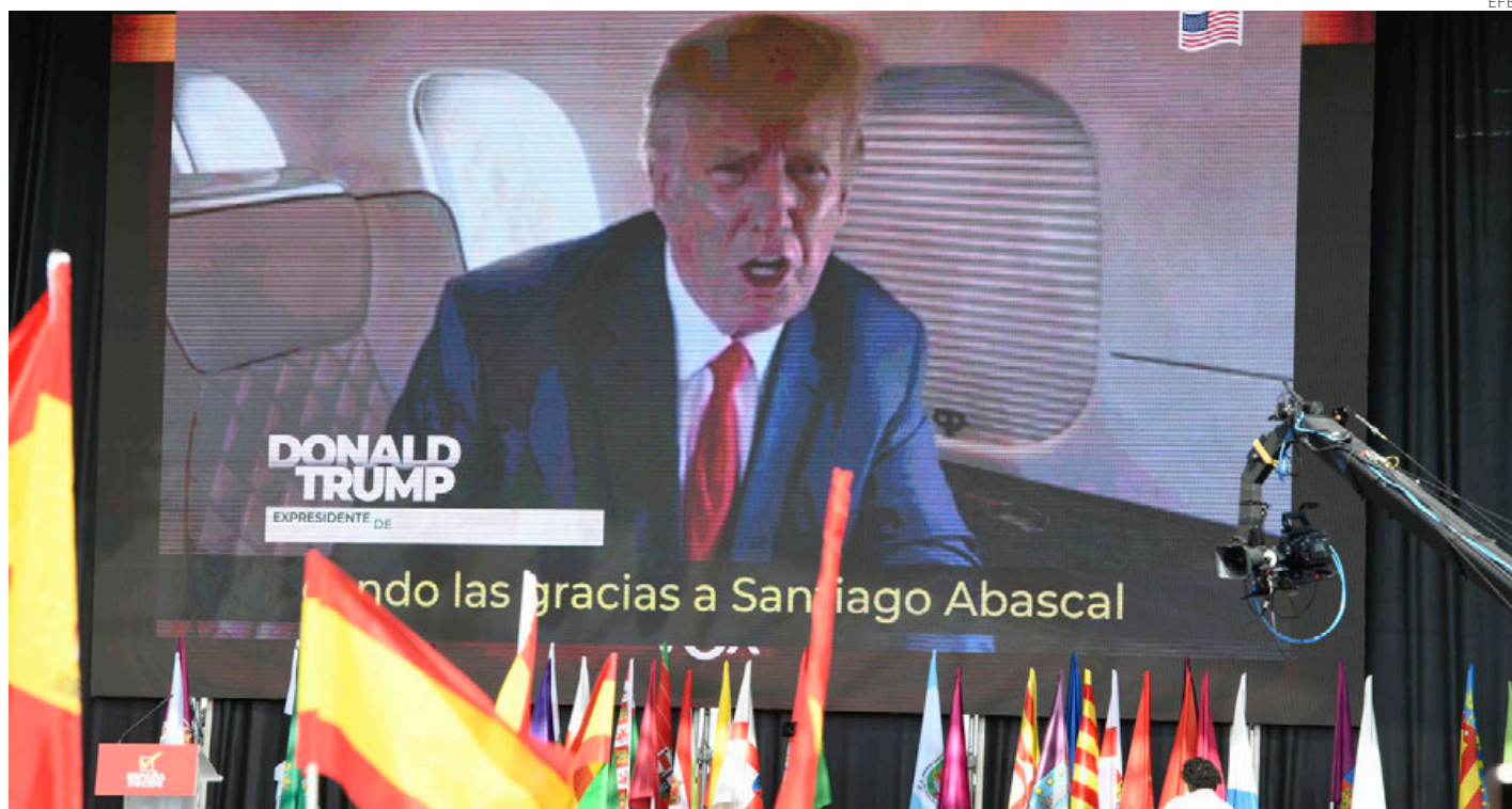
Trump ofreció su apoyo al líder de Vox, Santiago Abascal, en un mensaje grabado.