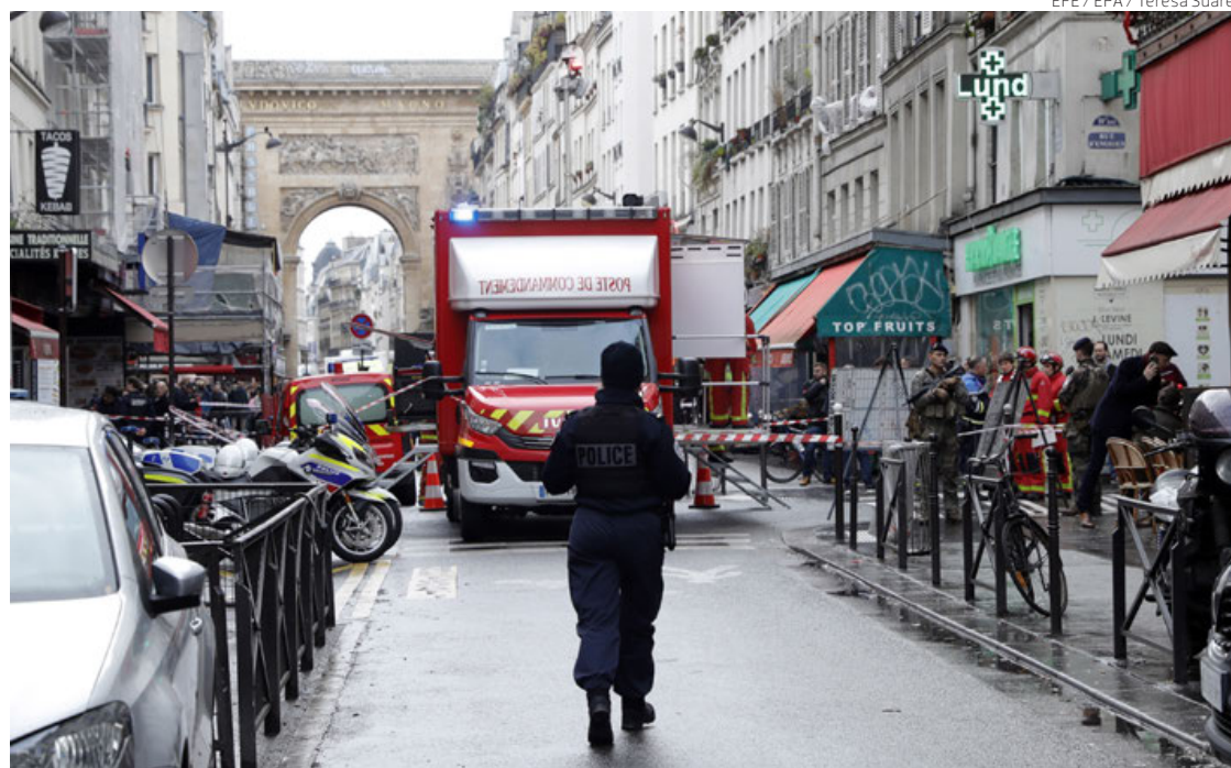
Disturbios entre manifestantes y policías tras el asesinato racista a tiros de tres kurdos en París, este viernes.

Según el Consejo Democrático Kurdo en Francia (CDKF), las tres víctimas, dos hombres y una mujer, son kurdas y miembros de esta asociación.