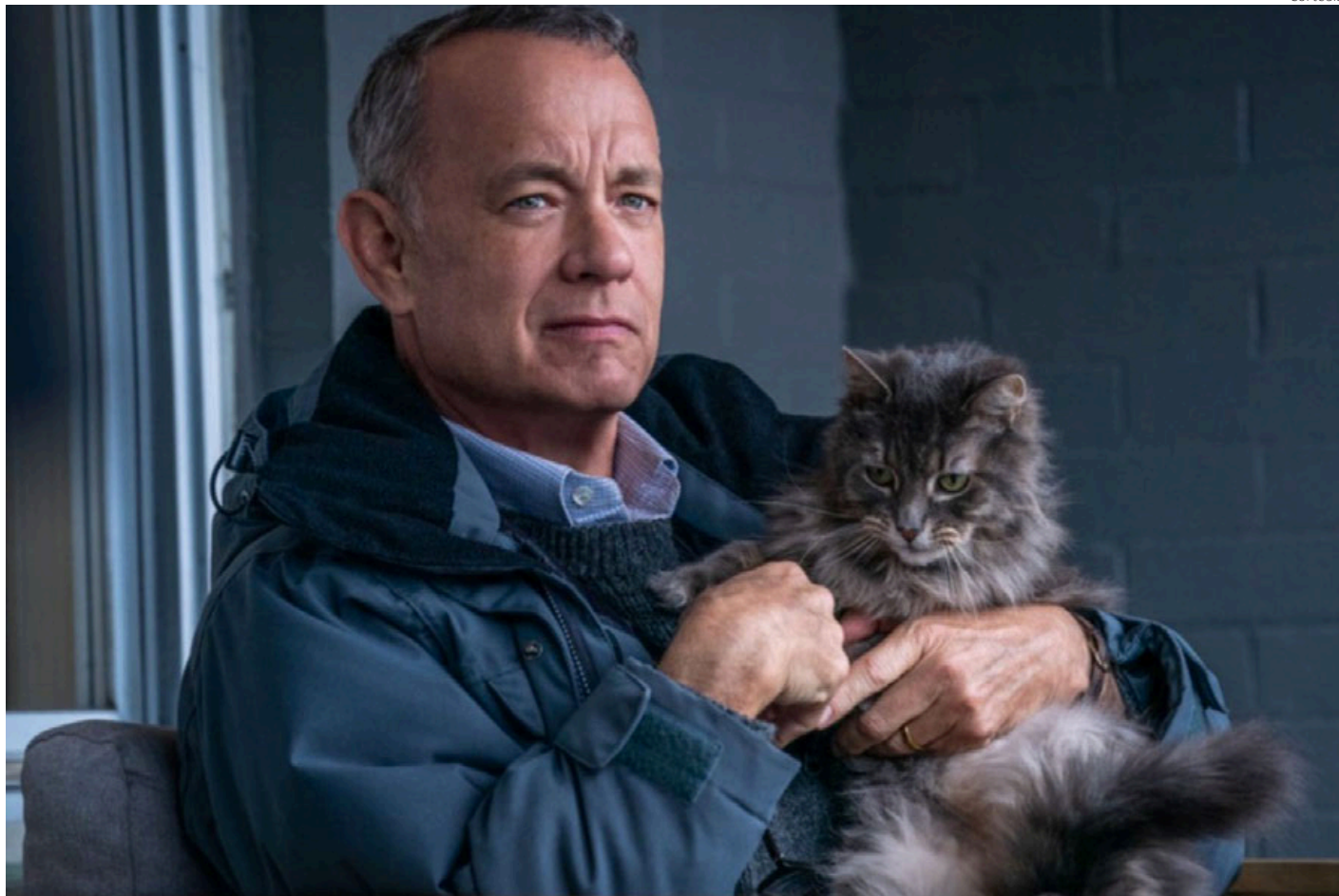
El filme se convierte en una de las grandes opciones de la temporada.