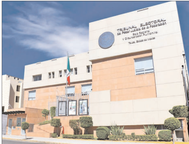
RESOLUCIONES. Regresan dictamen emitido por el TEEH.

Para diciembre del año pasado, el tribunal hidalguense ordenó como sentencia principal que la mencionada alcaldía adecuara, armonizara y regulara en la normativa, como bando municipal, reglamentos, lineamientos, entre otros, la institución jurídica de representante indígena, así como emitir y difundir una convocatoria, tanto en lengua hñahñu, como en español,