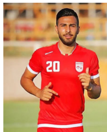
El futbolista Amir Nasr-Azadani, en una imagen de archivo.

Testimonios de testigos y documentos oficiales revisados por CNN y 1500Tasvir muestran evidencias de que se están realizando procesos judiciales de forma apresurada contra detenidos por participar en las protestas e imputados de cargos que podrían conllevar la pena de muerte, condenas a menudo dictadas en una sola sesión.