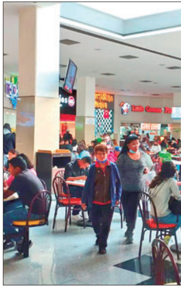
ALERTA Casos de covid-19 en aumento.

De acuerdo a los vendedores establecidos, las ventas registraron un incremento importante durante todo el sábado preva-