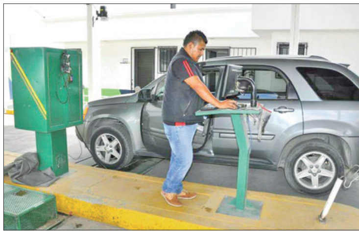
IRREGULARIDADES. La verificación vehicular derivó de que, en junio de este año, cerraron más de 40 verificentros.

Este programa es dirigido al control de las emisiones contaminantes mediante la inspección directa en los vehículos a través de equipo analizador de gases, para su posterior aprobación o rechazo de acuerdo con lo establecido en la NOM-167-SEMARNAT-2017, misma que delimita los máximos permisibles de con-