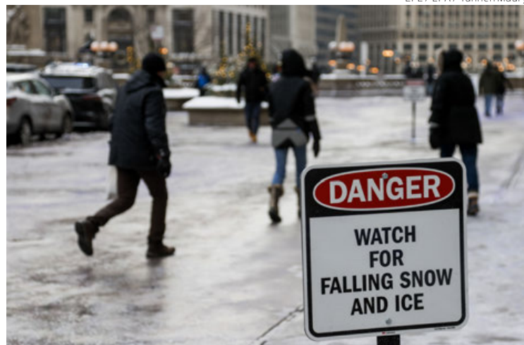
Personas caminan por Chicago, Illinois, con temperaturas de hasta -19 grados, este viernes.

El Servicio Meteorológico de Estados Unidos advierte que el temporal es "único en una generación"