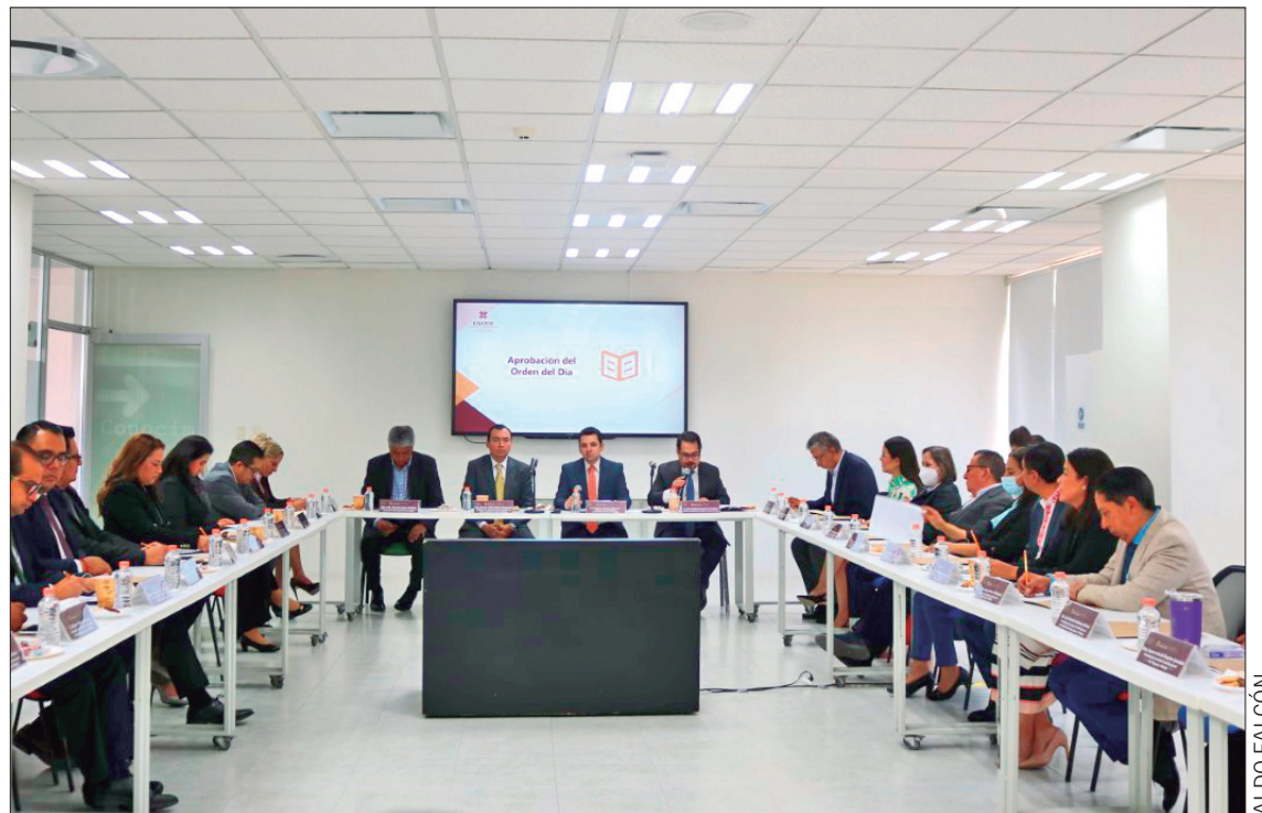
EXPECTATIVA. Se superó la meta planteada en un 35 por ciento, la cual era de 2 mil personas.