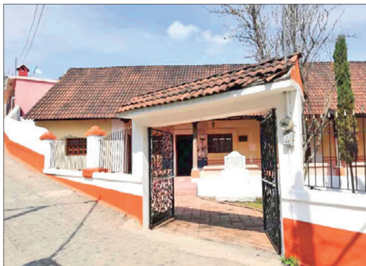
UBICACIÓN. El museo está en la calle Xicoténcatl 2, Barrio Arados, en Zacualtipán.

El inmueble histórico del siglo XIX, representativo de la arquitectura tradicional de la región, fue la casa donde nació el General Felipe de Jesús Ángeles Ramírez, el 13 de junio de 1868, conocido por su ilustre vida militar revolucionaria; hijo del coronel Felipe Ángeles Melo, originario de Molango y Juana Ramírez, originaria de Zoquiloquipan.