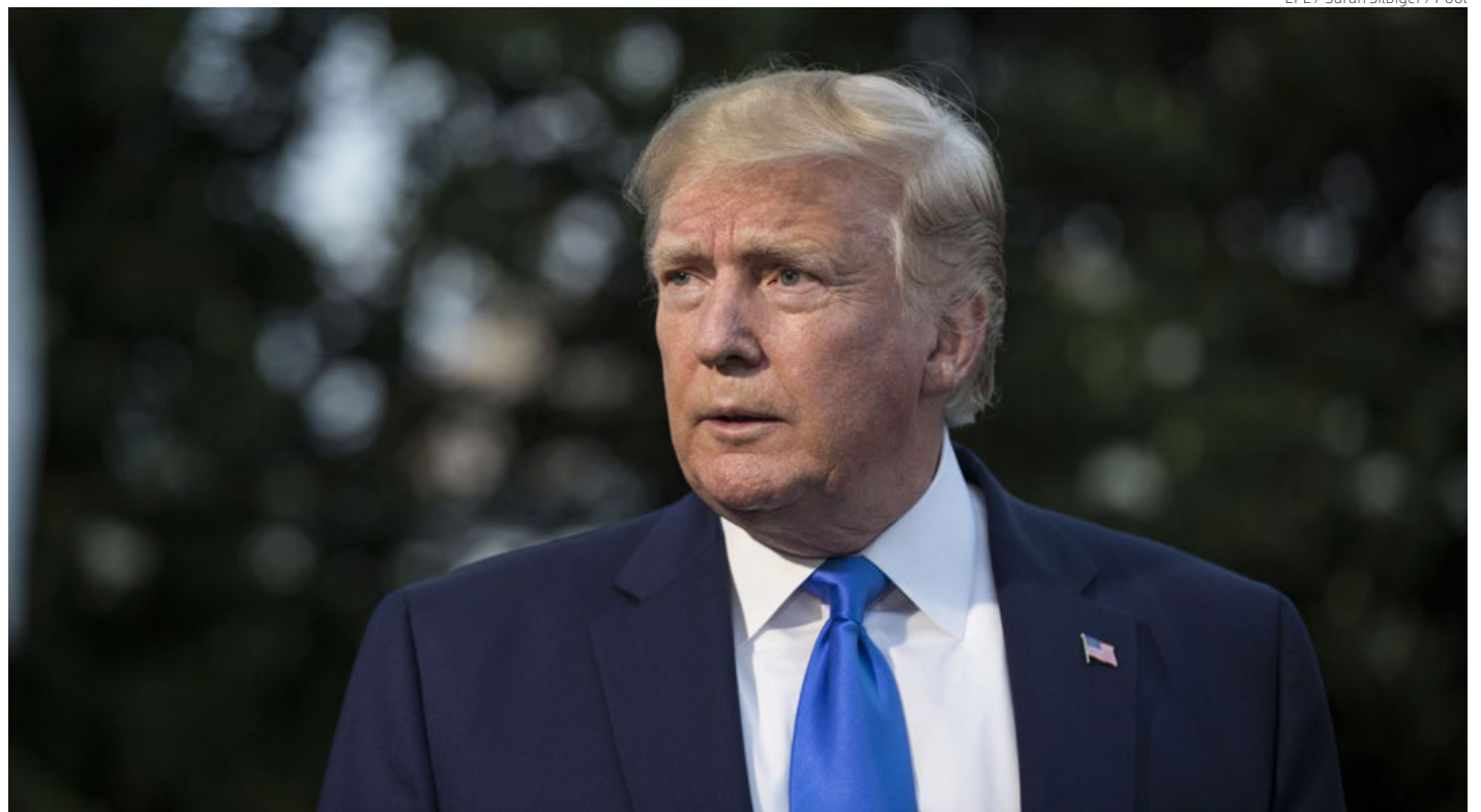
El expresidente de Estados Unidos Donald Trump, en una imagen de archivo.

En palabras del presidente del comité, Bennie Thompson, este informe ofrece "con detalle" pruebas "sobre los esfuerzos en varios pasos dirigidos por Trump