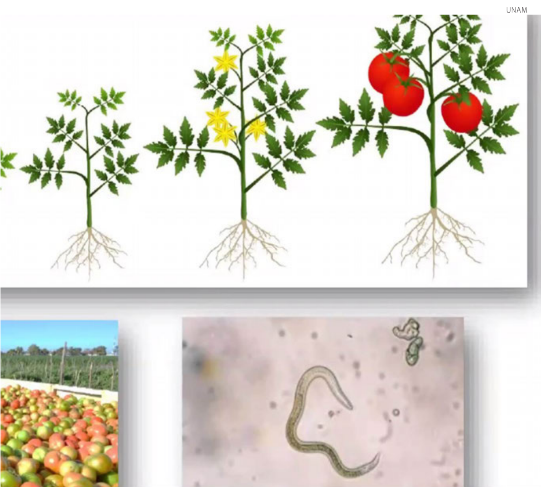
liga a estudiar cómo combatir a plagas tan difíciles de observar como los parásitos del

detecta su presencia, o de sus proteínas, que le sirven tanto para crecer como para manipular el sistema inmune de la planta, y que esta no los rechace.