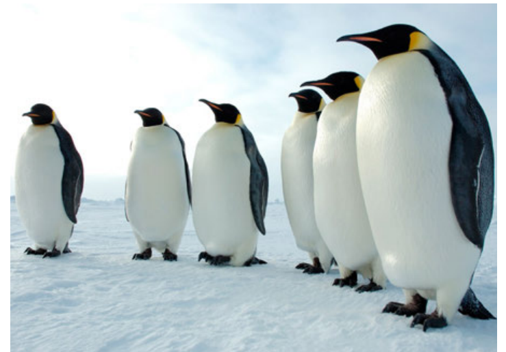
Los pingüinos emperador, los más vulnerables.

Los esfuerzos de conservación son insuficientes para proteger los ecosistemas antárticos, y es probable un descenso de la población del 65% de las plantas y la fauna del continente para el año 2100.