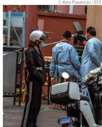
Hospitales y funerarias se saturan en Pekín por el Covid.

Junto a entrevistas a residentes en China y trabajadores de funerarias, la investigación sugiere que “los registros ofi-