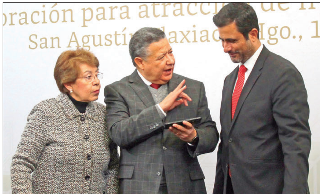
GOBIERNO DE HIDALGO. Con acuerdo, firmado con la Confederación de Cámaras Nacionales de Comercio, Servicios y Turismo de los Estados Unidos Mexicanos, la meta es promover en plataformas digitales los atractivos hidalguenses para impulsar la economía y el sector turístico.

"Es el primer convenio a nivel nacional para que nuestra enti-