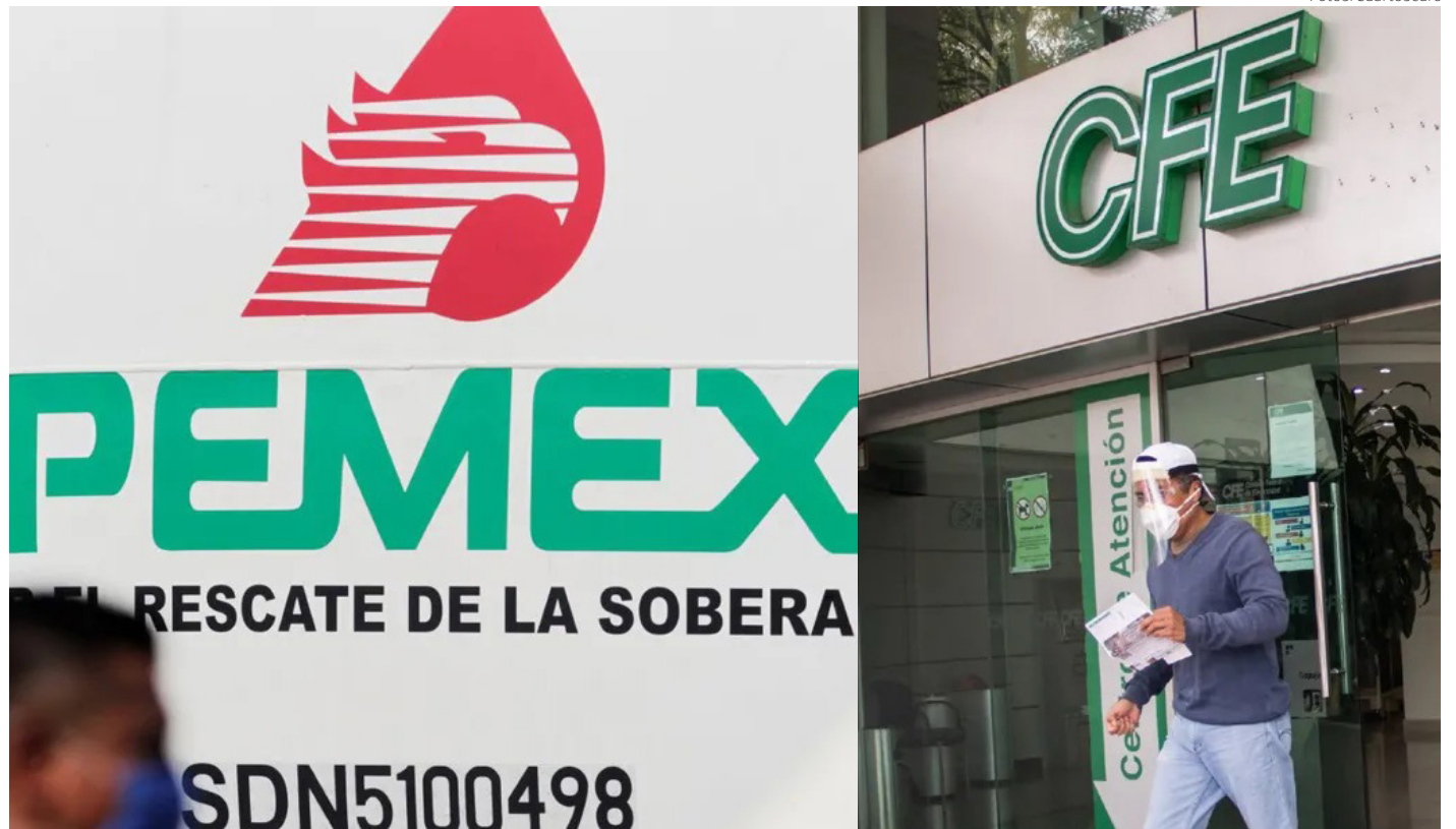
Uno de los puntos claves de la reunión trilateral será evitar llegar a un panel de controversias por la política energética de México.

Quienes son detenidos y no pueden acreditar su estancia, son regresados a México en un promedio de mil personas al