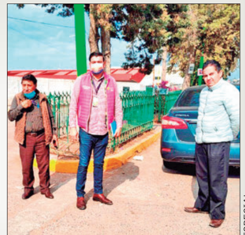
solicitudes para la instalación de plazas comerciales o negocios de alto impacto.