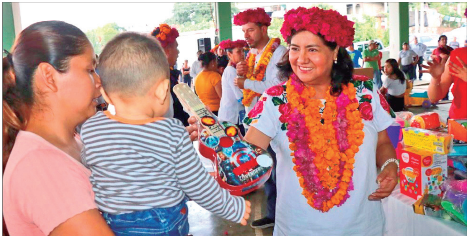
METAS. Llevar alegría a la niñez hidalguense que vive en la Huasteca.