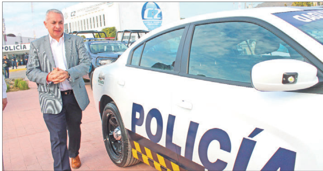
SERGIO BAÑOS. Entrega de unidades, así como equipamiento para elementos de la Secretaría de Seguridad Pública, Tránsito y Vialidad.

► Llamado del alcalde a ser partícipe en el combate a delincuencia; respaldo