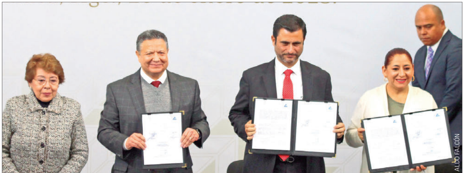
PRIMER CONVENIO NACIONAL. Julio Menchaca Salazar reconoció a la Confederación de Cámaras Nacionales de Comercio, Servicios y Turismo de los Estados Unidos Mexicanos como una organización seria y tradicional que ayudará a impulsar la economía hidalguense, ya que la entidad está ubicada en un punto estratégico, cercana a la zona metropolitana.

El gobernador, Julio Menchaca Salazar, signó dicho acuerdo con el presidente de Concanaco Servytur, Héctor Tejada Shaar; la meta es promover en plataformas digitales los atractivos hidalguenses para impulsar la economía y el sector turístico. 3