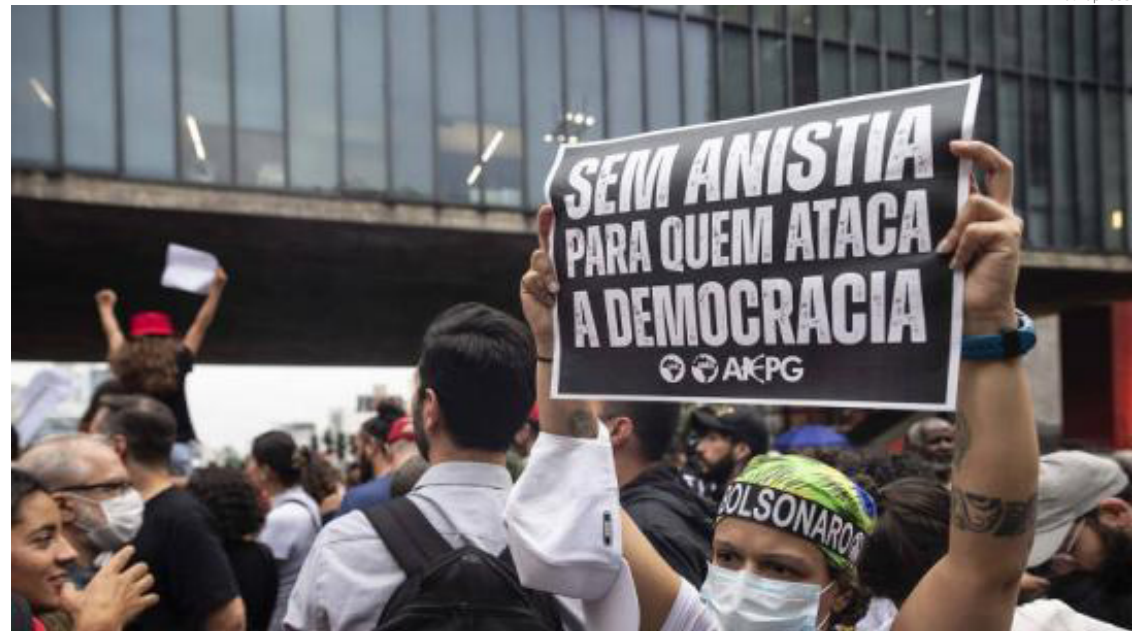
Manifestante en Sao Paulo pide cárcel sin amnistía para Bolsonaro.

Pero, como explicó en su edición online de este martes el diario “Folha de São Paulo”, la estrategia de Bolsonaro para salir indemne del peor ataque a la democracia en Brasil pasa