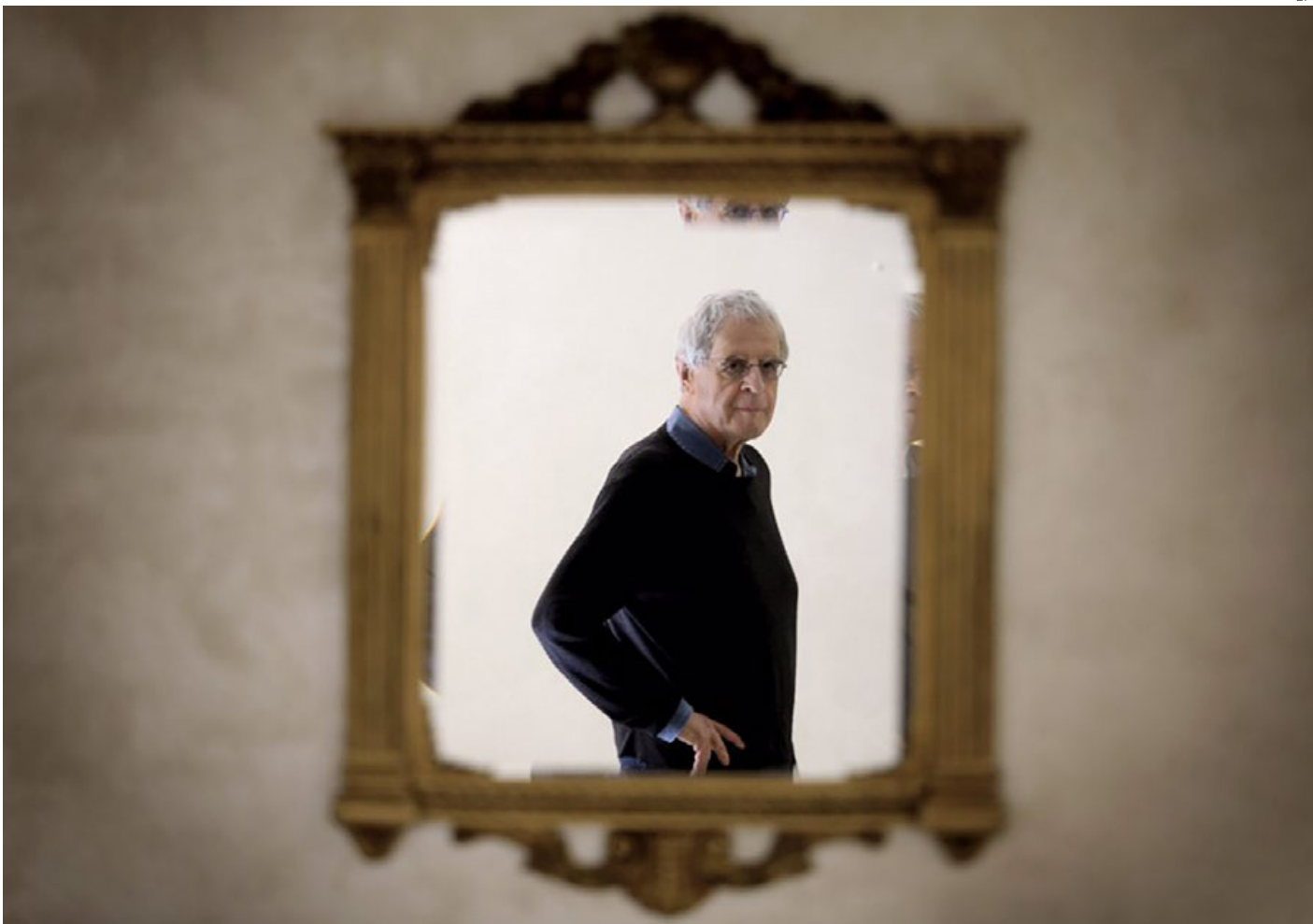
Pienso que vivir en Estados Unidos es como vivir en un tipo de institución donde todos están de acuerdo con algo, dijo Charles Simic.

Crónica presenta una entrevista inédita hecha al poeta y Premio Pulitzer 1990 que el pasado lunes falleció en Dover