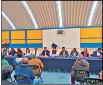
TULA. Seguimiento a los daños ocasionados por la inundación del año 2021.

► Mesas de trabajo conjunto entre las dependencias, en las que participaron autoridades municipales, ambientales y de salud