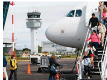
ASA transportó en total a 3.6 millones de pasajeros.

En este apartado, 10 son las terminales que registraron movimiento operacional positivo: Tamiún, con un crecimiento de 57%; Puebla, 40.9; Chetumal, 20.2; Puerto Escondido, 18.6; Tepic, 11; Loreto, 7.5; Guaymas, 5.8; Tehuacán, 5.5; Colima, 5; y, con un registro superior en 3.5 por ciento a lo alcanzado en 2021, el aeropuerto de Ixtepepec.