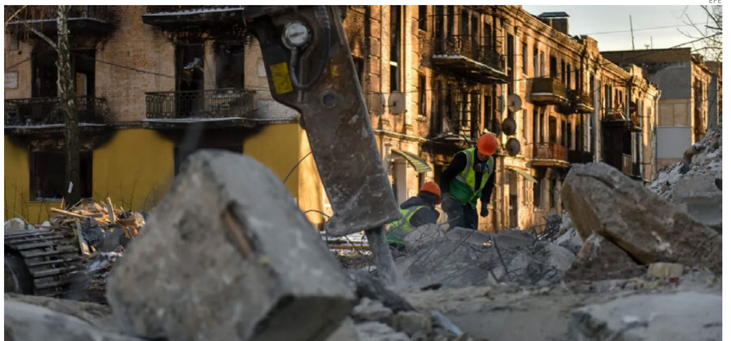
Edificios destruidos en la localidad ucraniana de Hostome.

Las situaciones más difíciles se dieron en las regiones de Zaporíyia (sureste), Járkov (este) y Jmelnytskyi (oeste) y los trabajadores de la red eléctrica están trabajando sin descanso para restablecer