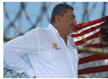
Cumplirá su sentencia en Miami.

La pena de 119 meses de cárcel impuesta a Comparán-Rodríguez por el juez Darrin Gayles es