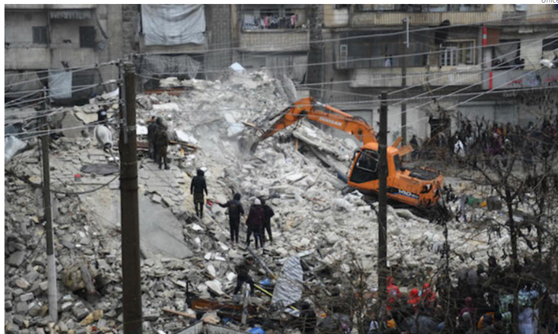
Un edificio derrumbado en la ciudad de Aleppo, en el norte de Siria.

También se puso en contacto con un responsable de Estados Unidos en el Consejo de Seguridad de la ONU para demandar una investigación sobre "por qué hubo negligencia en las zonas del noroeste de Siria, y por qué las ayudas llegaron a las zonas del