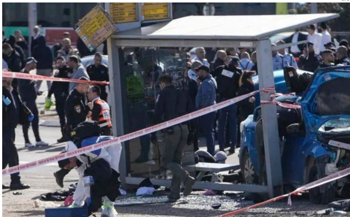
El atacante embistió a civiles con un auto en una parada de colectivo en Ramot.

Desde la Franja de Gaza, tanto el movimiento islamista Hamás como el grupo Yihad Islá-