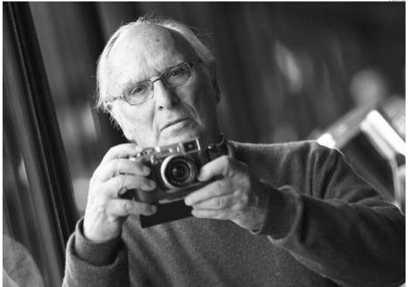
“Yo no he hecho cine para agradar a nadie o para recibir reconocimiento, lo he hecho porque me gustaba”, expresó el cineasta Carlos Saura.

Cuando era adolescente practicó la fotografía y a partir de 1950 realizó sus primeros reportajes con una cámara de 16 milímetros. Se trasladó a Madrid con la intención de seguir con la carrera de Ingeniería Industrial. A pesar de ello, su vocación por la fotografía, el cine y el periodismo lo hicieron abandonar más tarde los estudios industriales y matricularse en el Instituto de Investigaciones y Estudios Cinematográficos.