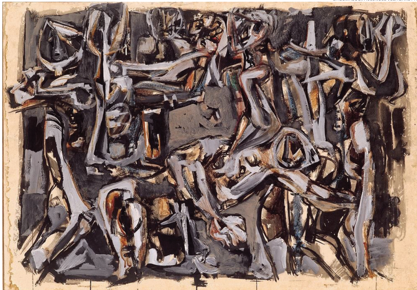
LA DEMAGOGIA 1953. JOSÉ VELA ZANETTI

En sociedades con menor desarrollo democrático, el error colectivo, que se ha repetido en México cada 6 años, es creer que el cambio o la confirmación de