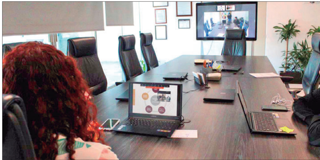
TEMAS. Unidad Especializada en Ética y Prevención de Conflictos de Interés asesoró a más de 250 personas del Poder Ejecutivo, Legislativo y Judicial, así como de los 84 ayuntamientos.

En la sesión virtual impartida por la Unidad Especializada en Ética y Prevención de Conflictos de Interés participaron más de 250 personas del Poder Ejecutivo, Legislativo y Judicial, así como de los 84 ayuntamientos, pa-