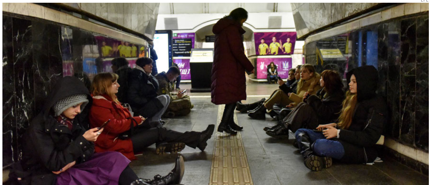
Personas en una estación de Metro durante la alerta de ataque aéreo en Kiev.