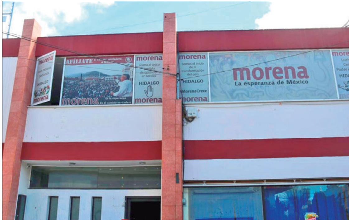
ATENTOS. Comité Ejecutivo Estatal aclaró que todo lo relacionado a registros de talleres y programas de capacitación, competen exclusivamente al Instituto Nacional de Formación Política

► Partido reitera que estos talleres son obligatorios para quienes aspiran a un cargo de elección popular en 2024