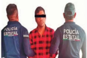
Se presume inocente, mientras no se declare su responsabilidad por la autoridad judicial.