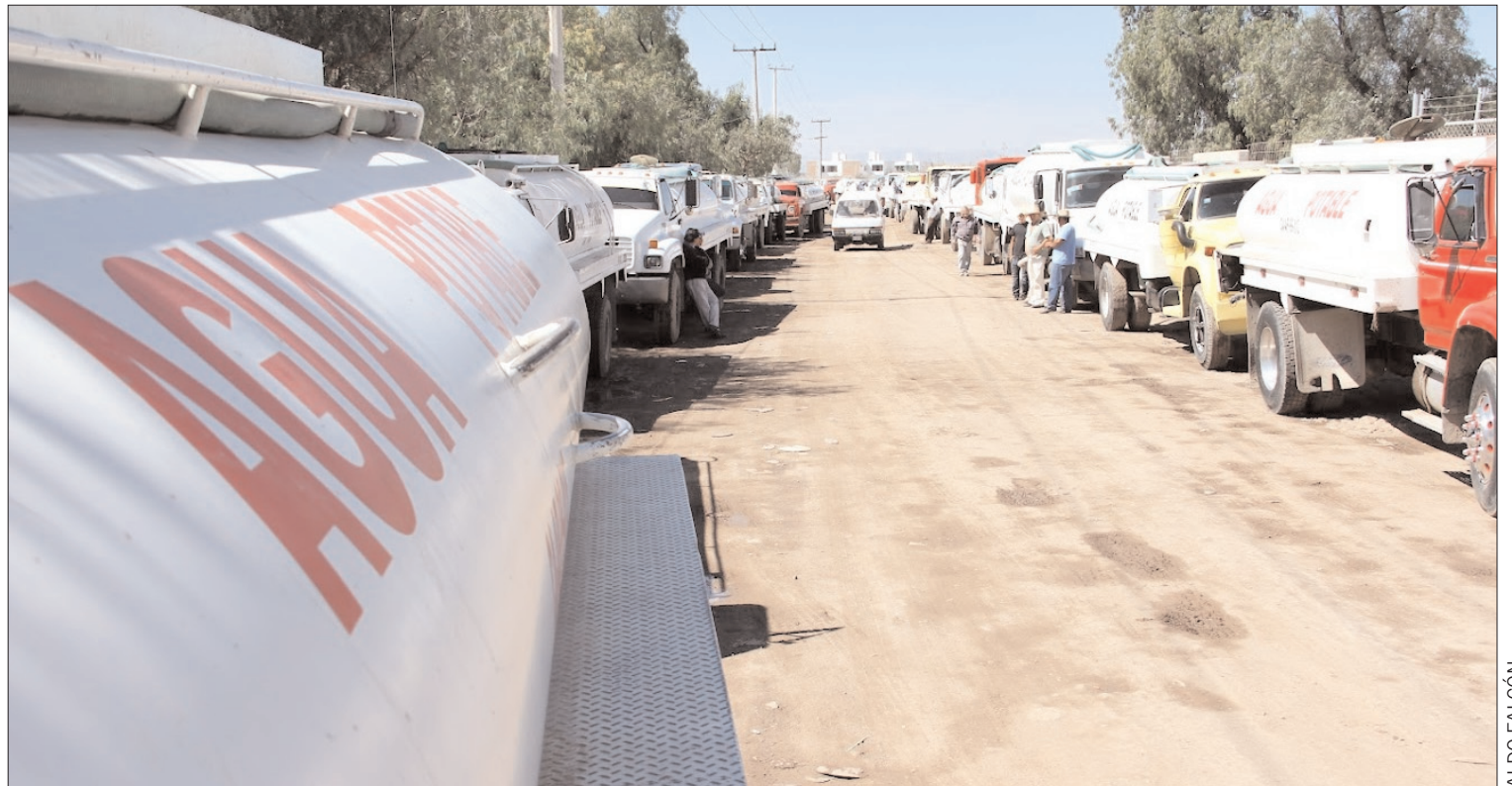
MARCOS. Habitantes solicitaron al organismo operador sensibilidad, ante necesidad de la gente.

Concluyeron con la premisa de que también se debe dejar en claro que en muchos casos la dependencia no ha atendido los llamados en las distintas colonias como se hace ver por medio de las redes sociales, por lo que se han visto en la necesidad de adquirir el líquido ante otras instancias.