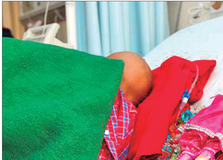
CÁNCER INFANTIL. Desarrollo de células anormales que se esparcen con rapidez en el cuerpo, provocando tumores o enfermedades en los pequeños, puede aparecer en cualquier momento de la niñez.

Por eso, citó la especialista, el Control de la Niña y del Niño Sano es una actividad que se lleva a cabo por un equipo multidisciplinario de manera periódica, en donde se supervisan varios aspectos de los infantes desde que nacen y hasta los cinco