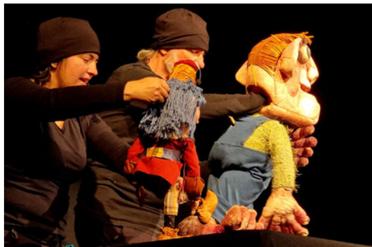
La Sastrecilla Valiente tendrá única función el domingo 19 de febrero a las 12:00 horas en el Centro Cultural de España.

Hemos tenido dos funciones en el Museo Nacional del Títere de Huamantla con lleno total, abriendo una temporada de programación nacional e internacional que ya promete para