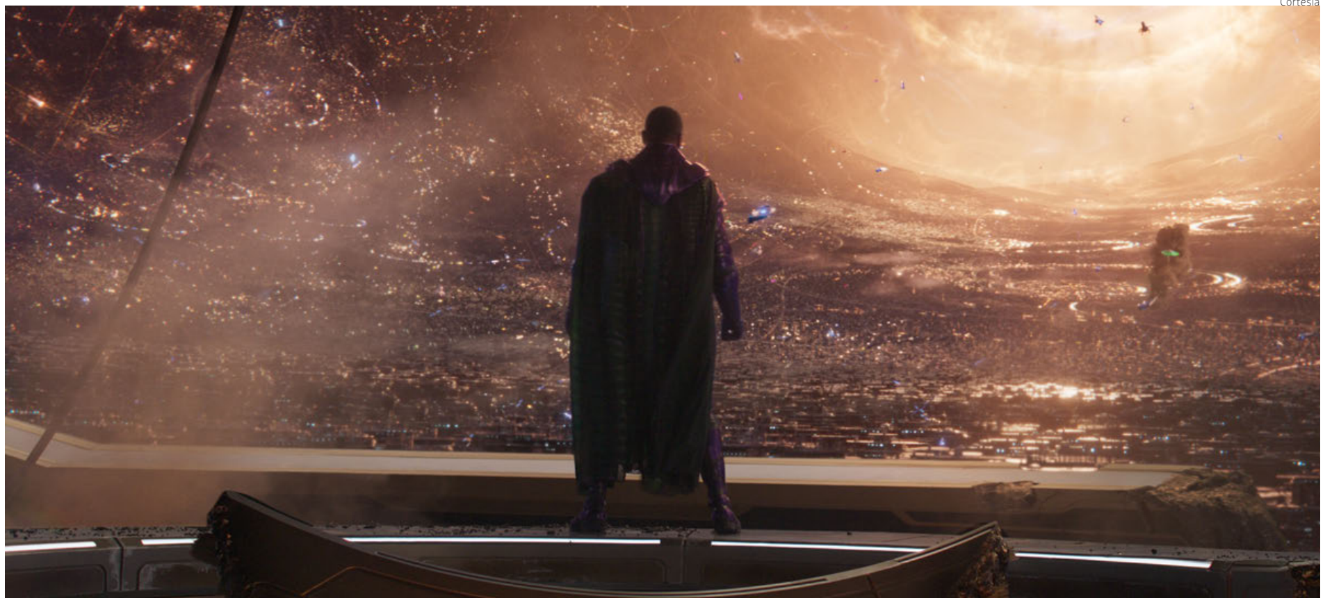
Fotograma del filme.

La nueva entrega de la saga de Marvel llegó este jueves a las salas de cine nacionales para presentar al gran villano de la Fase cinco de su mundo cinematográfico.