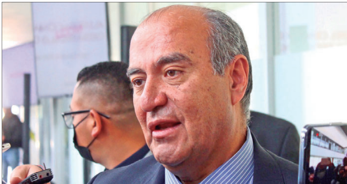
SEPH. Mientras no haya claridad de la fuente del presupuesto aún no se puede poner en marcha el programa citado.

Estos días se inicia el semestre del año, pero para llegar al programa será hasta agosto y faltan varios meses para determinar el