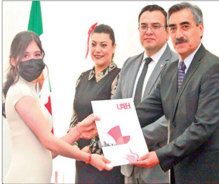
MÉTODO. Aprovecharon nueva carga académica de 2019 para que alumnado finalizara estudios del nivel medio superior en cinco semestres, sin que fuera un obstáculo para el correcto desarrollo de competencias, aptitudes y habilidades entre el estudiantado.

PREPA 3 Lograron el 100 por ciento de la eficiencia terminal, en esta generación