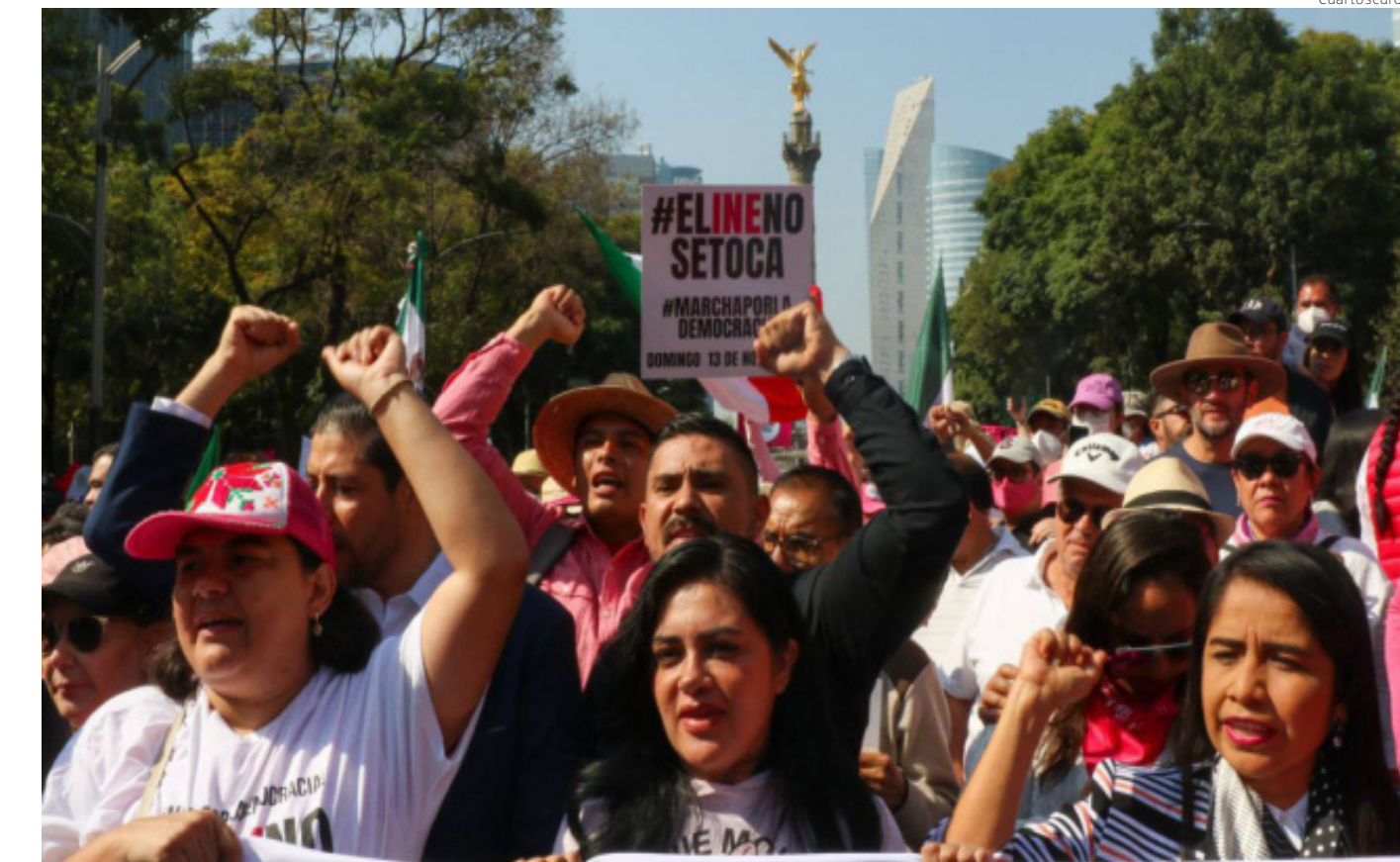
AMLO ya ha distorsionado la democracia mexicana, y la quisiera convertir en una entelequia, una mera fachada.

las frases de “yo sí pago impuestos”, como si no existiera el IVA y los asalariados formales no fueran causantes cautelosos. La idea de que el gobierno subsidia a “ninis”, quitándole el dinero a la clase media-alta. La de que ahora hay racismo inverso y llegó pura gente mal vestida y de pésimo gusto al poder.