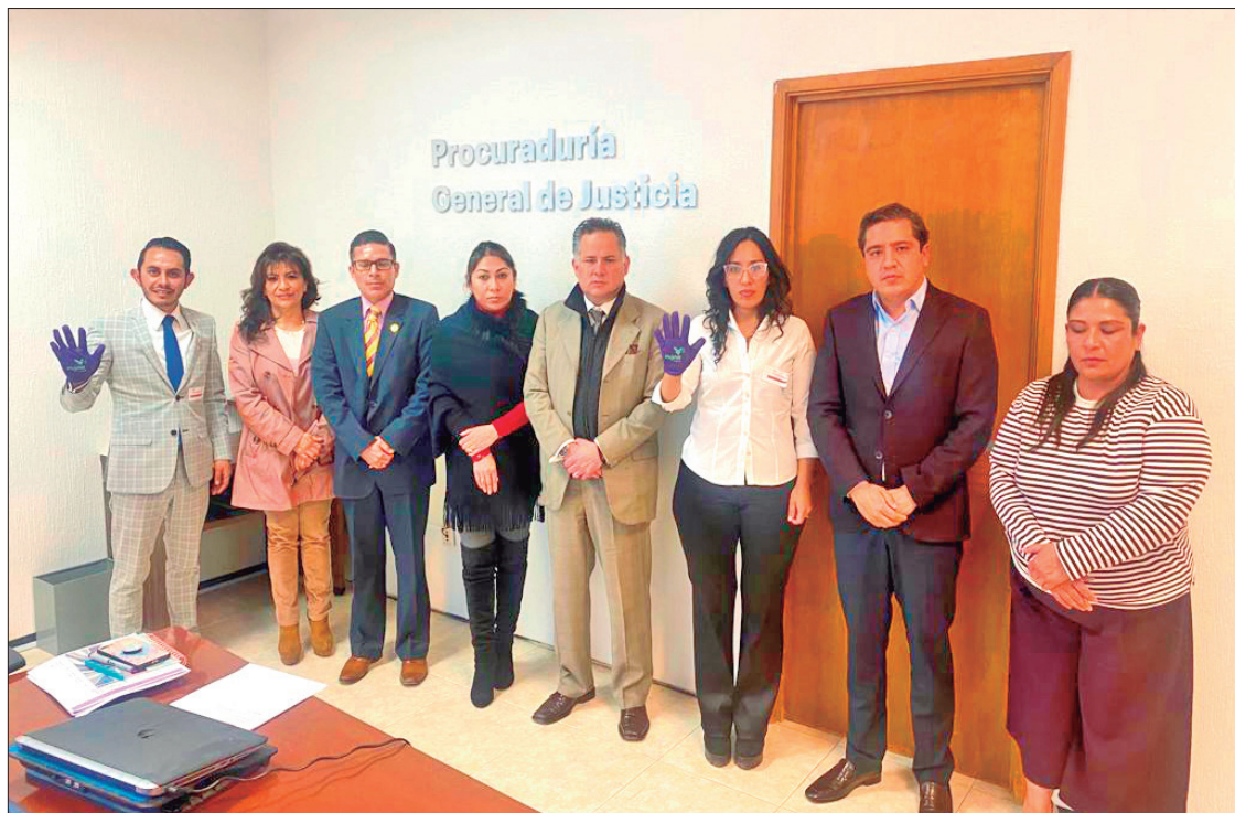
CAUCE. Reunión entre Asociación Civil, Mujeres Violeta y funcionarios de la PGJEH, encabezados por el encargado del Despacho, Santiago Nieto Castillo.