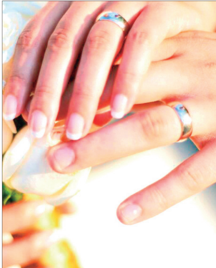
RUTA. Colectivos de mujeres promueven orientación hacia integrantes del sector para que conozcan las responsabilidades que conlleva vivir con alguien.

Integrantes de los colectivos apelaron a la sensatez de los padres de familia para guiar de forma adecuada a sus hijos e inculcarles la importancia del valor de la familia apegados también al respeto a los lineamientos jurídicos que avalan y dan certeza a los enlaces matrimoniales.