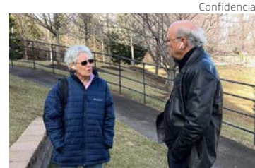
La histórica exguerrillera sandinista junto al periodista Carlos Chamorro, ex presos políticos de la dictadura de Ortega.

“Veo un proceso de enloquecimiento continuado, que empeora cada día. ¿Qué pretende sacar de la condena del obispo Álvarez? ¿Cree que lo va a quebrar? ¿Que lo va a doblegar? No lo va a doblegar. ¿Que va a hacer que