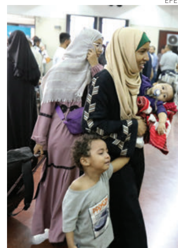
Iraquíes llegan a Bagdad desde Sudán.

este jueves no confirmó si se adhería a esta nueva tregua.