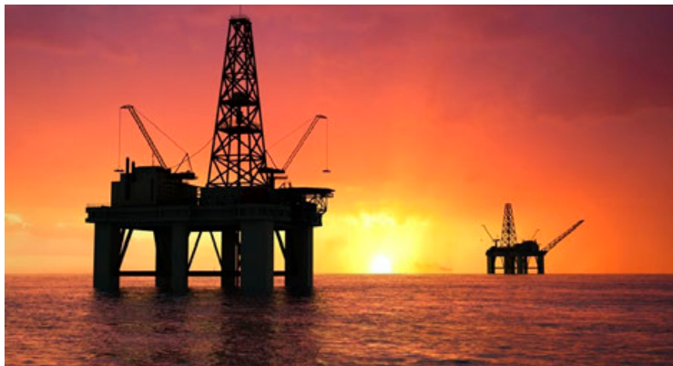
La extracción de petróleo avanzó 1.82 por ciento durante marzo de 2023.