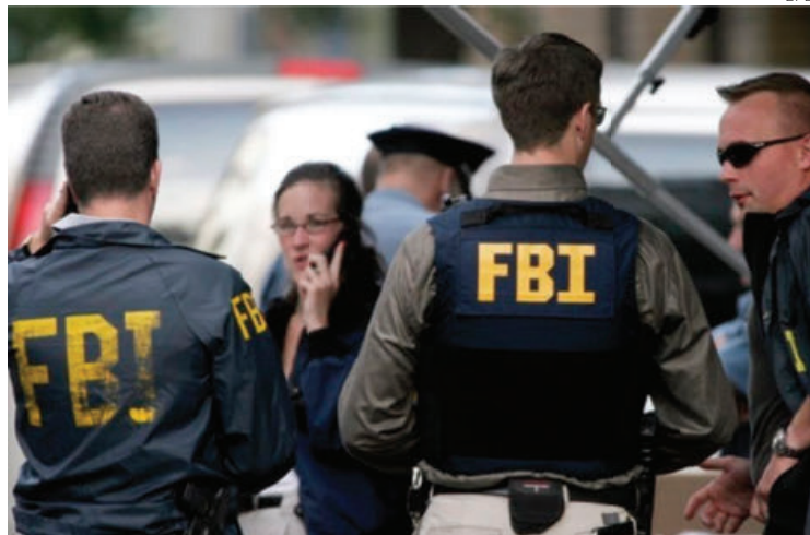
El FBI colabora con equipos de múltiples agencias dirigidos por fiscales.

Algunas ya dieron resultados como en el caso de los cargos contra los "Chapitos" y el Cártel de Sinaloa