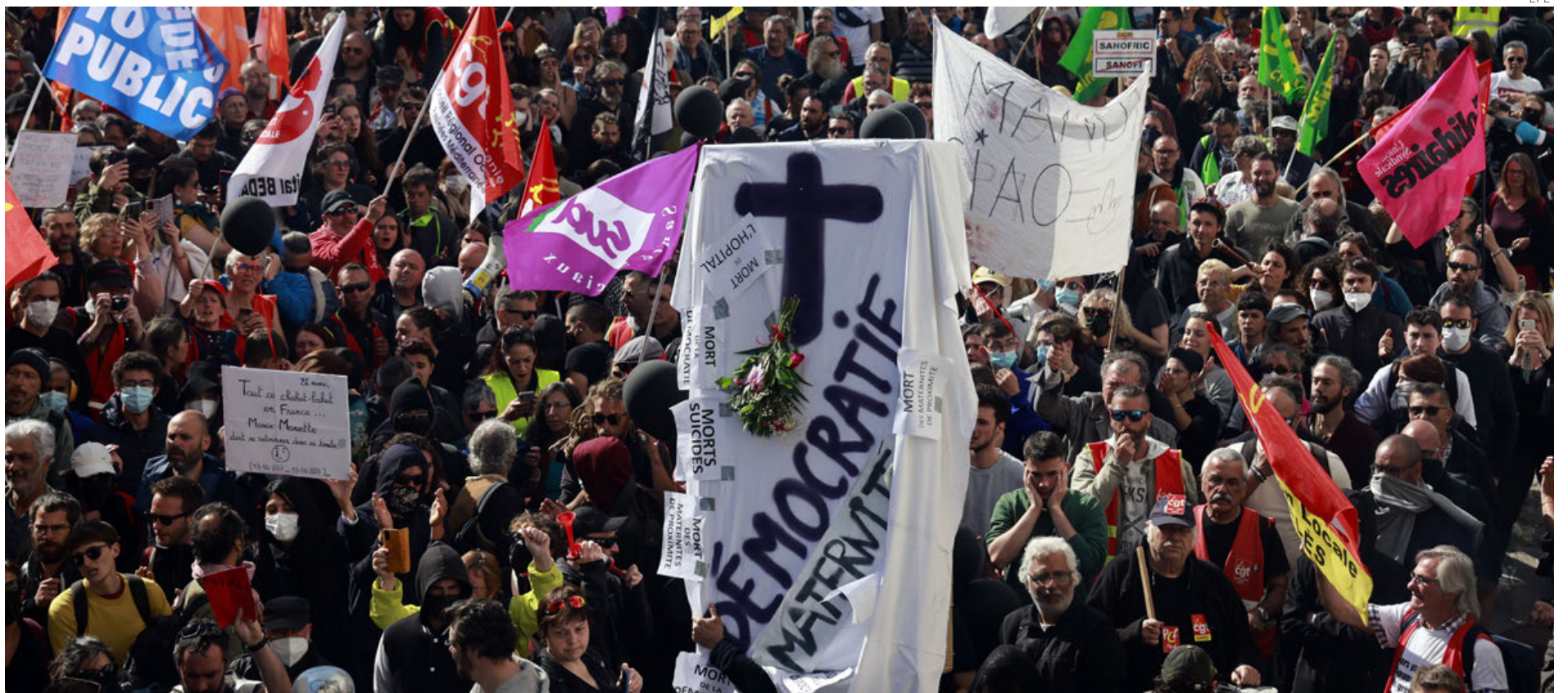
Los sindicatos franceses harán coincidir el Día del Trabajo con una nueva movilización nacional.