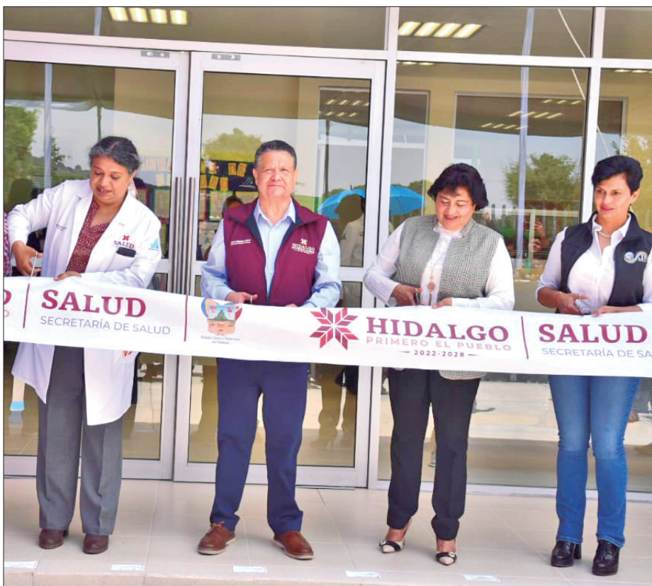
REDES. Con la sustitución del Centro de Salud en #Almoloya, estamos garantizando servicios médicos dignos para sus habitantes: gobernador.