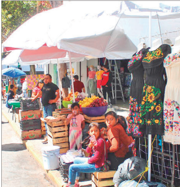
PLUS. Suspensión del tianguis que se ubicaba en el Jardín del Arte ha devuelto la actividad en calles del centro de la ciudad.

Expusieron que con todo y ese acierto, algunas calles como Guerrero y el entorno a la Plaza Constitución prevalecen con pre-