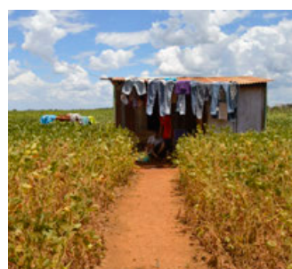
8 de cada 10 habitantes del campo se encuentran en pobreza extrema.

Esta forma pone de manifiesto que hay dos México contrastantes, por un lado, donde prácticamente 9 de 10 habitantes del medio rural viven en pobreza, lo que representa un dato abrumador. (Redacción / Agencias)