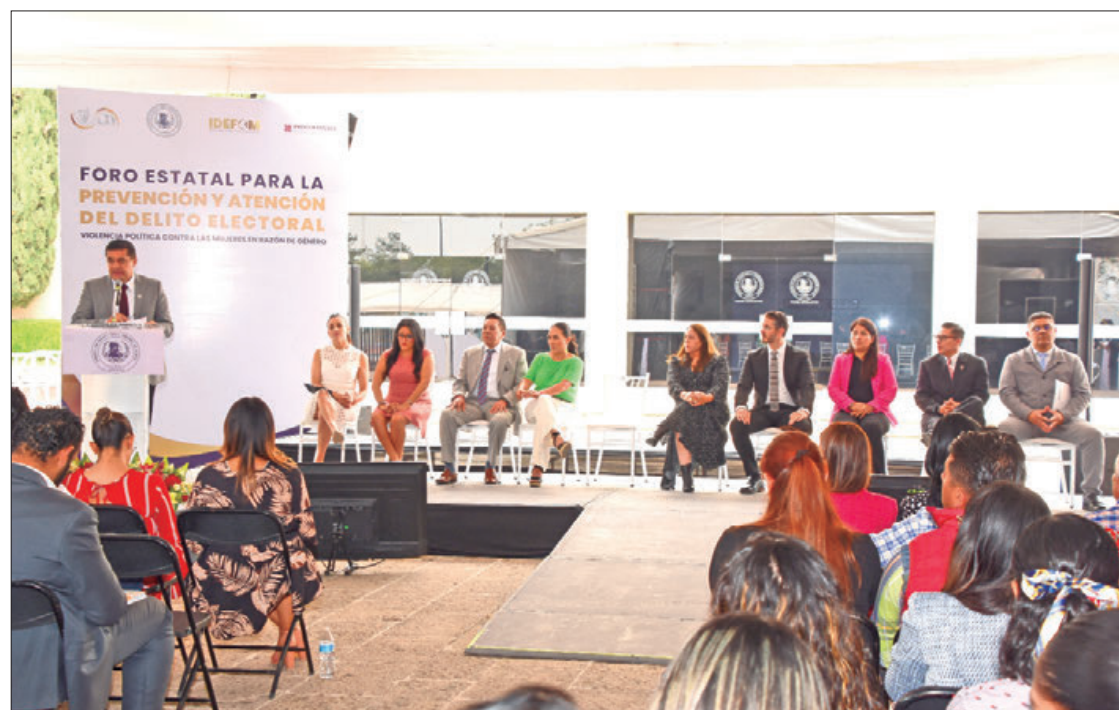
ACTIVIDADES. En la explanada del recinto legislativo se capacitó a presidentes municipales, regidores, síndicos y servidores públicos.

política es la capacidad e iniciativa de promover una acción colectiva; sin embargo, junto