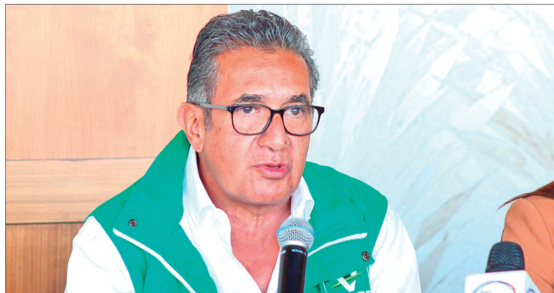
DISERTACIÓN. Existe la posibilidad que, en algunos ayuntamientos o distritos locales, de no aliarse con otros partidos.

"Como son cinco elecciones puedo decir que para la Presidencia de la República definitivamente podríamos ir en alianza, también podría considerarse a las senadurías, diputaciones federales, de alguna u otra manera en candidatura común, en fin, la propia forma de ser de cada elección nos permite tener diferentes escenarios que se tendrán que ana-