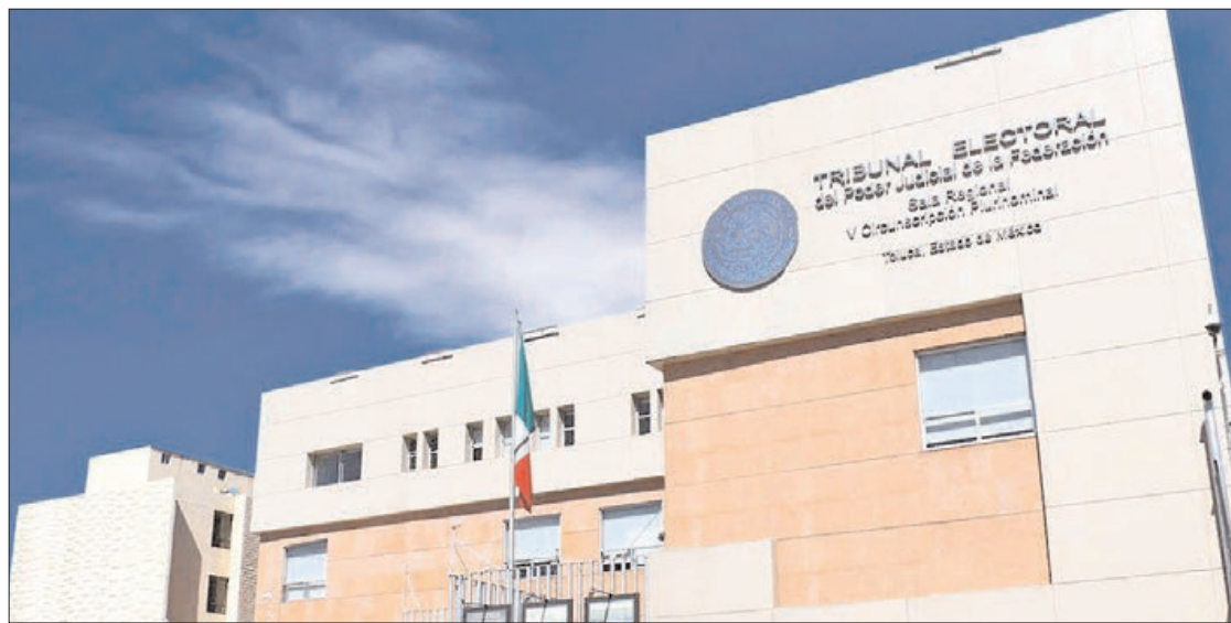
SÍNTOMA. Organismos que buscan constituirse como partidos locales recurren a todos los recursos legales para mantener su intención.

Respecto al juicio electoral, ST-JE-73/2023, declararon fundados los agravios sobre indebida fundamentación y motivación por parte del tribunal hidalguense, al desechar la demanda por extemporaneidad, pues el acto lo notificaron el 20 de febrero, entonces la agrupación tenía un lapso del 22 al 27 del mismo mes,