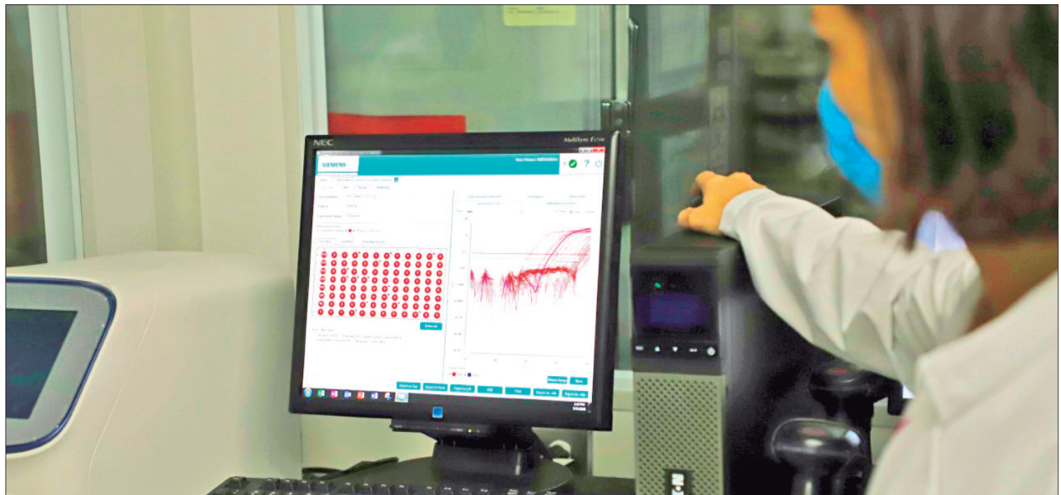
ESTADÍSTICAS. Actualmente se ha demostrado que el Virus del Papiloma Humano es la principal causa del cáncer cervicouterino.

El "Finipix" tiene como objetivo impulsar la creatividad, desarrollar un criterio propio, incrementar la capacidad de análisis, y sin duda, expresar las ideas y opiniones a través de una fotografía, pero también detectar talentos.