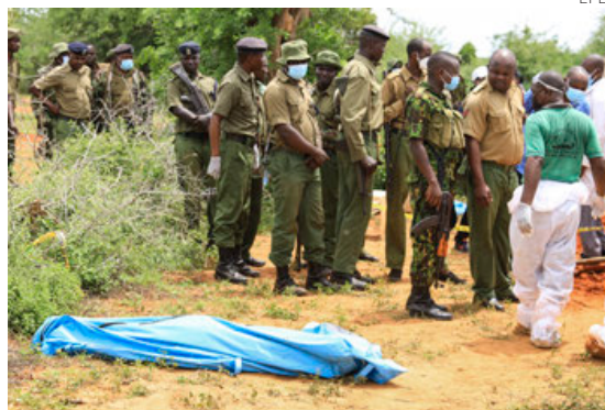
Detectives de homicidios de Kenia y expertos forenses examinan cuerpos exhumados.