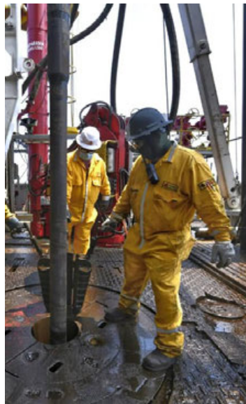
Trabajadores eventuales denuncian que esas plazas se están entregando a personal ajeno a Pemex.

La oficina de Octavio Romero Oropeza, de acuerdo a las denuncias presentadas ante Palacio Nacional, de las que este medio informativo tiene copias, indican que no se trata simple-