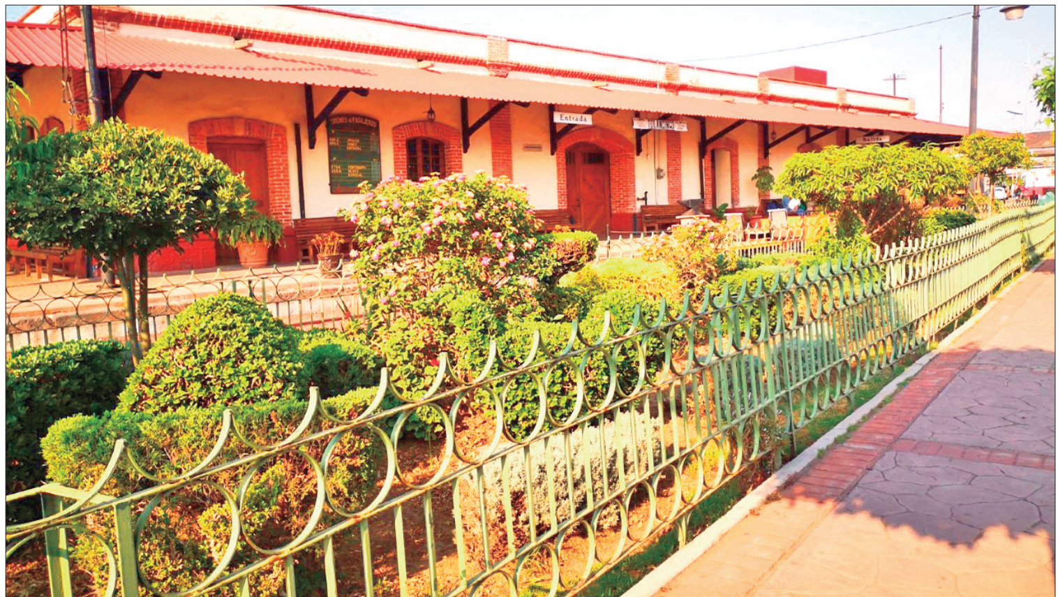
PROTOCOLO. El programa comenzará con un recorrido guiado por los tres recintos culturales, y la donación de una maqueta de la pirámide de Huapalcalco.

Esta celebración fue creada desde el año de 1977, a iniciativa del Consejo Internacional de Museos (ICOM).