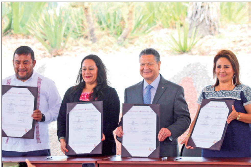
En compañía de la secretaria María Luisa Albores González, Julio Menchaca resaltó que en su administración el respeto al entorno representa un reto que requiere de la intervención de los tres niveles de gobierno y la sociedad.