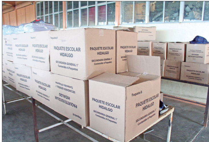
RECORDATORIO. La tarjeta es una promesa de campaña de mandatario hidalguense para que el canje útil escolares en las papelerías locales.

Recordó que su planteamiento es utilizar la tarjeta de Bienestar para los vales y uniformes escolares que van a entregar por