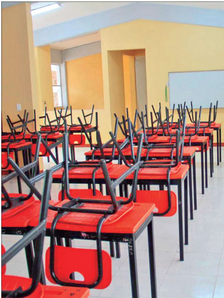
IMPETU. Esfuerzos a favor del respeto a las garantías y derechos humanos de los alumnos que han sido afectados.

PROMOVER VALORES Sobre todo, difundirlos entre los estudiantes para crear una nueva cultura de respeto