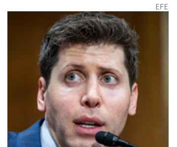
Sam Altman en el Congreso.

“Eso podría suceder de muchas maneras. Es por lo que iniciamos la compañía”, dijo, añadiendo que su empresa quiere trabajar con el Gobierno para evitar que ocurra.