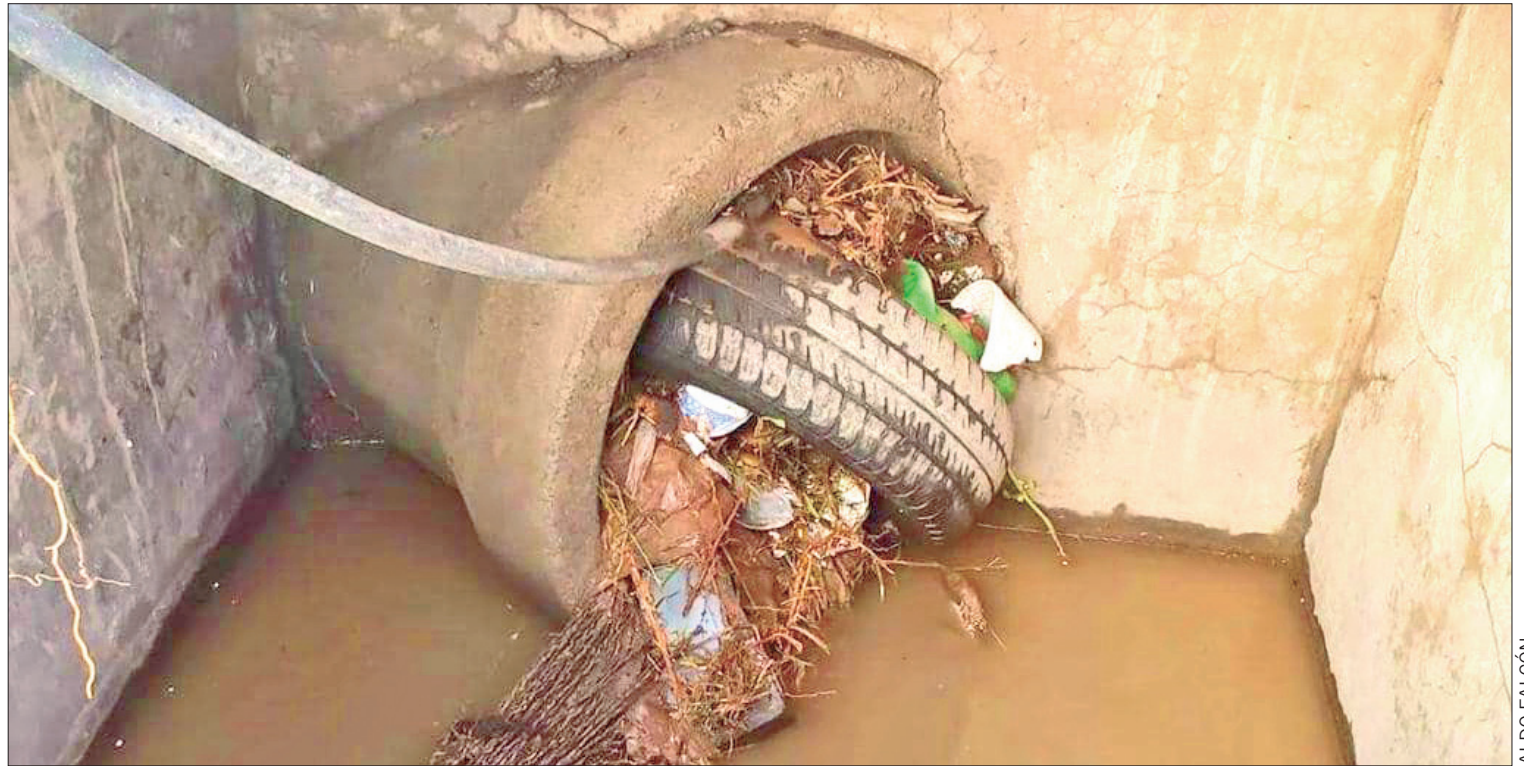
QUEJA. En Pachuca y La Reforma se ven lentos en la toma de decisiones para castigar estas conductas que atentan también contra el medio ambiente.

Brinda visitas guiadas para que la ciudadanía conozca todos los servicios que ofrecen las nueve salas o acuda a las diferentes actividades.