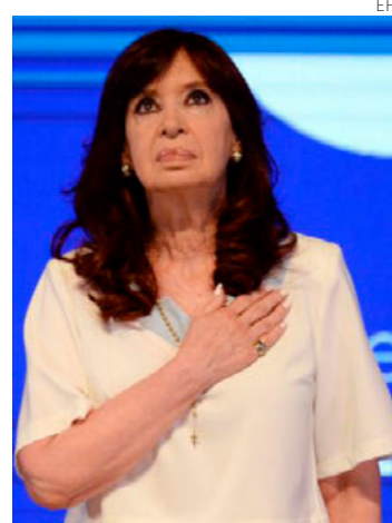
La actual vicepresidenta argentina.

Hace cinco meses, Fernández fue condenada a 6 años de pri-