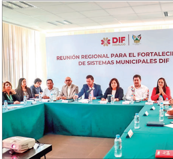
PREMISA. Resultado de la coordinación y cooperación entre sistemas será crucial.