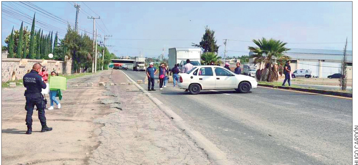
SITUACIÓN. El cerco carretero provocó un tráfico que se extendió por varios kilómetros por los tramos de El Arenal a Pachuca y El Arenal a Actopan.

Autoridades municipales, así como de Gobernación, ya mantenían acercamiento con los manifestantes a fin de escuchar sus demandas.