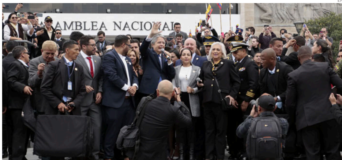
Lasso se dirige a los periodistas, seguidores y detractores que se concentraron frente a la Asamblea Nacional.

Según la oposición —dominada por seguidores del expresidente Rafael Correa—, Lasso incurrió en un supuesto peculado al tener conocimiento de presuntas