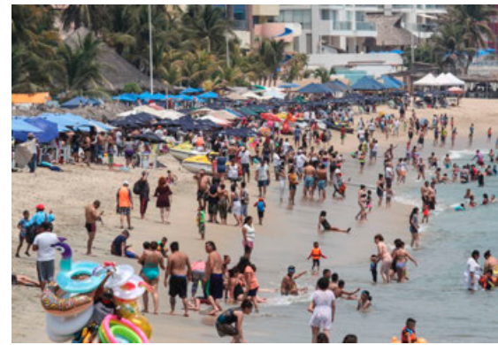
19.8 millones de turistas visitaron 70 destinos turísticos de México en los primeros tres meses del año.

Los inconformes, que aparecen en la documentación, aunque este medio informativo se reserva su nombre, abundaron en que se está contratando de planta a personal de confianza que no cuentan con los conocimientos técnicos ni formación académica que demanda el desempeño en las instalaciones de Pemex.