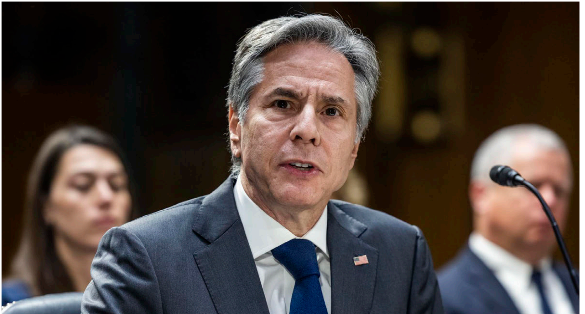
El secretario de Estado de EU, Antony Blinken, este martes en el Senado.