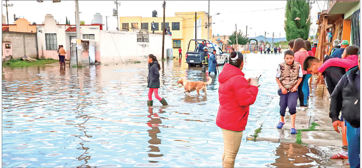
ANTECEDENTE. En el año 2022, nueve ciclones tropicales tuvieron efectos importantes en el país, aunque no se presentaron daños de consideración para Hidalgo.

heces con cal, si no se tiene acceso a estos