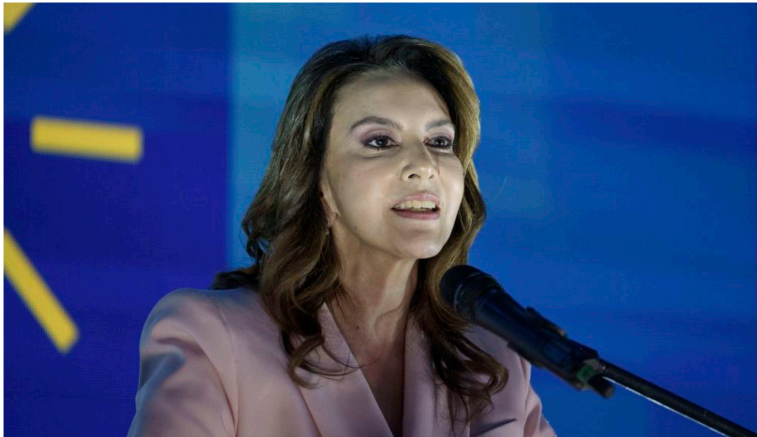
Zury Ríos, candidata conservadora e hija del dictador guatemalteco Efraín Ríos Montt.