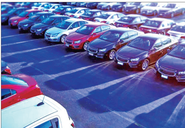
ESTADÍSTICAS. Según datos de AMDA en la entidad se comercializaron 2 mil 452 vehículos nuevos.

Consideró que no tener un crecimiento en las ventas de unidades, es por las políticas que aplican las empresas de la distribución de coches, derivado de los escasos que se presentó por la pandemia, dan prioridad a plazas y estados con mayor comercialización