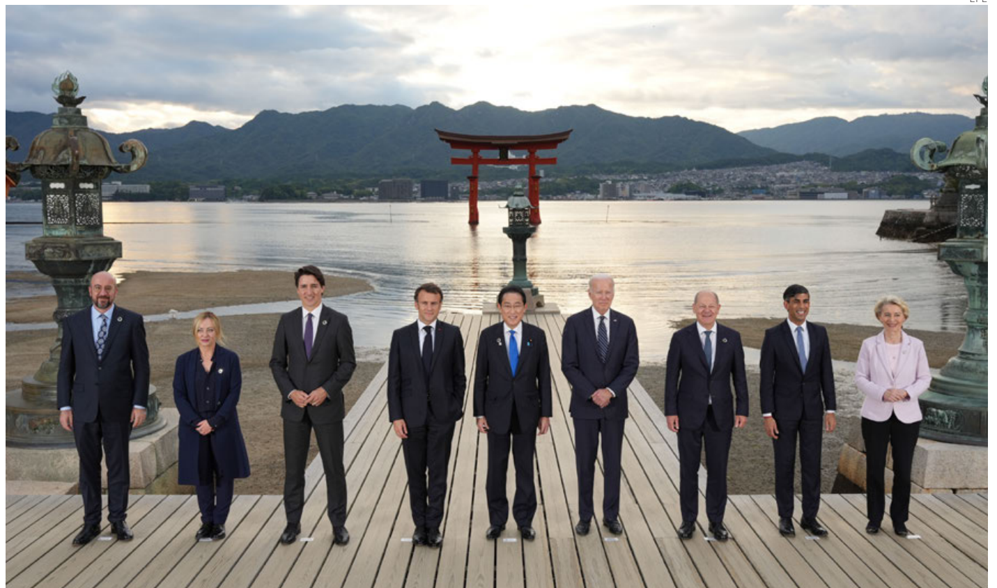
Las sanciones fueron decididas en coordinación con el G7, Australia y otros socios.

Las sanciones tienen en cuenta también a aquellos individuos implicados en