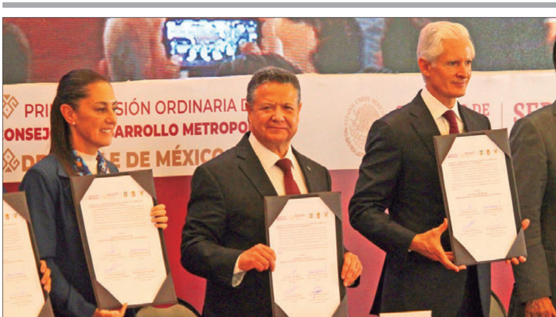
EN PACHUCA. Realizan primera sesión ordinaria del Consejo de Desarrollo Metropolitano del Valle de México 2023; aprobaron seis acuerdos que incluye una agenda metropolitana, crear un corredor logístico industrial y mecanismos de financiamiento, analizar la integración de 13 municipios hidalguenses a la ZMVM.

Celebraron la primera sesión ordinaria del Consejo de Desarrollo Metropolitano del Valle de México 2023 con la asistencia de los gobernadores de Hidalgo, Julio Menchaca Salazar; Alfredo del Mazo Maza, del Estado de México; y Claudia Sheinbaum Pardo, jefa de Gobierno de la Ciudad de México; donde aprobaron seis acuerdos que incluye una agenda metropolitana, crear un corredor logístico industrial y mecanismos de financiamiento, analizar la integración de 13 municipios hidalguenses, así como actualización de condiciones de aprovechamiento de recursos hídricos y del reglamento interior. .3