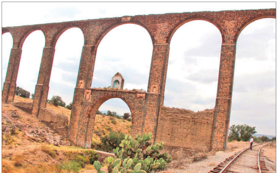
DINÁMICA. Estar atentos para reportar cualquier incidente relacionado con las precipitaciones pluviales.

Coincidieron que la atención que pueda brindar las instancias correspondientes a una emergencia depende mucho de la multitud de las llamadas de auxilio, por lo que en ese sentido convocaron a los habitantes de los municipios de la zona a estar atentos para reportar cualquier incidente relacionado con las precipitaciones pluviales.