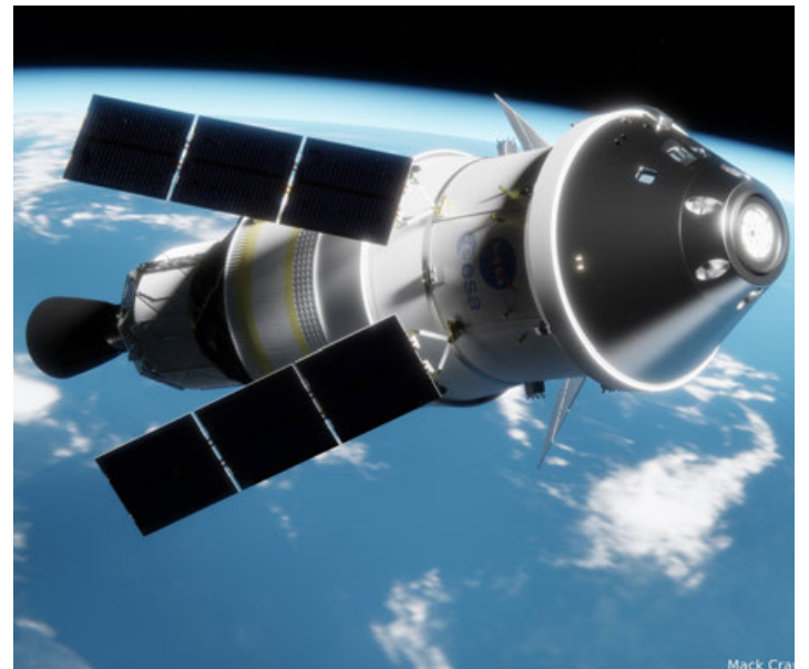
Blue Origin es propiedad del magnate Jeff Bezos.

La NASA ha elegido a la empresa aeroespacial Blue Origin, propiedad del magnate Jeff Bezos, para desarrollar un sistema de aterrizaje que permita llevar astronautas a la Luna bajo la misión Artemis.