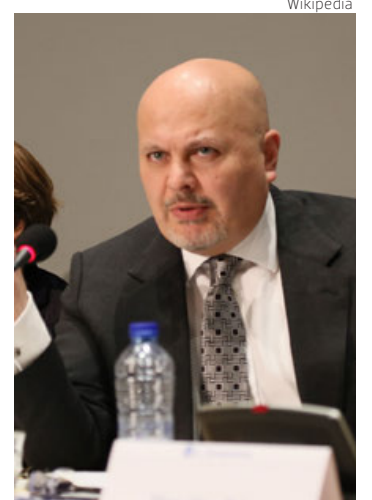
Karim Ahmad Khan, fiscal de la Corte Penal Internacional.

En respuesta a estas órdenes de arresto, el Comité de Instrucción de Rusia (CIR) abrió un caso penal contra el fiscal y los jueces de la CPI, argumen-