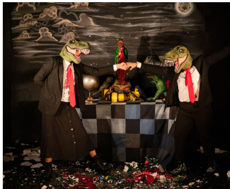
“Corruptocracia” estará hasta el 31 de mayo en La Capilla.

Desde el principio se aplicaron las alteraciones necesarias. Por ejemplo, “originalmente los dos personajes eran hombres, le cambiamos el género a uno