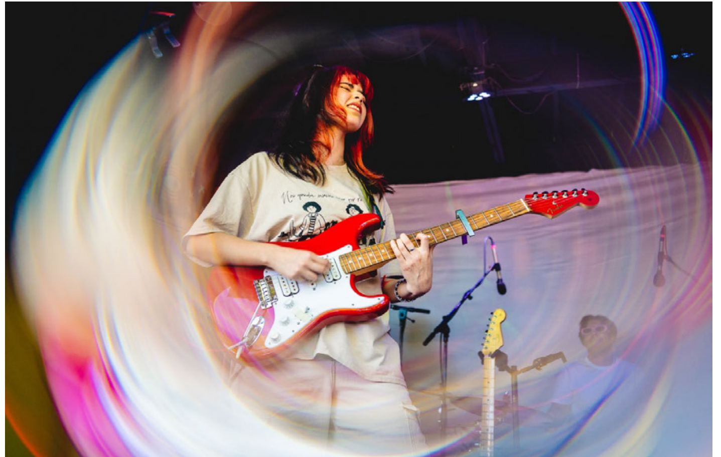
Imagen de su presentación en Coachella.

Tras el lanzamiento de dos álbumes de estudio, Delusión (2019) y tdbn (2021), Bratty comenzó este 2023 con el lanzamiento de un nuevo sencillo, “Continental”, en colaboración con Ns-