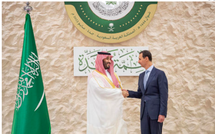
El príncipe de Arabia Mohammed bin Salman y el presidente sirio Bashar al-Assad.

Los jefes de Estado instaron a detener “la injerencia extranjera” y reiteraron su apoyo a la causa palestina