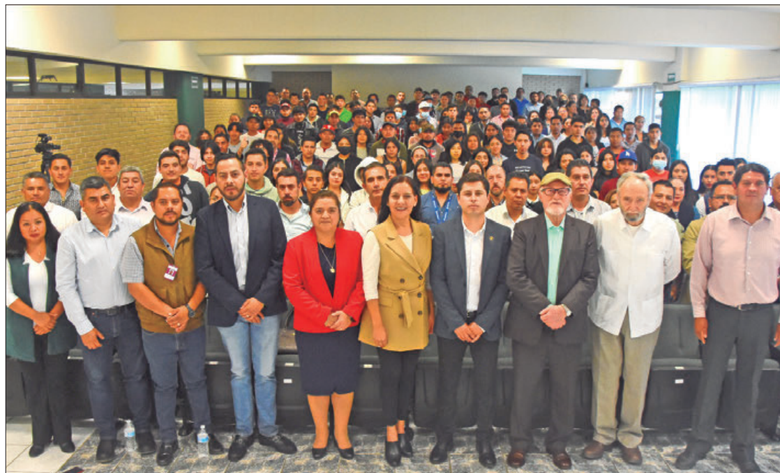
SENTIDO. Explica legisladora que a través de los foros recabarán información para armonizar la ley para Hidalgo de ciencia y tecnología.

La presidenta de la Primera Comisión Permanente de Ciencia y Tecnología, mencionó que son 13 los foros a realizarse en diferentes municipios para que puedan participar pues junto con académicos, científicos,