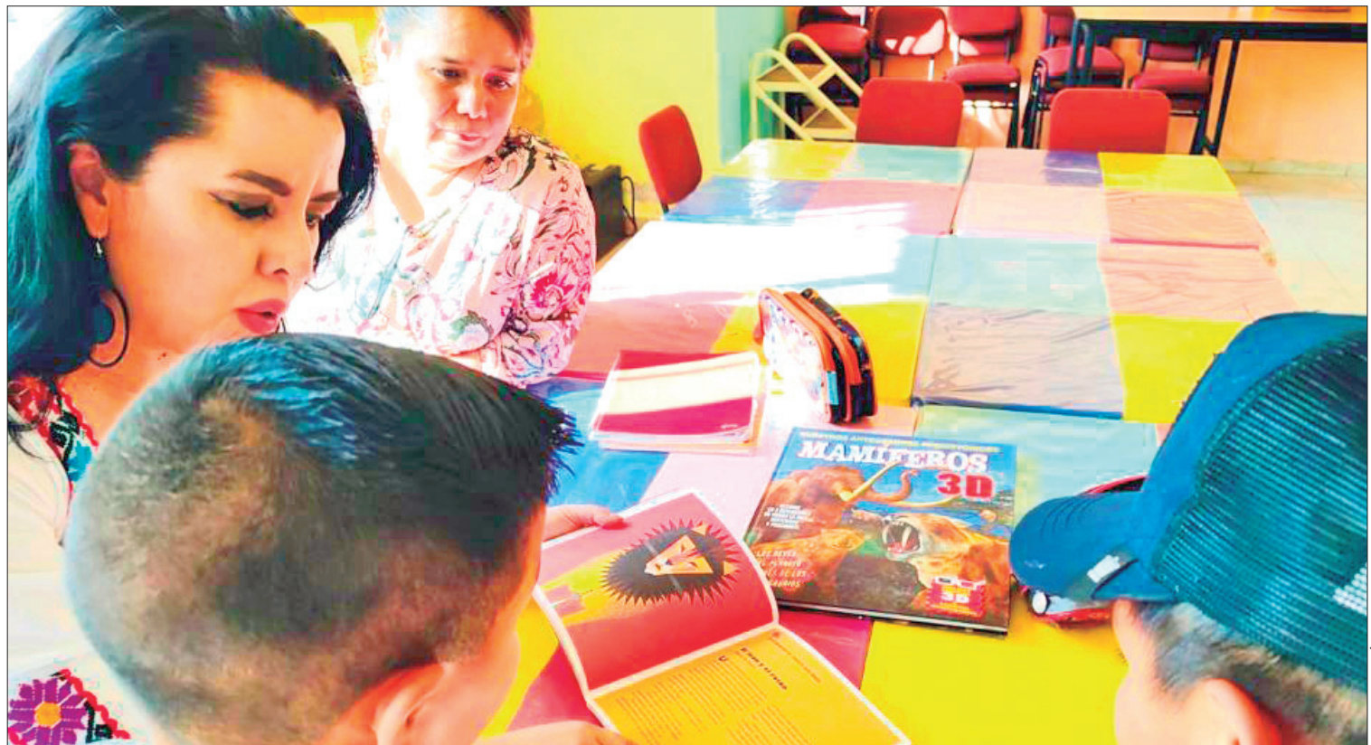
ALCANCE. Desde febrero pasado, atienden a usuarios del Centro Gerontólogo Integral, Casa de Día y desde 2022 realizan actividades de lectura y lúdicas, en la Residencia del Adulto Mayor.

De esta manera, la actual administración se preocupa por que los jóvenes estén actualizados en relación a información que los beneficie, para su desarrollo tanto físico como mental. (Staff Crónica Hidalgo)