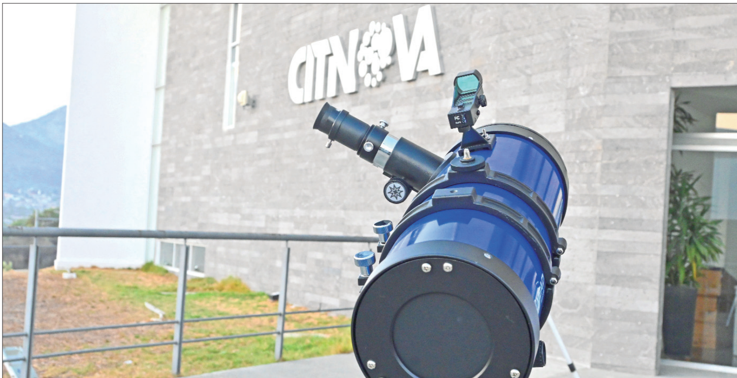
LEGISLACIÓN. El objetivo de esta Ley es apoyar y promover la investigación científica, la innovación y el desarrollo tecnológico.