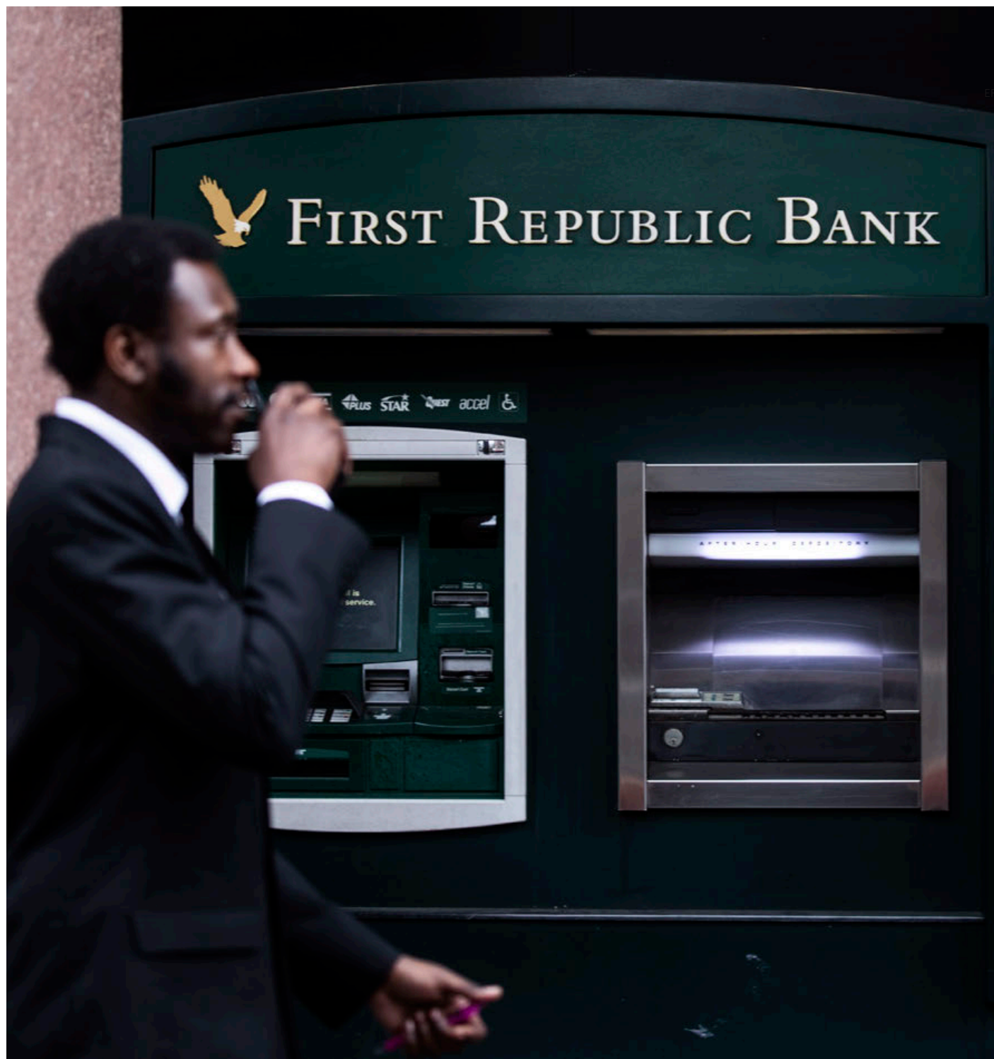
Un agente de seguridad vigila este lunes una sucursal del First Republic Bank en Los Ángeles, donde la jornada transcurrió en total calma.

El acuerdo garantiza los depósitos en los bancos medianos del país, como pidió Biden para que no cunda el pánico