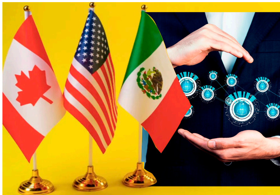
La incorporación en México de nuevas empresas y tecnologías podría desaprovecharse.

Sostuvo que los cambios a la Ley minera “generan un ambiente de incertidumbre y volatilidad que puede reducir la atracción de inversión y la competitividad del país”.