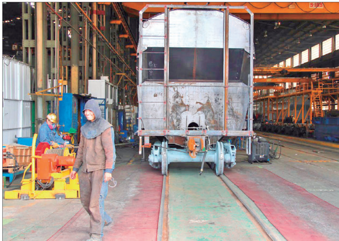
MENSAJE. Este 1 de mayo es un día para reconocer sus derechos.

El ataque a la corrupción debe llegar hasta donde tope, sabemos que vamos a herir y pisar callos, van a venir ataques y descalificaciones, pues ni modo es parte el trabajo.