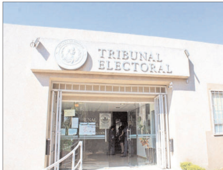
RASGOS. La asambleísta pidió la reserva de sus datos personales.

En la sentencia local enfatizaron que las pruebas testimoniales notariales ofrecidas por