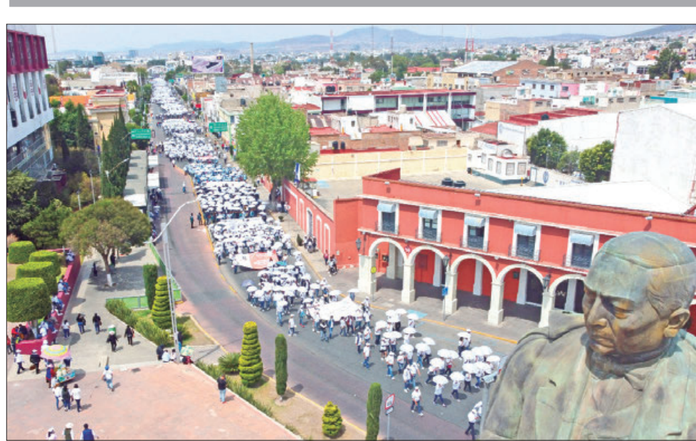
VOLUMEN. Los contingentes que formaron parte de la conmemoración del Día del Trabajo fueron encabezados por los miles de maestros afiliados a la Sección XV del SNTE.