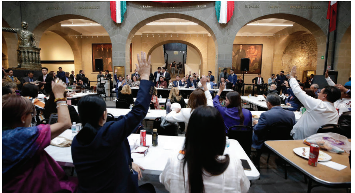
La madrugada del sábado el Senado aprobó una serie de reformas, la mayoría enviadas por el presidente Andrés Manuel López Obrador.

Más importante que las iniciativas que votaron los senadores de Morena junto con sus asociados de PVEM, PT y PES,