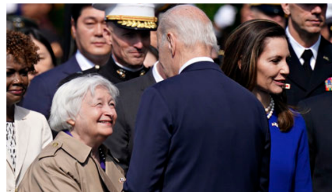
Janet Yellen saluda al presidente Biden durante una ceremonia la semana pasada en la Casa Blanca.

En la crisis financiera de 2008, el entonces presidente George W. Bush (2001-2008) sí que tuvo que usar el dinero de las arcas del Estado para financiar un rescate de 700,000 millones de dólares en activos hipotecarios en manos de los bancos, en lo que supondría la mayor intervención de la historia desde la Gran Depresión de los años 30.