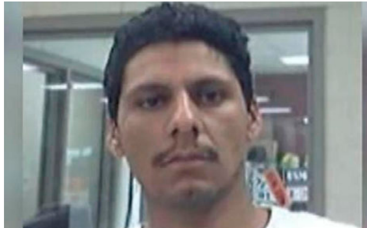
Foto distribuida por la Policía de Texas sobre el sospechoso de la masacre, Francisco Oropesa.

El mexicano Francisco Oropesa, fugado de la justicia tras asesinar a sangre fría a cinco inmigrantes hondureños el pasado viernes en Cleveland (Texas), había sido deportado cuatro veces de Estados Unidos antes de volver a entrar irregularmente en el país la última vez, informaron este lunes las autoridades estadounidenses.