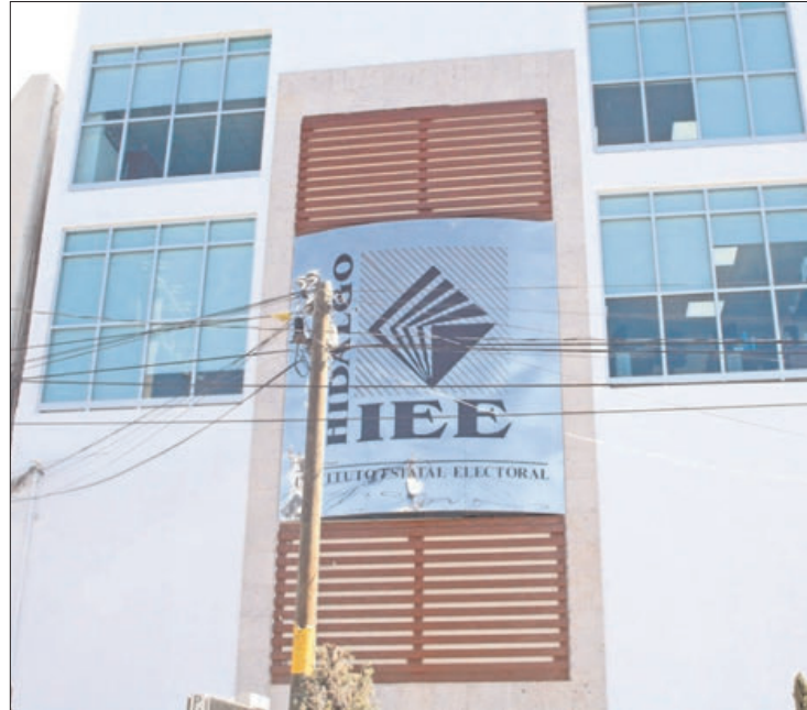
SITUACIÓN. Adeuda el gobierno del estado más de 15 millones 652 mil pesos al Instituto Estatal Electoral.

El Instituto Estatal Electoral dio a conocer que la diferencia pendiente de ministrar obedece