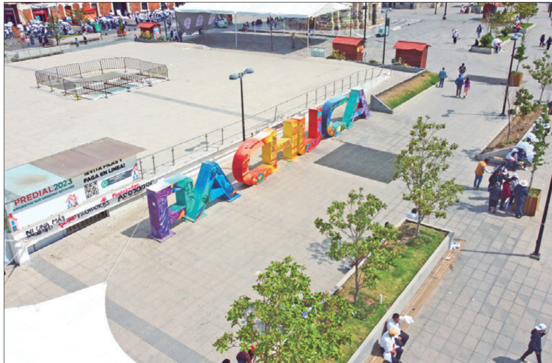
ESTADÍSTICAS. La afluencia de paseantes se presentó desde el pasado viernes en los Pueblos Mágicos, Pueblos con Sabor, corredor de los balnearios y parques acuáticos y zonas naturales.

Con estos resultados las expectativas se cumplen por parte de los prestadores de servicios y turísticos, además de las campañas que hace la Secretaría de Turismo del gobierno del estado de Hidalgo.