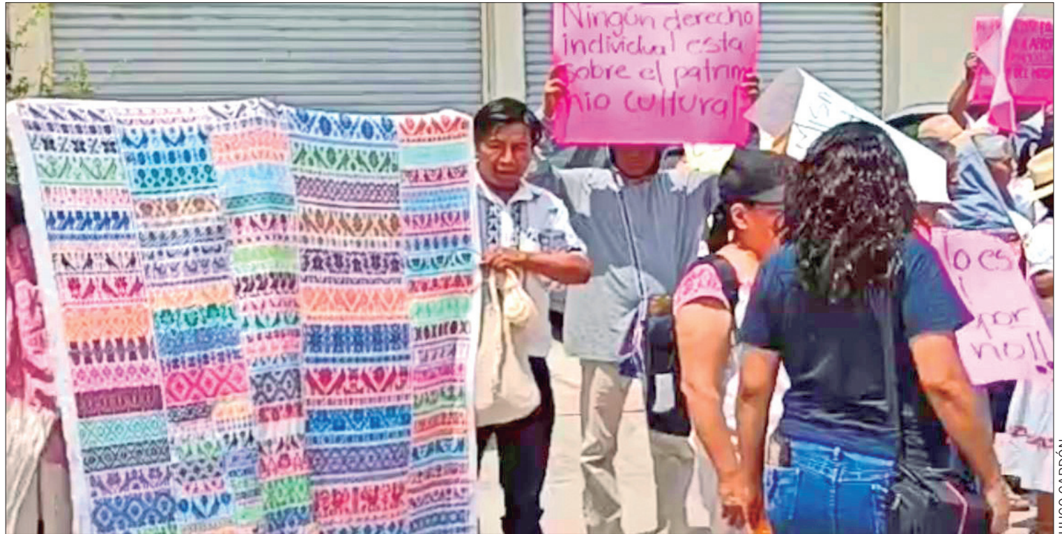
PROTESTAS. Artesanos mantienen inconformidad por el tema de la muñeca Nxutsi.

Dijo que con esta tecnología la proyección es tener un enlace con el sistema C5i para coadyuvar con la labor del estado y la federación para la ubicación de vehículos robados, asimismo dijo, que aun cuando es un proyecto de Actopan, también serán beneficiados municipios de la región. (Hugo Cardón Martínez)