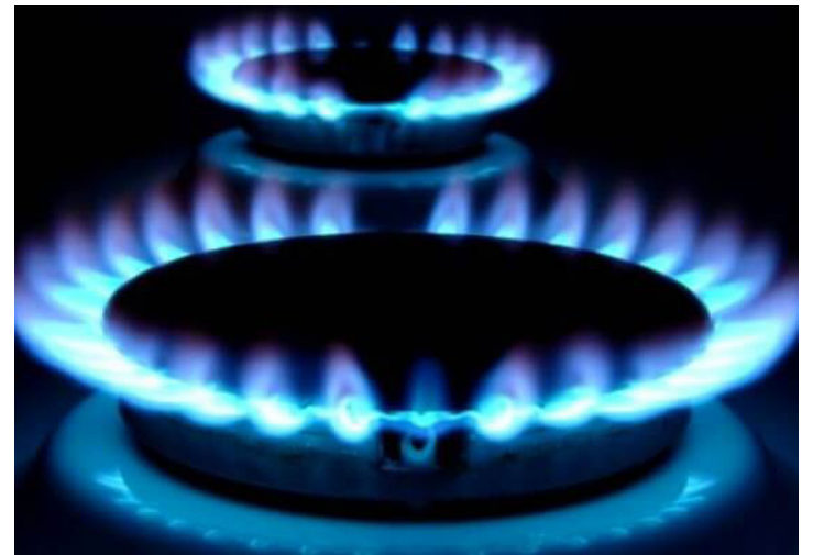
Gas metano en uso doméstico.

El uso de pulsos de rayos X acerca a los científicos un gran paso hacia el desarrollo de mejores catalizadores para transformar el metano, gas de efecto invernadero, en una sustancia química menos nociva.