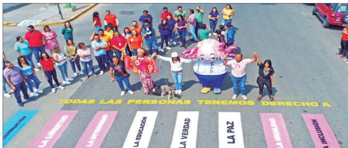
Colectivos de la comunidad LGBT+, representantes populares y de la Comisión de Derechos Humanos de la entidad, realizaron una pinta de pasos peatonales con los colores del Pride, en conmemoración de la lucha por los derechos de este sector poblacional.

"Hidalgo debe sentirse muy orgulloso de su cultura y tradición, seguimos trabajando muy fuerte para conservar el arte de cada región. Aquí hay dignidad y valor, mi reconocimiento a quienes a través de la cultura impulsan el estado que queremos", subrayó. .3