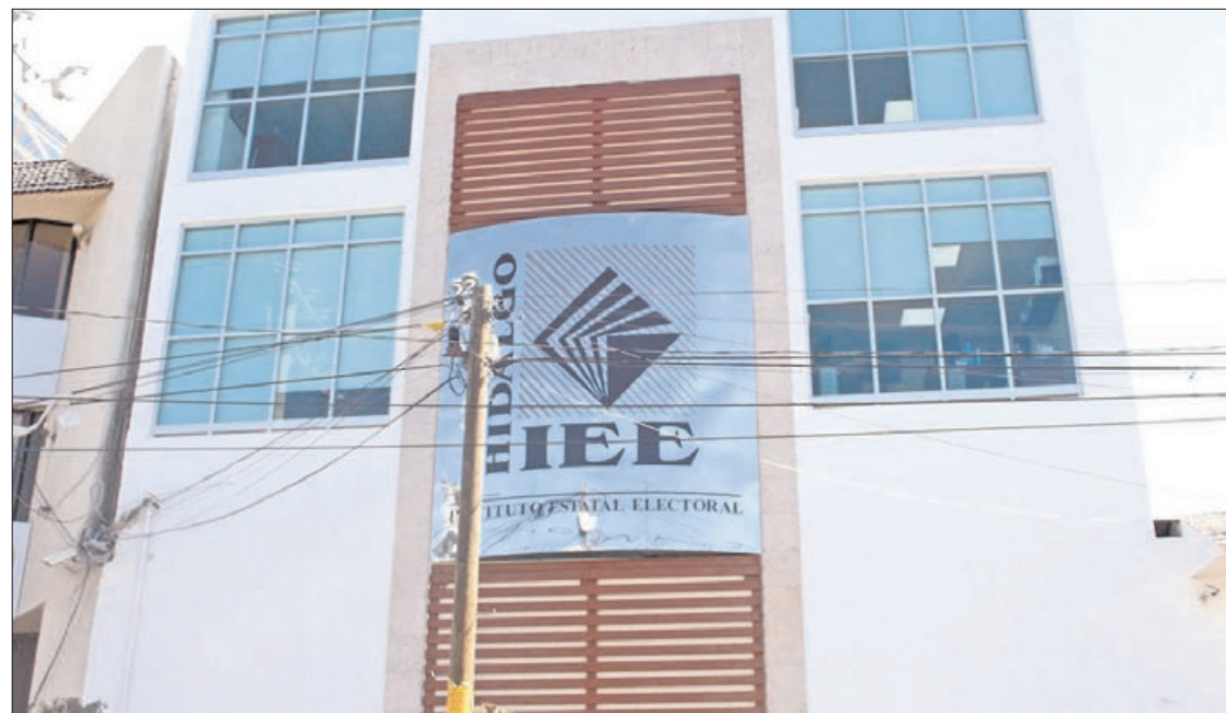
BALANCE. En el rubro de armonización contable correspondiente al primer trimestre del año, el Instituto Estatal Electoral ya devengó 43 millones 141 mil 492 pesos.

Como dato relevante, en el rubro de armonización contable correspondiente al primer trimestre del año, el Instituto Estatal Electoral ya devengó 43 millones 141 mil 492 pesos, de los 179 millones 632 mil 387 pesos que aprobaron de presupuesto para el ejercicio fiscal 2023.