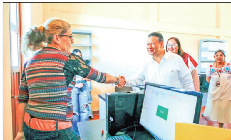
El gobernador Julio Menchaca recordó que su gobierno tiene el firme compromiso de impulsar expresiones artísticas.

"Somos un gobierno cercano al pueblo, trabajando para el bienestar de cada región del estado", es la consigna principal de estos recorridos en donde el titular del Poder Ejecutivo acude a las cabeceras municipales para informar sobre las inversiones destinadas a los rubros más importantes, como salud, educación, desarrollo social e infraestructura pública. .3