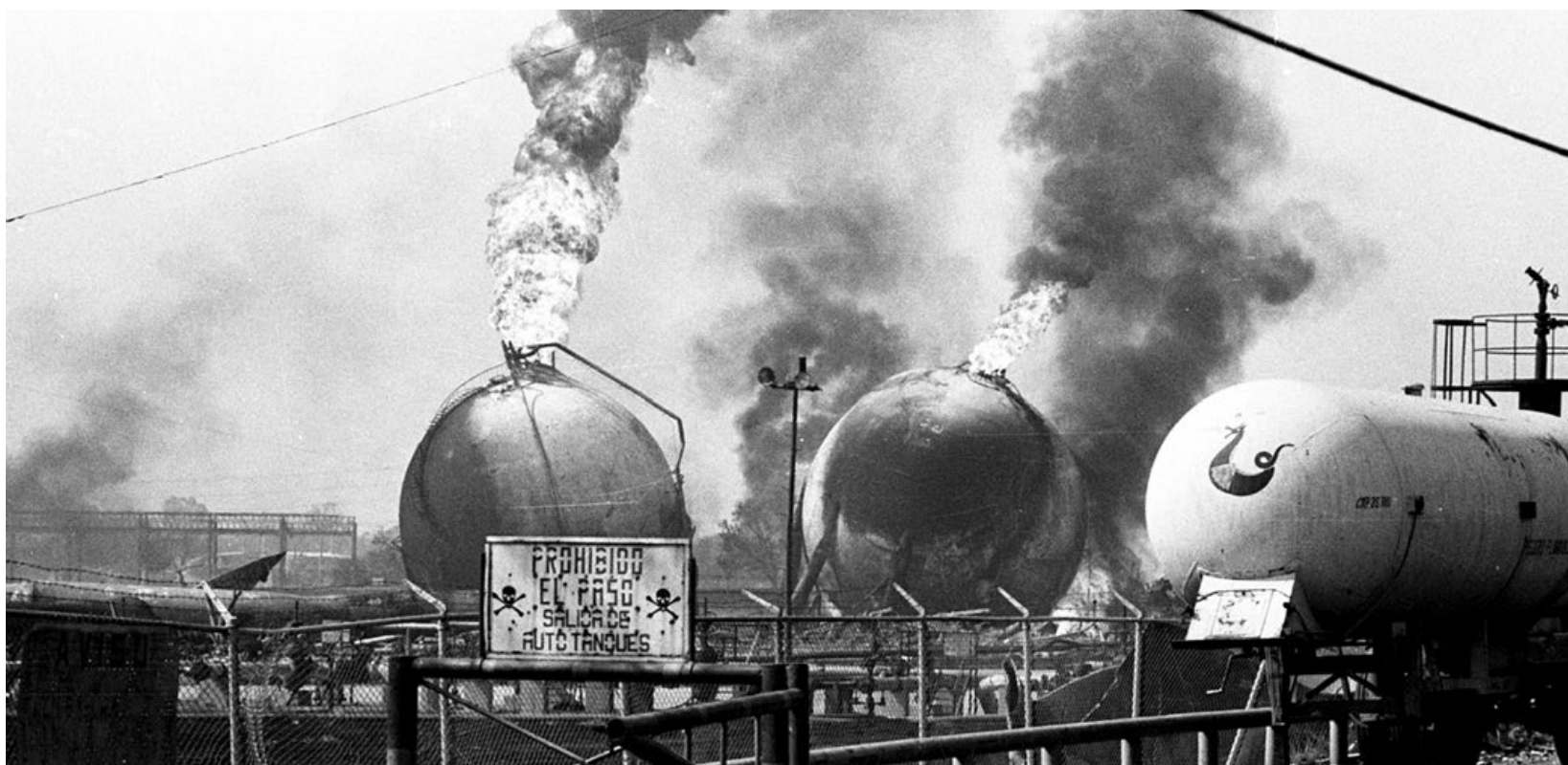
Petróleos Mexicanos, al final de una larga investigación, fue señalado como el origen del desastre de San Juanico.