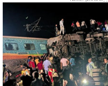
El accidente ocurrió cerca de Bahanaga.

El choque de trenes en India de este viernes ha generado conmoción en la India, a medida de que se van sumando más víctimas. Se han contabilizado más de 200 muertos y 900 heridos, luego de la colisión de un tren de pasajeros con otro de mercancías que provocó, a su vez, que varios va-