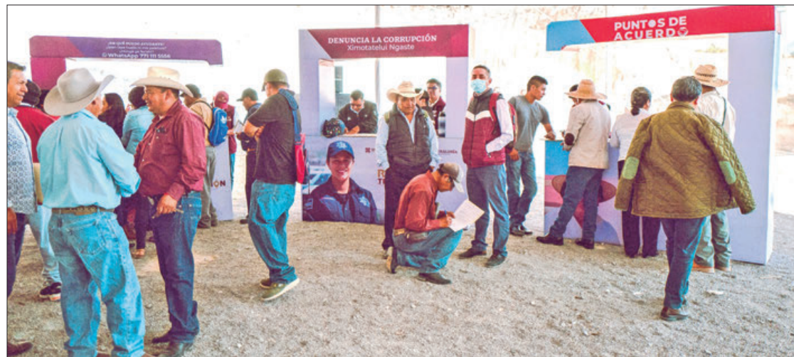
INGRESOS. Por el programa de reemplazamiento vehicular, hasta el momento recaudaron más de 600 millones de pesos, los mismos que usarán para obras en los 84 municipios.

Este año concurrió en Acachitlán, Santiago Tulantepec, Emiliano Zapata, Apan, Tepeapulco, Huehuetla, Tenango de Doria, Atitalaquia, Tlaxcoapan, Eloxochitlán, Xochiatipan, Huazalingo, Tezontepec de Aldama y Francisco I. Madero.