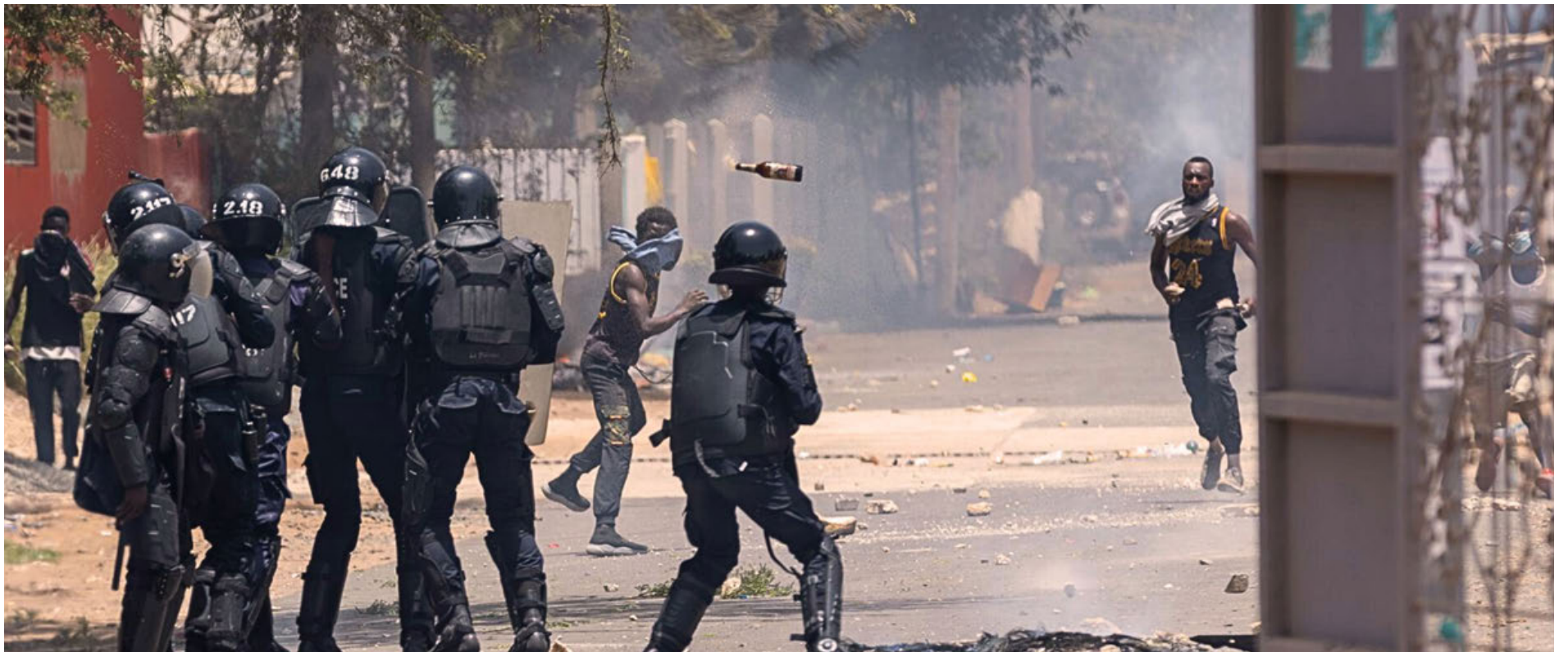
La universidad fue escenario de enfrentamientos entre manifestantes y policías.