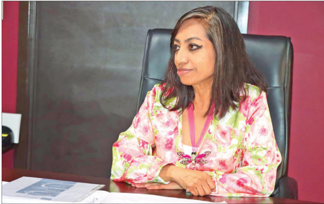
SEMOT. Las concesiones no se venden, rentan o tramitan de manera irregular, se hace un llamado al sector de los transportistas actúe de manera legal, hay añejas prácticas de rentar o vender los permisos del servicio público.

"En esta Administración no se han otorgado nuevas concesiones, cuando se proporcionen será en un procedimiento con bases claras, regulares, legales y transparentes para la población hidalguense".