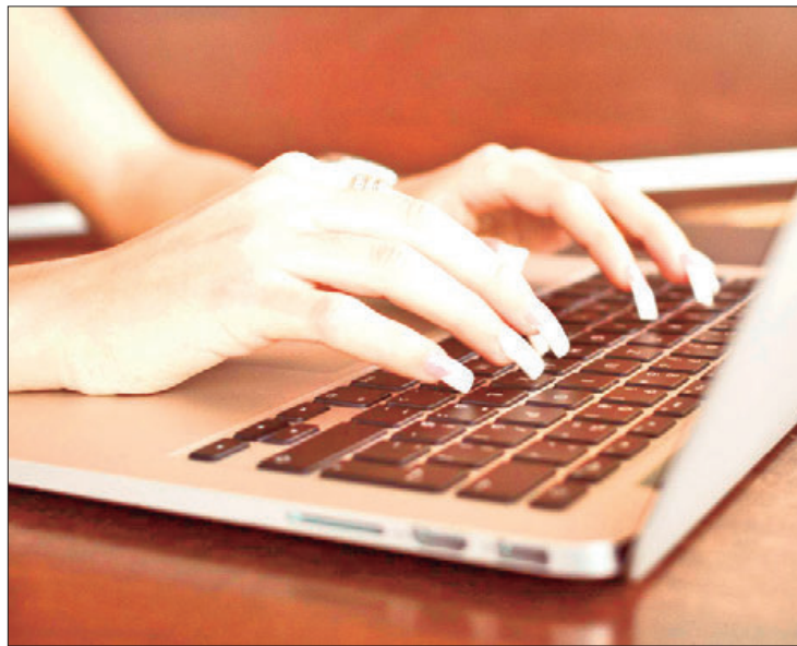
ASPECTOS. Cracker (no es lo mismo hacker), persona con altos conocimientos de informática que se dedica a la edición desautorizada de software propietario.

También, añadió, ha trascendido que entre las principales víc-