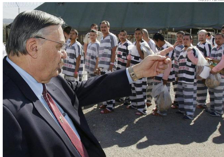
Arpaio junto a presos indocumentados en la infame cárcel que montó con tienda de campaña.

El año pasado, Arpaio solicitó una disculpa pública por parte de Ebrard, por decir el 5 de