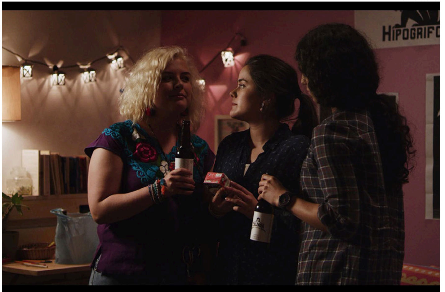
Fotograma del filme.

“Primero fue una escuela de cine, y luego unas chicas de una escuela de comunicación, que fueron los personajes finales, para hacerlo así un poquito más accesible y cercano a la realidad estudiantil de muchas personas que quieren hacer cine. Entonces terminamos justo usando una fórmula en la cual dijéramos ‘imagínense que en Chicas pesadas ( Mean Girls , Waters , 2004) o Ni idea ( Clueless , Heckerling , 1995), de repente entra un asesino y los mata’. Todos