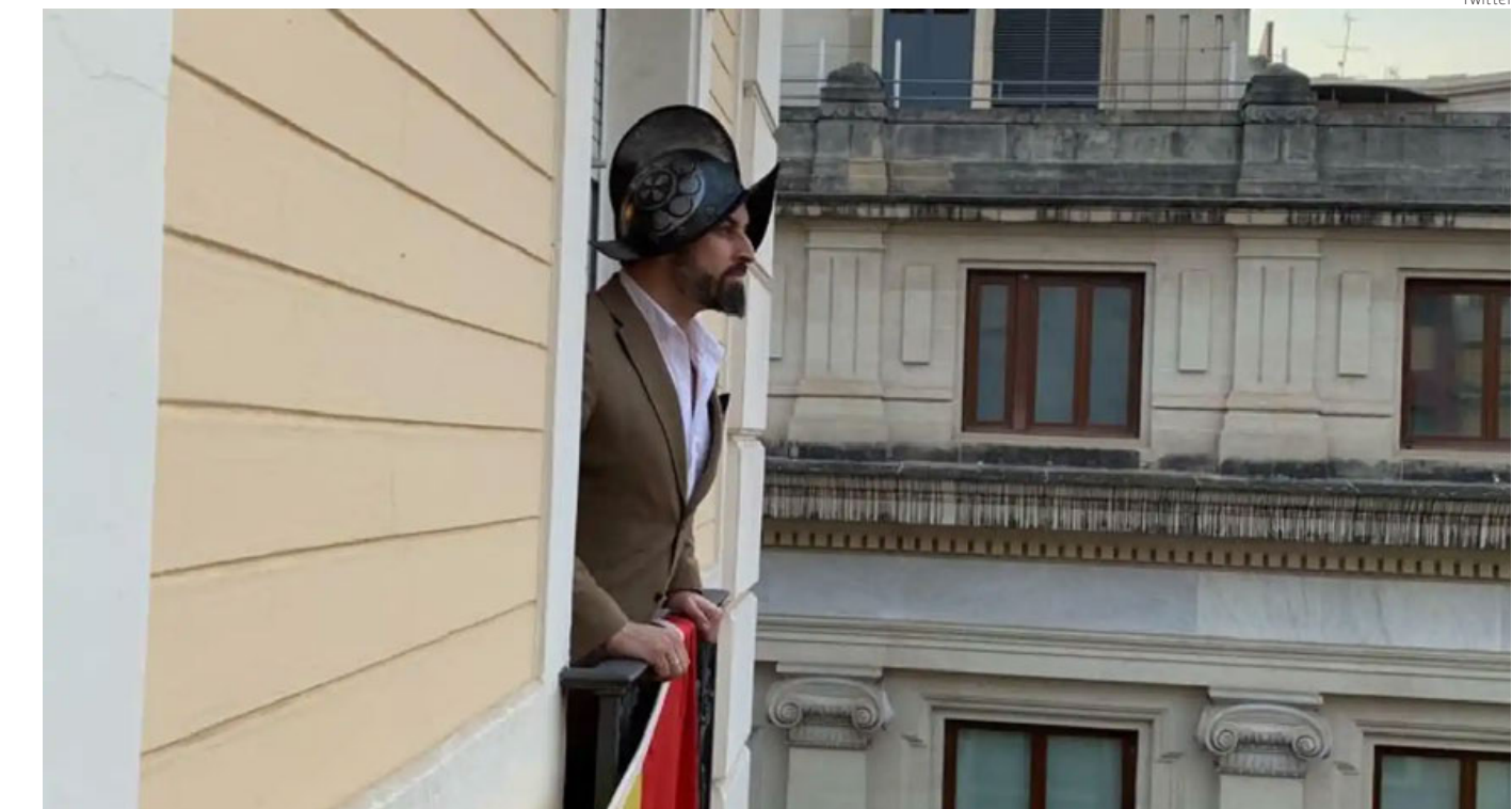
Santiago Abascal, líder de Vox, sueña con reconquistar América Latina ideológicamente.

Esta es precisamente la arriesgada apuesta de Sánchez al adelantar las elecciones con tan poco tiempo de campaña: que los españoles entiendan que la dere-