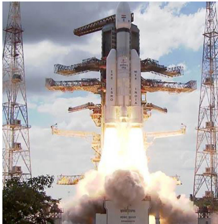
El viaje de la misión Chandrayaan-3 será de 40 días para llegar a la Luna.

El objetivo de la organización india es alcanzar el inexplorado