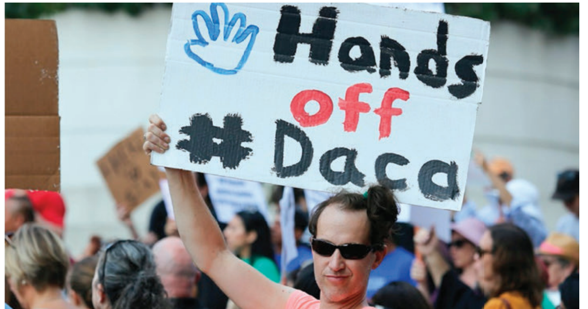
DACA ha permitido que jóvenes vivan y trabajen en Estados Unidos sin temor a la deportación.

El secretario del Departamento de Seguridad Nacional (DHS), Alejandro Mayorkas, también emitió una declaración aclarando que, a pesar del fallo, los beneficiarios de DACA no serán deportados y que se continuarán