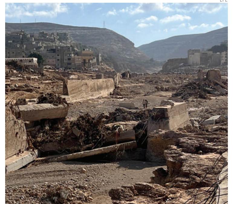
La ciudad portuaria de Derna, al este de Libia.

El año pasado, investigadores de la Universidad local de Omar Al Mukhtar advirtieron en un estudio de que las represas necesitaban un mantenimiento urgente debido al alto potencial de riesgo de inundaciones. Las autoridades no tomaron medidas al respecto ● (EFE en Nueva York)