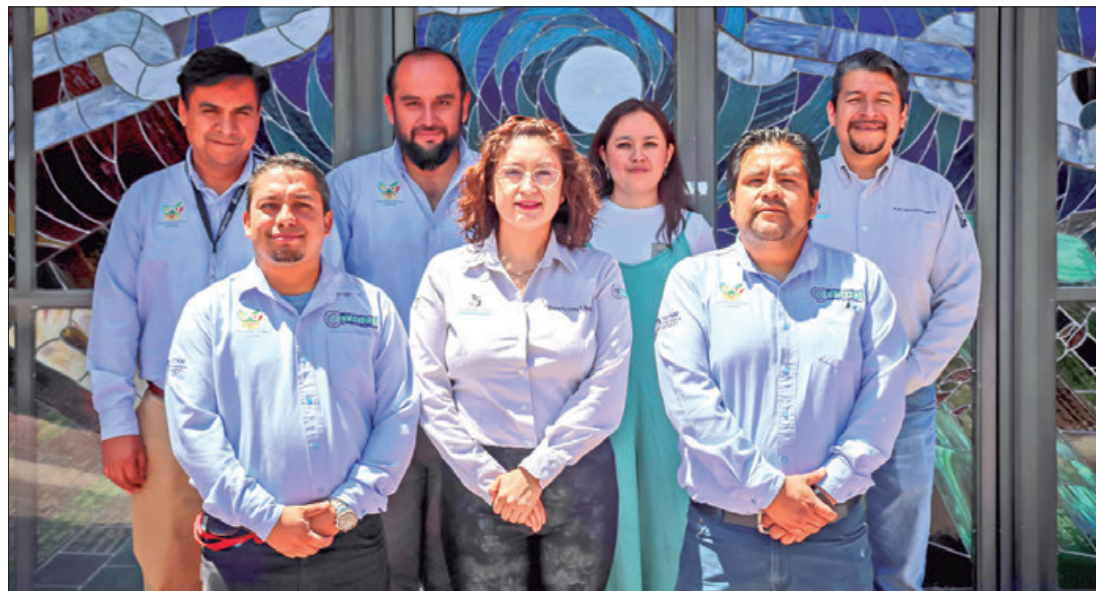
LÍNEAS. Trabajo de investigación cuyo objetivo es documentar y analizar científicamente saberes tradicionales locales aplicables al uso y manejo del territorio, así como la construcción e implementación de "ecotecnias" con materiales naturales y producción agroecológica.

Con esto se cumple la premisa del gobernador Julio Menchaca Salazar y del secretario de Educación Pública de Hidalgo, Natividad Castrejón Valdez, de que con