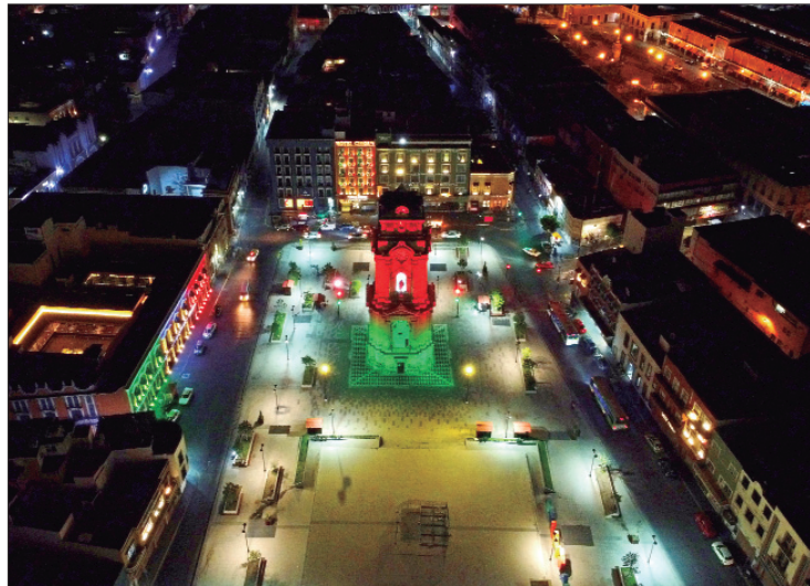
BUENA. Una vez que el Gobierno Federal mostró interés en trabajar en la restauración, con aval del INAH, se espera que la intervención sea en el corto plazo.

Para la conmemoración del 113 aniversario, durante este viernes, de las 9 a las 13 horas, se contempla un programa especial cultural y artístico en el que se le brindará espacio al talento local, habrá cabalgata, actividades charras, así como el tradicional corte de pastel, además que la sociedad podrá disfrutar de la iluminación tricolor que recae sobre el monumento.