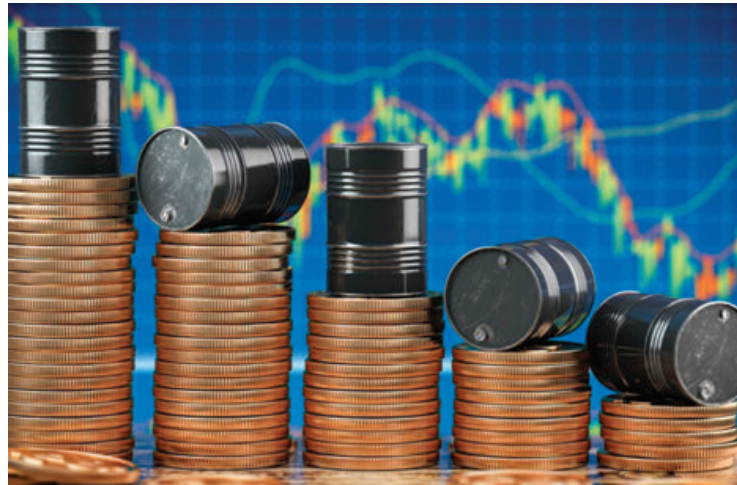
Los ingresos petroleros dejaron de ser palanca de las finanzas.

ción muy agresiva (en 2024)”, alertó en rueda de prensa, al señalar que las autoridades buscan obtener más recursos para dar continuidad a sus programas sociales y sus proyectos insignia, como el Tren Maya o la refinería Tres Bocas.