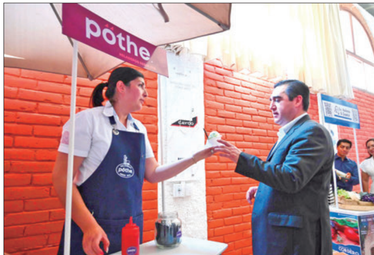
CONCIENCIA. La falta de agua en las diversas zonas del estado es un problema para los productores hidalguenses, por ello se buscan alternativas para atender y resolverlo.

En cada uno de los recorridos desde hace un año en los 84 municipios del estado, permitió conocer las necesidades, demandas y planteamientos de los productores, para determinar las acciones a seguir.