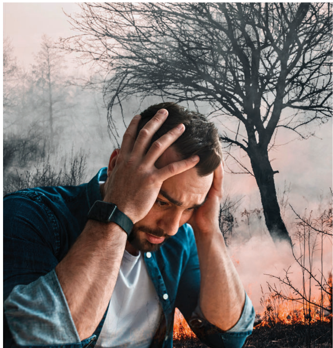
La ecoansiedad, un trastorno actual de nuestra modernidad moldeada por la incertidumbre y los riesgos climáticos.

A menudo se asocia con una profunda culpabilidad personal en relación con la propia huella de carbono, así como la ira o frustración dirigida hacia las generaciones mayores o los funcionarios gubernamen-