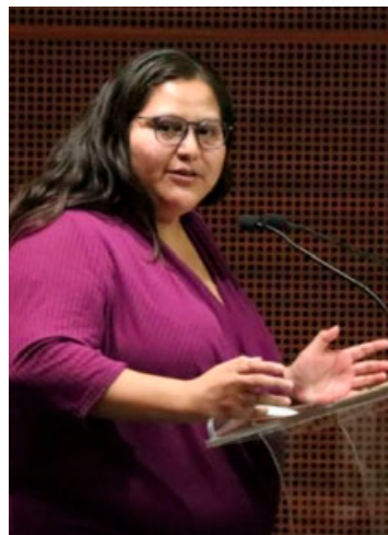
La senadora de Morena Citlalli Hernández.

La Sala Superior del Tribunal Electoral del Poder Judicial de la Federación (TEPJF) revocó, por mayoría de votos, el acuerdo emitido por la Comisión de Quejas y Denuncias del Instituto Nacional Electoral, el cual ordenaba a Ricardo Benjamín Salinas Pliego: a) el retiro de diversas publicaciones y comentarios en la red social X (antes Twitter); y b) abstenerse de realizar ma-