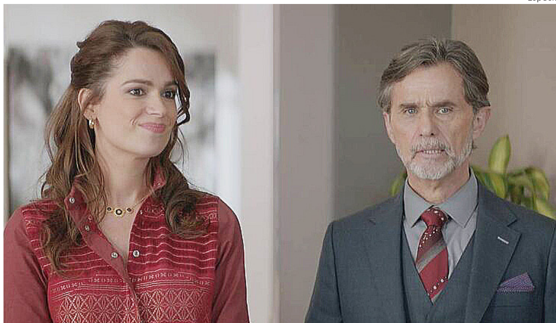
Fotograma del filme.

La película evita caer en los estereotipos familiares habituales y se adentra en la complejidad de las relaciones fraternas, enseñándonos que la reconexión no es un camino sencillo y que requiere esfuerzo y comprensión mutua. Esto se refleja de manera efectiva en los momentos emotivos y las