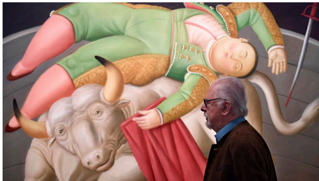
Fernando Botero falleció el pasado viernes a los 91 años de edad.

La grandiosidad de la obra de Botero, caracterizada por las suaves formas de sus figuras vo- luminosas que le dieron fama mundial y que no le gustaba lla-