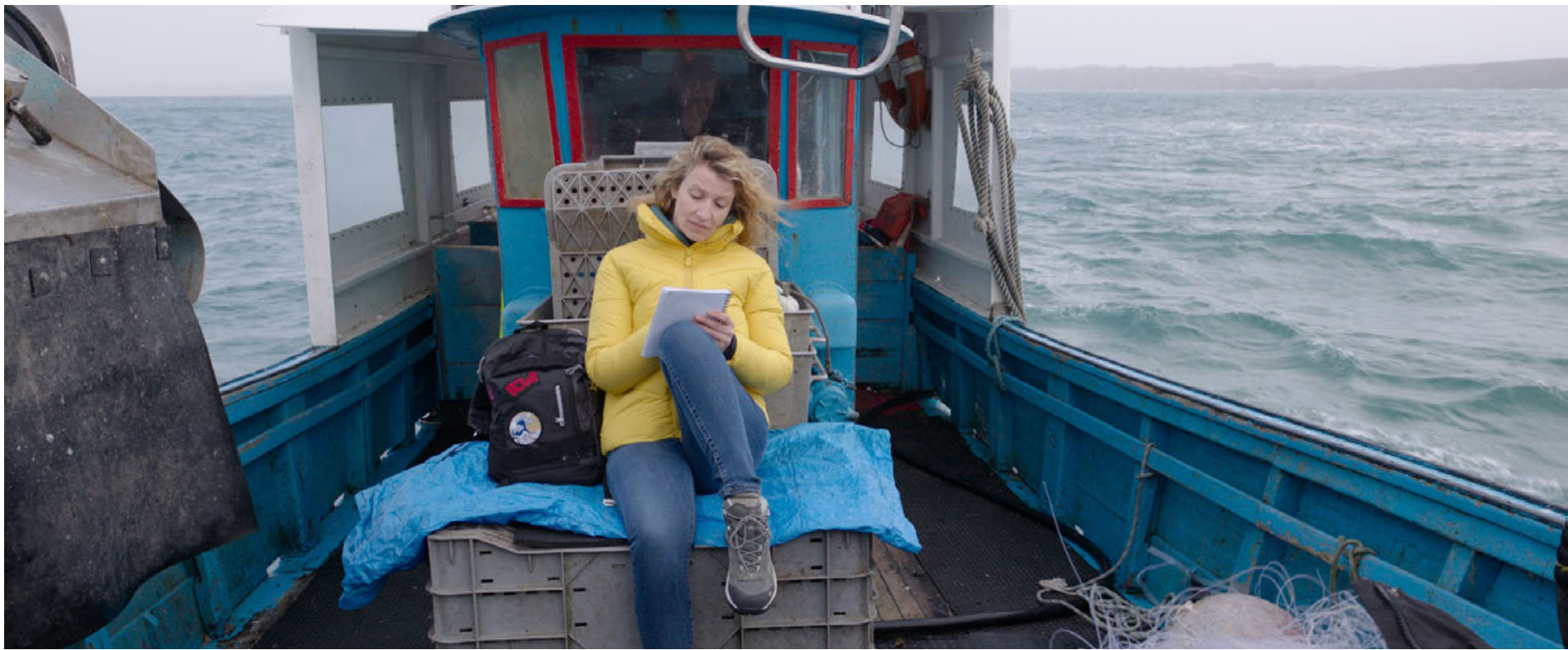
Fotograma del filme.

El filme de la cineasta francesa Lisa Azuelos está basado en la novela homónima de la escritora Julien Sandrel