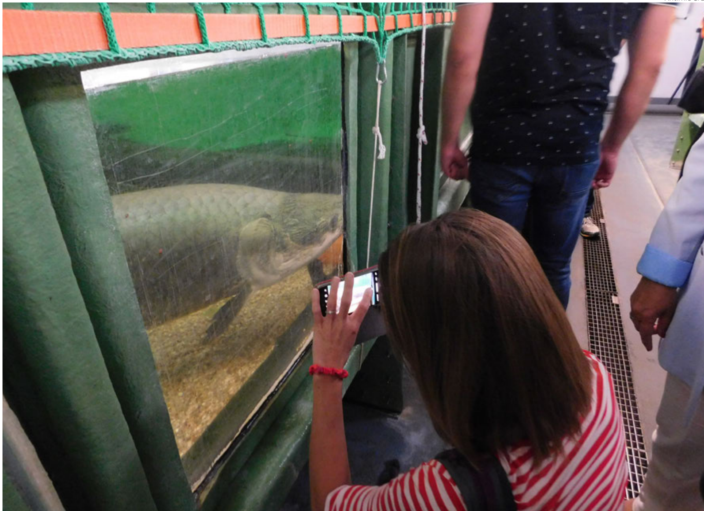
Aunque el sistema inició con crianza de tilapia, ahora experimenta con especies de agua dulce que pesan hasta 200 kilogramos.

berlinés de lo que era la Alemania socialista y después manejar entre bosques una media hora.