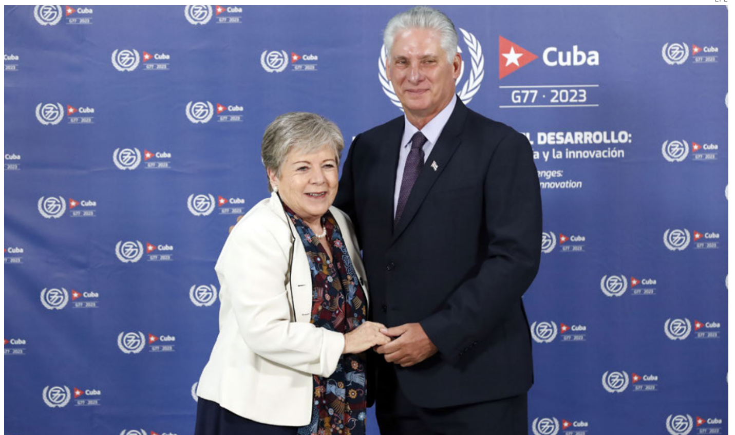
La canciller mexicana Alicia Bárcena y el presidente de Cuba Miguel Díaz-Canel en la cumbre.

“POLÍTICAS MIGRATORIAS EFECTIVAS” Panamá pidió al G77+China una mayor