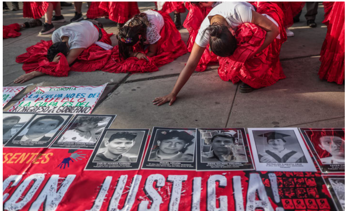
Organizaciones sociales y sindicales marcharon este sábado contra el gobierno de Boluarte.

Dina Boluarte ya había comparecido ante la Fiscalía en dos ocasiones en relación con esta investigación. La primera vez, el 7 de marzo, no pudo declarar debido a una resolu-